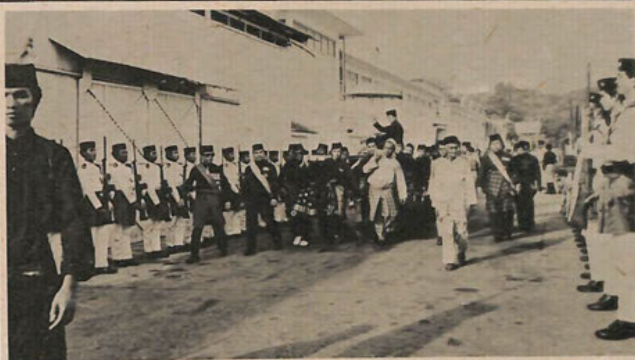
Gambar menunjukkan upacara istiadat permakaman Y.T.M. Seri Paduka Pengiran Temanggung.

Sa-masa menerima derma tersebut Yang Berhormat itu telah mengucapkan terima kasih dan memberikan penghargaan yang sa-tinggi2-nya di-atas usaha dan inisiatif Ahli2 Kelab tersebut mengadakan perlumbaan itu dan telah menyelitkan sumbangan yang berkebakikan bagi tujuan ini.