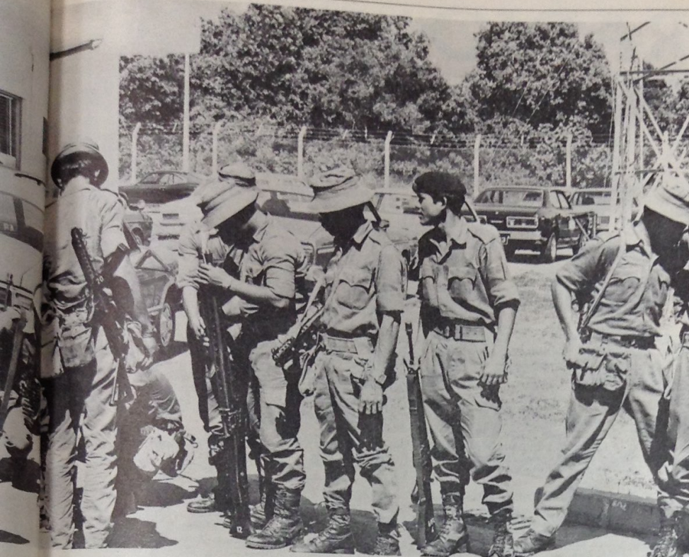
Above: Men of the First Flotilla, Royal Brunei Malay Regiment, prepare to embark on exercise Flex, in which the vessels men and patrol boats, like the one left, "defended" the Muara marine base against an attack by insurgents.