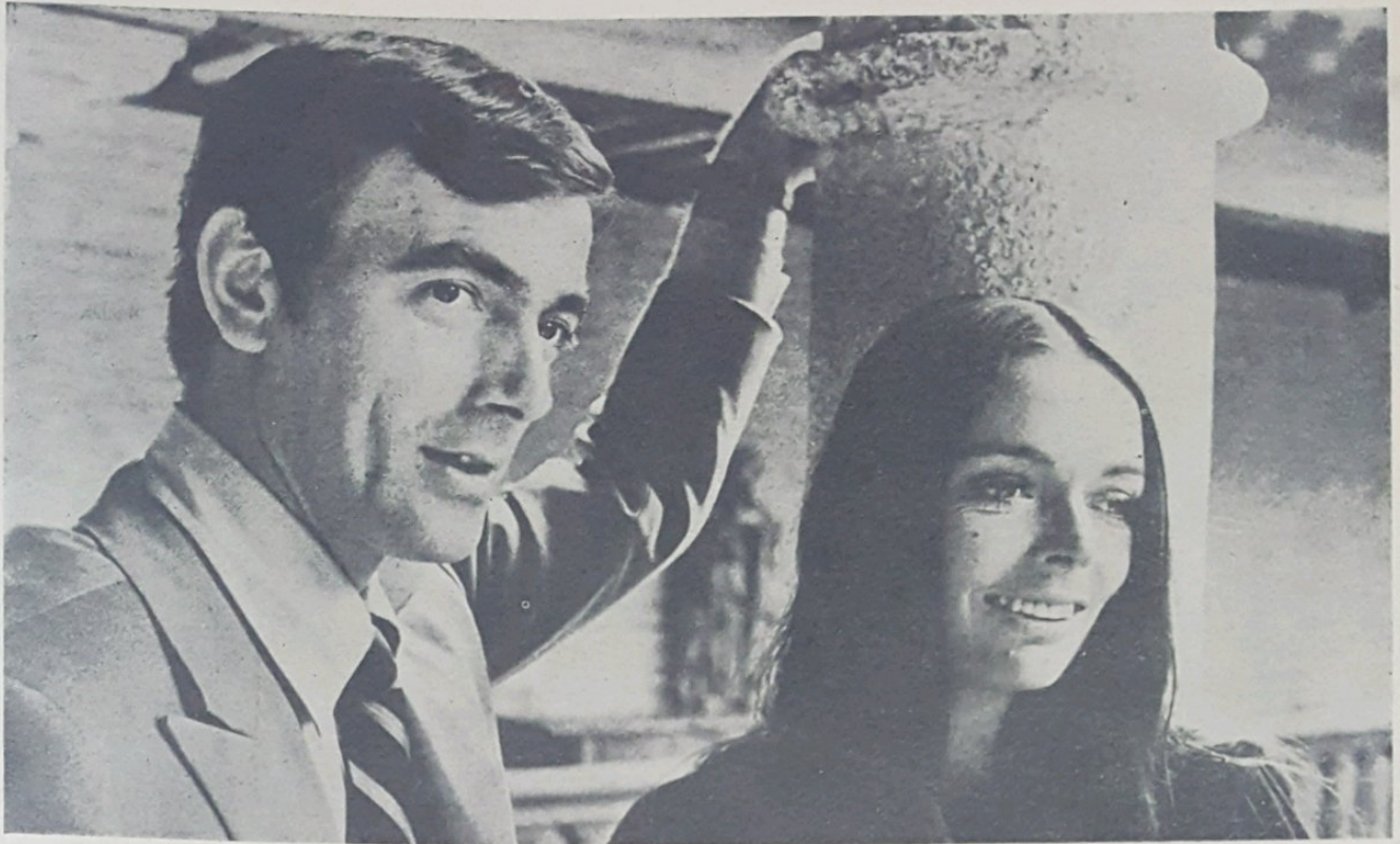
"Honeymoon with a Stranger" is this week's Saturday movie whose main stars are Janet Leigh and Rossano Brazzi.

MARCH Beats The House") Fence") Honeymoon With MARCH Instant War") (Shell film on the the World) Rebels"). MARCH Plan") he Captive River") PES ("No. 7: The MARCH HAMMAD (S.A.W.) enal v Luton") S ("Disappearing My Love"). MARCH Iron Hand") Fools Gold"). MARCH IE KORAN. (BA- phase") ATTENBOROUGH ederal of Trees") PES ("No. 8: The MARCH Ve Are Waiting — YERS ("No. 8: Hinge VIE ("Banacek —