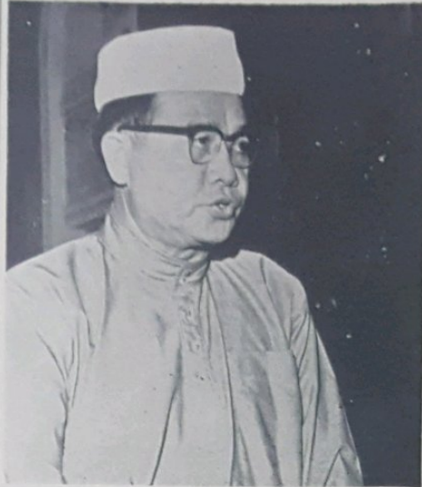
Y.D.M. Pehin Datu Inderasugara Awang Haji Johari bin Abdul Razak berucap merasmikan Majlis Berzikir di-Mesjid Omar Ali Saifuddin pada malam Jumaat lalu.

Bahagian penerangan pula, satu penyusunan kerja telah di-lakukan dan masa ini usaha2 di-pergiatkan untuk menyumbangkan penerangan2 berhubung dengan kegiatan2 Kerajaan termasuk bidang2 kawalan keselamatan baik melalui kunjungan ka-kampong2, mahupun melalui penerbitan2. Pelita Brunei tidak saja memperbesar bidang-nya, tetapi juga telah menambah halaman2 muka-nya dengan mengadakan bahagian Bahasa Ingeris bagi memudahkan penduduk2 yang belum dapat menguasai Bahasa Melayu tetapi berpengetahuan dalam Bahasa Ingeris untuk mengetahui apa usaha yang di-buat oleh Kerajaan sa-jauh ini. Bilangan akhbar ini juga telah di-tambah dari 3,500 kepada 15,000 naskhah pada tiap2 keluaran. Sa-lain dari itu Pelita Brunei juga mempunyai naskhah Bahasa China. Bahagian penerbitan penerangan juga sedang berusaha untuk menerbitkan siaran2 penerangan dalam bentuk majalah bergambar. Usaha dalam bahagian ini akan dapat di-pesatkan lagi sa-baik2 saja tenaga kerja-nya bertambah. Perkhidmatan Radio pula tidak kurang dengan peranan-nya yang pada masa ini sedang mengalami penyusunan yang teliti pada melaksanakan tugas-nya. Ia-nya juga akan menempoh beberapa perubahan untuk memesatkan lagi perkhidmatan-nya.