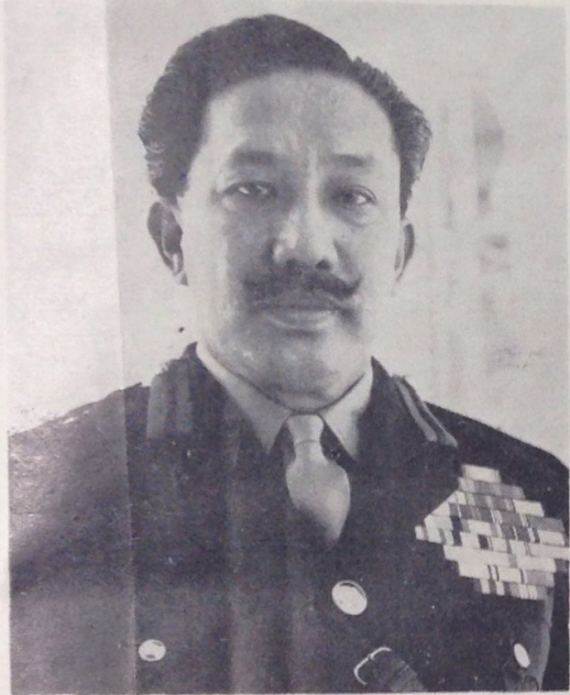
Duli Yang Teramat Mulia Paduka Seri Begawan Sultan.