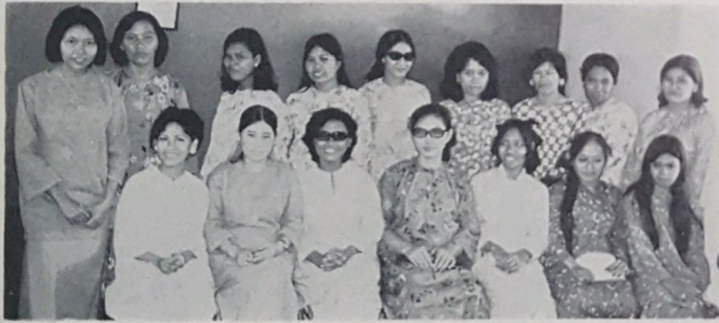
Sa-bahagian dari penuntut2 yang akan memulakan pelajaran mereka 15 Februari ini.

Kaum wanita yang ingin menyertai kelas tersebut bolehlah datang ka-Bangunan Ibunda Jaya, Kampong Sultan Lama, Bandar Seri Begawan.