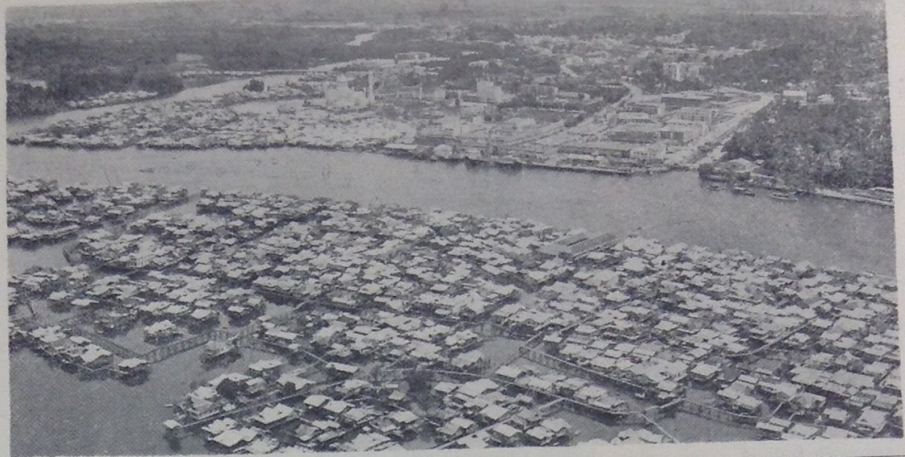
Pemandangan Bandar Brunei di-ambil dari udara. Kelihatan di-sebelah bawah ia-lah sa-bahagian dari Kampong Ayer.

Kata-nya, karangan2 lama itu hanya akan di-pinjam untok mengisikan pameran tersebut, tetapi jika pemilik2 karangan2 lama itu berkehendakan syarat2 yang tertentu, maka jawatankuasa pameran bersedia untok berunding.