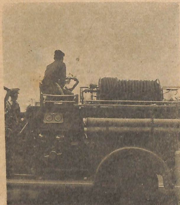
Pertunjukkan kuasa deras panchutan ayer dari salah sa-buah kenderaan bomba.

Pasokan Pencharagam Pulis Di-Raja Brunei turut juga menyertikan lagi upacara tamat latehan itu.