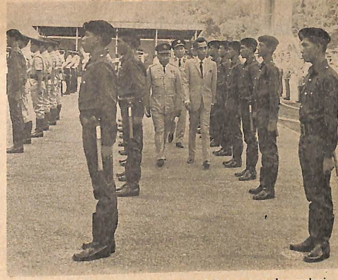
Yang Amat Berhormat Pemangku Menteri Besar memereksa perbarisan yang terdiri dari ahli2 bomba yang baru itu.