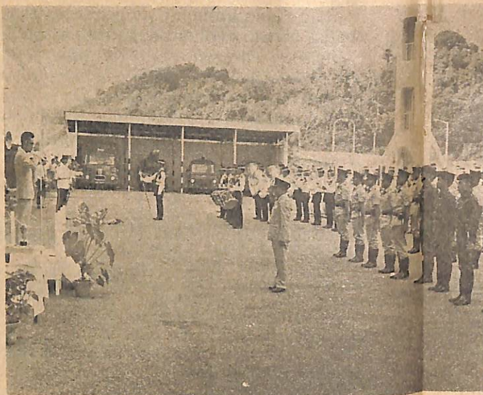
Yang Amat Berhormat, Pemangku Menteri Besar sedang membalas tabek kehormatan di-upachara perbarisan tamat latehan itu.