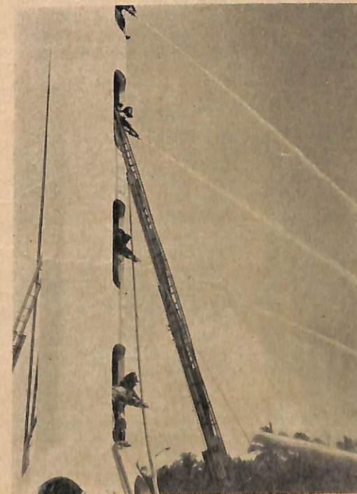
Pertunjukkan bagi empat chara menchegeh kebakaran dari bangunan yang rendah hingga ka-bangunan2 yang tinggi.