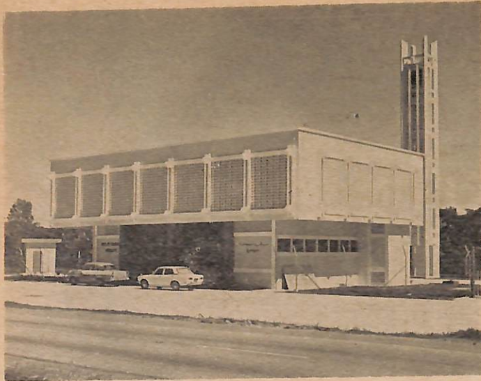
Gambar atas menunjukkan balai bomba di-Pekan Tutong dan gambar bawah pula ia-lah balai bomba Muara.

Pembinaan kedua2 buah bangunan tersebut di-jadualkan siap dan di-gunakkan dalam bulan hadapan.