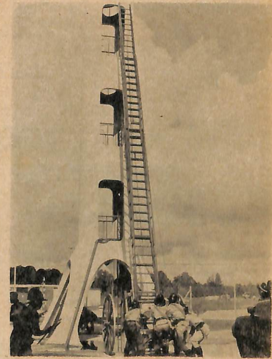
Menggunakan tangga otomatis ada-lah di-perlukan bagi menchegeh kebakaran yang berlaku ka-atas bangunan yang tinggi.