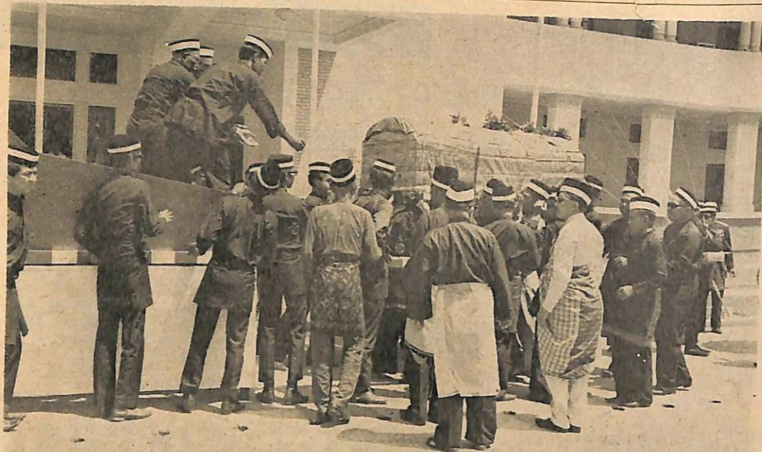
Jenazah Al-Marhum ketika di-naikkan ka-atas usongan sedang di-perhatikan oleh Duli Yang Teramat Mulia Paduka Seri Begawan Sultan.

Atas kemangkatan itu, di- iringi dengan doa semoga Al- lah menempatkan roh-nya di- tempat orang2 yang beriman kapada-Nya Amin.