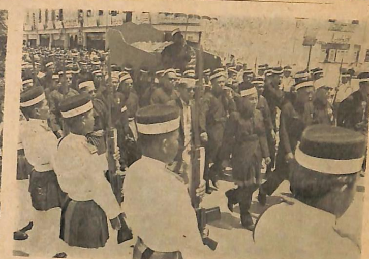
Beribu2 orang kelihatan penoh sesak mengiringi perarakan jenazah Al-Marhum Duli Pengiran Di-Gadong Sahibol Mal ketika hendak masuk ka-pintu besar tambatan Kastam Di-Raja Brunei untuk menaiki gegandung yang akan membawa jenazah Al-Marhum itu ka- Makam Di-Raja. Di-kiri dan kanan kelihatan barisan pasokan Pu- lis Di-Raja sambil memberikan Hormat Di-Raja yang terakhir.