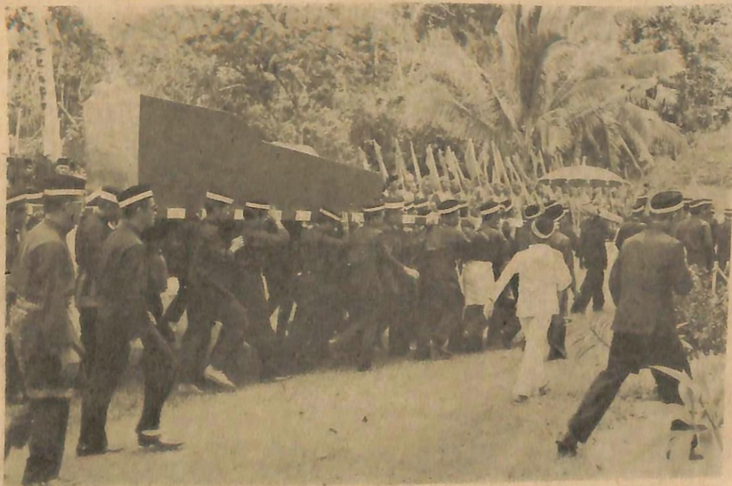
Jenazah Al-Marhum di-usong dengan penoh hati2 menuju ka-tempat permakaman-nya. Dalam gambar ini kelihatan juga sinipit alat kebesaran Di-Raja sedang di-pegang oleh pegawai2 yang mengiringkan jenazah Al-Marhum itu.