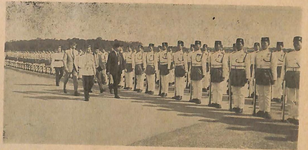
▲ D.Y.M.M. sedang memereksa barisan kehormatan yang terdiri dari pasukan Polis Di-Raja Brunei sa-belum Baginda dan rombongan berangkat ka-Johor.

Pada sa-belah malam-nya, Baginda dan rombongan telah menghadiri jamuan Kerajaan yang telah di-langsungkan di-Istana Besar bagi meraikan lawatan Baginda itu.