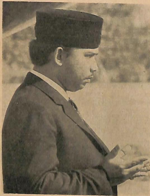
▲ D.Y.M.M. Paduka Seri Baginda Sultan dan Yang Di-Pertuan Negeri Brunei kelihatan menadah tangan ketika do'a selamat di-bachakan sa-jurus sa-belum Baginda dan rombongan berangkat ka-Johor.

Pada umum-nya lawatan Di-Raja itu telah dapat menimbulkan kesan2 yang baik dan telah dapat menanamkan perasaan muhibbah yang semakin mendalam yang faedah2-nya amat besar bagi masa hadapan.