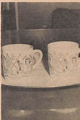
Bentuk chenderamata yang akan di-hadaikan itu.

Chawan itu berukuran 3 \frac{3}{4} inchi tinggi dan 3 inchi buka, di-sebelah tepi-nya mengandungi gambar wajah Duli Yang Maha Mulia Paduka Seri Baginda Sultan dan Yang Di-Pertuan dan Duli Yang Maha Mulia Paduka Seri Baginda Raja Isteri.