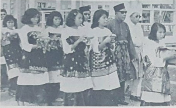
Dayang2 yang membawa gamsa2 yang berhiel dengan surat Mahar atau Berian dan gam2an.