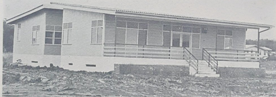
Gambar atas ia-lah bangunan masjid dan bawah bangunan klinik di-ranchangan perpindahan, Berakas. Bangunan2 ini baru saja siap di-bena dan akan di-gunakan tidak beberapa lama lagi.