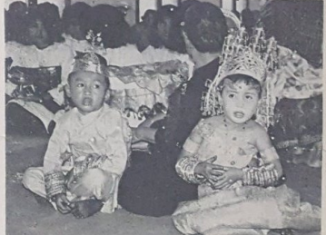
Di-kanan ia-lah kanak2 perempuan yang berpakaian lak2 dan di-kiri ia-lah kanak2 lak2 "Pemutus Tali Jintong".

mat Mulia Seri Paduka Duli Pengiran Muda Mahkota Hassanal Bolkiah. Kanak2 perempuan itu, kemudiannya di-persembahkan kepada Duli2 Yang Maha Mulia Paduka Seri Baginda Maulana Al-Sultan dan Raja Isteri untuk menjunjung anugerah pengabdian Baginda suami isteri.