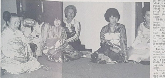
Y. T. M. Duli Pengiran Isteri Anak Saleha (No. 2 dari kiri) dan Y. T. M. Pengiran Anak Puteri Mansa dalam Istiadat Menghantar Tanda Di-Raja. Duli Pengiran Isteri Anak Saleha telah mengepal isteri2 pembesar negara dalam Istiadat itu.

Istiadat yang berlangsung di-tumang Yang Teramat Mulia Seri Paduka Duli Pengiran Pemancha adalah menurut Adat Istiadat Di-Raja turun temurun di-dahului dengan tembakan meriam sa-banyak tujuh das.