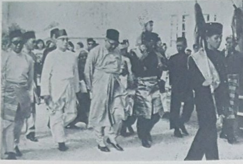
Rombongan Menghantar Pertunangan Di-Raja. Yang di-utong oleh Pengarah Haji Mokti ini ia-lah kanak2 perempuan yang berpakaian lak2.

Kerjasama dari semua golongan bagi pelaksanaan semua rancangan haruslah di-lakukan terus menerus.