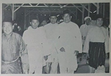
No. 4 dari kiri ia-lah Y.A.M. Pengiran Kerma Indera yang mengepal rombongan "Menghantar Tanda Di-Raja"