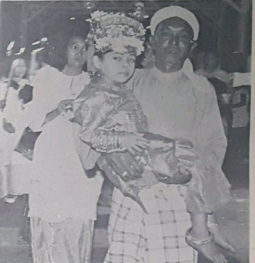
Yang di-tukung oleh Pengarah Haji Mokti ini ia-lah "Tanda Perkahwinan Di-Raja" ia-itu sa-orang kanak2 perempuan yang lengkap dengan palikan Adat Istiadat. Kanak2 ini memakai gelang pengahan, geroncong, subang dan berbagai serondoh di-kepala-nya.