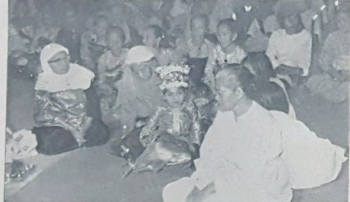
Kanak2 yang berpakaian lengkap ini di-siapkan kepada isteri2 Pembesar Negara, sa-belum di-sampaikan kepada D.Y.M.M. Maulana Al-Sultan dan D.Y.M.M. Raja Isteri.