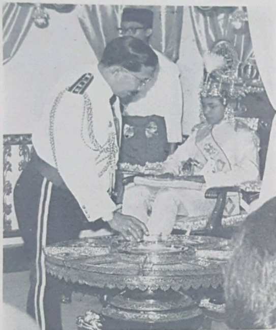
D.Y.M.M. Paduka Seri Baginda Maulana Al-Sultan sedang menepong tawar ka-atas Yang Teramat Mulia Pengiran Muda Jefri Bolkihah, salah sa-orang putera baginda yang telah selamat berkhatan.

BANDAR BRUNEI —Yang Teramat Mulia Pengiran Muda Sufri Bolkihah dan Yang Teramat Mulia Pengiran Muda Jefri Bolkihah telah di-arak dalam satu perarakan menurut tradisi adat isti'adat di-raja mengelilingi ibu kota pada hari khamis berikutan dengan berlangsungnya upacara berkhata ka-atas dua orang putera di-raja itu.