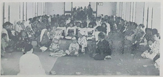
Suasana ketika di-adakan Istiadat Menerima Pertunangan Di-Raja di-Istana Darul Hana.