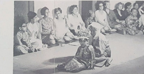
Perkakas yang di-pakai oleh kanak2 perempuan ini ia-lah Gelang Pengahan, geroncong, subang dan bunga Serondoh. Kanak2 ini telah menjadi utusan perhatian para tetamu kerana ia-nya di-selubungi dengan palikan Adat Istiadat Di-Raja turun temurun.