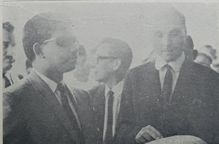
Duli Yang Maha Mulia Paduka Seri Sultan Hassanal Bolkiah Mu'izzuddin Waddaulah ketika merasmikan pembukaan Sharikat Kewangan Malaysia Borneo di-Bandar Brunei

Sharikat itu menerima wang sa-bagai simpanan di-bawah rancangan simpanan wang untuk menolong penyimpanan2 wang menyimpan dengan mendapat faedah dan memberi pinjaman dan pendahuluan untuk berbagai tujuan bagi menolong penerima2 pinjaman dengan pembiayaan sa-chara praktikal dan ekonomikal.