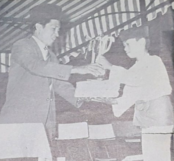
Wakil kumpulan Nashid Sekolah Rendah sedang menerima hadiah kemenangan-nya dari Y.B. Pg. Damit bin Pengiran Sunggoh.