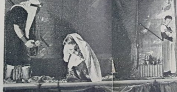
In-lah penentuan Tablo dari Perastian Majlis Belia Daerah Brunei dan Muara yang berjaya menjadi Johan. Pasukan ini juga memenangi dekorasi yang terbaik dan pelakon pembantu yang terbaik.

Dalam kelainan ini di-siarkan sepuluh keping gambar yang di-dalam sambutan2 kerana mengingati Nuzul Al-Kor'an yang di-dianggunkan di-Padang Besar dan di-Dewan Madrasah dalam minggu lepas.