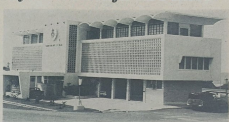
Bangunan Ibu Pejabat Askar Melayu Di-Raja Brunei.