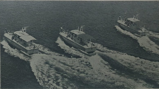
Tiga buah kapal ronda Askar Melayu Di-Raja Brunei ketika dalam latihan pelayaran.