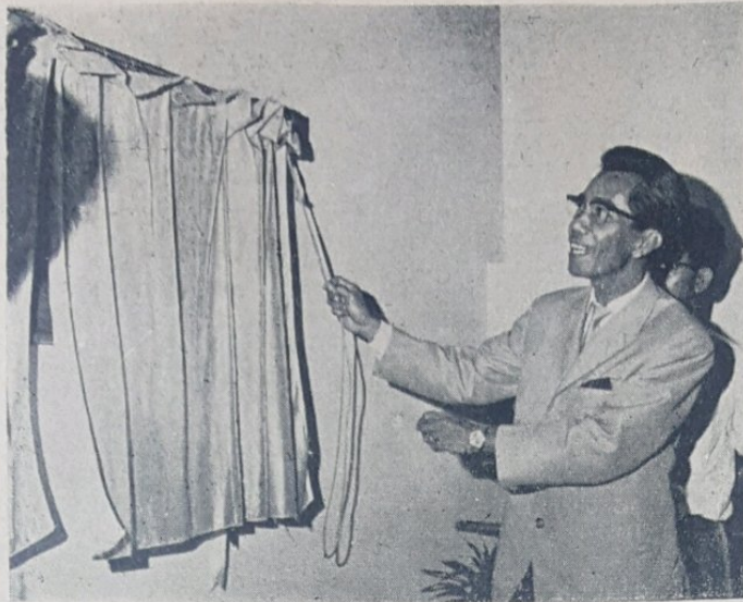
Yang Berhormat, Pengiran Dato Seri Paduka Haji Md. Yusuf kelihatan dalam gambar atas sedang melaksanakan pembukaan rasmi Rumah Tumpangan Kerajaan, Kuala Belait.

Hotel yang mempunyai 40 buah bilek itu akan menolong mengatasi kekurangan tempat tinggal bagi pelawat2 ka-bandar tersebut.