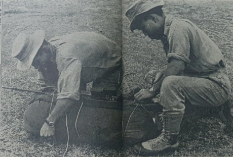
Dua orang perajurit sedang menjalani latihan kehemahan sa-masa dalam perkhemahan di-hutan.