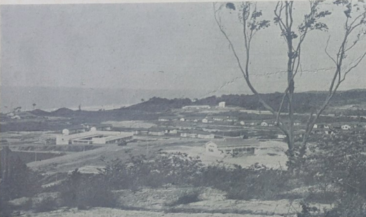
Gambar pemandangan sa-bahagian dari bangunan dan perumahan Askar Melayu Di-Raja Brunei di-Berakas.