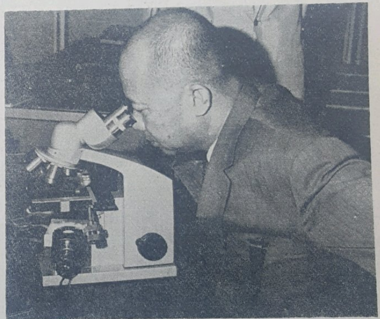
Yang Amat Berhormat, Dato Seri Paduka Marsal bin Maun sedang melihat bahan2 makanan untuk ikan2 kechil dengan menggunakan teropong.

Juruchakap itu berkata, Sharikat Shell berharap bahawa dengan berjaya-nya pusat pertanian itu akan dapat membuktikan bahawa pertanian ada-lah satu2-nya perusahaan untuk memperjeniskan ekonomi negeri ini.