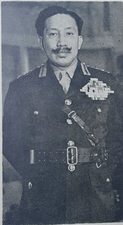
Duli Yang Maha Mulia Paduka Seri Baginda Maulana Al-Sultan, Sir Omar Ali Saifuddin.

BANDAR BRUNEI. — Duli Yang Maha Mulia Paduka Seri Baginda Maulana Al-Sultan, Sir Omar Ali Saifuddin, yang pada masa ini sedang melawat keseluruh dunia, telah menyampaikan Titah Uchapan Baginda bagi menyambut genap usia sepuluh tahun Radio Brunei.