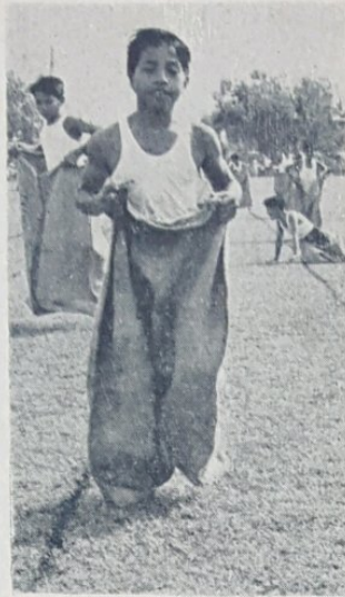
Kanak2 dalam gambar ini kelihatan sedang mengambil bahagian dalam lumba lari dalam guni di-temasha Sokan Sekolah2 Rendah Melayu Bahagian Tutong I di-Padang Sekolah Melayu Muda Hashim, Pekan Tutong baru2 ini.