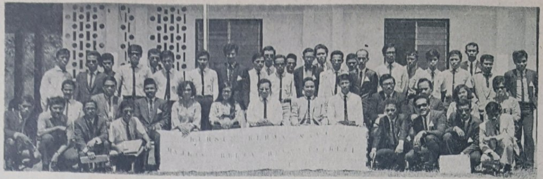
Satu Kursus Kerjasama Pemimpin2 Belia Sa-Negeri Brunei telah di-langsungkan di-Sekolah Menengah Arab Hassanah Bolkiah, Batu Satu, Jalan Tutong sa-lama tiga hari mulai pada 28 April, 1967.

Kursus tersebut telah di-adakan di-bawah anjoran Majlis Belia2 Negeri Brunei dengan memperoleh kejayaan.