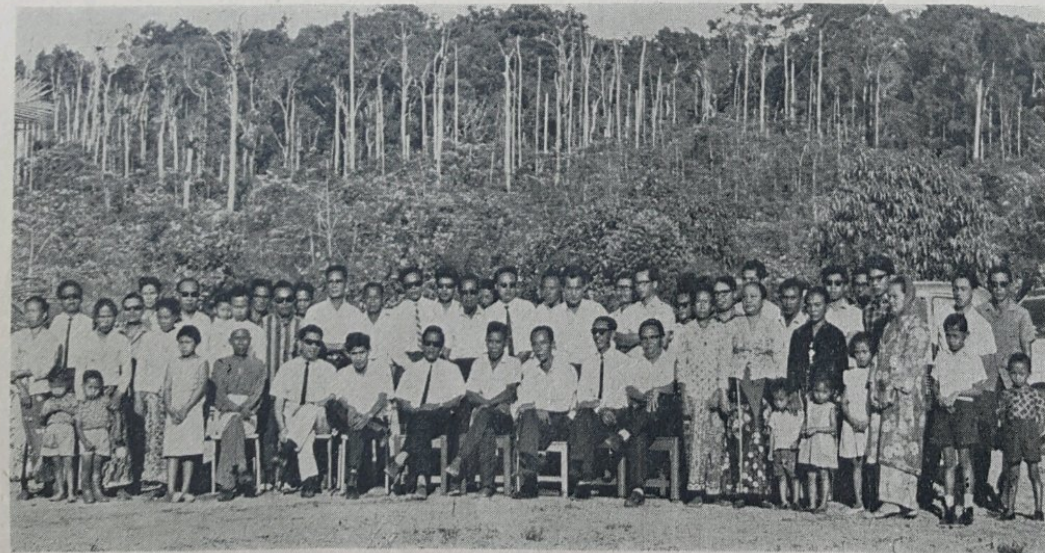
Gambar ini di-ambil sa-lepas di-langsungkan upacara pembukaan rasmi Kursus Pertanian ahli2 Persatuan Peladang Kampong Lailas, Daerah Belait pada 17 April 1967.

ucapan sa-belum beliau merasmikan pembukaan Kursus Pertanian ahli2 Persatuan Peladang Kampong Lailas Daerah Belait, pada 17 April, 1967.