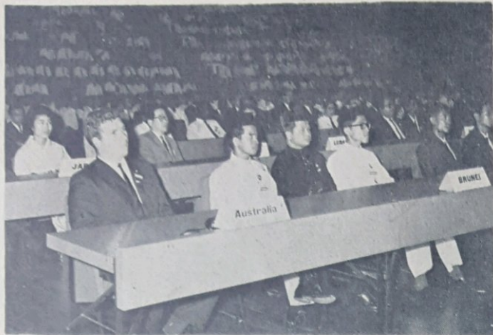
Perwakilan dari Majlis Belia2 Negeri Brunei kelihatan dalam gambar ini sa-masa mereka menghadiri Seminar Perhimpunan Belia Sa-Dunia (WAY) di-Singapura baru2 ini. Bilangan ke-dua dari

Mudah2an dengan memperolehi latehan2 yang bersungguh2, adalah di-harapkan sa-moga Pasokan Hoki Wanita Negeri Brunei akan dapat mempertahankan gelaran kejohanan dalam perlawanan tersebut pada tahun hadapan dan sa-terusnya berjaya dalam perlawanan itu tahun2 yang akan datang kelak.