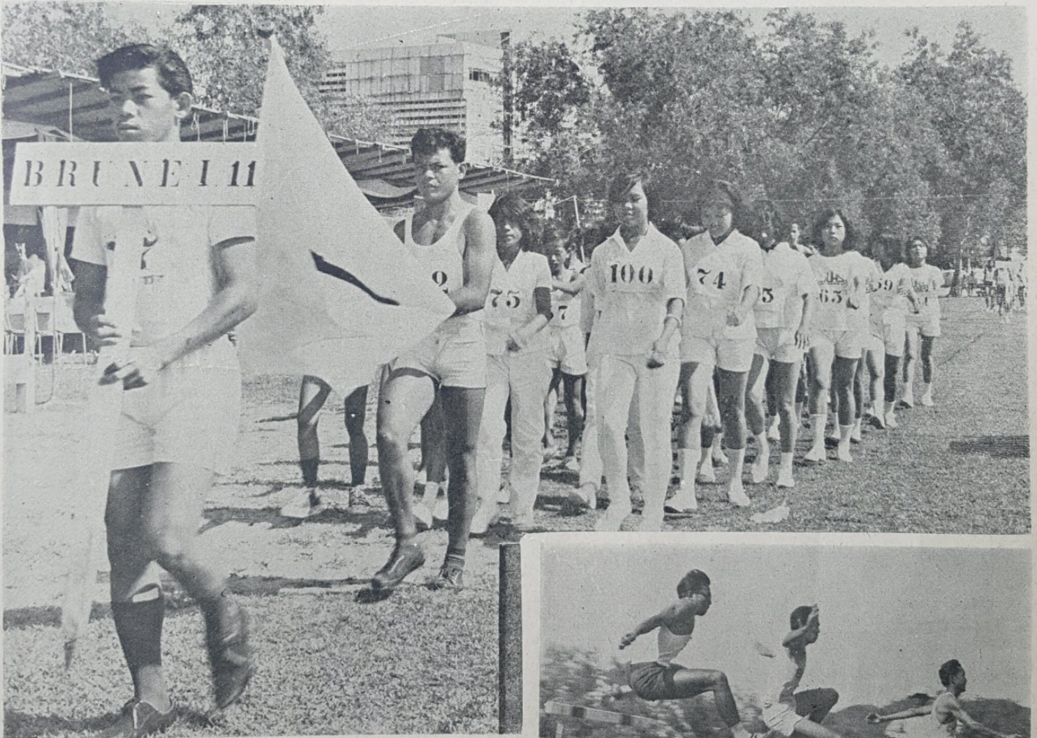
Pasokan Brunei Dua kelihatan dalam gambar ini pada masa di-langsungkan upacara Pembukaan Rasmi Sokan Tahunan Sekolah2 Rendah Melayu Seluruh Negeri Brunei di-Padang Besar, Bandar Brunei pada 21 April, 1967.

Satu pemandangan Lumba Lari lompat pagar Bahagian lelaki di-temasha Sokan Tahunan anjoran Persatuan Sokan Amateur Daerah