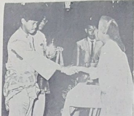
Yang Teramat Mulia Seri Paduka Duli Pengiran Temenggong sedang menyampaikan hadiah kepada pemenang.