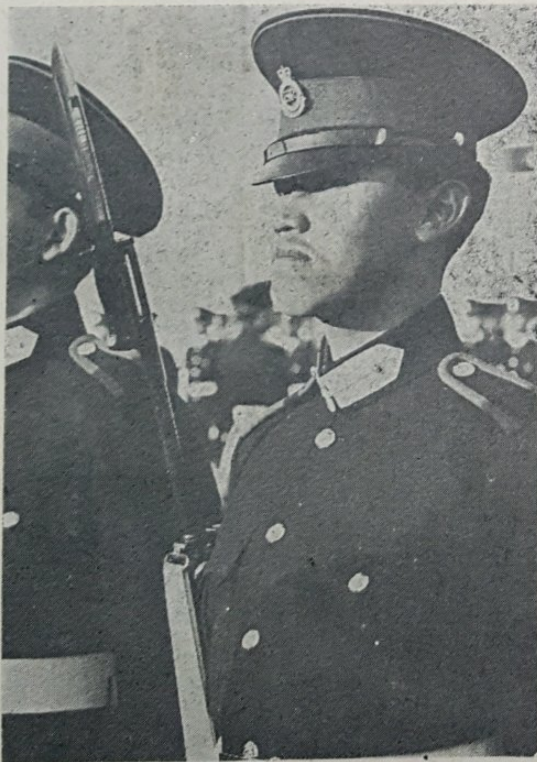
Yang Teramat Mulia Seri Paduka Duli Pengiran Temenggong Sahibul Bahar Muda Muhammad Bolkih, adinda kepada Duli Yang Maha Mulia Paduka Seri Sultan kelihatan dalam gambar sa-belah kanan sedang mengambil bahagian dalam satu latehan perbarisan baru2 ini bagi perbarisan Baginda Queen di Sandhurst, Maktab Tentera Di-Raja British yang mashhor diselatan England.

Walau machamana pun, Yang Amat Berhormat mensifatkan sa-bagai 'bagus juga' apabila ahli yang di-pilih itu mengatakan bahawa nikmat2 itu hanya di-dapati oleh orang2 dalam bandar saja, termasuklah ahli2 yang di-pilih itu sendiri dapat menerima sama nikmat-nya.