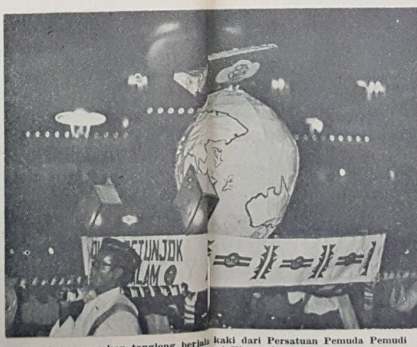
Pasukan perarakan tanglong berjaya dari Persatuan Pemuda Pemuda Kampung Sigai Klanggich.