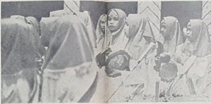
Hadhrab perempuan dari Persatuan Bui Putera Belait berjaya menjadi Johan seluruh negeri.

Sesuai dengan peranan Agama Islam sebagai Agama rasmi di-negeri ini, maka sudah memang wajar supaya saha2 yang berani harus di-lakukan terhadap perkembangan dan kesucian-nya (Di-halaman ini di-siarkan ganjar2 yang di-ambil semasa sambutan Nuzul Al-Kor'an peringat kemunchak itu di-siarkan.)