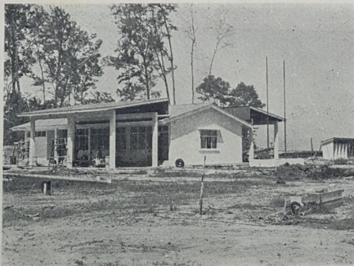
Pemereksaan Kastam dan Imigeresen di-sempadan Brunei dan Sarawak akan di-jalankan dengan lichin-nya apabila bangunan untuk melaksanakan kerja2 pemereksaan itu siap di-bena nanti. Kerja2 bagi membena bangunan itu (seperti gambar atas) kelihatan dalam peringkat terakhir.

Steshen yang ada sekarang akan di-ruboh apabila yang baru itu siap nanti.