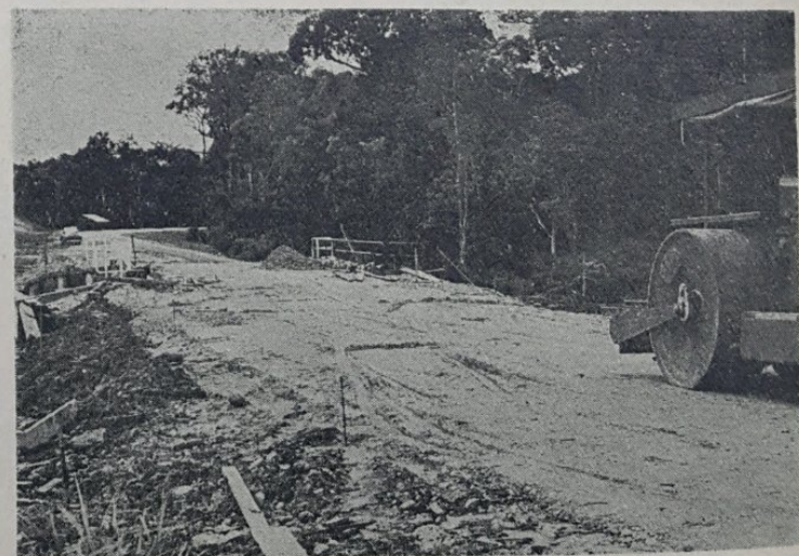
Gambar atas menunjukkan sa-buah jambatan yang menghubungkan Jalan Gadong dan jalan menuju ka-Kilanas pada masa ini telah dapat di-gunakan untuk lalu lintas. Jambatan itu telah dibena berikutan dengan pembenaan jalan baru di-Gadong beberapa tahun yang lalu, tetapi pembenaan jambatan tersebut telah tergendala. Sementara menantikan sempurna-nya pembenaan itu, sa-buah jambatan sementara telah di-buat.