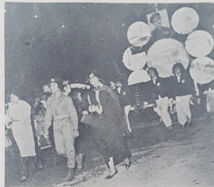
Pelajar2 perempuan Maktab Perguruan Melayu Brunei telah juga menyertai peraduan perarakan tanglong berjalan kaki yang di-adakan baru2 ini.