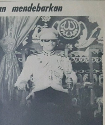
D.Y.M.M. Paduka Seri Sultan.

Baginda Sultan yang lalu telah menduduki takhta Kerajaan Brunei sa-lama 17 tahun dan memerintah negeri ini dengan penuh kebijaksanaan dan keadilan. Baginda telah membawakan kemajuan yang di-nek-nakhal rasmi turun dari takhta Kerajaan Negeri Brunei itu, telah di-starikan oleh Yang Teramat Mulia Seri