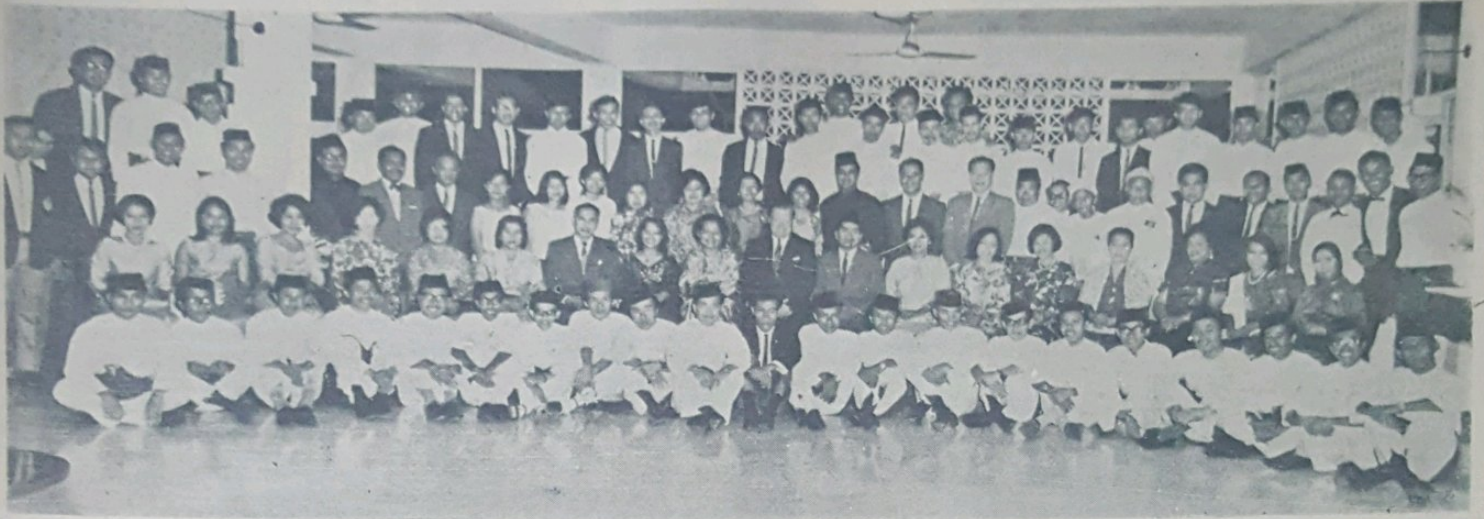
Gambar atas menunjukkan pelajar2 Brunei di-Malaysia Barat dan jemputan2 khas bergambar ramai sa-bagai kenangan bagi penutup acara majlis itu.