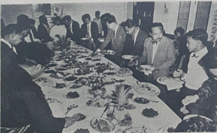
Suasana dalam majlis jamuan makan berserak.