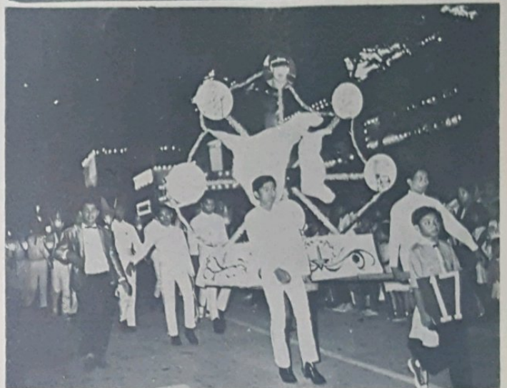
Dua buah gambar atas menunjukkan sa-bahagian dari peserta2 yang mengambil bahagian dalam perarakan tanglong.