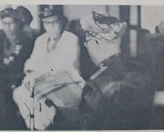
Gambar atas menunjukkan, Yang Teramat Mulia Seri Paduka Duli Pengiran Bendahara sedang membacakan pemashoran pertabalan Duli Yang Maha Mulia Paduka Seri Sultan Hassanul Bolkiah dalam istiadat yang di-langsungkan di-Istana Darul Hana dengan di-saksikan oleh pem-besar2 negara.

Duli Yang Maha Mulia Raja Isteri yang baru ada-lah bekas Yang Teramat Mulia Pengiran Anak Saleha, puteri kepada Yang Teramat Mulia Seri Paduka Duli Pengiran Pemancha Haji Mohammad Alam dan Duli Pengiran Bini Anak Besar.