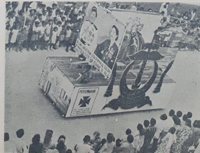
Gambar atas menunjukkan perarakan kereta berhias yang di-punyai oleh kakitangan Jabatan Perubatan dan Kesihatan dan Penghapus Malaria yang berjaya mendapat hadiah ketiga.