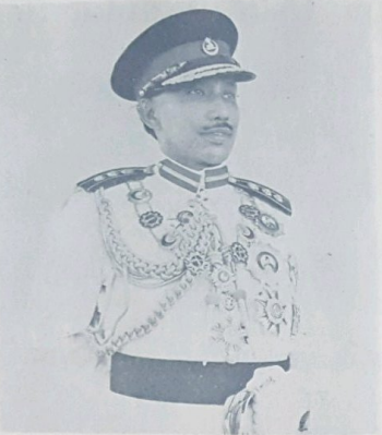
Duli Y.T.M. Paduka Seri Bagawan dengan pakatan selaku Pemertab Tertinggi Askar Melayu Di-Raja.

Apa dasar2 pemerintahan, dari Singabhasana, Paduka Seri Sultan telah menubuhkan Ikrar akan tetap menjalankan dasar2 pemerintahan seperti masa yang telah di-laksanakan oleh Paduka Ayahanda Baginda dan kerana itu Baginda membuat seruan kepada seluruh lipisan rakyat agar menubuhkan kerisahan yang erai untuk melaksanakan chit2 Baginda yang murni itu — chit2 untuk keamanan, kemahmahan dan kesejahteraan negeri Brunei serta penduduknya. Semoga di-berkati Allah.