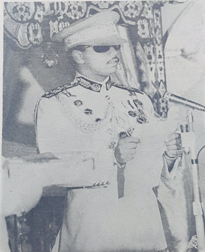
D.Y.M.M. PADUKA SERI SULTAN

(Berita lanjut mengenai pengishtiharan turun dari takhta oleh Paduka Ayahanda Baginda di-siarkan di-muka tengah.)