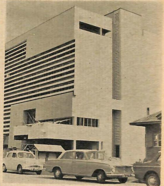
Bangunan baru Dewan Bahasa dan Pustaka