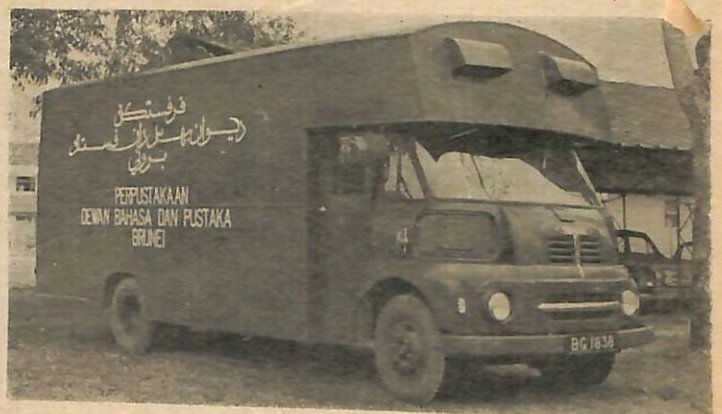
Perpustakaan bergerak Dewan Bahasa dan Pustaka.