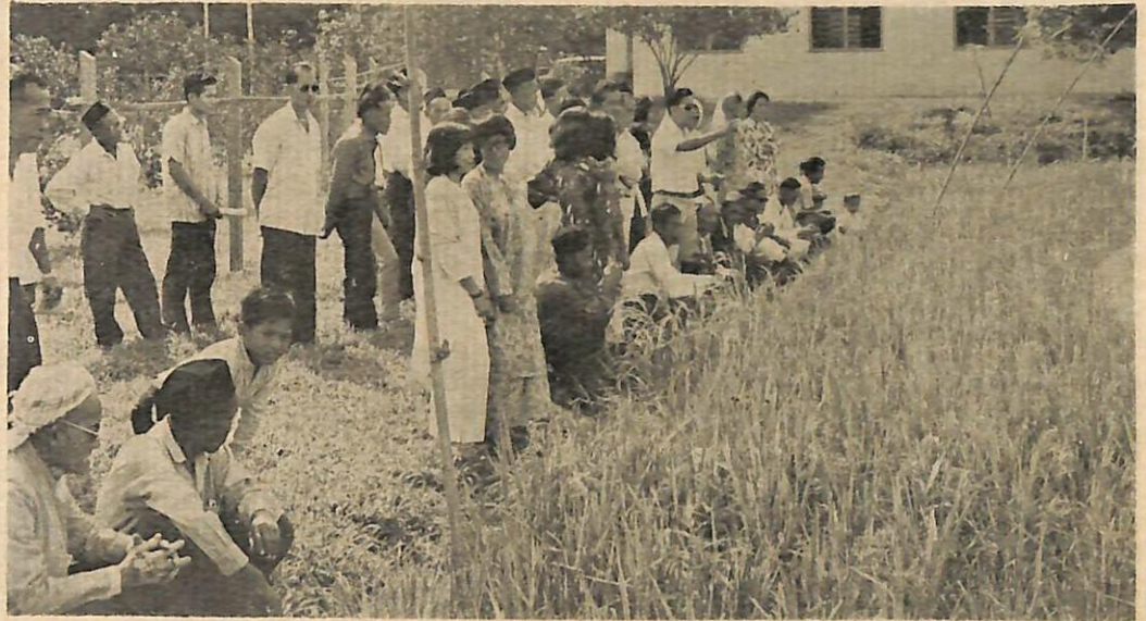
Ahli2 Persatuan Peladang Kg. Sebakit sedang di-tunjukkan oleh sa-orang Pegawai Pertanian contoh tanaman padi yang baik.

Sa-orang juruchakap jabatan pertanian berkata, setakat ini anggota2 dari 44 buah persatuan2 peladang di-negeri ini telah menghadiri kursus sa-rupa itu di-kampong2 mereka.