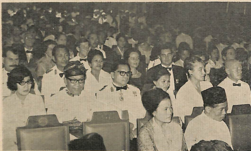
Gambar atas: Sa-bahagian daripada pembesar2 negara yang telah hadir di-istiadat tersebut.