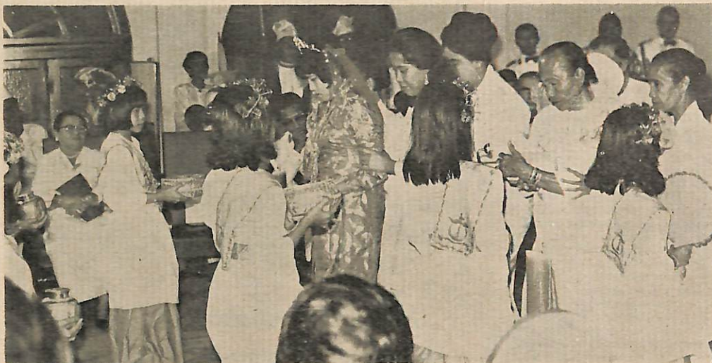
teri Nor'ain sedang di-iringi ka-Balai Singgahsana oleh isteri2 pembesar negara yang di-ketuai oleh isteri Ketua Cheteria, Yang Amat Mulia Pengiran Shahbandar.