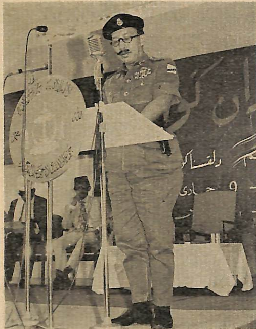
Duli Yang Maha Mulia Paduka Seri Baginda Maulana Al-Sultan ketika bertitah dalam majlis pembukaan Kursus Guru2 dan Pegawai2 Ugama yang di-langsungkan pada hari Ahad lepas.

Pembukaan rasmi kursus itu telah di-hadiri oleh antara lain Yang Teramat Mulia Seri Pa-