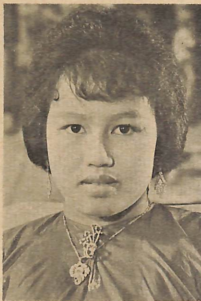
Yang Teramat Mulia Pengiran Anak Puteri Nor'ain.

Maka ternampak alat2 yang dipakai oleh sa-orang puteri ketika hendak memasoki ka-gerbang perkahwinan. Alat2 itu dari Gelang