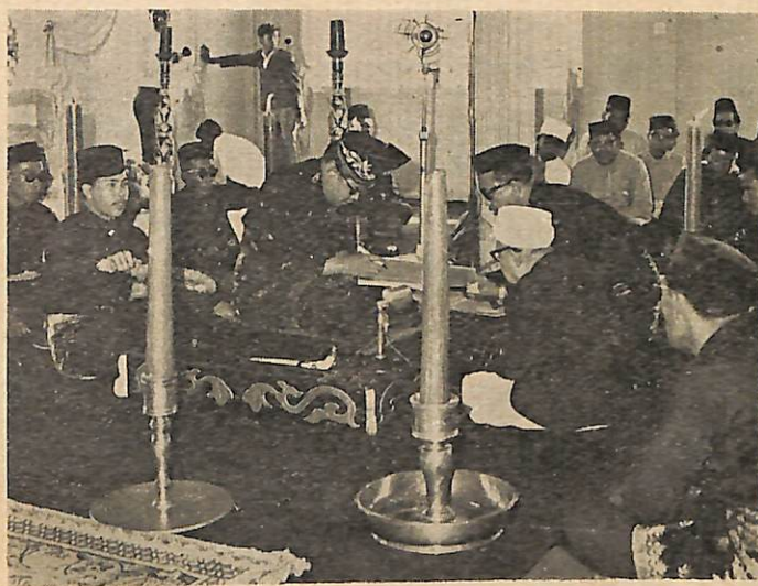
Yang Amat Mulia Pengiran Anak Mohamad Yusof sedang menandatangani surat nikah dalam istiadat 'Akad Nikah Di-Raja.