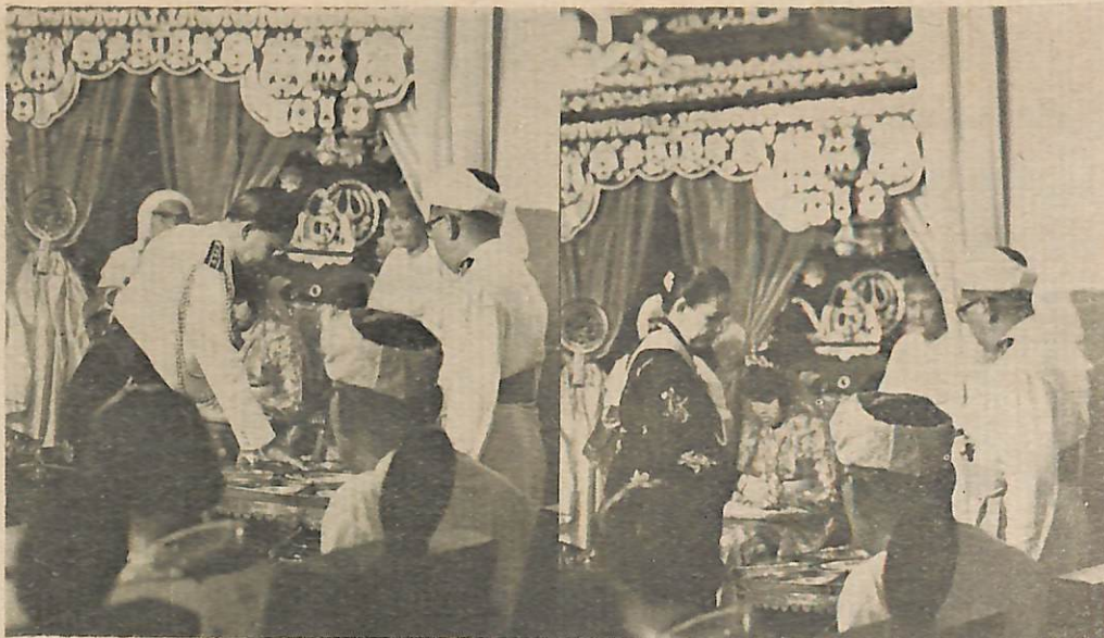
Gambar atas kiri: Duli Yang Maha Mulia Paduka Seri Baginda Maulana Al-Sultan sedang menchuliki bedak kepada puteri Baginda, Yang Teramat Mulia Pengiran Anak Pu-

Istiadat menchuliki Bedak Di-Raja itu di-mulakan dengan di-dahului oleh Duli Yang Maha Mulia Paduka Seri Baginda di-ikuti pula oleh D.Y.M.M. Raja Isteri yang telah menchuliki Bedak Di-Raja kepada puteri Baginda.