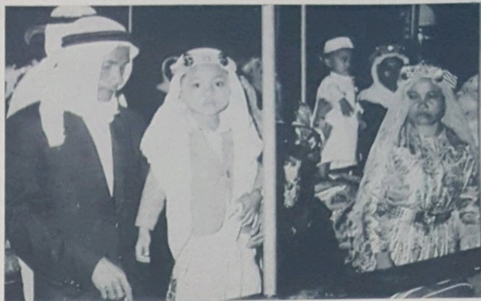
Seramai 187 orang jema'ah2 Haji dari Negeri Brunei yang telah berangkat ka-Tanah Suci dengan menaiki kapal laut pada tahun ini telah selamat balek ka-Brunei pada malam hari Juma'at 29 April, 1966. Gambar ini di-ambil di-Tambatan Kastam Diraja, Bandar Brunei pada masa ketibaan sa-bilangan daripada jema'ah2 Haji itu dalam sa-buah kapal Kerajaan Brunei dari Labuan pada malam tersebut.