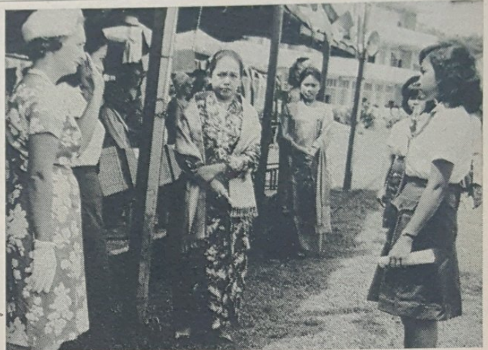
Duli Yang Maha Mulia Raja Isteri kelihatan dalam gambar ini semasa Baginda berchemar Duli ka-Temasha Perjumpaan Pandu2 Puteri dari seluruh negara di-Padang Sekolah Melayu S.M.J.A. pada petang hari Sabtu 30 April, 1966.

BANDAR BRUNEI. — Duli Yang Maha Mulia Raja Isteri telah berchemar Duli ka-Padang Sekolah Melayu Sultan Mohamed Jamalul Alam, Bandar Brunei pada petang hari Sabtu 30 April, 1966 untuk menyaksikan temasha Perjumpaan Pandu2 Puteri dari seluruh Negeri Brunei.