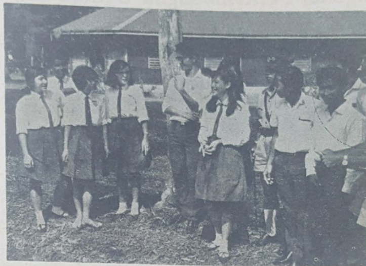
Gambar ini di-ambil pada masa lawatan penuntut2 Maktab Anthony Abell, Seria ka-Balai Polis Panaga.