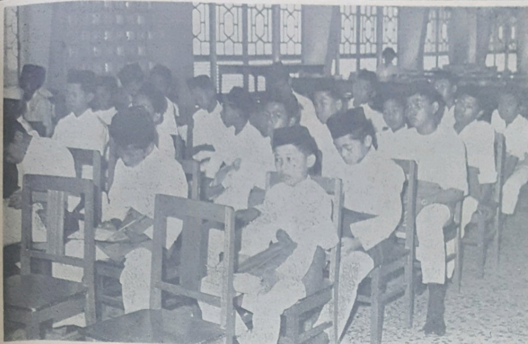
Sekolah Menengah Ugama (Arab) Hassanal Bolkiah Brunei telah mengadakan Majlis Perpisahan Akhir Persekolahan-nya di-Dewan Madrasah, Bandar Brunei pada 10 Disember, 1966. Dalam gambar ini kelihatan sa-bilangan daripada murid2 Sekolah Menengah Ugama (Arab) Hassanal Bolkiah, Brunei sa-masa mereka menghadhiri majlis tersebut.