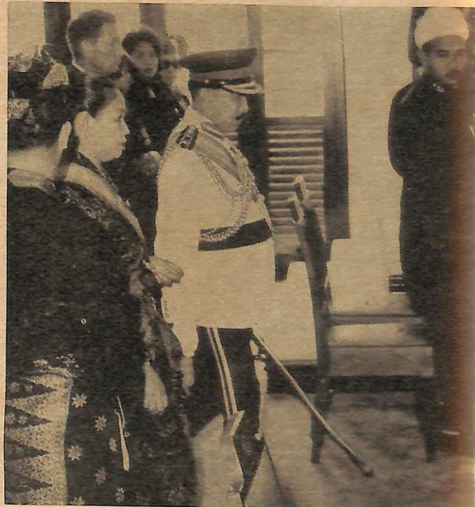
Duli Yang Maha Mulia Paduka Seri Baginda Maulana Sultan dan Duli Yang Maha Mulia Seri Paduka Raja Isteri berhadapan berangkat ka-Balai Singgahsana, Istana Darul Hana untok menghadiri Istiadat Peringatan Darjah Kehormatan Jasa Utama pada pagi 12 Ogos.

Baginda juga telah me-hatkan Ahli2 Darjah dan Pingat supaya bersungguh2 churahkan perkhidmatan