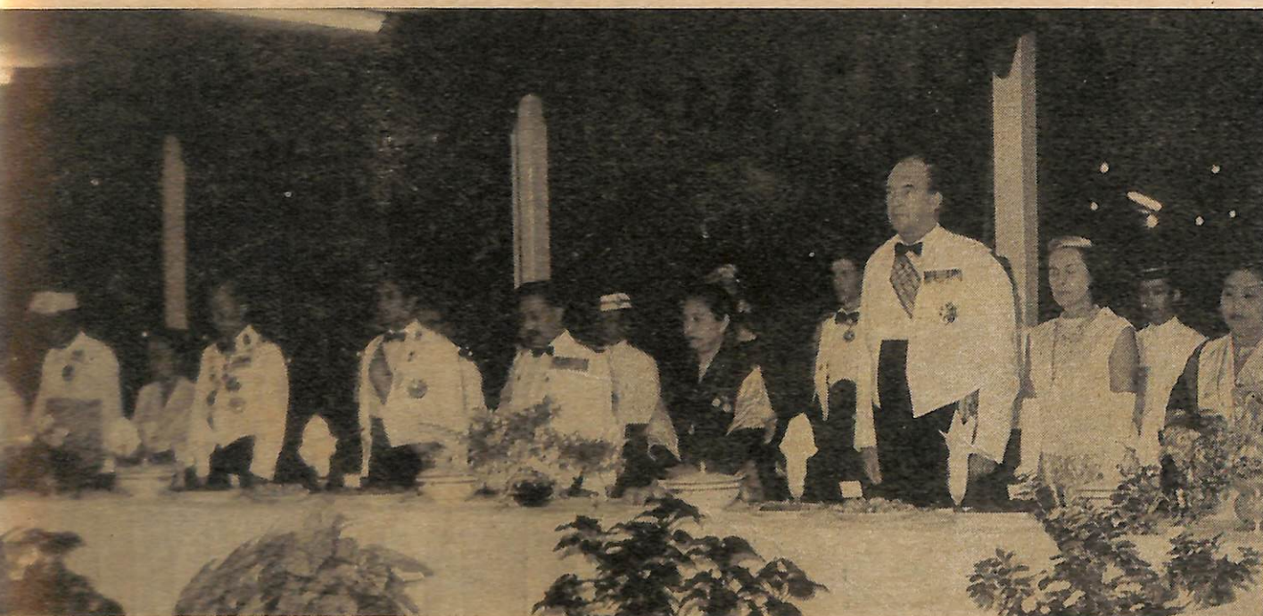
D.Y.M.M. Maulana Al-Sultan kelihatan semasa Baginda menghadiri Majlis Santapan Berserak di-Taman Istana Darul Hana pada malam 12 Ogos. Berdiri di-sabelah kanan Baginda dalam gambar ini ia-lah D.Y.M.M. Seri Paduka Raja Isteri dan di-sabelah kiri Baginda ia-lah Y.T.M. Seri Paduka Duli Pengiran Muda Mahkota Hassanal Bolkihah.

tapan Berserak telah di-lang- songkan di-Taman Istana Darul Hana.