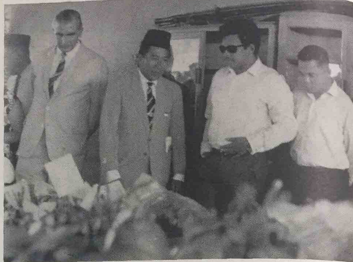
Yang Teramat Mulia Seri Paduka Duli Pengiran Muda Mahkota Hassanal Bolkiah (bilangan kedua dari kanan) kelihatan dalam gambar ini semasa Yang Teramat Mulia itu berchemar Duli ka-temasha Pertunjukan Pertanian Sa-Negeri Brunei pada pagi hari Juma'at 3 September 1965.

Timbalan Menteri Besar Brunei merangkap Menteri Pertanian Brunei Yang Berhormat Pengiran Dato Seri Paduka Haji Ali bin Pengiran Haji Md. Daud telah merasmikan pembukaan Pertunjukan Pertanian Sa-Negeri Brunei di-bangunan sementara Sekolah Melayu Sultan Mohamed Jemalul Alam, Bandar Brunei pada pagi hari Juma'at yang lalu. Dalam gambar ini kelihatan Yang Berhormat Dato Seri Paduka Haji Ali semasa beliau beruchap di-majlis pembukaan rasmi Pertunjukan Pertanian itu.