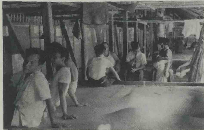
Dalam gambar ini, keluarga 2 Iban di-rumah panjang Kinua kelihatan hidup dalam suasana gembira.

Mencheritakan a k a n penghidupan puak Iban dalam beberapa tahun yang lalu, Penghulu