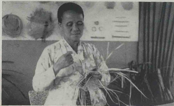
Sa-orang perempuan kelihatan menganyam bakul di-temasha Pertunjukan Pertanian Sa-Negeri Brunei baru 2 ini.