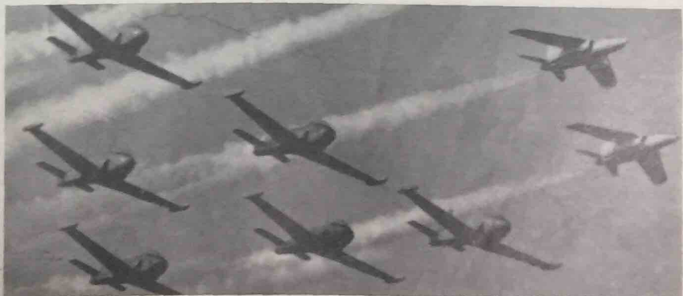
Lapan buah kapal terbang pejuang jet buatan British, enam buah jenis Red Pelicans dan dua Gnats. Dalam perjuangan di-Kashmir sekarang jenis Gnats yang di-gunakan oleh India, sementara Pakistan menggunakan pesawat pejuang jenis Sabre dan F-104 buatan Amerika.

Oleh ini maka satu ujian akan di-hadapi oleh Bangsa2 Bersatu mengenai masalah Kashmir, sa-telah ia-nya agak berjaya dalam tahun 1948 mendapatkan gencatan senjata di-Kashmir. Mungkin apabila kegentingan di-Kashmir bertambah lagi membahayakan dan jika banyak lagi negara2 mengambil kesempatan untuk menyampaikan bantuan mereka kepada salah satu pihak, neschaya permulaan perang di-Kashmir merebak lebeh luas, mungkin membingungkan Bangsa2 Bersatu untuk mengatasi masalah itu gagal, jika tidak di-keraskan dari sekarang, seperti yang terlihat di-Vietnam hari ini.