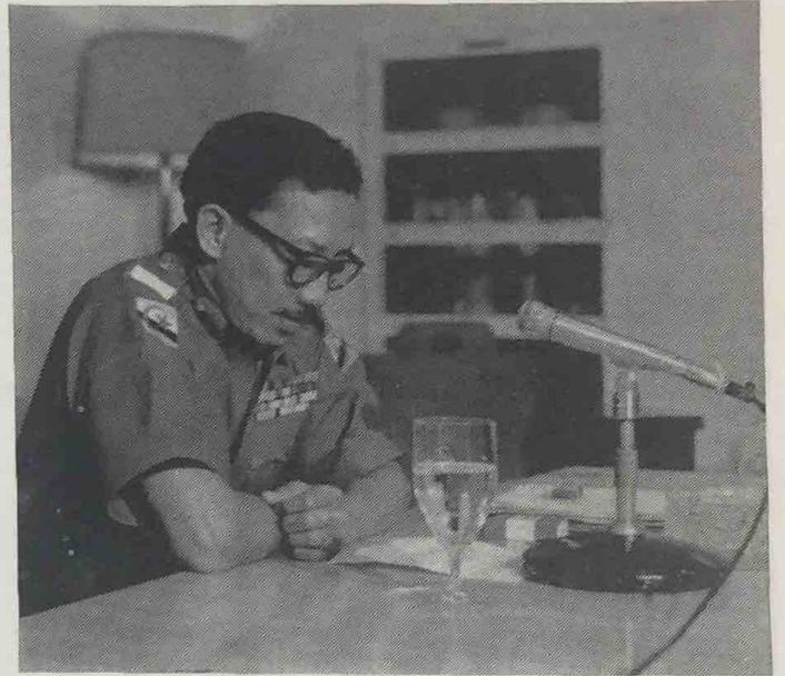
Duli Yang Maha Mulia Paduka Seri Baginda Maulana Al-Sultan, Sir Omar Ali Saifuddin telah menyampaikan ucapan terima kasih kepada Ahli2 Jawatan Kuasa Perkahwinan Diraja dan juga kepada semua lapisan ra'ayat yang telah bekerjasama pada masa di-langsungkan Perkahwinan Diraja antara Yang Teramat Mulia Seri Paduka Duli Pengiran Muda Mahkota Hassanal Bolkhiah dan Yang Amat Mulia Duli Pengiran Isteri Anak Saleha baru2 ini. Titah ucapan Duli Yang Maha Mulia Maulana Al-Sultan telah di-pancharkan melalui Radio Brunei. Dalam gambar ini kelihatan Baginda semasa melafadzkan titah ucapan tersebut di-Istana Darul Hana.

Serentak dengan istiadat itu, "Gendang Perang" pun di-bunyikan dengan di-iringi tembakan meriam sa-banyak 9 das, dan setelah itu di-ikuti dengan "Gendang Aleh2an Tengah dan Aleh2-an Ujong".