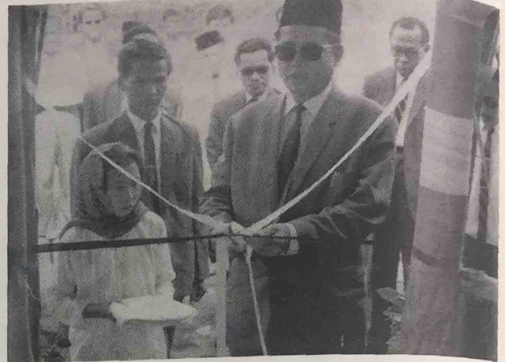
Awang Johari bin Abdul Razak kelihatan mengguntingkan peta sa-bagai merasmikan pembukaan Rumah Persatuan Pemuda Kampong Penanjong pada petang hari Ahad yang lalu.

Pada sa-belah malam pula ramai penduduk2 Kampong Penanjong dan dari lain2 tempat telah menyaksikan tayangan Wayang Gambar oleh Jabatan Penyiaran dan Penerangan, Brunei.