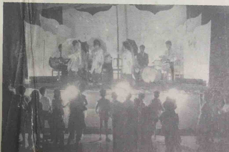
Ini-lah satu pemandangan sa-buah tarian yang di-persembahkan oleh murid2 perempuan Sekolah Melayu Anggerak Desa. Berakas di-temasha Malam Ria, Sambutan Akhir Persekolahan Sekolah Melayu Anggerak Desa baru2 ini.

Borang2 permohonan boleh di-dapati di-Pejabat Kadzi Daerah Belait, dan mesti-lah di-kembalikan kepada pejabat ini tidak lewat dari 31 Disember, 1965.