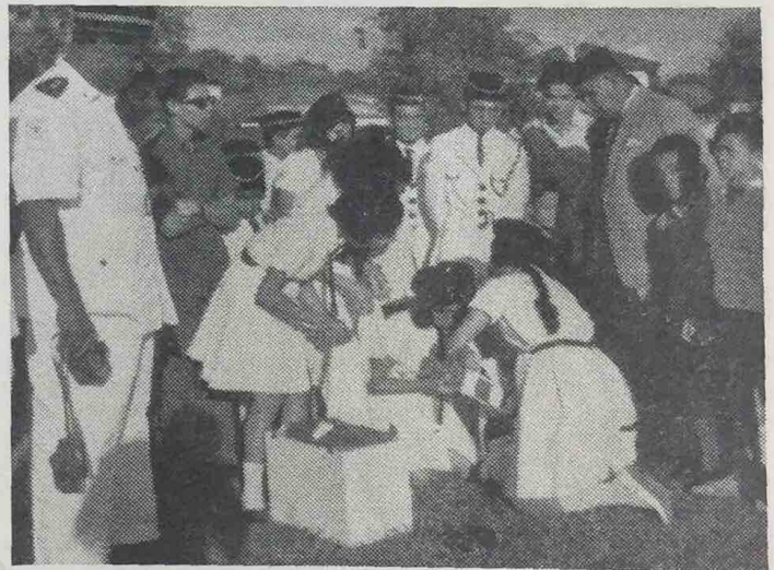
Sambutan "Minggu Palang Merah" telah di-adakan di-Negeri Brunei di-bawah anjuran Pasokan Palang Merah Negeri Brunei, mulai pada 7 Mei hingga ka-15 Mei, 1965, untuk mengutip derma bagi membantu Tabong Derma Palang Merah itu.

Di-antara achara2 yang telah di-adakan ia-lah Hari Bendera, Pertunjukan Pekerjaan Palang Merah; Wayang Gambar; Permainan Pancharagam oleh Pancharagam Pulis Brunei dan oleh Pasokan Gurkha di-Dewan Kemasyarakatan, Bandar Brunei dan Temasha Tari Menari Derma Bakti di-Klub Peralu Layar Diraja Brunei.