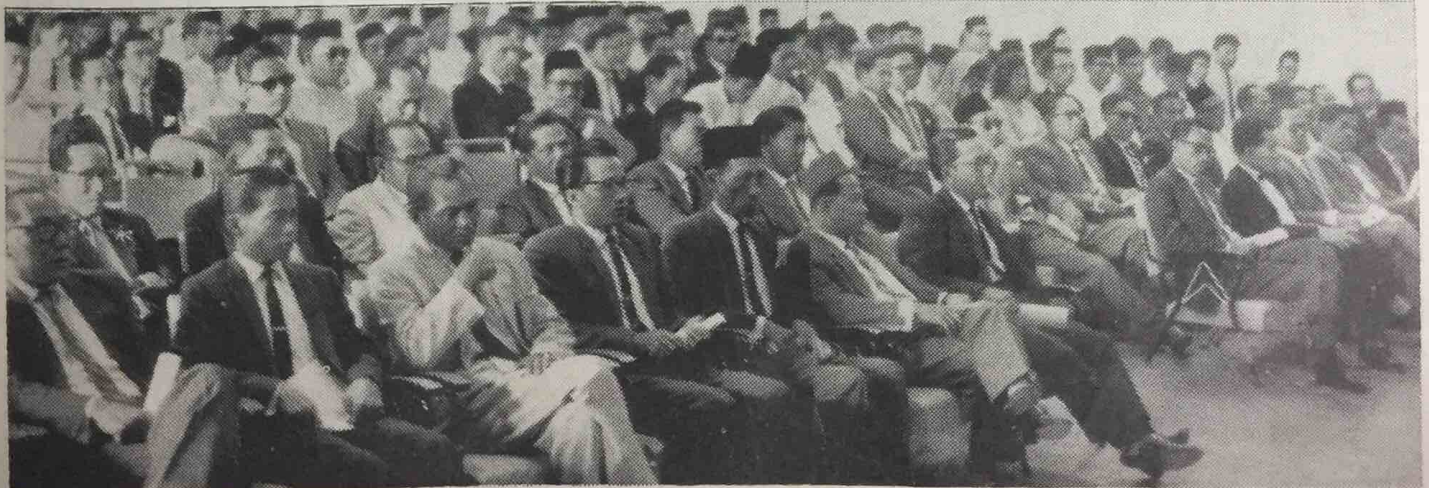
Menteri Besar Brunei, Yang Amat Berhormat Dato Seri Paduka Marsal bin Maun telah merasmikan pembukaan Kursus Pemimpin 2 Belia sa-Negeri Brunei di-Dewan Maktab Anthony Abell, Seria pada pagi hari Ahad 16 Mei, 1965. Dalam gambar 2 ini kelihatan di-antara para jempunan dan lain 2 -nya yang hadir di-majlis pembukaan rasmi kursus itu.