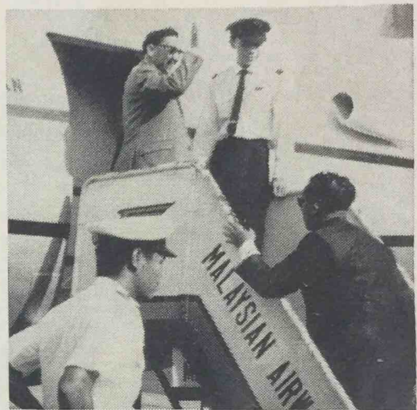
Gambar atas: Duli Yang Maha Mulia Paduka Seri Baginda Maulana Al-Sultan, Sir Omar Ali Saifuddin kelihatan mengucapkan "Selamat Tinggal" semasa Baginda menaikki kapal terbang untuk berangkat ka-London pada petang hari Khamis 13 Mei, 1965.

Duli Yang Maha Mulia Paduka Seri Baginda Maulana Al-Sultan telah di-iringi oleh Duli Yang Maha Mulia Raja Isteri serta Putera2 dan Puteri2 Baginda2.