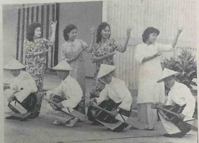
Penari2 Kebudayaan dari rombongan pertama Persatuan Seni Budaya Melayu Brunei sedang berlatih Tarian Adai-adai Naindung yang telah di-persembahkan di-suatu majlis malam kebudayaan di-Bandar-raya Singapura beberapa tahun yang lalu.

Dari saloran kebudayaan (dan lebeh2 lagi masharakat2 yang berlainan tempat dan faham) kita bo-