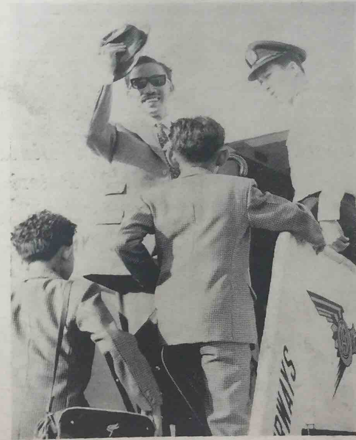
Duli Yang Maha Mulia Maulana Al-Sultan kelihatan menguchapan "Selamat Tinggal" buat sementara kepada para hadirin di-Lapangan Terbang Berakas sa-belum Baginda dan Putera2 serta rombongan berangkat ka-England pada petang hari Khamis yang lalu.

Sementara itu menurut satu kawat Sharikat Perkhbaran REUTER dari London, Duli Yang Maha Mulia Maulana Al-Sultan serta dua orang Putera2 Baginda dan rombongan telah selamat tiba di-London pada hari Juma'at yang lalu.