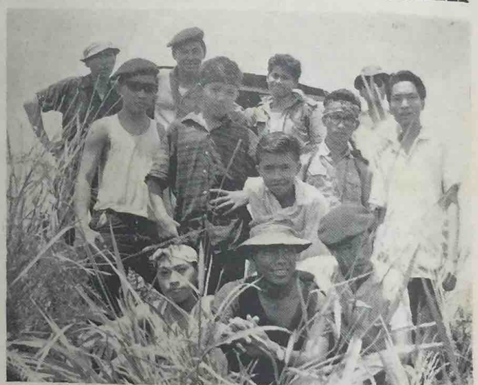
Beberapa orang Pegawai2 dan ahli2 Persatuan Angkatan Tunas Harapan (PATUH) Brunei telah mendaki Bukit Saeh baharu2 ini. Gambar ini di-ambil di-atas Bukit Saeh sa-lepas pemuda2 tersebut berjaya mendaki bukit yang tinggi itu, letak-nya di-Daerah Brunei.