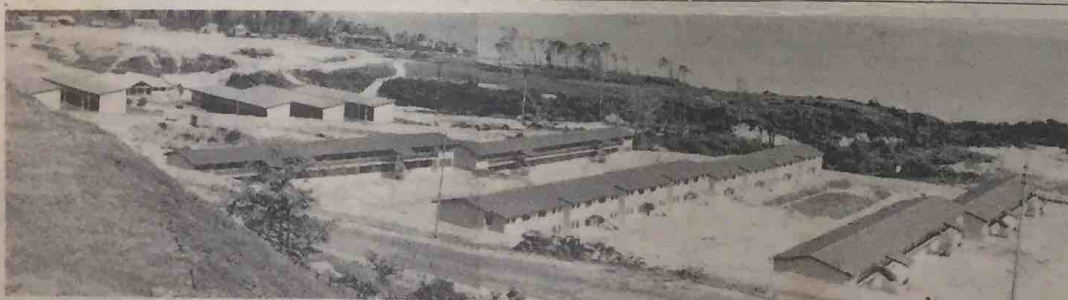
Kawasan Perkhemahan Askar Melayu Brunei, di-Berakas maseh dalam pembenaan, tetapi tidak lama lagi sa-tengah2 dari bangunan2 ini (atas) boleh di-diami. Gambar ini telah di-ambil baharu2 ini dari atas bukit tempat rumah kediaman Pegawai Pemerintah askar itu.

Pihak pulis menyiasat puncha2 kebakaran tersebut.