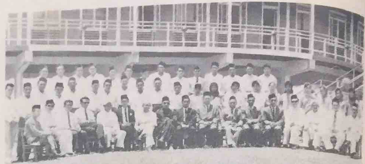
Gambar ramai para hadirin di-majlis pembukaan rasmi perjumpaan Guru2 UGAMA Daerah Tutong yang telah di-langsungkan di-Sekolah UGAMA Sengkurong pada 4 April, 1964.