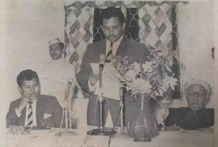
Yang Teramat Mulia Seri Paduka Duli Pengiran Muda Mahkota Brunei kelihatan dalam gambar ini sedang memberi ucapan di-majlis jamuan "Selamat Perpisahan" yang telah diadakan di-rumah Y.T.M. Seri Paduka Duli Pengiran Pemancha baharu2 ini.