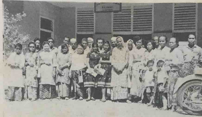
Beberapa orang kaum ibu tani dari Daerah Temburong telah melawat ka-Pusat Perchubaaan Tanam2an Kilanas baharu2 ini. Dalam gambar ini kelihatan para pelawat itu semasa ka-tempat itu.