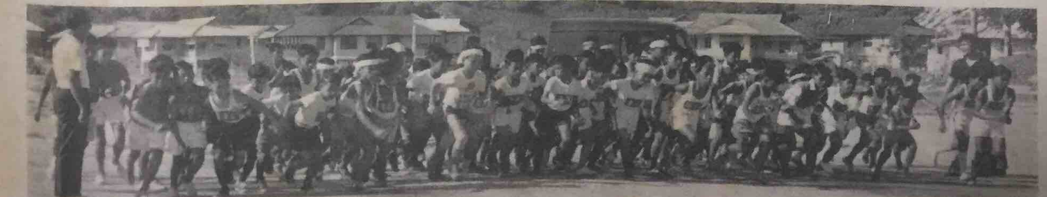
Gambar ini di-ambil di-kawasan Tongkadeh pada petang 28 Mach yang lalu pada masa peserta2 yang mengambil bahagian dalam Perlumbaan Merentas Desa Sekolah2 Melayu Bahagian Brunei II mulai berlumba.

Pertandingan bola sepak tersebut di-adakan di-Padang Besar Bandar Brunei dan di-mulai pada pukul 5 petang hari2 yang berkenaan.