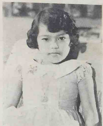
Y.T.M. PENGIRAN ANAK PUTERI AMAL UMI KALTHUM AL-ISLAM