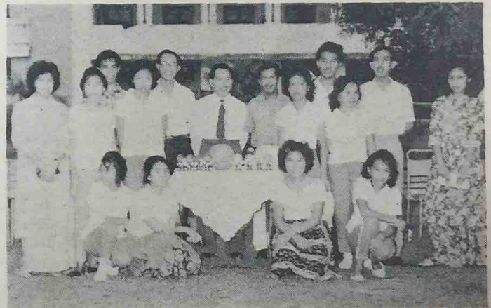
Sekolah Melayu Ahmad Tajuddin, Kuala Belait telah mengalahkan Sekolah Melayu Sengkuring dalam pertandingan akhir bola jaring antara murid2 perempuan Sekolah2 Melayu Sa-Negeri Brunei pada 6 Disember, 1963. Dalam gambar ini kelihatan pemain2 Pasokan S.M.A.T. dan beberapa orang yang lain sa-lepas Pasokan S.M.A.T. berjaya menyandang gelaran kejohanan pertandingan tersebut.