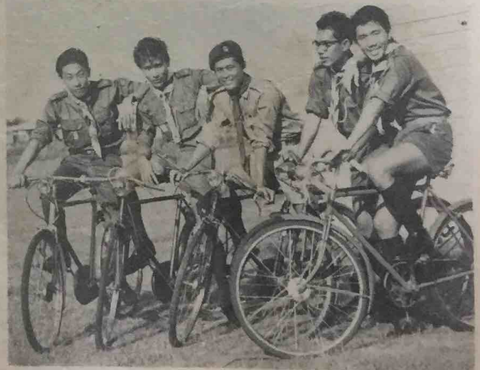
Enam orang Pengakap2 Kanan dari Seria telah mengembara ka-Bangkok, Thailand dengan menaiki basikal baharu2 ini. Lima daripada enam orang Pengakap2 tersebut kelihatan dalam gambar ini tidak beberapa lama sa-belum mereka pergi ka-Bangkok.