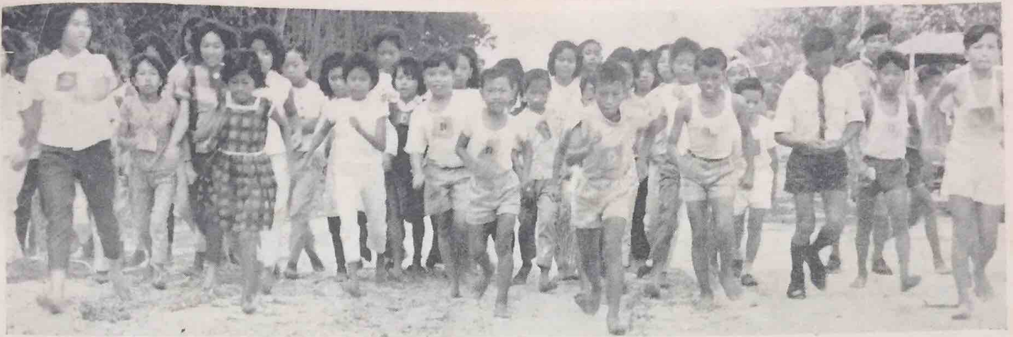
Sekolah Melayu Sungai Kebun telah mengadakan satu temasha Perlumbaan Berjalan Kaki di-Jalan Lumapas — Sungai Kebun pada 8 Disember, 1963. Keputusan2 perlumbaan berjalan kaki itu telah di-siarkan dalam PELITA BRUNEI pada 18 Disember, 1963. Gambar ini di-ambil pada masa peserta2 Perengkat 'D' mulai "berjalan" dari Jalan Lumapas ka-Sekolah Melayu Sungai Kebun.