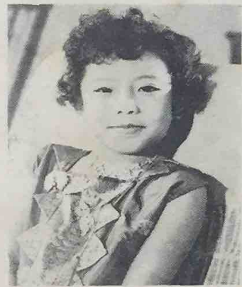
Y.T.M. PENGIRAN ANAK PUTERI AMAL RAKIAH

Istiadat Bertindek Dan Berkhatan Puteri2 Di-Raja