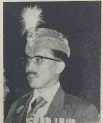
D.Y.M.M. MAULANA AL-SULTAN

"Alhamdulillah, beberapa kejayaan dan kemajuan telah pun kita chapai dan telah kita perbuat dalam tahun yang baharu lepas ini.