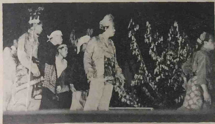
Persatuan Pakatan Putera Kampong Ayer, Brunei telah mempersembahkan satu pementasan derma bakti di-Pangpong Boon Pang Baharu, Bandar Brunei pada petang hari Ahad 22 Disember dengan memperolehi kejayaan. Dalam gambar ini kelihatan satu babak lakonan derama "Selingkar kesah di-Tasek Kaseh" yang telah di-persembahkan di-temasha tersebut.