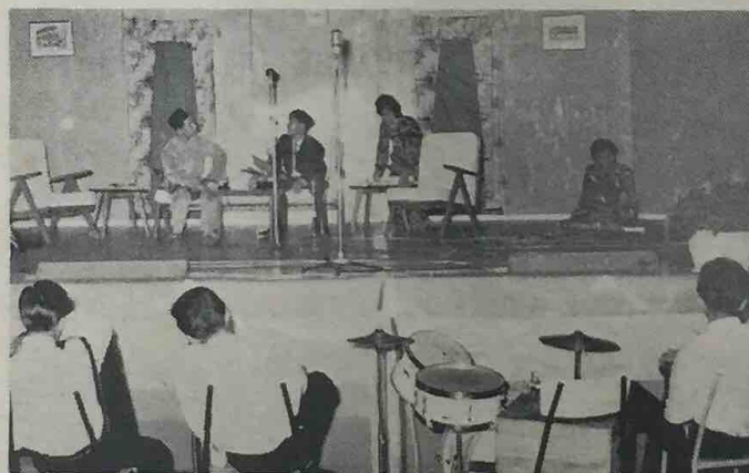
Ini-lah satu pemandangan lakonan "Chinchin Belah Rotan" yang telah di-persembahkan oleh penuntut2 Maktab Sultan Omar Ali Saifuddin dan Sekolah Tinggi Perempuan Raja Isteri di-temasha Malam Seni Budaya yang telah di-adakan di-dewan Maktab S.O.A.S. dalam bulan Disember