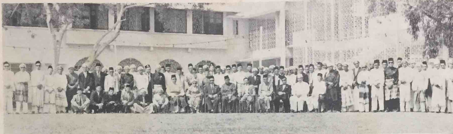
Wazir2, Chateria2 dan Menteri2 telah mengadakan satu perjumpaan di-Balai Pamajangan, Indera Kenchana, Istana Darul Hana pada 14 Disember, 1963. Gambar ini telah di-ambil sa-lepas di-adakan perjumpaan tersebut. Duli Yang Maha Mulia Paduka Seri Baginda Maulana Al-Sultan kelihatan duduk di-tengah dalam gambar ini.