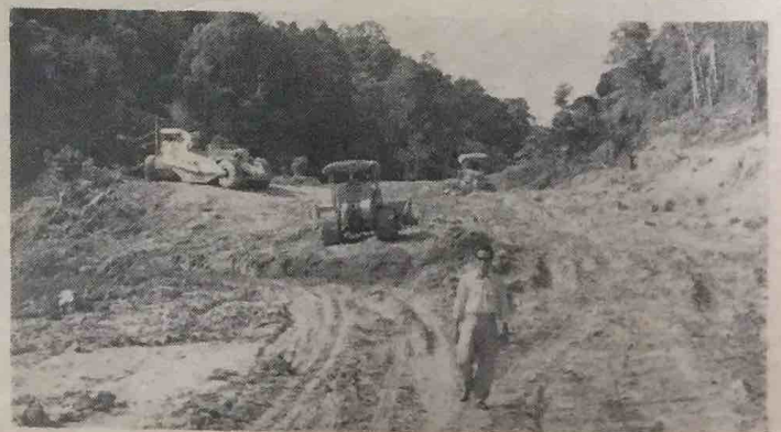
Ini-lah satu pemandangan jalan raya baharu yang sedang di-bena di-Jalan Lumapas, Daerah Brunei.