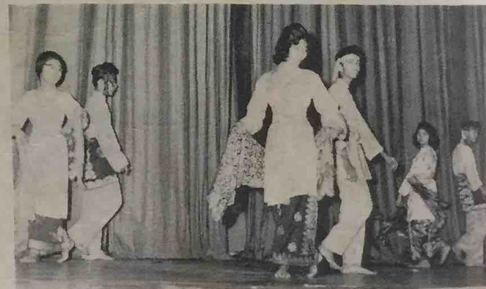
Penuntut2 Maktab Sultan Omar Ali Saifuddin dan Sekolah Tinggi Perempuan Raja Isteri, Bandar Brunei telah mempersembahkan Malam Seni Budaya di-dewan Haktab S.O.A.S. baharu2 ini dengan mendapat sambutan yang baik. Dalam gambar ini kelihatan satu tarian Melayu Asli yang telah di-persembahkan di-temasha itu.