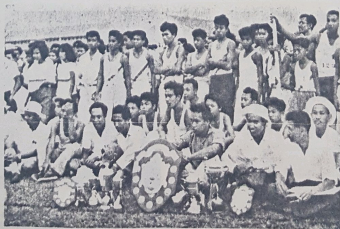
Satu pemandangan para peserta dan lain2-nya di-majlis monyampaikan hadiah pertandingan sukan Sekolah2 Melayu sa-Negeri Brunei yang telah di-adakan di-padang Sekolah Melayu S.M.J.A., Bandar Brunei pada 29 September, 1962. Berita berkenaan dengan pertandingan sukan itu telah di-siarkan dalam akhbar ini pada 3 Oktober, 1962.