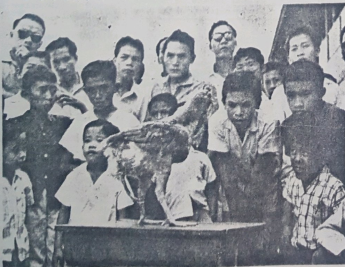
Wah! apa-kah yang menjadi kehairanan kepada pemuda2 dan kanak2 dalam gambar ini? Jikalau di-lihat benar2 ayam ini ada mempunyai tiga kaki. Di-manakah gambar ini di-ambil oleh Juru Gambar kita? Jawab-nya ia-lah di-temasha Pertunjukan Pertanian Negeri Brunei sa-dikit hari dahulu.