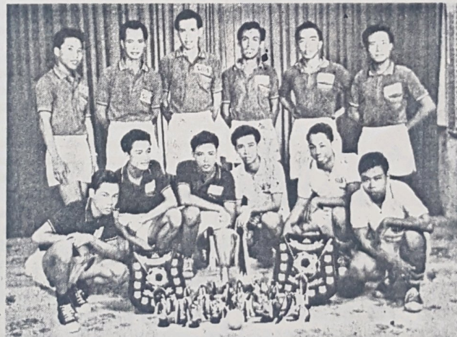
Ahli2 Pasokan Ikatan Pemuda, Brunei yang telah berjaya membolot hadiah2 pertama dan kedua dalam kedua2 bahagian pertandingan sepak raga jaring yang telah di-adakan di-Bandar Brunei tidak berapa lama dahulu sa-bagai salah satu acara sambutan Hari Ulang Tahun Keputeraan Duli Yang Maha Mulia Maulana Al-Sultan di-bawah anjoran Persatuan Guru2 Melayu Negeri Brunei. Gambar ini di-ambil sa-bagai kenangan kejayaan pasokan sepak raga jaring yang handal di-Negeri Brunei.

Pemohonan2 daripada pegawai2 Kerajaan, hendak-lah menghantarkan permohonan-nya melalui Ketua Jabatan masing2.