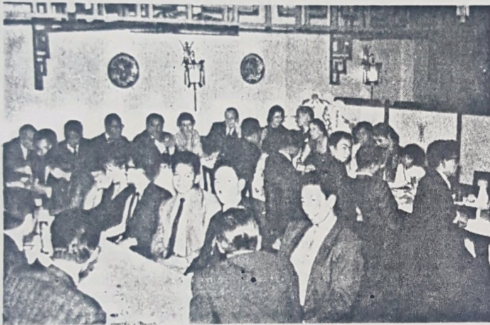
Satu pemandangan majlis sambutan hari ulang tahun Keputeraan Duli Yang Maha Mulia Maulana Al-Sultan, Sir Omar Ali Saifuddin yang telah di-adakan di-London, pada malam 29 September, 1962 di-bawah anjoran Persatuan Penuntut2 Brunei di-United Kingdom.