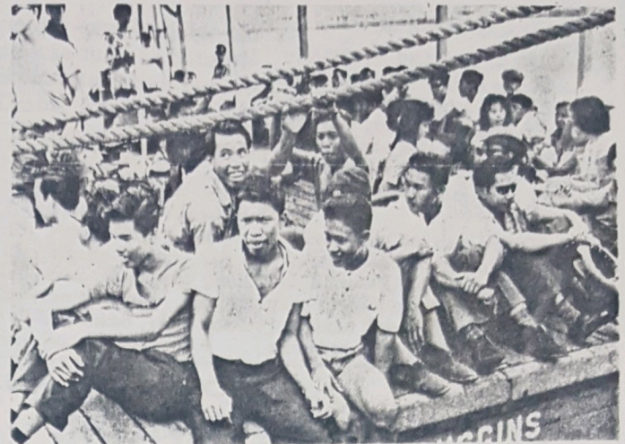
Sa-bilangan dari peserta2 yang mengambil bahagian dalam pengembaraan berjalan girang sa-belum feri yang membawa mereka ka-hujung Jalan Lumapas itu bertolak dari tambatan Kastam Diraja, Bandar Brunei.