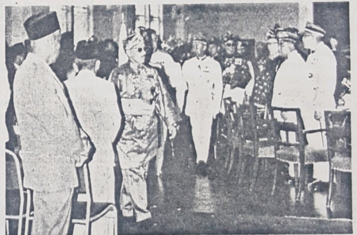
Duli Yang Maha Mulia Maulana Al-Sultan kelihatan dalam gambar ini sedang berangkat ka-luar bangunan Dewan Kemasyarakatan, Bandar Brunei pada pagi 10 Oktober sa-lepas Baginda merasmikan pembukaan Majlis Meshuarat, Negeri Brunei.