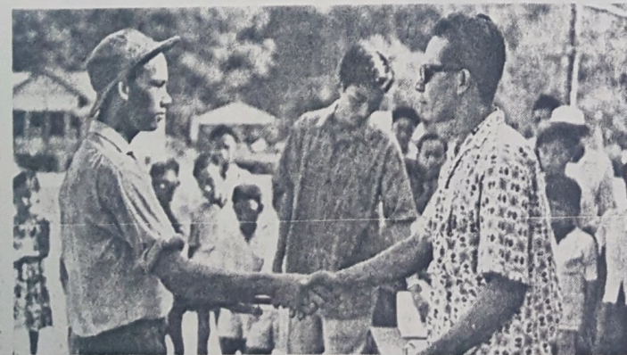
Yang Berhormat Inche Misir bin Karuddin, kelihatan dalam gambar ini sedang menyampaikan hadiah kepada sa-orang peserta yang berjaya dalam perlakuan bermain gasing yang telah di-adakan di-Pekan Bangar, Temburong dalam bulan September yang lalu sa-bagai salah satu daripada acara2 sambutan hari puja usia Duli Yang Maha Mulia Maulana Al-Sultan.

Orang ramai yang chenderong untuk menjadi ahli persatuan ini ada-lah di-galakkan supaya berhubung langsung kepada Setia Usaha Agong di-alamat Jabatan Hal Ehwat Uagama, Bandar Brunei.