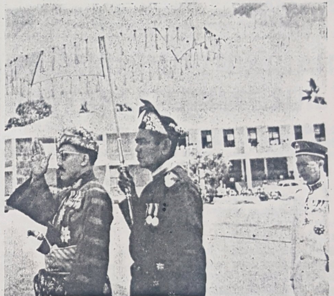
DULI YANG MAHA MULIA SERI PADUKA BAGINDA MAULANA AL-SULTAN kelihatan dalam gambar ini sedang membalas tabek dalam istiadat memereksa Barisan Kehormatan sa-belum Baginda merasmikan pembukaan Majlis Meshuarat Negeri Brunei baharu2 ini. Menteri Besar Brunei, Yang Amat Berhormat Dato Setia Marsal bin Ma’un kelihatan di-tanan sa-kali dalam gambar ini.

“Dengan sebab itu hendak-lah tuan2 sentiasa mengingati bahawa Allah Subhanahu Wata’ala sentiasa akan memberi petunjuk dan menurunkan rahmat-nya kepada hamba-nya sentiasa,