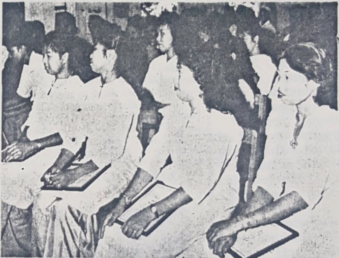
Sa-bilangan daripada penuntut2 perempuan Darjah Dewasa Kampong Gadong, Brunei kelihatan tersenyum dalam gambar ini pada masa di-adakan upacara menyampaikan sijil2 Darjah Dewasa kepada penuntut2 darjah dewasa itu di-Sekolah Melayu Gadong baharu2 ini.