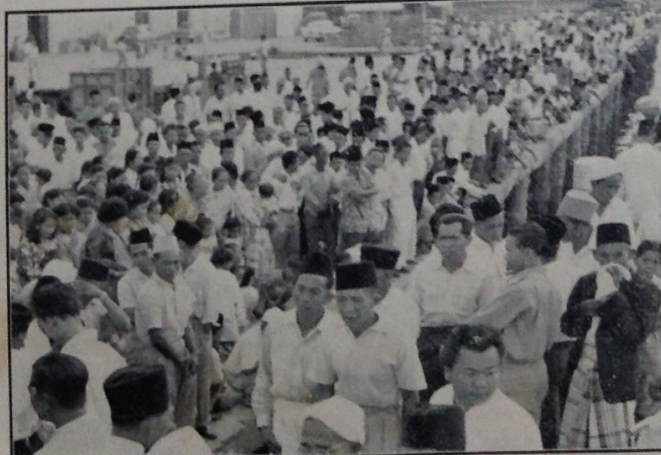
Satu pemandangan di-tambatan kapal, Bandar Brunei dan juga di-atas kapal Bolkihah baharu2 ini sa-belum sa-bilangan daripada bakal jema'ah2 haji dari negeri ini belayar ka-Labuan. Mereka telah belayar dari Labuan ka-Singapura dengan kapal Kimanis dan dari sana pula telah belayar ka-Jeddah dengan kapal yang lain.