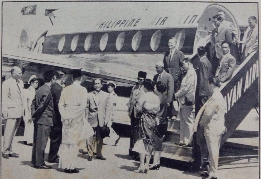
Presiden Carlos Garcia dari Filipina (berdiri di-tengah memegang topi) kelihatan pada masa beliau singgah di-lapangan terbang Brunei baharu2 ini dalam perjalanan beliau dari Manila ka-Persekutuan Tanah Melayu.