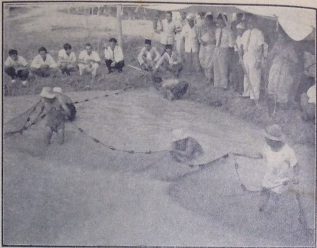
Penghulu2 dan ketua2 kampung itu sedang menyaksikan bagaimana ikan2 itu di-tangkap dengan menggunakan pukat, sambil itu Yang Berhormat Inche Hamidoon, Pegawai Pertanian Negara dan pegawai2 pertanian telah menjawab beberapa pertanyaan dari penghulu2 dan ketua2 kampung itu tentang chara2 pemeliharaan ikan2 itu.

Mereka2 juga telah di-beri penerangan oleh pegawai2 pertanian bagaimana chara2 menuai dengan menggunakan sabit dan chara2 menanggalkan buah2 padi yang di-tuai dengan menggunakan sa-jenis perkakas yang tertentu.