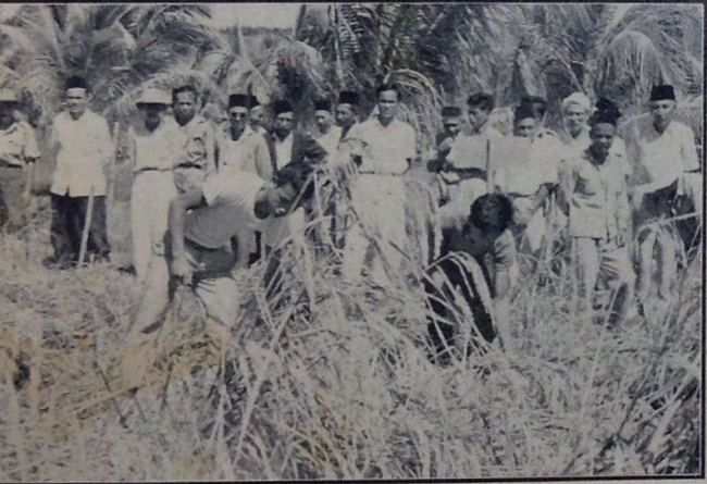
Chara2 menuai padi dengan menggunakan sabit khas ada-lah menyenangkan petani2 menjalankan kerja-nya telah di-tunjukkan oleh kaki tangan Jabatan Pertanian itu dalam bidang lawatan penghulu2 dan ketua2 kampung itu ka-tempat Kebun Kelapa Luahan, Jerudong.

Penghulu2 dan ketua2 kampung itu dapat menyaksikan perbezaan antara dua petak padi yang di-tanam dengan menggunakan baja: keadaan-nya subur dan mengeluarkan hasil yang banyak dan yang di-tanam dengan tidak menggunakan baja: keadaan-nya tidak subur dan tidak banyak mengeluarkan hasil.