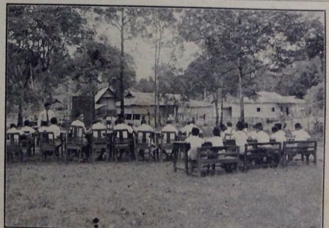
Hujan lebat telah membanjiri kawasan sekolah Kampong Katimahar, batu 12 Jalan Tutong baharu2 ini dan ayer telah masuk ka-dalam sekolah. Tetapi keadaan itu tidak mengchohokan guru2 menjalankan tugas mereka mengajar murid2. Klas2 telah di-pindahkan ka-suatu tempat tinggi dan pelajaran di-teruskan juga.

Tidak berapa lama kemudian, Murni centre forward Kuala Belait Recreation Club telah berjaya mendapatkan gol yang tunggal bagi K.B.R.C. dalam pertandingan tersebut.