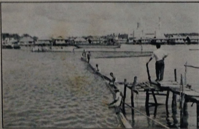
Pekerja2 Pejabat Kerja Raya duduk di-atas saloran ayer daripada getah sa-belum saloran itu di-benamkan di-dalam Sungai Brunei pada 15 November lepas.

Pertama — Kedai Kopi Hai Guan. Kedua — Kedai Kopi Chuan Guan. Hadiah2 khas — Kedai2 Jing Chew, Sir. Tai Peng, Wah Chuan dan Lai Wah.