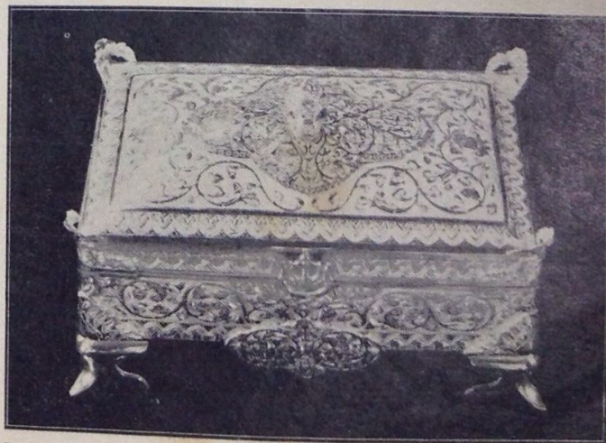
Rupa peti rokok buatan tukang2 perak Brunei yang telah di-hadiahkan oleh Kerajaan Brunei kapada Yang Terutama Yang di-Pertuan Negara Singapura Inche Yusof bin Ishak sa-bagai chendera mata kenangan lawatan beliau ka-Brunei dalam bulan September lepas.

Bagaimana pula hal-nya sa-ya hendak mengetahui bila-kah orang2 Melayu itu sampai kapulau Kalimantan ini, biar-lah soal ini di-selesaikan oleh ahli2 keturunan bangsa untok menentukan-nya, dan bukan-nya pada saya atau pun yang lain-nya.