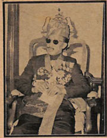
D.Y.M.M. SULTAN DI-LAPAU

rentahan dan ketenteraman serta kemakmoran Negeri ini.