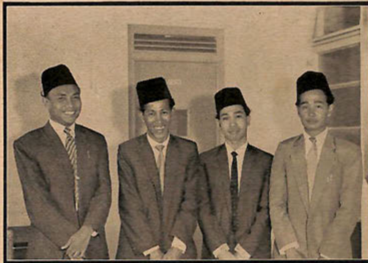
Penuntut2 dari Brunei yang telah berangkat ka-Kaherah untuk melanjutkan pelajaran di-Azhar University.

Penuntut2 tersebut telah selamat tiba di-kaherah dari Brunei.