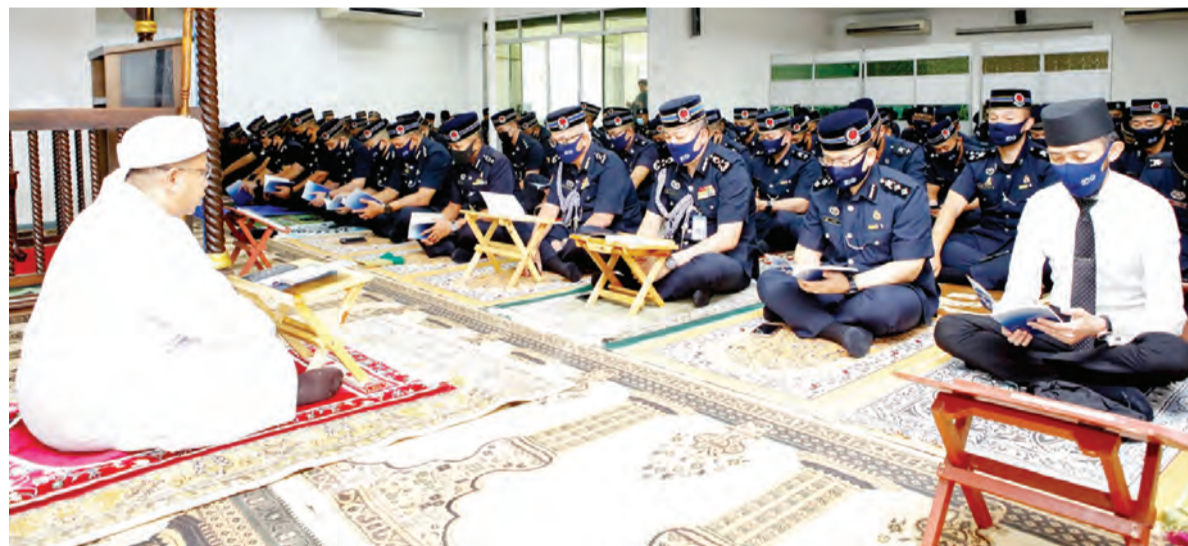
PESURUHJAYA Polis, Pasukan Polis Diraja Brunei (depan, tiga dari kanan) semasa hadir pada Majlis Bertahlil dan Membaca Surah Yaa Siin.