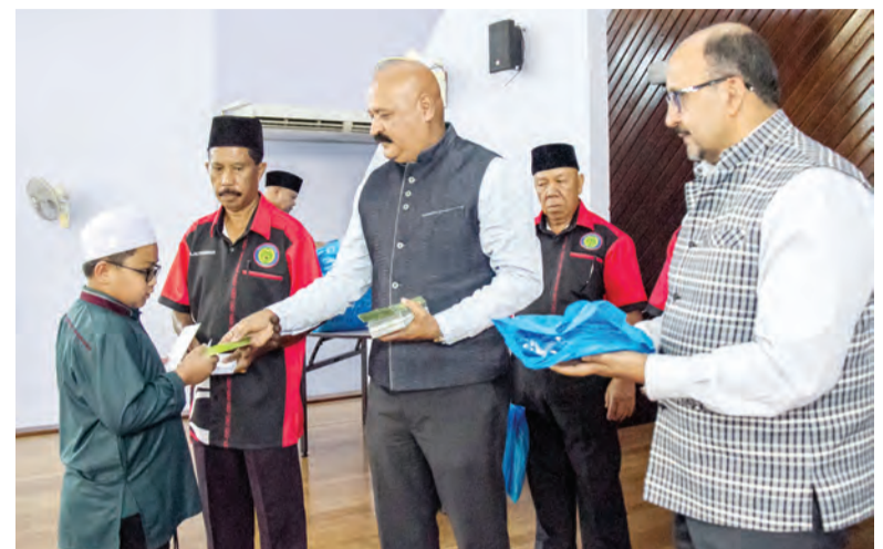
SUASANA Majlis Penyampaian Derma kepada Anak-Anak Yatim bagi Kampung Jerudong 'B'.

Acara dimulakan dengan bacaan Surah Al-Fatihah, diikuti dengan penyampaian derma kepada anak-anak yatim. Acara ini merupakan sebahagian daripada aktiviti kebajikan MPKJB tersebut sepanjang bulan Ramadan.