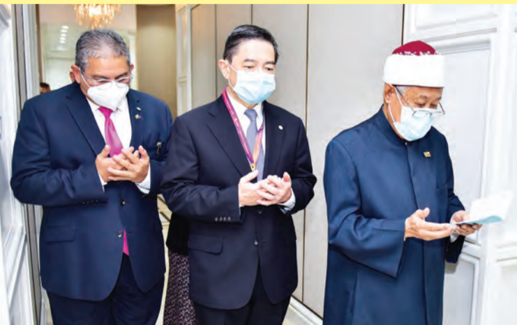
DOA Selamat dibacakan oleh Yang Berhormat Mufti Kerajaan.