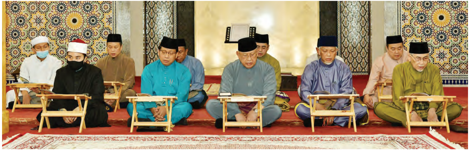
YANG Berhormat Menteri di Jabatan Perdana Menteri (depan, tengah) hadir selaku tetamu kehormat pada Majlis Khatam Al-Quran. Turut hadir, Yang Berhormat Ketua Hakim Syar'ie.