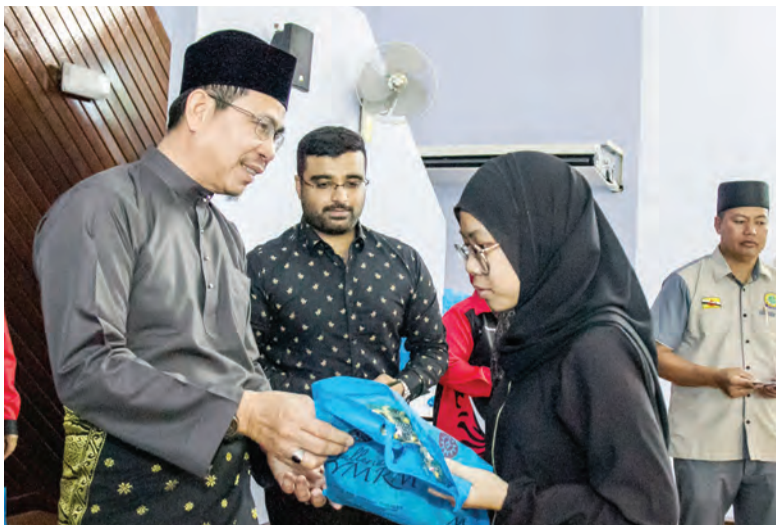
YANG Berhormat Ahli Majlis Mesyuarat Negara semasa menyampaikan derma kepada anak yatim.

Oleh : Rohani Haji Abdul Hamid