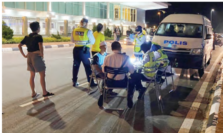
OPERASI Sepadu tersebut melibatkan seramai 94 pegawai dan anggota yang menumpukan kepada rondaan pencegahan dan juga sekatan jalan raya.