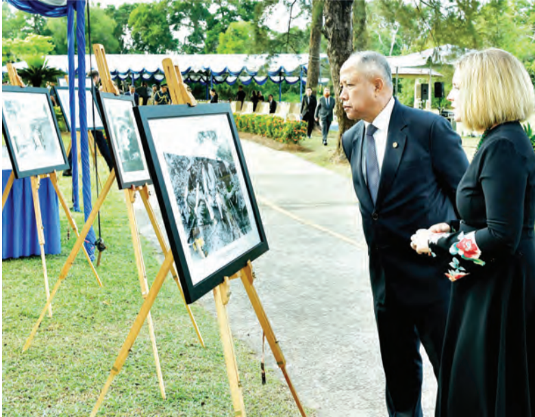
YANG Berhormat Menteri Pertahanan Kedua dan Puan Yang Terutama Pesuruhjaya Tinggi Australia ke Negara Brunei Darussalam (NBD) ketika menyaksikan gambar yang dipamerkan pada Hari ANZAC, iaitu hari peringatan bagi lelaki dan wanita Australia dan New Zealand yang berkhidmat di negara-negara mereka sebagai angkatan bersenjata.

untuk mendapatkan kembali Kepulauan Borneo dan menamatkan pendudukan Jepun di Brunei semasa Perang Dunia Kedua.