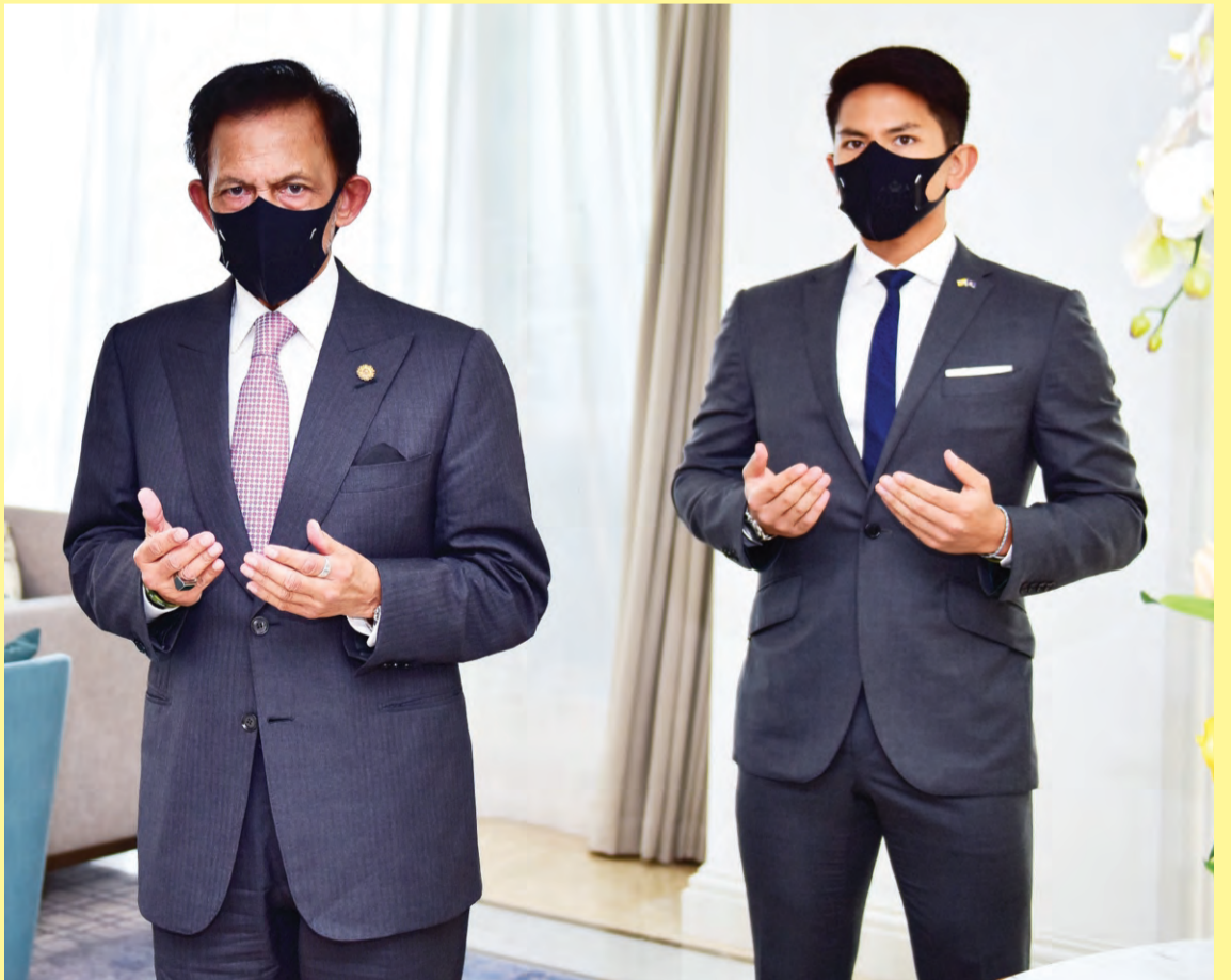
KEBAWAH Duli Yang Maha Mulia Paduka Seri Baginda Sultan Haji Hassanalk Bolkih Mu'izzaddin Waddaulah ibni Al-Marhum Sultan Haji Omar 'Ali Saifuddin Sa'adul Khairi Waddien, Sultan dan Yang Di-Pertuan Negara Brunei Darussalam berkenan berangkat balik meninggalkan Jakarta, Republik Indonesia setelah selesai mempengerusikan Mesyuarat Pemimpin-pemimpin ASEAN. Berangkat mengiringi Kebawah Duli Yang Maha Mulia Paduka Seri Baginda Sultan dan Yang Di-Pertuan Negara Brunei Darussalam ialah Duli Yang Teramat Mulia Paduka Seri Pengiran Muda 'Abdul Mateen.