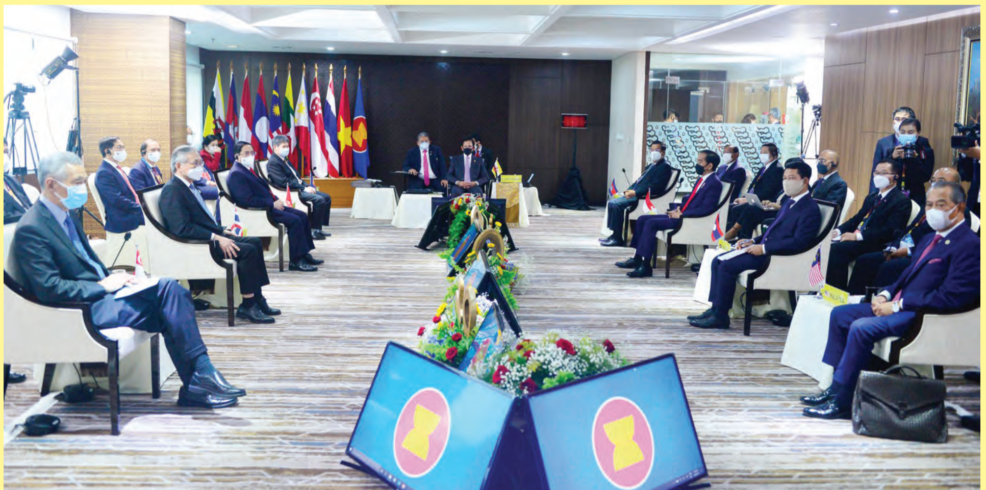
KEBAWAH Duli Yang Maha Mulia Paduka Seri Baginda Sultan dan Yang Di-Pertuan Negara Brunei Darussalam berkenan berangkat bagi mempengerusikan Mesyuarat Pemimpin-Pemimpin ASEAN yang berlangsung di Bali Room, Bangunan Sekretariat ASEAN, Jakarta, Republik Indonesia.

■ NEGERA-NEGERA anggota ASEAN sentiasa mengikuti perkembangan di Myanmar dan pada masa yang sama menghormati tujuan-tujuan dan prinsip-prinsip yang termaktub dalam Piagam ASEAN.