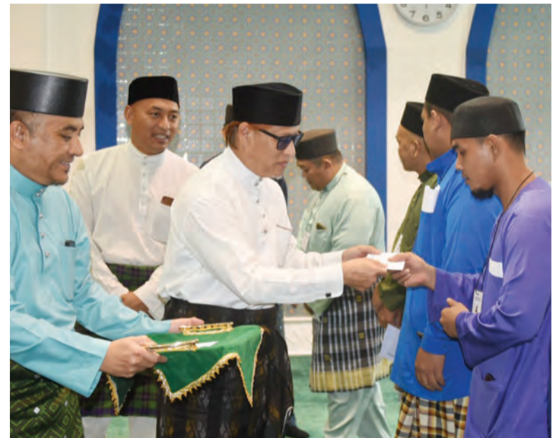
RA'ES Kolej Universiti Perguruan Ugama Seri Begawan semasa hadir pada Majlis Penyampaian Agihan Zakat Wang Tunai kepada Asnaf Fakir dan Miskin menjelang Hari Raya tahun ini (atas), manakala gambar bawah kiri, acara Tadarus Al-Quran Rombongan Pegawai dan Kakitangan Kementerian Hal Ehwal Ugama sempena Bulan Ramadan ke Masjid-masjid Tahun 1442H, berlangsung di masjid berkenaan.

Rombongan Tadarus Pegawai dan Kakitangan KHEU, seterusnya akan mengunjungi Masjid Yayasan Sultan Haji Hassanah Bolkiah (YSHHB), Kampung Bolkiah pada Isnin, 3 Mei 2021, jam 4.45 petang.