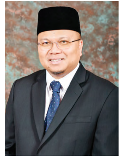
PERUTUSAN Yang Berhormat Menteri Kesihatan sempena Sambutan Minggu Imunisasi Sedunia 2021.

Kata Yang Berhormat, mereka yang ingin mengikuti Program Vaksinasi Kebangsaan COVID-19 boleh membuat tempahan perjanjian melalui aplikasi BruHealth atau menghubungi