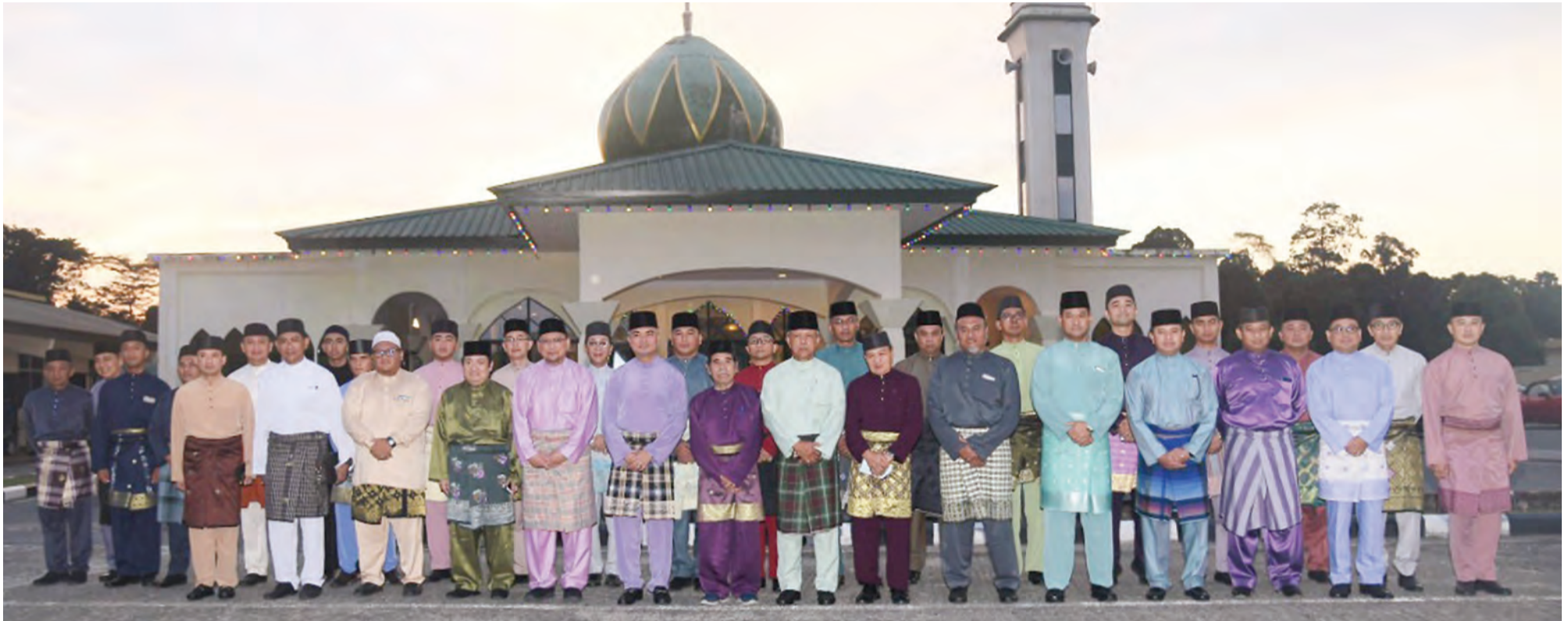
YANG Berhormat Menteri Pertahanan Kedua (depan, lapan dari kiri) pada sesi bergambar ramai di Program Ihya Ramadan dan Jangkauan Ramadan Kementerian Pertahanan dan Angkatan Bersenjata Diraja Brunei.