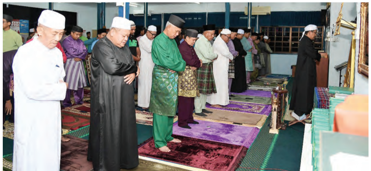
MAJLIS dimulakan dengan Sembahyang Fardu Isyak Berjemaah, diikuti dengan Sembahyang Sunat Tarawih dan Witir (atas), manakala gambar bawah, Yang Berhormat hadir pada jamuan malam.