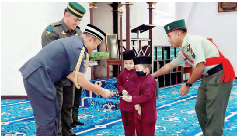
PEMERINTAH Angkatan Bersenjata Diraja Brunei (ABDB) menyampaikan sumbangan derma kepada anak yatim yang diraikan pada Majlis Sentuhan Kasih Ramadan ABDB.

Oleh : Rohani Haji Abdul Hamid