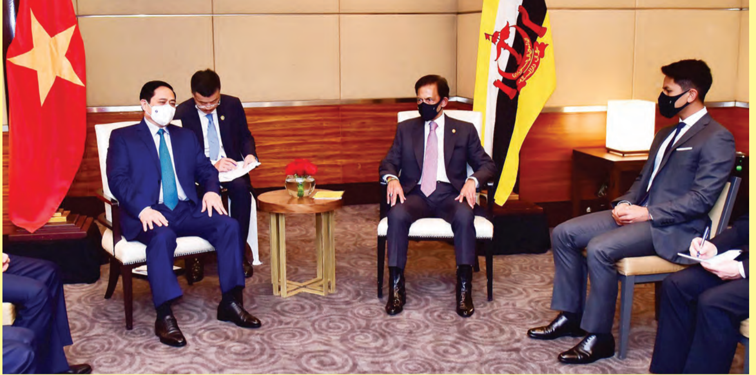
KEBAWAH Duli Yang Maha Mulia Paduka Seri Baginda Sultan Haji Hassanalk Bolkih Mu'izzaddin Waddaulah ibni Al-Marhum Sultan Haji Omar 'Ali Saifuddin Sa'adul Khairi Waddien, Sultan dan Yang Di-Pertuan Negara Brunei Darussalam berkenan menerima kunjungan hormat daripada Perdana Menteri Republik Sosialis Viet Nam, Tuan Yang Terutama Pham Minh Chinh yang berlangsung di Hotel Grand Hyatt, Jakarta.

Selain itu, TYT juga menyampaikan sokongan penuh Republik Sosialis Viet Nam