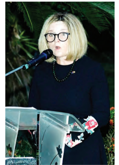
PYT semasa menyampaikan kata alu-aluannya.

Majlis peringatan itu juga menyaksikan bendera negara Australia dan New Zealand dikibarkan di kawasan tugu berkenaan bagi memperingati jasa-jasa tentera Australia dan New Zealand yang telah dan terus berjuang serta berkhidmat di seluruh dunia.