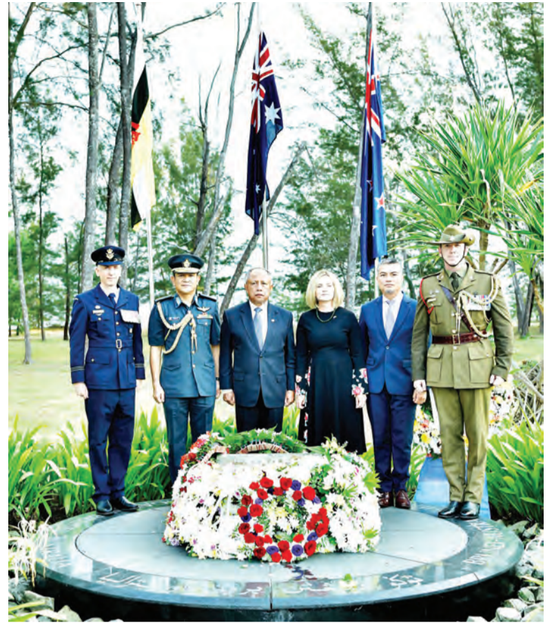
YANG Berhormat dan PYT Pesuruhjaya Tinggi Australia ke NBD pada sesi bergambar ramai di Tugu Peringatan Brunei-Australia, Pantai Muara sempena Hari ANZAC.

"Maka kita tidak punya pilihan selain memiliki keberanian untuk berdiri, melangkah maju, berbahagi beban keamanan bersama, kestabilan wilayah,