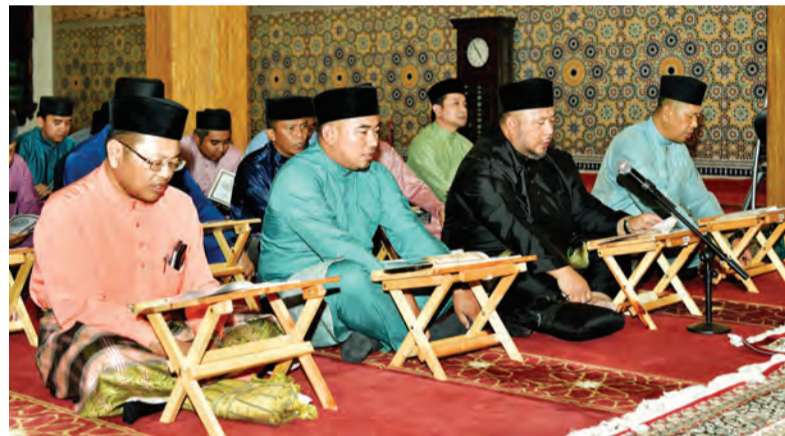
ANTARA yang hadir pada Majlis Khatam Al-Quran yang berlangsung di Masjid Ash-Shaliheen (kiri dan kanan).

sama-sama menghidupkan dan menyemarakkan lagi bulan Ramadan yang mulia ini dengan mengharapkan ganjaran pahala dan keberkatan yang dijanjikan oleh Allah Subhanahu Wata'ala dalam bulan yang penuh keberkatan ini.