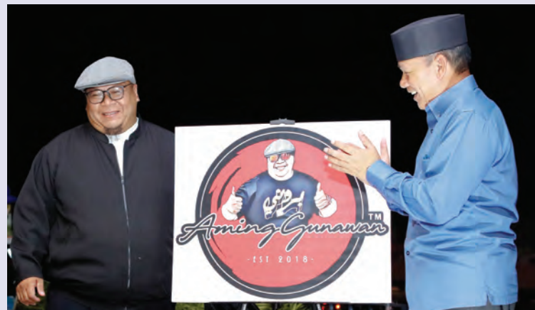
YANG Berhormat Menteri Kebudayaan, Belia dan Sukan semasa melancarkan 'Aming Gunawan Street Food Fest' bersempena dengan bulan 'Februari : Stay Strong Brunei' (atas). Sementara gambar bawah, suasana pada Aming Gunawan Street Food Fest tersebut.

BERIBI , Jumaat, 19 Februari. - AIZ Management dengan sokongan ATHA Sdn. Bhd. mengadakan 'Aming Gunawan Street Food Fest' bersempena dengan bulan 'Februari : Stay Strong Brunei'.