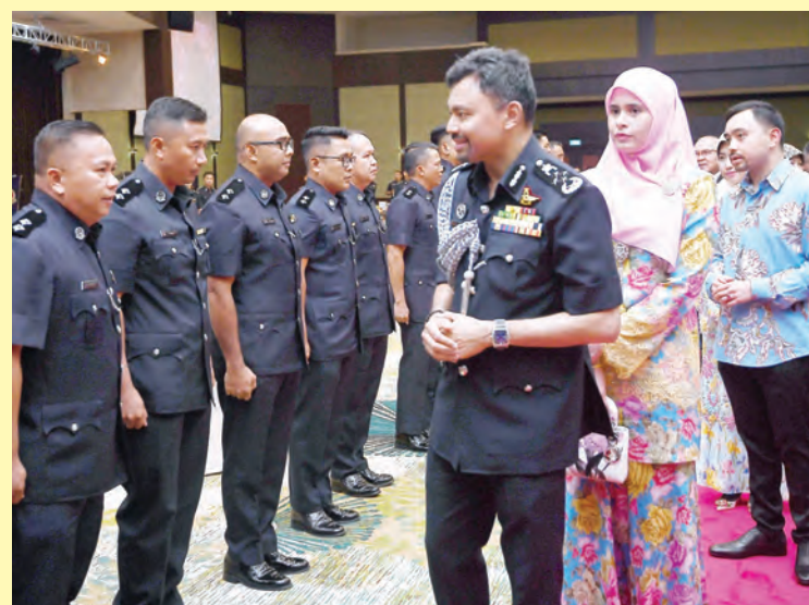
DULI Yang Teramat Mulia Paduka Seri Pengiran Muda Mahkota berkenan menandatangani Lembaran Kenangan Keberangkatan dan disembahkan dengan para Pegawai Peralihan Inspektor Skuad 1 dan 2 yang dinaikkan pangkat daripada anggota pangkat rendah juga Pegawai-pegawai Inspektor Percubaan (kiri sekali dan kiri).