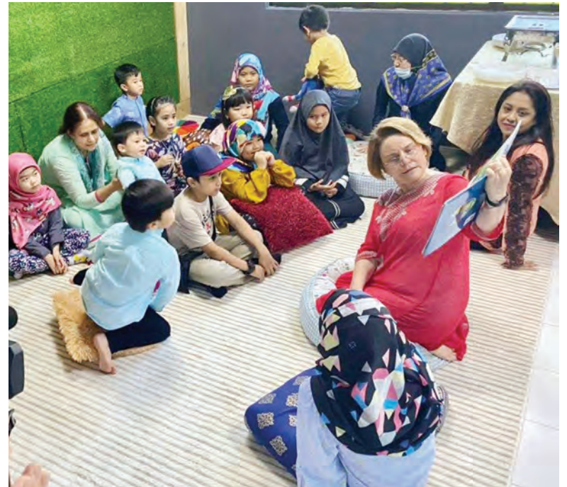
PUAN Yang Terutama Pesuruhjaya Tinggi Kanada ke Negara Brunei Darussalam semasa sesi membaca buku bagi pelajar-pelajar sekolah rendah di negara ini.

Beliau juga berharap agar Persatuan ReLA akan terus menjadi platform berkesan untuk kolaborasi berterusan bersama pelbagai agensi tempatan dan