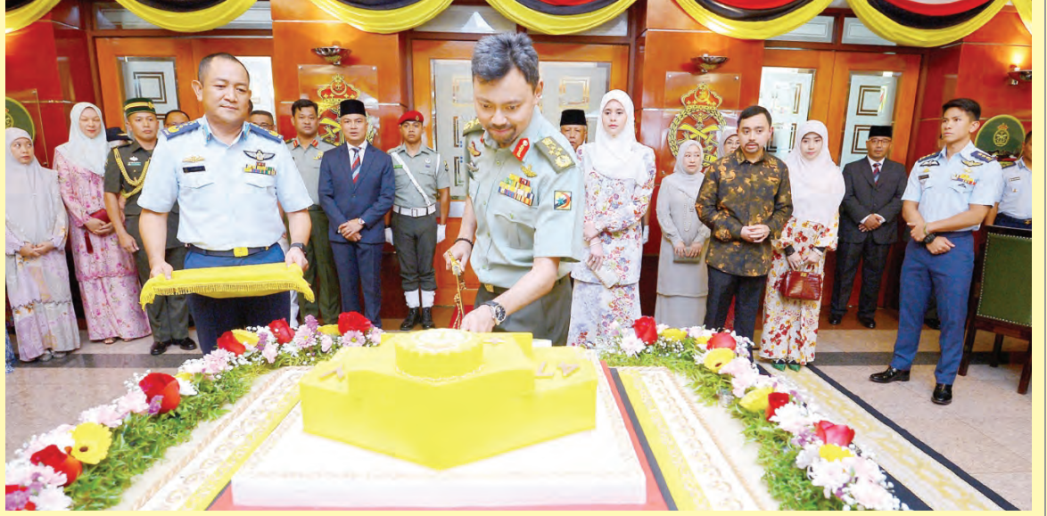
DULI Yang Teramat Mulia Paduka Seri Pengiran Muda Mahkota Pengiran Muda Haji Al-Muhtadee Billah ibni Kebawah Duli Yang Maha Mulia Paduka Seri Baginda Sultan Haji Hassanal Bolkiah Mu'izzaddin Waddaulah, Menteri Kanan di Jabatan Perdana Menteri (JPM) berkenan disembahkan kepada para Pegawai Angkatan Bersenjata Diraja Brunei (ABDB) dan memotong kek Hari Puja Usia Duli Yang Teramat Mulia Paduka Seri Pengiran Muda Mahkota Ke-47 Tahun pada Majlis Santap Petang sempena Sambutan Hari Puja Usia Duli Yang Teramat Mulia Paduka Seri Pengiran Muda Mahkota Ke-47 Tahun anjuran Kementerian Pertahanan dan ABDB (atas kiri dan atas).

BOLKIAH GARISON , Rabu, 17 Februari. - Duli Yang Teramat Mulia Paduka Seri Pengiran Muda Mahkota Pengiran Muda Haji Al-Muhtadee Billah ibni Kebawah Duli Yang Maha Mulia Paduka Seri Baginda Sultan Haji Hassanal Bolkiah Mu'izzaddin Waddaulah, Menteri Kanan di Jabatan Perdana Menteri dan Yang Teramat Mulia Paduka Seri Pengiran Anak Isteri Pengiran Anak Sarah binti Pengiran Haji Salleh Ab. Rahaman berkenan