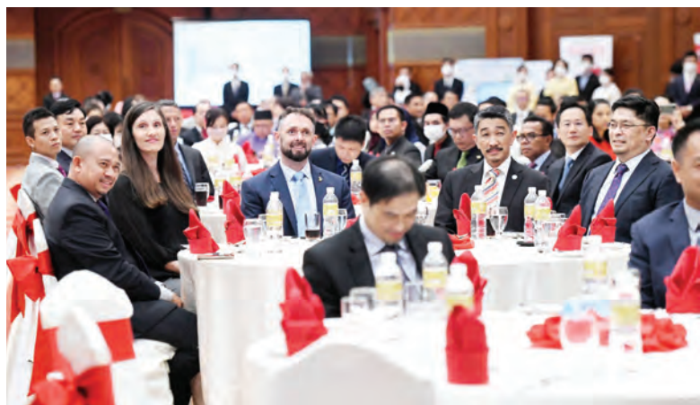
SEBAHAGIAN daripada jemputan yang hadir pada Majlis Resepsi sempena Sambutan Ulang Tahun Hari Keputeraan Maharaja Jepun Ke-61.

BANDAR SERI BEGAWAN, Rabu, 17 Februari. - Jepun akan terus menyokong usaha Negara Brunei Darussalam (NBD) dalam mempelbagaikan ekonomi dan memupuk green society melalui kerjasama dalam sektor tenaga hijau, seperti Projek Demonstrasi persatuan syarikat Jepun, AHEAD, bagi penghasilan hidrogen dan kerjasama dengan Mitsubishi Corporation dalam sumber tenaga solar.