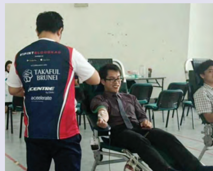
PESERTA yang menderma darah pada Kempen Derma Darah yang dianjurkan oleh School of Science and Engineering, Politeknik Brunei, Lumut.

Aktiviti tersebut juga merupakan acara tahunan sekolah berkenaan dengan kerjasama Unit Pendermaan Darah, Hospital Raja Isteri Pengiran Anak Saleha (RIPAS), Kementerian Kesihatan.