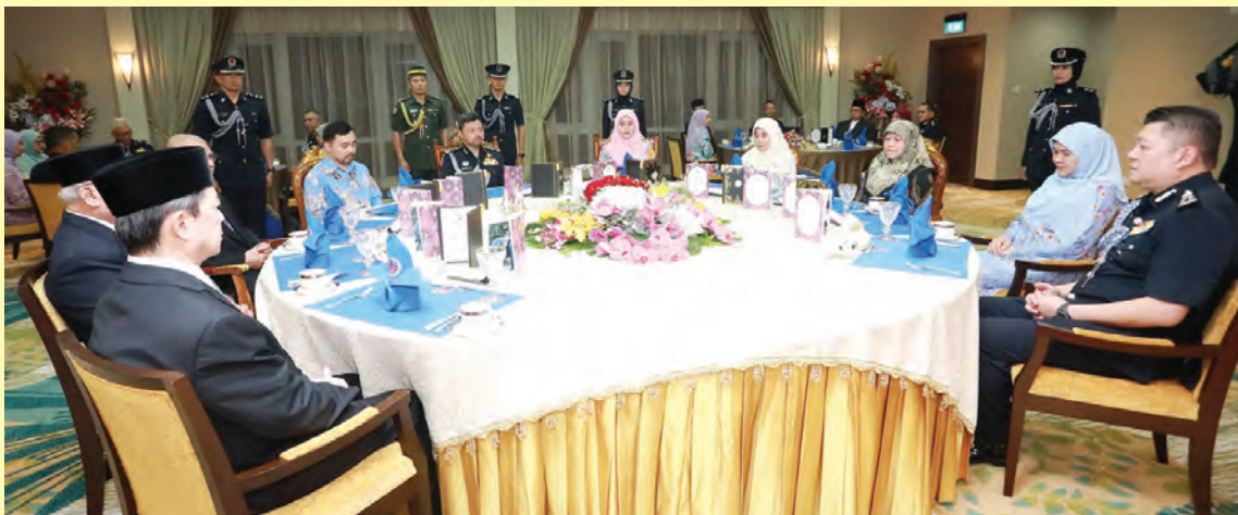
DULI Yang Teramat Mulia Paduka Seri Pengiran Muda Mahkota Pengiran Muda Haji Al-Muhtadee Billah dan Yang Teramat Mulia Paduka Seri Pengiran Anak Isteri Pengiran Anak Sarah bersama paduka-paduka adinda DYTMM berkenan berangkat ke Majlis Santap Petang sempena Hari Puja Usia Duli Yang Teramat Mulia Ke-47 Tahun (atas).