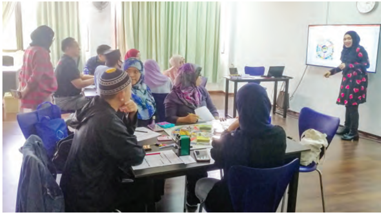
'RUT to Riches' merupakan permainan board game, yang bertindak sebagai simulasi bagi seseorang untuk mengendalikan kewangan peribadi mereka dan belajar menstabilkan ekonomi masing-masing (atas dan kanan).

Oleh : Haniza Abdul Latif