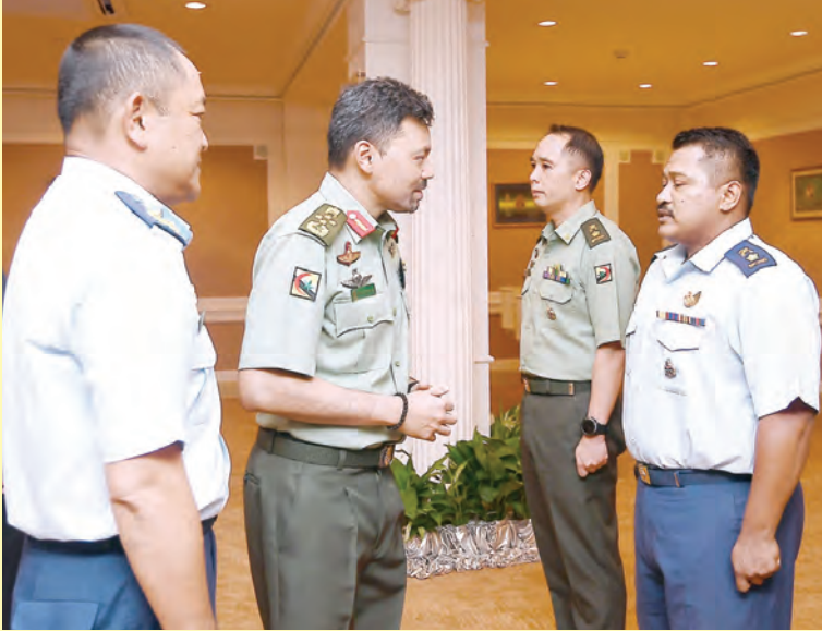
Oleh : Hajah Siti Zuraiyah Haji Awang Sulaiman