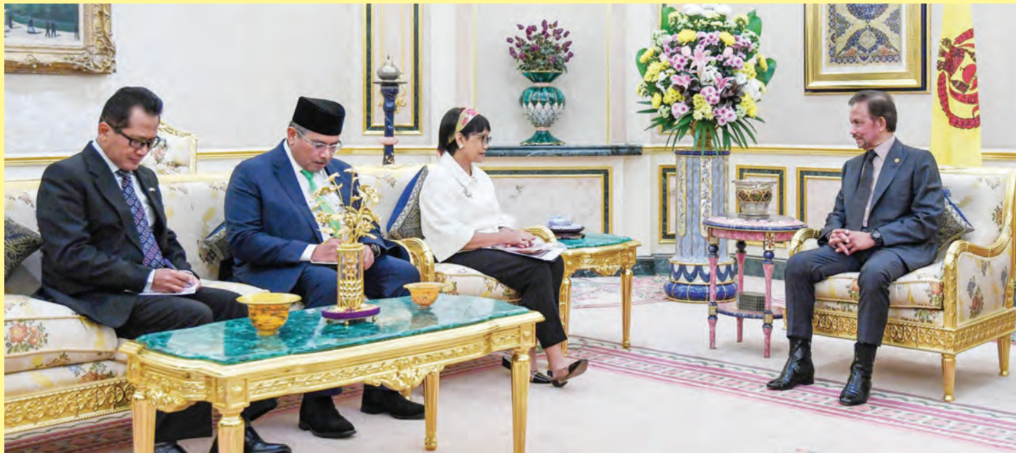
KEBAWAH Duli Yang Maha Mulia Paduka Seri Baginda Sultan Haji Hassanal Bolkiah Mu'izzaddin Waddaulah ibni Al-Marhum Sultan Haji Omar 'Ali Saifuddien Sa'adul Khairi Waddien, Sultan dan Yang Di-Pertuan Negara Brunei Darussalam berkenan menerima mengadap Menteri Luar Negeri Republik Indonesia, Puan Yang Terutama Retno L.P. Marsudi, di Istana Nurul Iman.