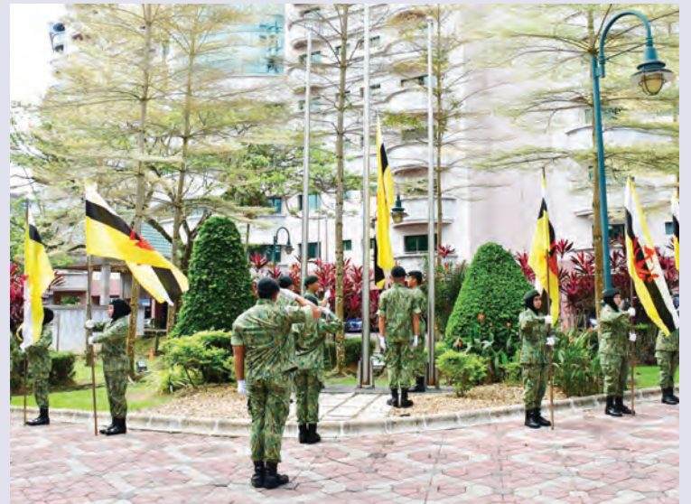
UPACARA Menaikkan Bendera Negara yang diadakan di hadapan Bangunan Kampus Utama PB, Jalan Ong Sum Ping.

Upacara tersebut seterusnya dimeriahkan lagi dengan nyanyian Lagu Patriotik 'Berkibarlah Bendera', yang