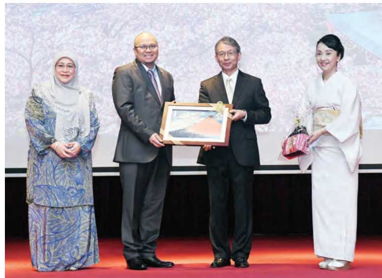
YANG Berhormat Menteri Kesihatan menerima cenderahati daripada Tuan Yang Terutama Duta Besar Istimewa dan Mutlak Jepun ke Negara Brunei Darussalam pada majlis berkenaan.

Hadir mewakili Kerajaan Kebawah Duli Yang Maha