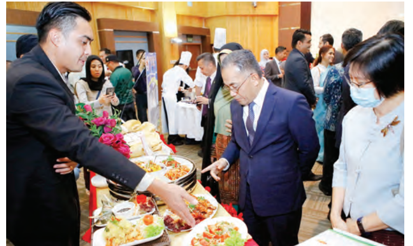
YANG Berhormat semasa meninjau makanan yang disajikan semasa Minggu Gastronomi Brunei 2021 Ke-5.

Maklumat lanjut mengenai Minggu Gastronomi Brunei 2021 boleh didapati di laman sesawang bruneitourism.com/bgw2021 .