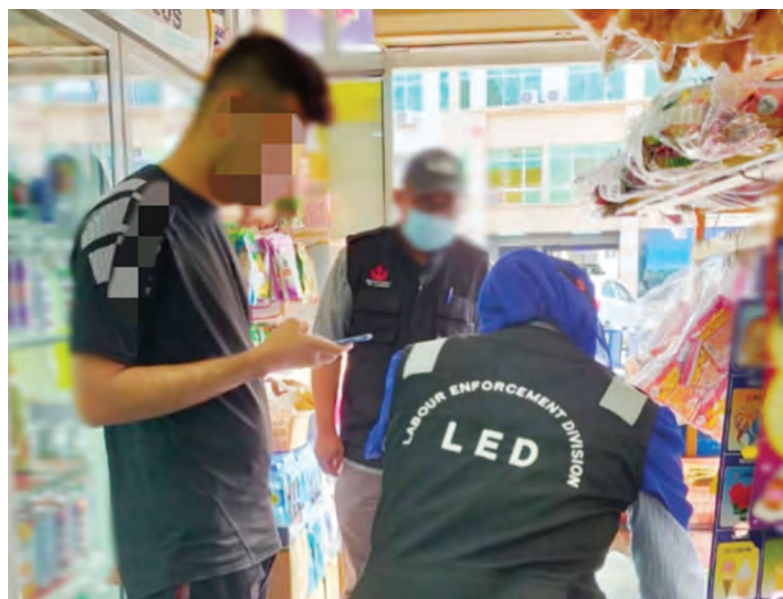
HASIL daripada Operasi Selongkar yang dijalankan, didapati pekerja asing menyalahgunakan jawatan yang tercatat dalam Lesen Pekerja Asing mereka.