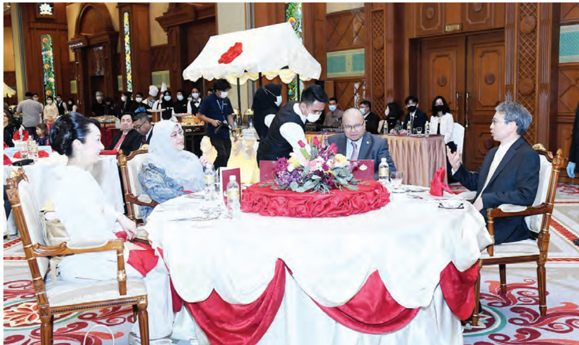
YANG Berhormat Menteri Kesihatan (dua, kanan) mewakili Kerajaan Kebawah Duli Yang Maha Mulia Paduka Seri Baginda Sultan dan Yang Di-Pertuan Negara Brunei Darussalam dan Datin pada Majlis Resepsi sempena Memperingati Sambutan Ulang Tahun Hari Keputeraan Maharaja Jepun Ke-61.

BANDAR SERI BEGAWAN, Rabu, 17 Februari. - Jepun akan terus menyokong usaha Negara Brunei Darussalam (NBD) dalam mempelbagaikan ekonomi dan memupuk green society melalui kerjasama dalam sektor tenaga hijau, seperti Projek Demonstrasi persatuan syarikat Jepun, AHEAD, bagi penghasilan hidrogen dan kerjasama dengan Mitsubishi Corporation dalam sumber tenaga solar.