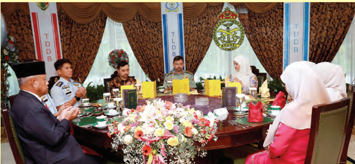
DULI Yang Teramat Mulia Paduka Seri Pengiran Muda Mahkota Pengiran Muda Haji Al-Muhtadee Billah, Menteri Kanan di JPM dan Yang Teramat Mulia Paduka Seri Pengiran Anak Isteri Pengiran Anak Sarah binti Pengiran Haji Salleh Ab. Rahaman bersama paduka-paduka adinda DYTM menadah tengah semasa Doa Kesyukuran dibacakan pada Majlis Santap Petang berkenaan.