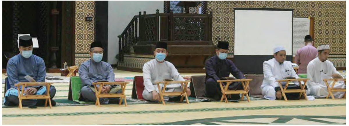
SETIAUSAHA Tetap (Pengajian Tinggi), Kementerian Pendidikan (tiga, kiri) pada Majlis Doa Kesyukuran dan Membaca Surah Yaa Siin sempena Ulang Tahun Hari Puja Usia Yang Ke-47 Duli Yang Teramat Mulia Paduka Seri Pengiran Muda Mahkota Pengiran Muda (Dr.) Haji Al-Muhtadee Billah ibni Kebawah Duli Yang Maha Mulia Paduka Seri Baginda Sultan Haji Hassanal Bolkiah Mu'izzaddin Waddaulah, Menteri Kanan di Jabatan Perdana Menteri selaku Pro Canselor UBD, Pro Canselor UNISSA, Pro Canselor UTB.

Majlis didahului dengan Sembahyang Fardu Maghrib