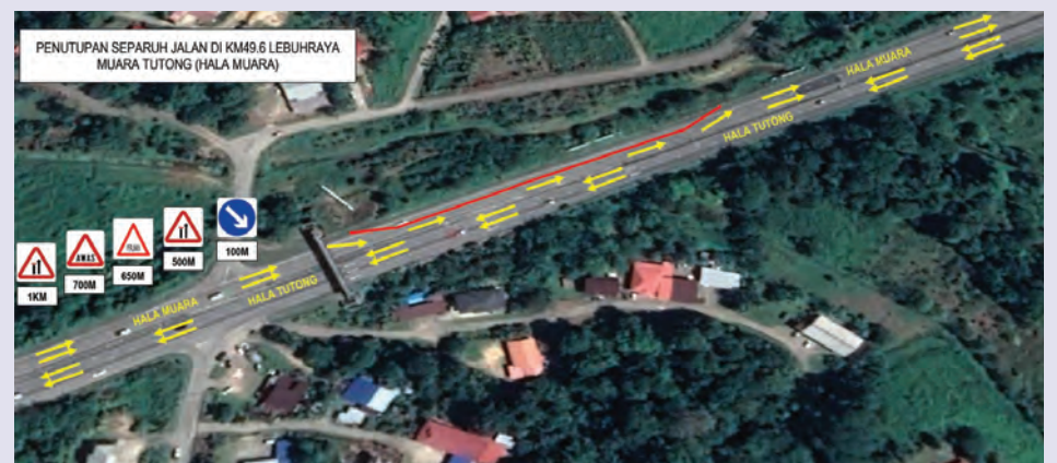
PENUTUPAN sementara separuh jalan, di Lebuhraya Muara - Tutong, KM 49.6 (hala Muara), kawasan Bukit Panggal.

Siaran Akhbar dan Foto : Jabatan Kerja Raya