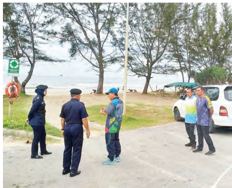
UNIT Pengawasan Kejiranan (UPK) Balai Polis Muara bersama Ahli PK semasa melakukan rondaan pencegahan jenayah di Pantai Meragang.

Sepanjang kesemua rondaan tersebut tidak ada menemukan sebarang kegiatan jenayah dan aktiviti yang melanggar perundangan negara ini. PPDB berharap dengan usaha program ini akan memberikan kesedaran kepada orang awam akan betapa pentingnya gandingan bersama masyarakat dalam memantapkan lagi semangat kejiranan dan bersama membanteras dan mencegah jenayah.