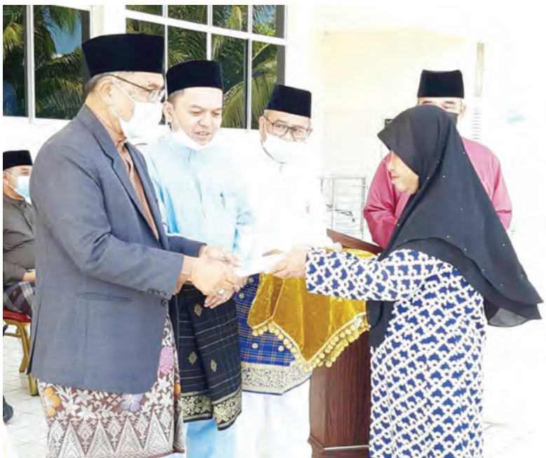
YANG Berhormat Ahli Majlis Mesyuarat Negara (kiri) semasa menyampaikan sumbangan kepada penerima pada Majlis Pelancaran Projek Infaq Lillah.

Berita dan Foto : Dk. Vivy Malessa Pg. Ibrahim