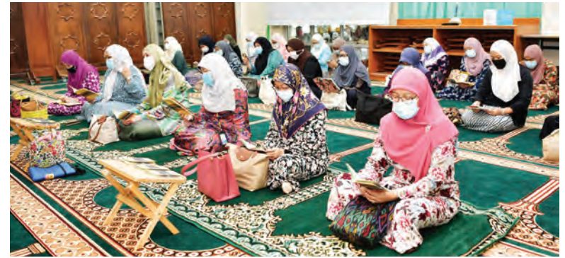
ANTARA yang hadir pada Majlis Doa Kesyukuran sempena Hari Puja Usia Duli Yang Teramat Mulia Paduka Seri Pengiran Muda Mahkota Pengiran Muda Haji Al-Muhtadee Billah ibni Kebawah Duli Yang Maha Mulia Paduka Seri Baginda Sultan Haji Hassanal Bolkiah Mu'izzaddin Waddaulah, Menteri Kanan di Jabatan Perdana Menteri selaku Pengerusi Lembaga Pengarah AMBD Ke-47.