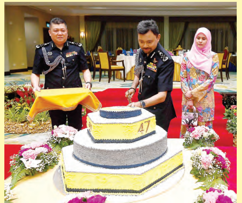
DULI Yang Teramat Mulia Paduka Seri Pengiran Muda Mahkota berkenan memotong kek Hari Puja Usia pada majlis tersebut (atas).