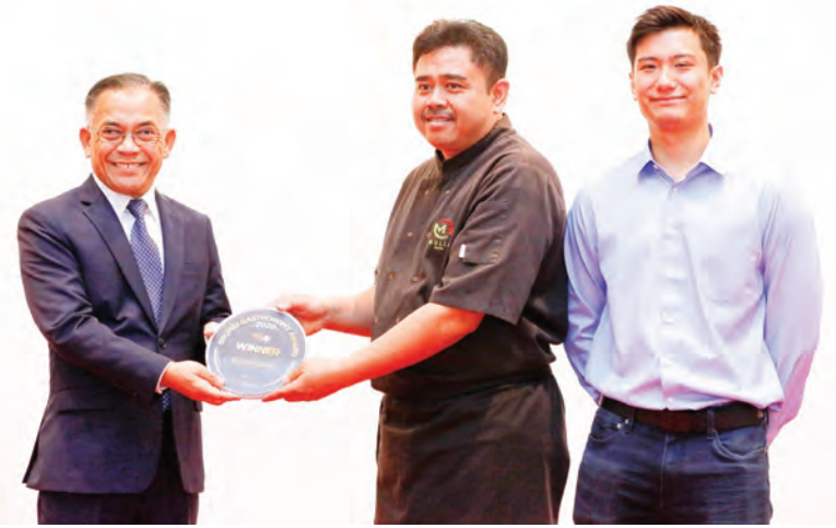
YANG Berhormat Menteri Sumber-Sumber Utama dan Pelancongan menyampaikan hadiah kepada Mulia Hotel yang berjaya memenangi Anugerah bagi 'Best Starter' dengan hidangan 'Grilled Prawn bersama Coconut Kerabu'.

BANDAR SERI BEGAWAN, Rabu, 17 Februari. - Semua penyedia perkhidmatan pelancongan digalakkan untuk melihat bukan hanya sekadar menyediakan lawatan pakej biasa tetapi melihat lebih banyak inisiatif, komuniti atau ekopelancongan berdasarkan pengalaman serta lawatan yang berkesinambungan untuk menjadikan penawaran pelancongan lebih menarik bagi pengunjung domestik dan antarabangsa.