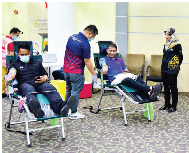
ANTARA yang hadir menderma darah.