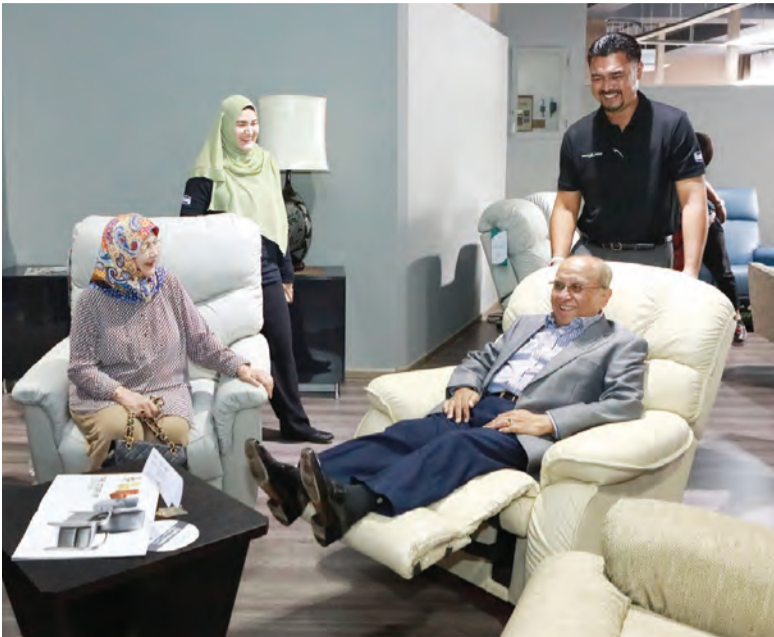
YANG Di-Pertua MMN bersama Datin semasa meninjau barang yang dijual di kedai tersebut.

Oleh : Khartini Hamir