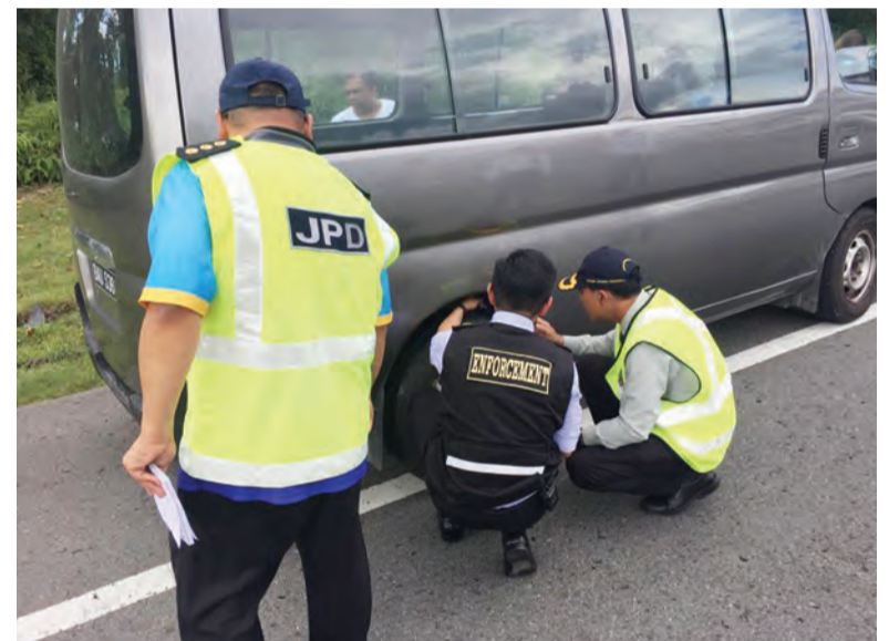
JABATAN Pengangkutan Darat (JPD) dan Pasukan Polis Diraja Brunei (PPDB) meneruskan operasi penguatkuasaan peraturan dan undang-undang jalan raya bagi membanteras kenderaan-kenderaan jenis 'Kijang' yang mencurigakan.

lagi ingin mengingatkan kepada orang ramai, khususnya pemilik-pemilik kenderaan untuk meningkatkan kewaspadaan mengenai tahap keselamatan kenderaan mereka dan bagi pengguna jalan raya umumnya, untuk sentiasa mematuhi peraturan juga undang-undang lalu lintas jalan raya dan meningkatkan kewaspadaan kepada semua pengguna jalan raya bagi memastikan tahap keselamatan jalan raya adalah terjamin, di samping memandu dengan berhemah dan cermat supaya biskita sampai ke destinasi dengan selamat.