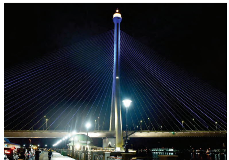
SMARTER Brunei meraikan sambutan tersebut dengan menyalakan lampu berwarna biru di Jambatan Raja Isteri Pengiran Anak Hajah Saleha, Jalan Residency.