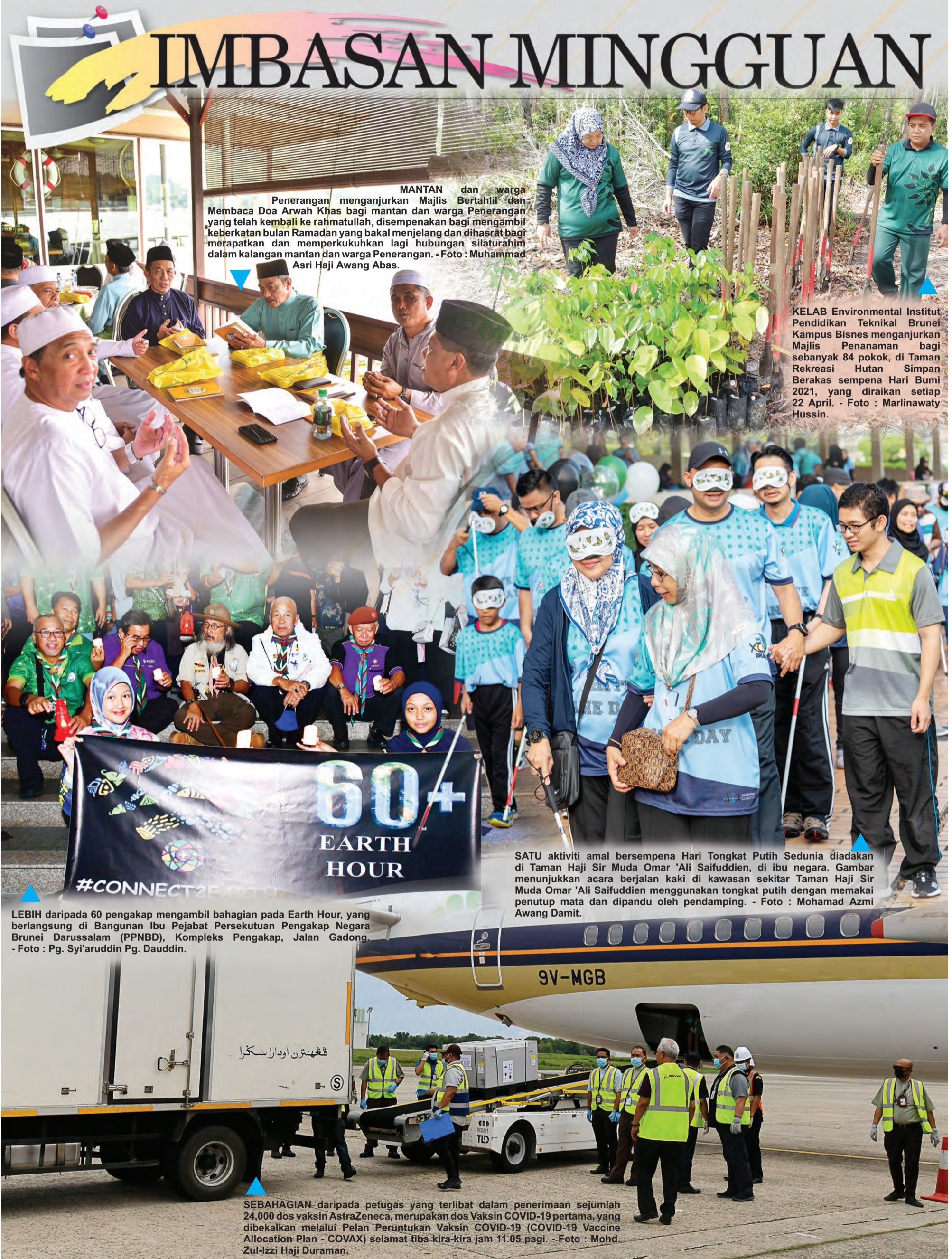
MANTAN dan warga Penerangan menganjurkan Majlis Bertahlil' dan Membaca Doa Arwah Khas bagi mantan dan warga Penerangan yang telah kembali ke rahmatullah, disempenakan bagi mengambil keberkatan bulan Ramadan yang bakal menjelang dan dihasrat bagi merapatkan dan memperkukuhkan lagi hubungan silaturahim dalam kalangan mantan dan warga Penerangan.