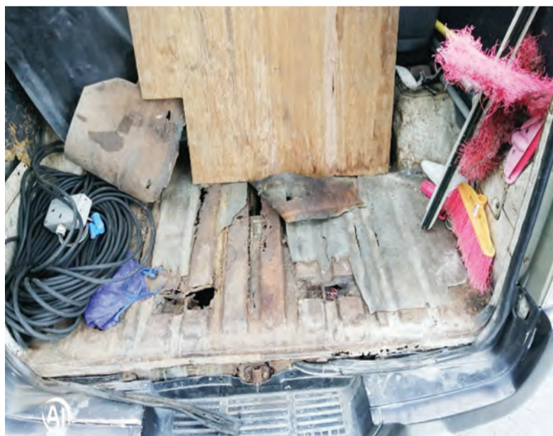
SALAH sebuah kenderaan Kijang yang diubah suai di dalamnya.

Untuk mengambil tindakan, orang ramai bolehlah memberikan keterangan lengkap, seperti tempat, waktu, jenis atau nombor pendaftaran dan jenis kesalahan dengan menghubungi Talian Darussalam 123 atau melalui Aplikasi WhatsApp Talian Darussalam +673 8333123 atau melayari laman Sesawang Talian Darussalam www.123.gov.bn dengan menyertakan gambar mengenai kenderaan terbabit.