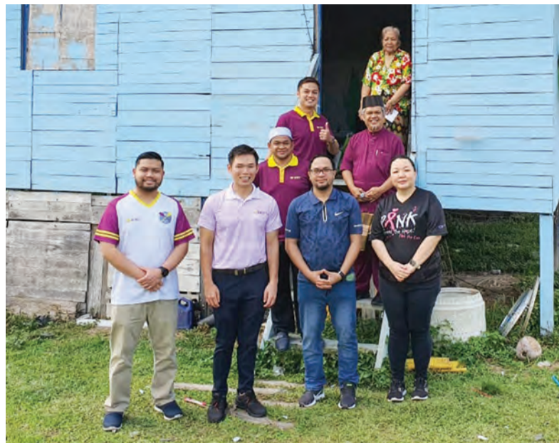
KAKITANGAN bank berkenaan berganding bahu untuk memberikan keriang kepada keluarga yang dilawati dengan menyampaikan sumbangan.

BIBD percaya bahawa menyokong semua orang dan mempromosikan kemasukan ke seluruh perniagaan dan