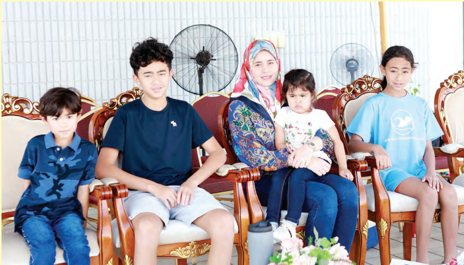
YANG Teramat Mulia Paduka Seri Pengiran Anak Isteri Pengiran Anak Sarah binti Pengiran Haji Salleh Ab. Rahaman bersama anakanda-anakanda berkenan berangkat menyaksikan Kejuhanan Renang Kumpulan Umur Brunei Ke-28.