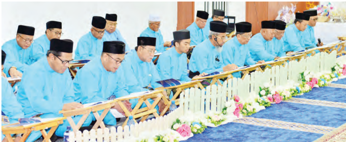
ANTARA peserta khatam ketika bacaan Surah-surah Khatam beramai-ramai bermula dari Surah Adh-Dhuha hingga Surah Al-Masad.

Untuk maklumat lanjut dan perkembangan terkini, orang ramai boleh melayari Laman Sesawang Kementerian Kesihatan, iaitu www.moh.gov.bn atau menghubungi Talian Nasihat Kesihatan 148 atau melalui aplikasi BruHealth.