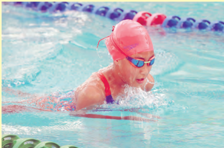
BERANGKAT menyertai kejohanan tersebut, anakanda Duli Yang Teramat Mulia Paduka Seri Pengiran Muda Mahkota Pengiran Muda Haji Al-Muhtadee Billah, Yang Teramat Mulia Pengiran Anak Muneerah Madhul Bolkiah (atas). Manakala gambar kanan, sebahagian yang hadir menyaksikan kejohanan tersebut.

BERAKAS , Sabtu, 3 April. - Yang Teramat Mulia Paduka Seri Pengiran Anak Isteri Pengiran Anak Sarah binti Pengiran Haji Salleh Ab. Rahaman berkenan berangkat menyaksikan Kejuhanan Renang Kumpulan Umur Brunei Ke-28 (28th Brunei Age Group Swimming Championships) pada hari