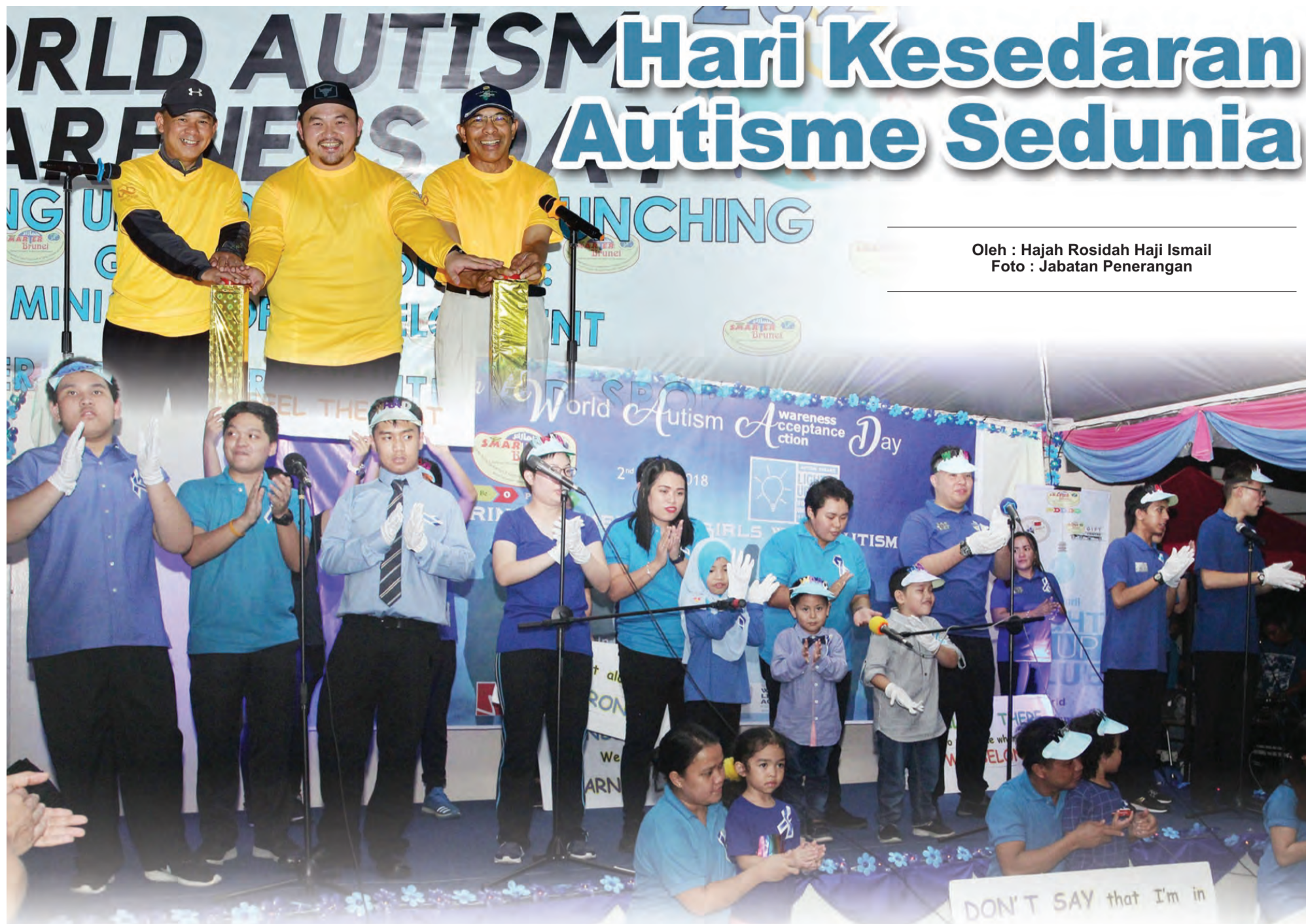
Oleh : Hajah Rosidah Haji Ismail

H ARI Kesedaran Autisme Sedunia merupakan hari yang diiktiraf antarabangsa pada 2 April setiap tahun, menggalakkan Negara Anggota Pertubuhan Bangsa-Bangsa Bersatu mengambil langkah-langkah meningkatkan kesedaran tentang orang dengan Gangguan Spektrum Autisme (ASD) di seluruh dunia. Hari Kesedaran Autisme Sedunia atau World Autism Awareness Day (WAAD) yang disambut setiap 2 April setiap tahun bagi memupuk kesedaran dalam kalangan masyarakat agar lebih peka terhadap keadaan pesakit autisme.