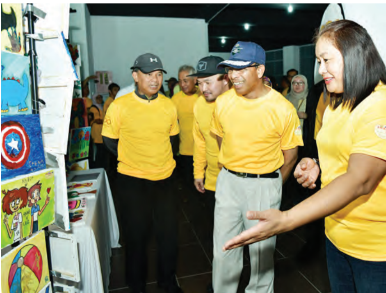
YANG Berhormat Menteri Pembangunan dan Yang Berhormat Menteri Kebudayaan, Belia dan Sukan semasa menyaksikan pameran.

Setiausaha Tetap di Kementerian Pembangunan dan Kementerian Kebudayaan Belia dan Sukan.