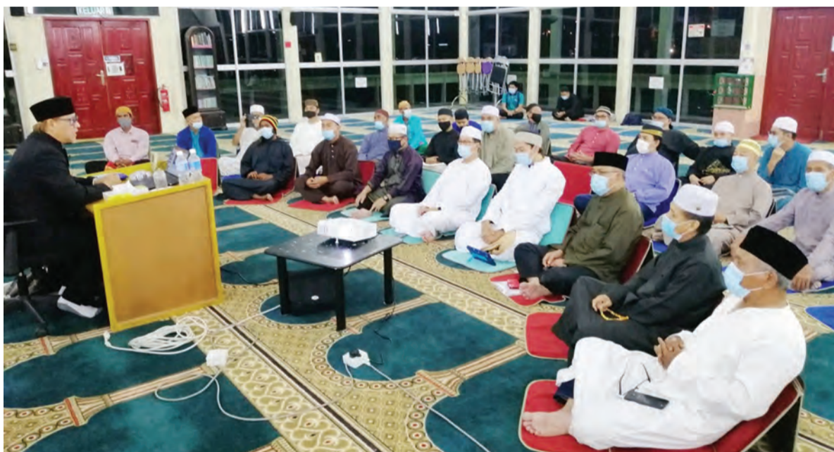
YANG Berhormat Ahli Majlis Mesyuarat Negara semasa hadir mendengarkan ceramah yang disampaikan oleh Ra'es Kolej Universiti Perguruan Ugama Seri Begawan.

Berita dan Foto : Wan Mohamad Sahran Wan Ahmadi