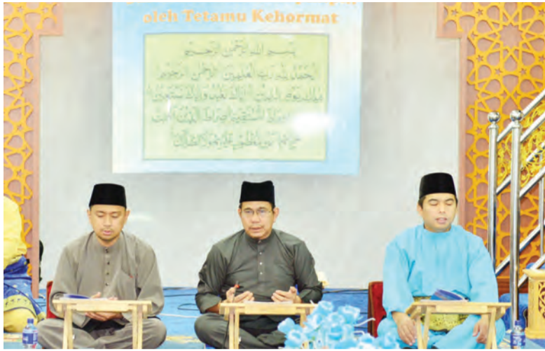
YANG Berhormat Ahli Majlis Mesyuarat Negara (tengah) hadir selaku tetamu kehormat pada Majlis Khatam Al-Quran bagi meraikan 40 peserta Kelas Al-Quran Lelaki Dewasa dan Muslimah yang berjaya menamatkan pembacaan 30 Juzuk Al-Quran.

BANDAR SERI BEGAWAN, Ahad, 4 April. - Ahli Jawatankuasa Takmir Masjid Kampung Masin menganjurkan Majlis Khatam Al-Quran bagi meraikan 40 peserta Kelas Al-Quran Lelaki Dewasa dan Muslimah yang berjaya menamatkan pembacaan 30 Juzuk Al-Quran mereka, hari ini, di sini.