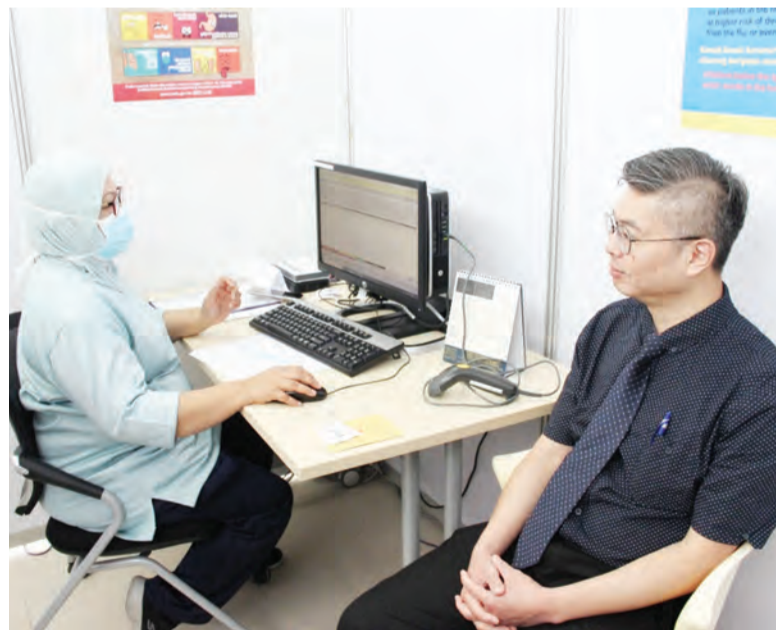
ANTARA petugas barisan hadapan yang menerima suntikan Vaksin COVID-19 tersebut (kiri dan kanan).

Berita dan Foto : Noraisah Haji Muhammed