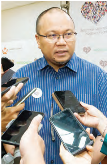
YANG Berhormat Menteri Kesihatan semasa ditemu bual.