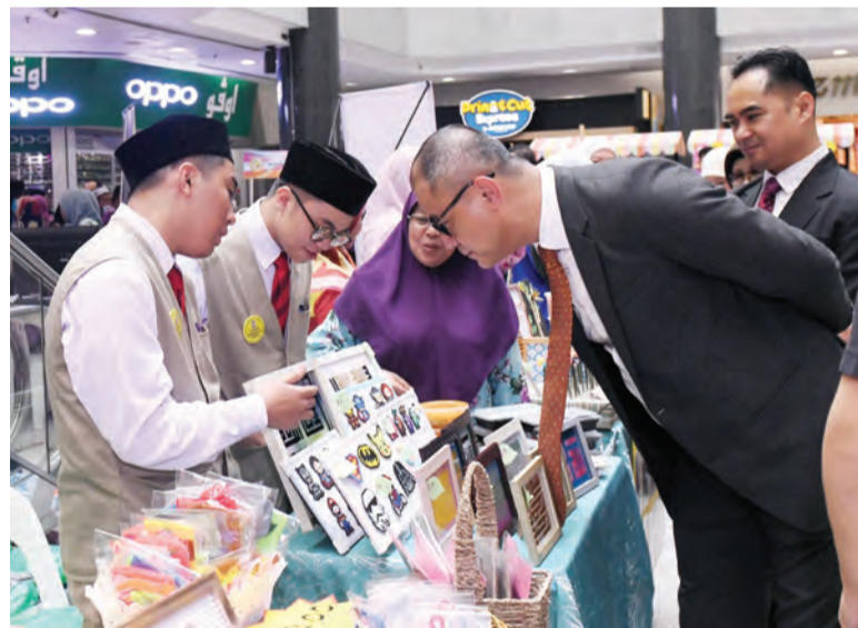
ANTARA hasil tangan pelajar Pra-Vokasional yang dipamerkan pada majlis tersebut.

Majlis juga menjemput pihak JobCentre Brunei (JCB) untuk membantu para lepasan pelajar Program Pra-Vokasional mendaftar sebagai pencari kerja.