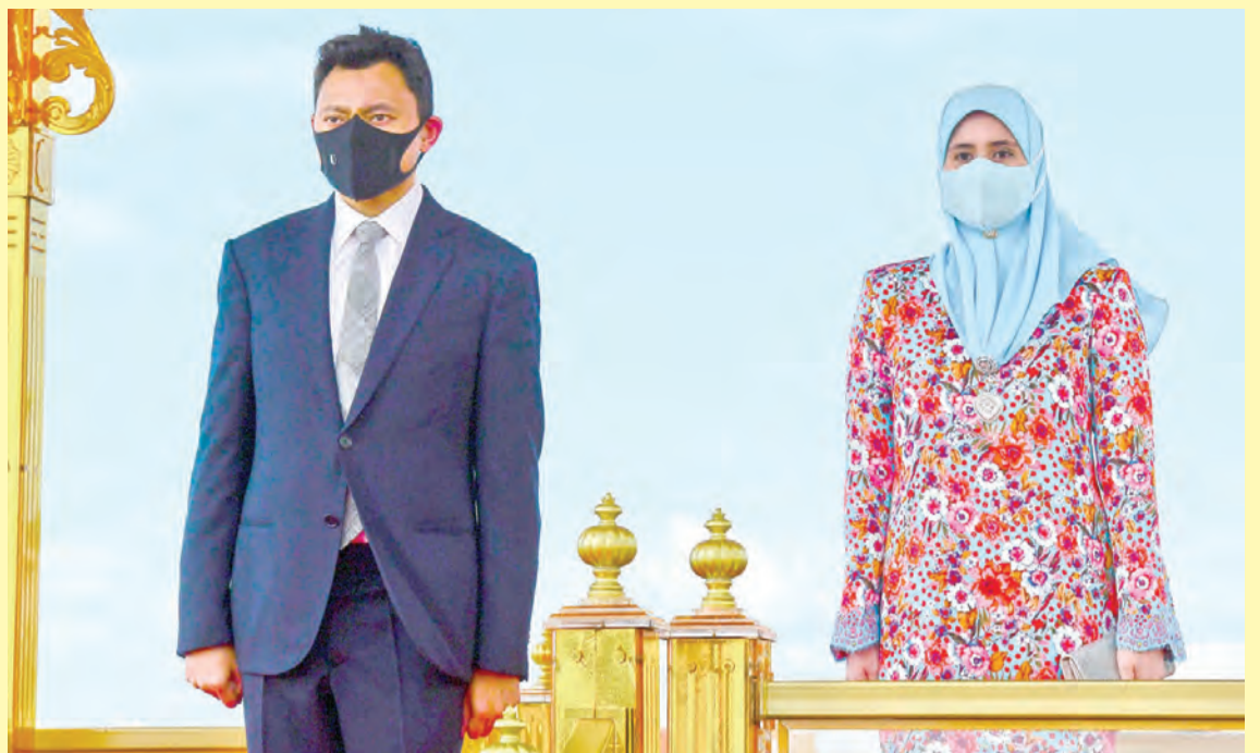
DULI Yang Teramat Mulia Paduka Seri Pengiran Muda Mahkota Pengiran Muda Haji Al-Muhtadee Billah, Menteri Kanan di JPM selaku Wakil Peribadi Kebawah Duli Yang Maha Mulia Paduka Seri Baginda Sultan dan Yang Di-Pertuan Negara Brunei Darussalam dan Yang Teramat Mulia Paduka Seri Pengiran Anak Isteri Pengiran Anak Sarah berkenan berangkat ke LTAB bagi mengalu-alukan ketibaan Yang Amat Berhormat Perdana Menteri Malaysia dan isteri serta rombongan (atas dan kiri).

Yang Amat Berhormat kemudiannya beredar memeriksa Perbarisan Kehormatan yang terdiri daripada anggota Tentera Darat Diraja Brunei, Angkatan Bersenjata Diraja Brunei (ABDB).