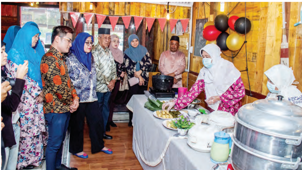
TIMBALAN Setiausaha Tetap (Kemasyarakatan) KKBS semasa menyaksikan demonstrasi cara memasak.