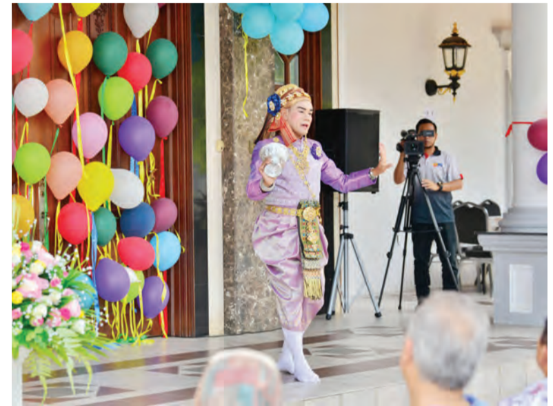
SUASANA Festival Songkran yang mengambil tempat di kediaman Kedutaan Besar Thailand (kiri dan kanan).