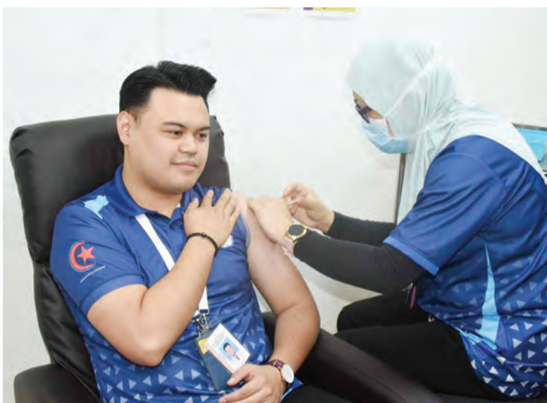
SUNTIKAN Vaksin COVID-19 yang diadakan di Hospital Pengiran Muda Mahkota Pengiran Muda Haji Al-Muhtadee Billah (atas), manakala gambar kanan, Vaksin COVID-19 yang diberikan kepada para penerima.

JPMC merupakan sebuah hospital pakar swasta di Negara Brunei Darussalam yang menawarkan pelbagai perkhidmatan perubatan yang meluas dengan kemudahan yang canggih dan merupakan pusat pakar yang pertama menerima pengiktirafan antarabangsa Joint Commission International (JCI) di negara ini.