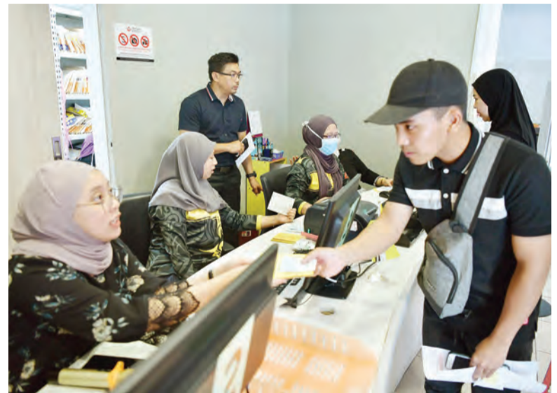
PARA petugas barisan hadapan semasa membuat pendaftaran sebelum mendapatkan suntikan vaksin (atas). Manakala gambar bawah, antara yang mendapatkan suntikan Vaksin COVID-19 di Pusat Kesihatan Pengiran Anak Puteri Hajah Muta-Wakillah Hayatul Bolkiah, Kampung Rimba.

Untuk maklumat lanjut dan perkembangan terkini, orang ramai boleh melayari laman sesawang Kementerian Kesihatan iaitu www.moh.gov.bn dan ikuti media sosial Kementerian Kesihatan @mohbrunei atau menghubungi Talian Nasihat Kesihatan 148 atau melalui aplikasi BruHealth.