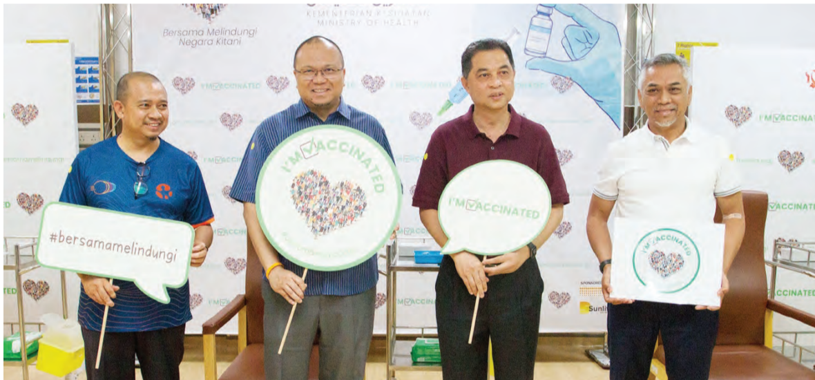
YANG Berhormat Menteri Kesihatan semasa bergambar ramai selepas menerima suntikan dos pertama Vaksin COVID-19 (atas), manakala gambar bawah, Yang Berhormat menerima suntikan dos pertama Vaksin COVID-19 di Hospital Raja Isteri Pengiran Anak Saleha.

BANDAR SERI BEGAWAN, Sabtu, 3 April. - Menteri Kesihatan, Yang Berhormat Dato Seri Setia