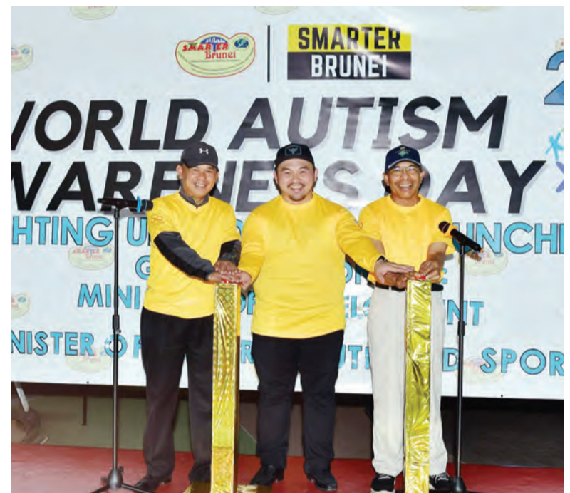
YANG Berhormat Menteri Pembangunan (kanan) dan Yang Berhormat Menteri Kebudayaan, Belia dan Sukan (kiri) semasa hadir selaku tetamu kehormat, seterusnya menyempurnakan pelancaran Sambutan Hari Kesedaran Autisme Sedunia (WAAD).