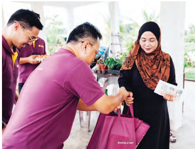
BANK Islam Brunei Darussalam mengadakan aktiviti tahunan, iaitu Sirah Amal Ke-11 dalam semangat untuk mengalu-alukan bulan suci Ramadan.

Ramadan. Kakitangan bank berkenaan berganding bahu untuk memberikan keriang kepada keluarga yang dikunjungi dengan menyampaikan sumbangan dan