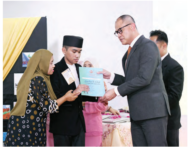
TIMBALAN Setiausaha Tetap (Pendidikan Teras) Kementerian Pendidikan menyampaian sijil kepada salah seorang pelajar yang berjaya menamatkan Program Pra-Vokasional Sesi 2016 - 2020.

Selain itu, tambahnya, dalam memastikan setiap pelajar termasuk pelajar berkeperluan khas diberikan akses kepada pendidikan yang berkualiti secara serata ( equality ) dan saksama ( equity ), sebuah kurikulum pendidikan khas yang komprehensif juga sedang dalam pembinaan, dengan mengambil kira penilaian, sumber