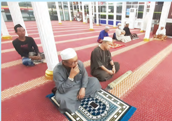
ANTARA yang hadir pada Program Liqa' Ilimi Ahli Sunnah Waljama'ah.

Program berkenaan adalah anjuran bersama Pusat Pengkajian Kefahaman Ahli Sunnah Waljama'ah KUPU SB, Jabatan Hal Ehwal Masjid dan masjid-masjid terpilih di Negara Brunei Darussalam.