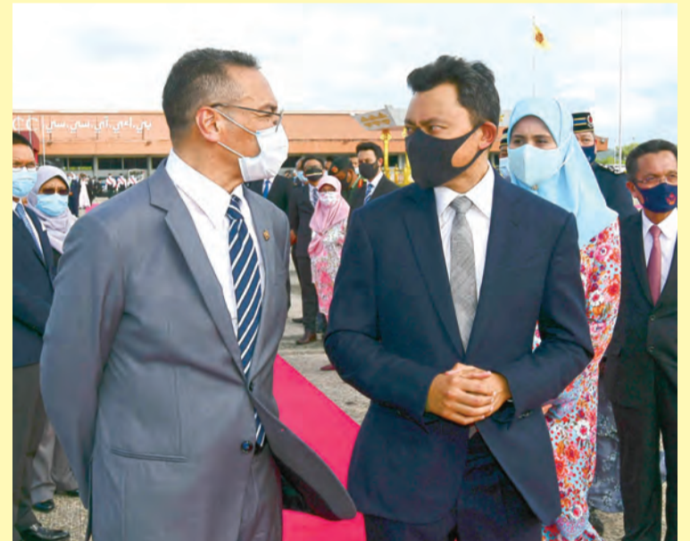
DULI Yang Teramat Mulia berkenan beramah mesra bersama Menteri Hal Ehwal Luar Negeri Malaysia, Yang Berhormat Dato' Seri Hishammuddin Tun Hussein (atas). Sementara gambar kiri, ketibaan Yang Amat Berhormat Perdana Menteri Malaysia dan isteri serta rombongan. Manakala gambar bawah, Yang Amat Berhormat semasa memeriksa Perbarisan Kehormatan yang terdiri daripada anggota Tentera Darat Diraja Brunei, Angkatan Bersenjata Diraja Brunei.

Selain itu, lawatan Yang Amat Berhormat ini adalah merupakan Lawatan Rasmi pertama daripada pemimpin luar ke NBD sejak tercetusnya pandemik COVID-19 pada awal tahun 2020.