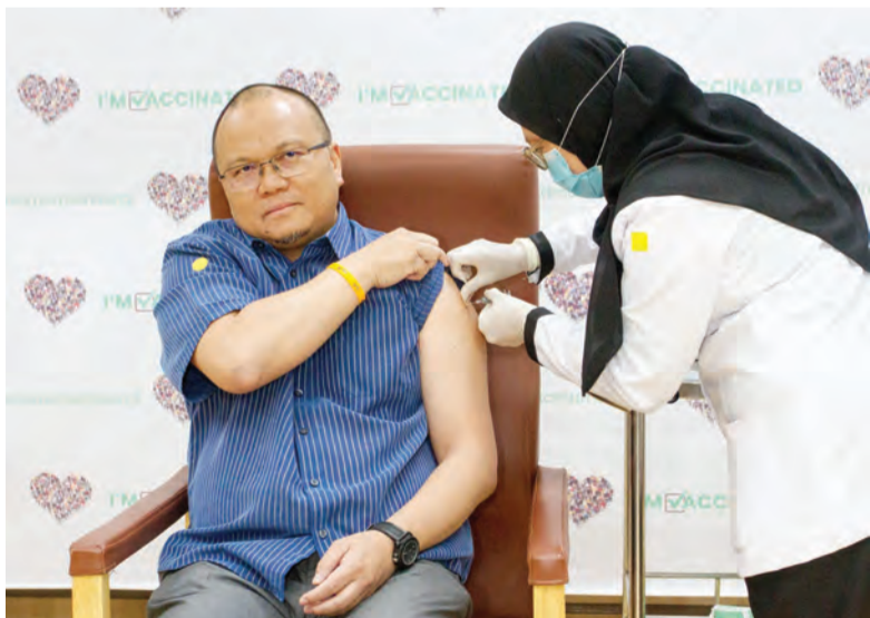
MENTERI Kesihatan, Yang Berhormat Dato Seri Setia Dr. Awang Haji Md. Isham bin Haji Jaafar menerima suntikan dos pertama Vaksin COVID-19 di Hospital Raja Isteri Pengiran Anak Saleha.

Untuk maklumat lanjut dan perkembangan terkini, orang ramai boleh melayari laman sesawang Kementerian Kesihatan iaitu www.moh.gov.bn dan ikuti media sosial Kementerian Kesihatan @mohbrunei atau menghubungi Talian Nasihat Kesihatan 148 atau melalui aplikasi BruHealth.