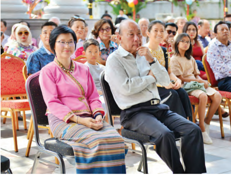
PUAN Yang Terutama Duta Besar Istimewa dan Mutlak Kerajaan Thailand ke Negara Brunei Darussalam (NBD) semasa hadir pada Tahun Baharu Thailand atau lebih dikenali sebagai Festival Songkran atau Festival Air.