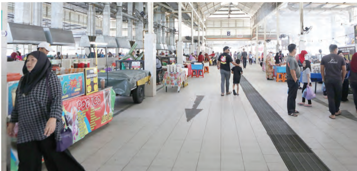
SUASANA Pasar Pelbagai Barangan Gadong yang menjadi tumpuan para pelancong yang datang dari dalam dan luar negara.

Bagi mereka yang berkunjung ke sana sudah setentunya akan berasa sangat selesa dengan kemudahan-kemudahan prasarana yang lengkap termasuk tempat duduk dan meja makan; tandas berasingan bagi lelaki dan perempuan; dan sebuah surau yang boleh memuatkan kira-kira 40 orang jemaah.