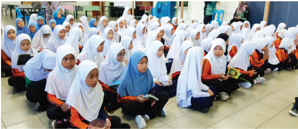
PELBAGAI gelagat murid-murid di Sekolah Rendah Muda Hashim, Daerah Tutong ketika memulakan musim persekolahan mereka pada tahun ini (atas, kiri dan bawah).

Berita dan Foto : Dk. Vivy Malessa Pg. Ibrahim