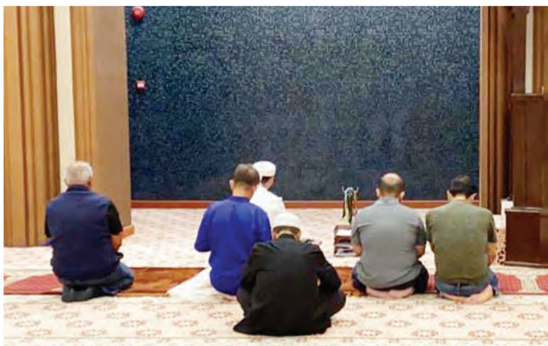
KEMUDAHAN surau di gedung-gedung perniagaan dapat dimanfaatkan oleh para pengunjung supaya tidak menjadi insan yang lalai.