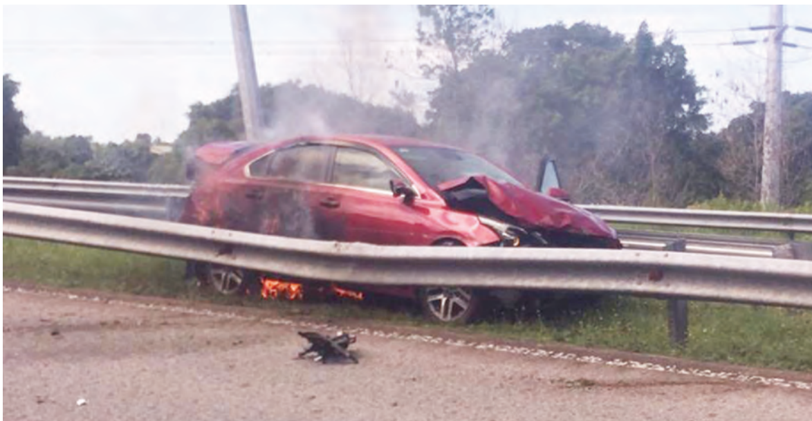
KERITA yang dimiliki oleh lelaki tempatan hangus terbakar selepas melanggar tiang lampu di tengah penghadang jalan raya di Lebuhraya Lumut By Pass pada 1 Januari lepas.

Jika berlaku sebarang insiden kecemasan hendaklah berhubung terus kepada pusat gerakan JBP melalui talian kecemasan 995 dan memberikan maklumat yang tepat.