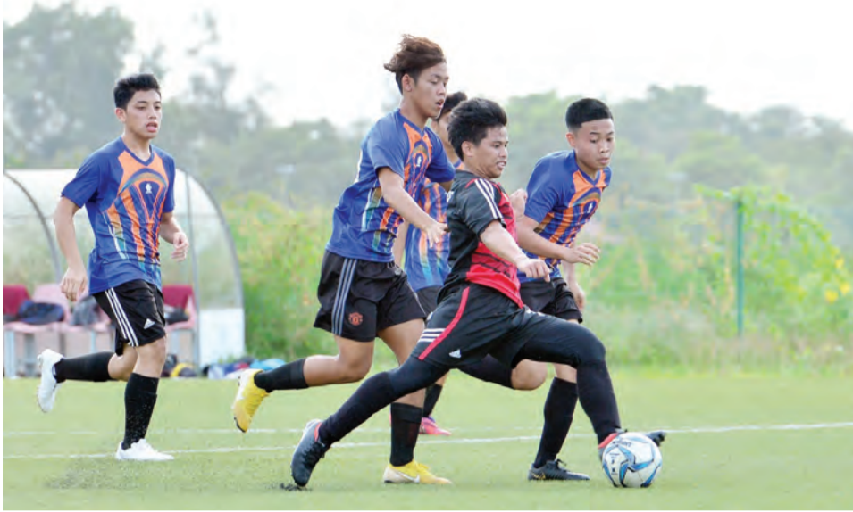
SEBAHAGIAN daripada aksi perlawanan antara Indera SC (jersi merah) dan pasukan Setia Perdana (jersi biru) pada saingan Bola Sepak Belia Di Bawah 19 Tahun Persatuan Bola Sepak Kebangsaan Negara Brunei Darussalam (NFABD) (atas dan kanan).