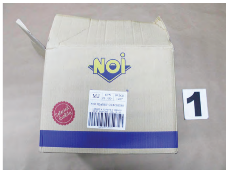
KOTAK berlabel dengan nama 'Noi' tempat anak damit perempuan yang baru lahir ditemui pada 1 Januari 2020.

PPDB meminta kerjasama daripada orang ramai untuk memberikan apa-apa maklumat yang boleh membantu penyiasatan kes ini.