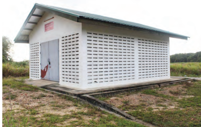
LOKASI penemuan anak damit perempuan yang baru lahir di kawasan Stesen Elektrik Lebuhraya Muara Tutong.

Pihak Polis ingin mengucapkan ribuan terima kasih kepada masyarakat atas bantuan yang diberikan.