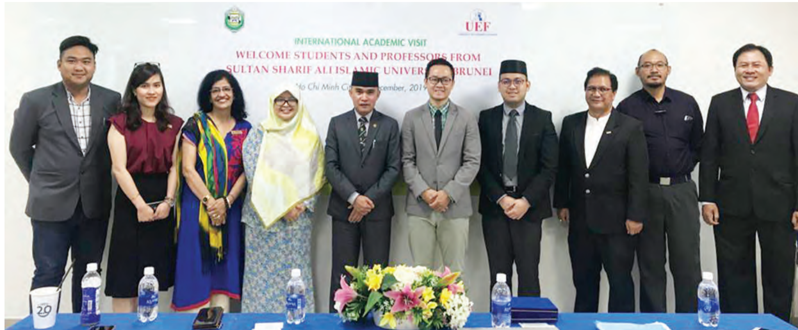
ROMBONGAN Universiti Islam Sultan Sharif Ali (UNISSA) melalui Fakulti Ekonomi dan Kewangan Islam (FEKIm) mengadakan Program Lawatan sambil Belajar ke Viet Nam, Saigon dan Ben Tre pada 22 hingga 29 Disember 2019 lepas.

Tema Lawatan sambil Belajar ke Luar Negara pada tahun ini,