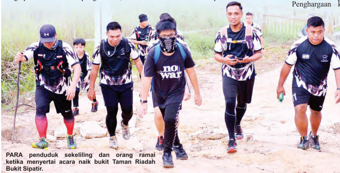
PARA penduduk sekeliling dan orang ramai ketika menyertai acara naik bukit Taman Riadah Bukit Sipatir.

Di puncak Bukit Sipatir, orang ramai berpeluang bergambar ramai dan menikmati suasana pemandangan yang menarik juga indah.