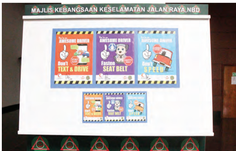
SEBAHAGIAN daripada pameran keselamatan di jalan raya (atas dan kanan).