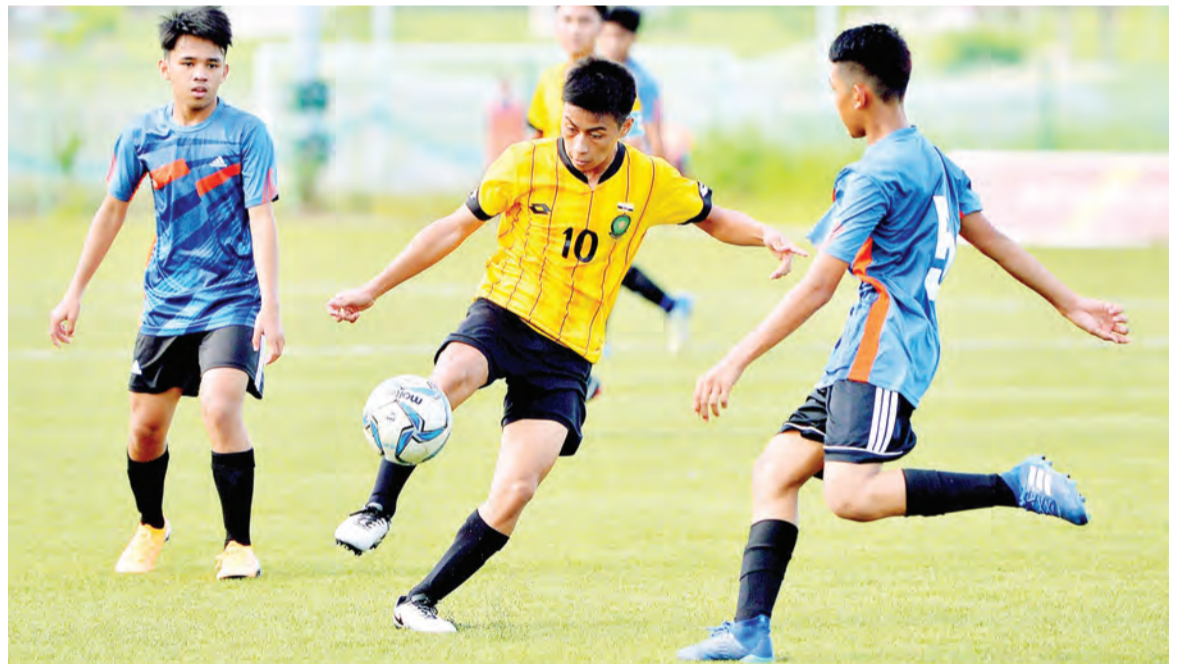
PEMAIN Tabuan (jersi kuning) melepaskan rembatan sambil cuba dikawal oleh pemain Setia Perdana (atas). Sementara gambar bawah, antara yang hadir terdiri daripada ibu bapa dan keluarga para pemain yang tidak melepaskan peluang memberikan sokongan padu kepada mereka.