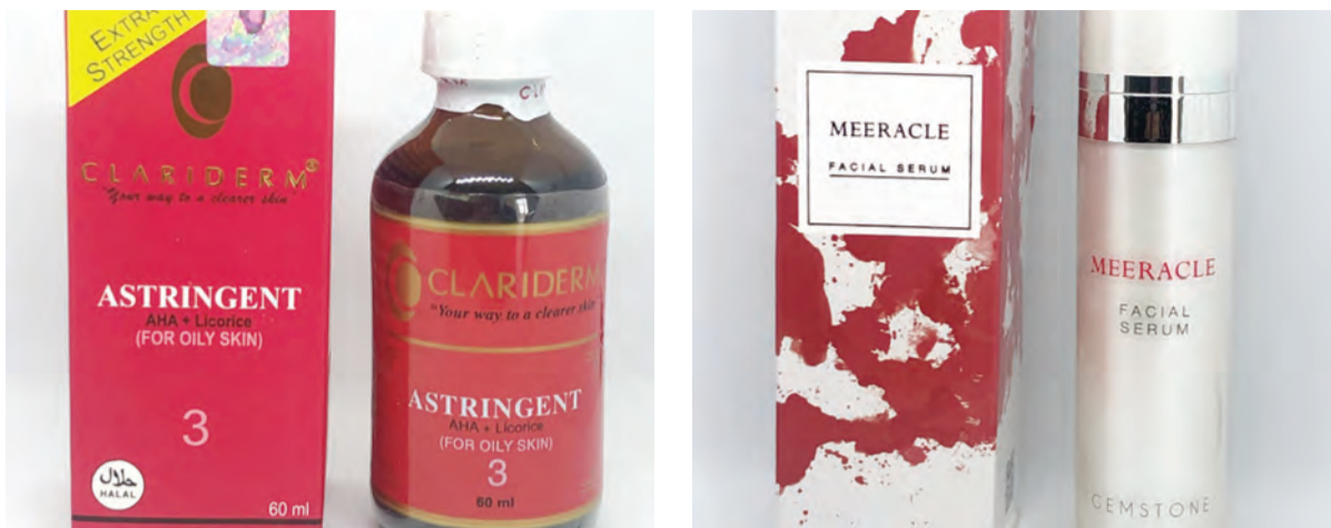
PRODUK-PRODUK Kosmetik, iaitu Meeracle Facial Serum Gemstone Essence (kanan) dan Clariderm Astringent AHA + Licorice (For Oily Skin) 3 (kiri) didapati dicemari dengan bahan terlarang yang tidak diisytiharkan.