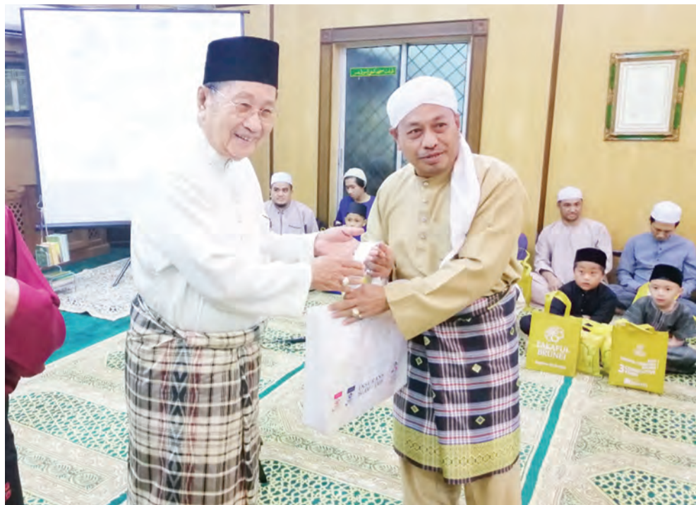
MENTERI Hal Ehwal Ugama, Yang Berhormat Pehin Udana Khatib Dato Paduka Seri Setia Ustaz Haji Awang Badaruddin bin Pengarah Dato Paduka Haji Awang Othman menyampaikan sumbangan derma kepada anak yatim (kanan) dan menyampaikan cenderahati kepada mantan yang pernah berkhidmat di Masjid Kampung Sungai Besar (atas).

Berita dan Foto : Wan Mohamad Sahran Wan Ahmadi