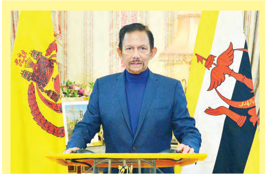
TITAH Kebawah Duli Yang Maha Mulia Paduka Seri Baginda Sultan Haji Hassanal Bolkiah Mu'izzaddin Waddaulah ibni Al-Marhum Sultan Haji Omar 'Ali Saifuddien Sa'adul Khairi Waddien, Sultan dan Yang Di-Pertuan Negara Brunei Darussalam sempena Menyambut Tahun Baharu Masihi 2020 pada Selasa, 4 Jamadilawal 1441 Hijrah bersamaan 31 Disember 2019 Masihi.

Dalam usaha mengurangkan pengangguran, faktor kerjasama di antara agensi-agensi kerajaan dan sektor swasta sangatlah diperlukan. Ke arah itu, beta telah pun memperkenalkan bagi penubuhan Manpower Planning and Employment Council (MPEC), di Jabatan Perdana Menteri, untuk menangani isu-isu pengangguran di negara ini secara efisien, telus dan berkesan. Ini termasuk memupuk kerjasama dengan industri-industri di negara ini dan institusi-institusi pendidikan, bagi memastikan anak-anak