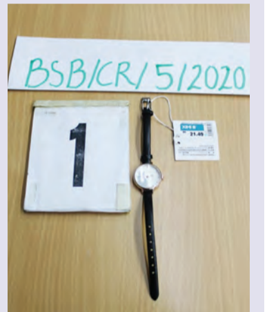
ANTARA barang yang dicuri ialah seutas jam tangan.

Dengan kelebihan teknologi yang ada pada ketika ini diharapkan dapat membantu pihak polis dalam mengesan aktiviti jenayah dengan lebih mudah dan berkesan. Di samping itu juga, PPDB mengucapkan ribuan terima kasih atas kerjasama orang ramai dalam sama-sama menjaga keamanan serta keharmonian negara ini.