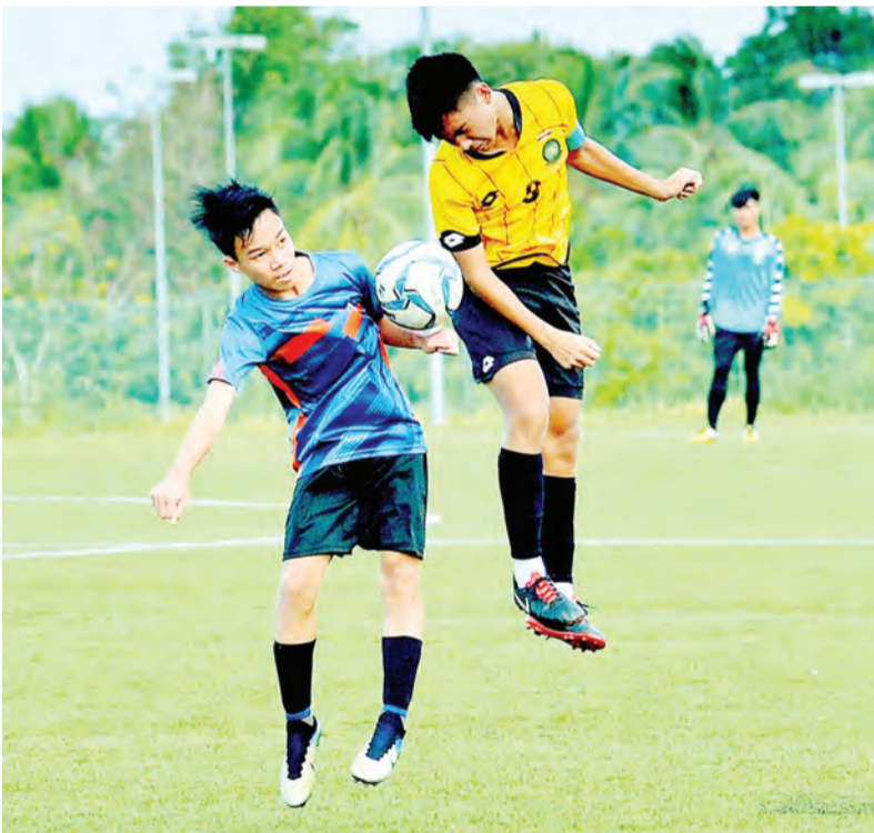
PEMAIN Tabuan (jersi kuning) dan pemain Setia Perdana (jersi biru) bersaing bagi merebut bola pada aksi perlawanan Bola Sepak Belia Di Bawah 16 Tahun Persatuan Bola Sepak Kebangsaan Brunei Darussalam (NFABD) yang diadakan di Padang NFABD Berakas.