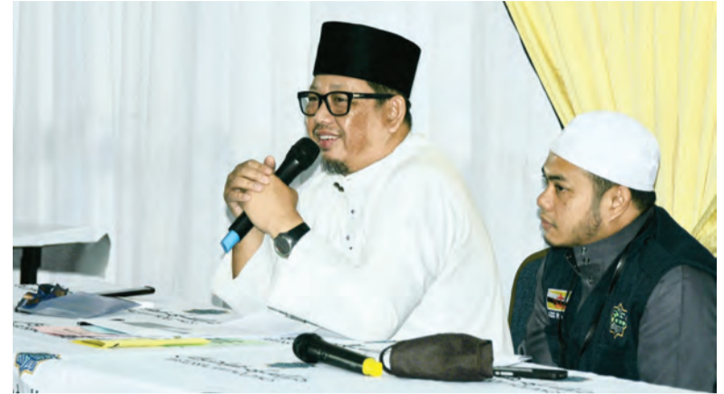
TAKLIMAT Pengurusan Umrah diberikan oleh Ketua Haji dan Umrah DHSB, Pengiran Haji Ibarahim bin Pengiran Haji Bakar (dua, kanan) (atas). Sementara gambar kiri, antara bakal jemaah umrah DHSB ketika menghadiri taklimat.