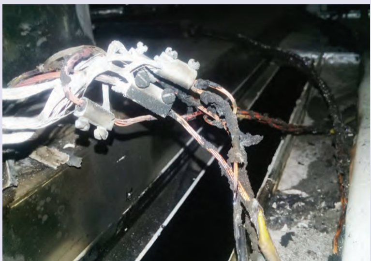
KEBAKARAN kecil berlaku berpunca daripada dapur di Restoran Jolibee, Seria Plaza. Kejadian berlaku sekitar jam 7:58 pagi, Rabu lepas.