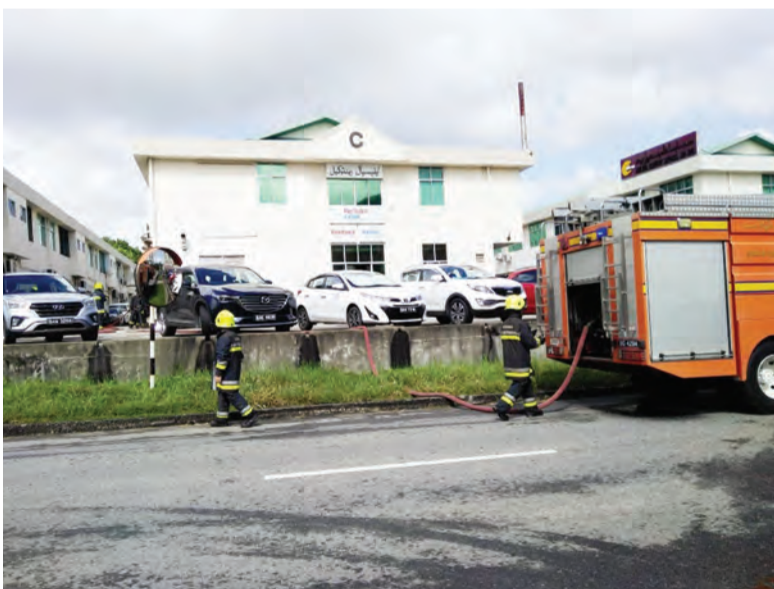
SERAMAI 35 pekerja dan kakitangan Rentokil Initial mengikuti Latihan Kebakaran dan Pengosongan Bangunan yang dikendalikan oleh Bahagian Perhubungan Awam, Cawangan Operasi 'A', Jabatan Bomba dan Penyelamat (JBP), di Rentokil Laundry, Blok 'C', Bangunan Haji Lazim dan Anak-Anak, Kampung Kiarong (kanan dan kiri).