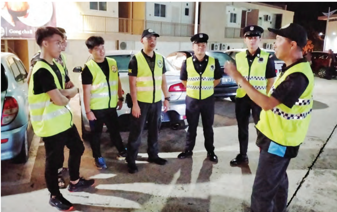
AHLI-AHLI Pengawasan Kejiranan (PK) ketika menjalankan pemantauan bersama anggota Polis bertugas melalui rondaan pencegahan jenayah di beberapa kawasan.