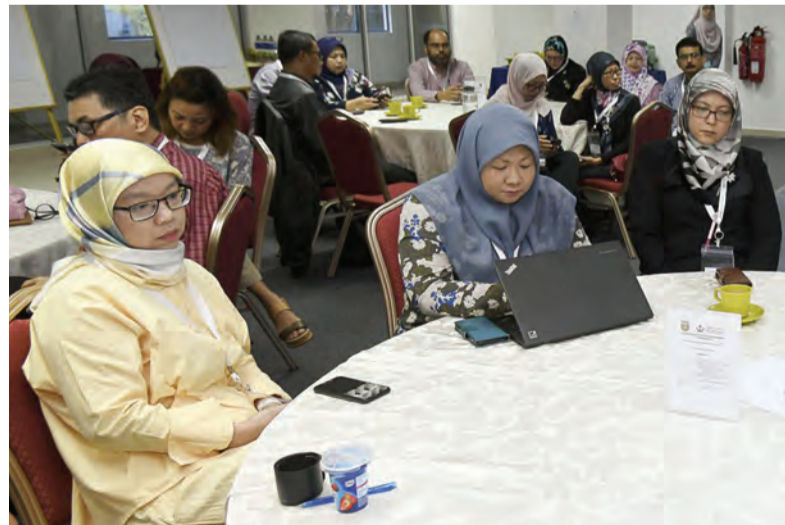
ANTARA peserta yang hadir pada Bengkel Perkembangan Fakulti Klinikal : Konsep-konsep Utama dalam Pendidikan Perubatan selama dua hari di Pusat Sumber Anatomomi, Pusat Sains Kesihatan Pengiran Anak Puteri Rashidah Sa'adatul Bolkiah (PAPRSBIHS), Universiti Brunei Darussalam.

Ini adalah matlamat strategik utama, yang digariskan dalam Pelan Strategik Kementerian Kesihatan 2019 - 2023.