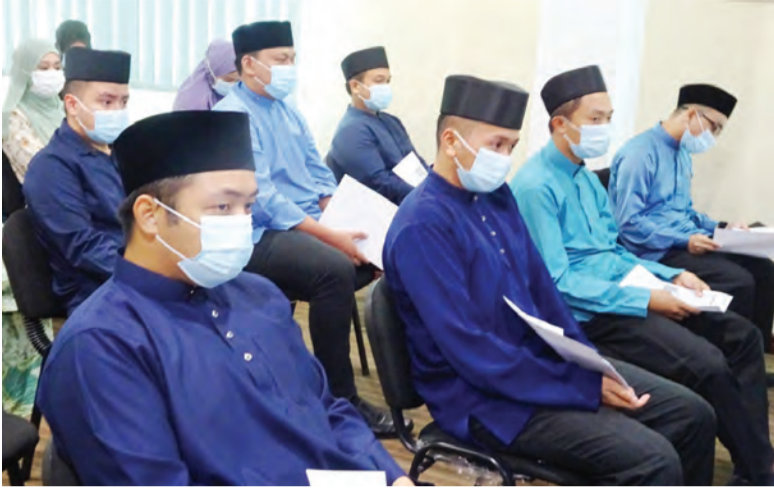
PARA mahasiswa dari Universiti Islam Sultan Sharif Ali (UNISSA) yang mengikuti program Sarjana Muda Tahfiz dan Qiraat mengadakan Lawatan sambil Belajar ke Pusat Pengkajian Borneo (penBORNEO), di sini.