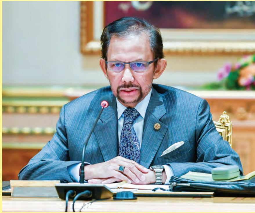
TITAH Kebawah Duli Yang Maha Mulia Paduka Seri Baginda Sultan Haji Hassanal Bolkiah Mu'izzaddin Waddaulah ibni Al-Marhum Sultan Haji Omar 'Ali Saifuddin Sa'adul Khairi Waddien, Sultan dan Yang Di-Pertuan Negara Brunei Darussalam sempena Mesyuarat Jawatankuasa Tertinggi Rancangan Kemajuan Negara Kali Pertama bagi Tahun 2020 pada Isnin, 3 Safar 1442 Hijrah bersamaan 21 September 2020 Masihi di Istana Nurul Iman.

Sehubungan itu, beta melihat apa jua perancangan di bawah projek Rancangan Kemajuan Negara yang akan datang, khasnya Rancangan Kemajuan Negara Ke-12 tidak hanya akan memberikan tumpuan kepada penyediaan atau pembinaan infrastruktur sahaja, bahkan turut lebih perlu ialah menjurus kepada projek-projek yang boleh menyumbang