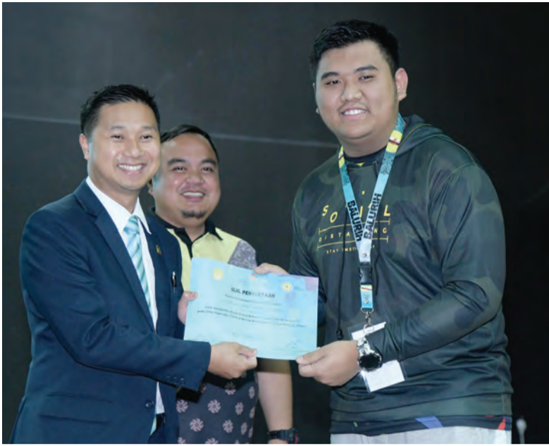
SETIAUSAHA Tetap, Kementerian Kebudayaan, Belia dan Sukan (kiri) semasa menyampaikan sijil penyertaan kepada peserta bengkel tersebut.

Berita dan Foto : Haji Ariffin Mohd. Noor / Morshidi