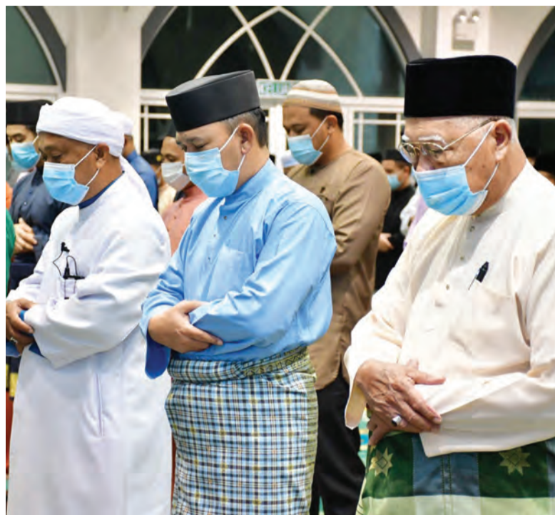
YANG Berhormat Menteri Kebudayaan, Belia dan Sukan bersama jemaah lain menunaikan Sembahyang Fardu Subuh.

ANTARA jemaah yang hadir pada program tersebut.