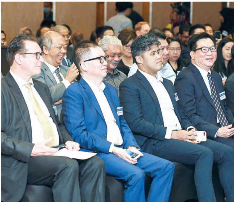
YANG Amat Mulia Pengiran Muda Dr. Abdul Fattaah semasa berangkat pada Program Transform 2020 Townhall Forum, bertajuk 'Coming Out Stronger - A Townhall Forum on Business Survival and Opportunity in The Time of COVID-19'.

BANDAR SERI BEGAWAN, Rabu, 23 September. - Lebih 90 tokoh perniagaan, para eksekutif korporat dan pegawai kerajaan mengambil bahagian pada Program Transform 2020 Townhall Forum bertajuk 'Coming Out Stronger - A Townhall Forum on Business Survival and Opportunity in The Time of COVID-19'.