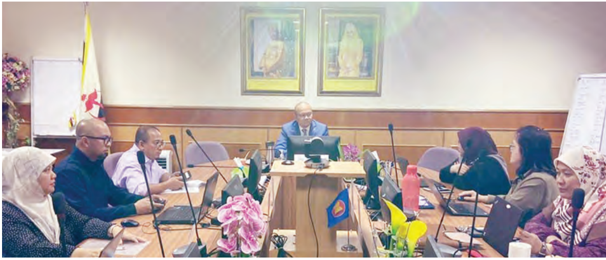
YANG Berhormat Menteri Kesihatan semasa menghadiri Mesyuarat Peringkat Tinggi Kerjasama Ekonomi Asia-Pasifik mengenai Kesihatan dan Ekonomi Ke-10 (10th Asia-Pacific Economic Cooperation on Health & The Economy) secara dalam talian.

BANDAR SERI BEGAWAN , Khamis, 24 September. - Mesyuarat Peringkat Tinggi Kerjasama Ekonomi Asia-Pasifik mengenai Kesihatan dan Ekonomi Ke-10 (10th Asia-Pacific Economic Cooperation on Health & The Economy) diadakan pada 23 September 2020 secara dalam talian.