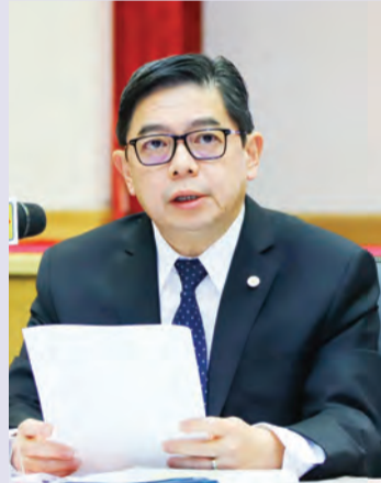
YANG Berhormat Menteri di Jabatan Perdana Menteri dan Menteri Kewangan dan Ekonomi II semasa Sidang Media berkenaan.

Peningkatan itu, jelasnya, adalah semasa suku kedua tahun ini, iaitu ketika penularan COVID-19 dan negara masih menjalankan beberapa sekatan, termasuk penutupan gim, sekolah memandu, pusat penjagaan kanak-kanak dan sebagainya.