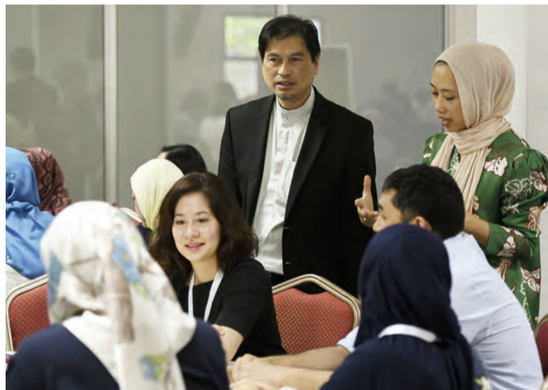
TIMBALAN Setiausaha Tetap (Profesional) Kementerian Kesihatan selaku Pengerusi bagi Penasihat Siswazah dan Lembaga Latihan (Postgraduate Advisory and Training Board-PGATB), Kementerian Kesihatan semasa meninjau lebih dekat bengkel yang diadakan.

Bengkel bertujuan untuk mendedahkan pengetahuan,