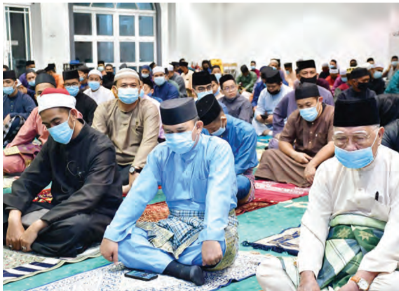
YANG Berhormat Menteri Kebudayaan, Belia dan Sukan (tengah) ketika menghadiri Wira Fajar Program Belia Sembahyang Fardu Subuh Berjemaah di Masjid bagi Tahun 1442H / 2020M bersama jemaah lainnya.

Program tersebut, antara lain bertujuan untuk mendidik diri para belia mengerjakan sembahyang berjemaah di masjid dan memberikan pendedahan kepada para belia dengan mengisi aktiviti bermanfaat, terutama sekali dalam mengadakan aktiviti-aktiviti