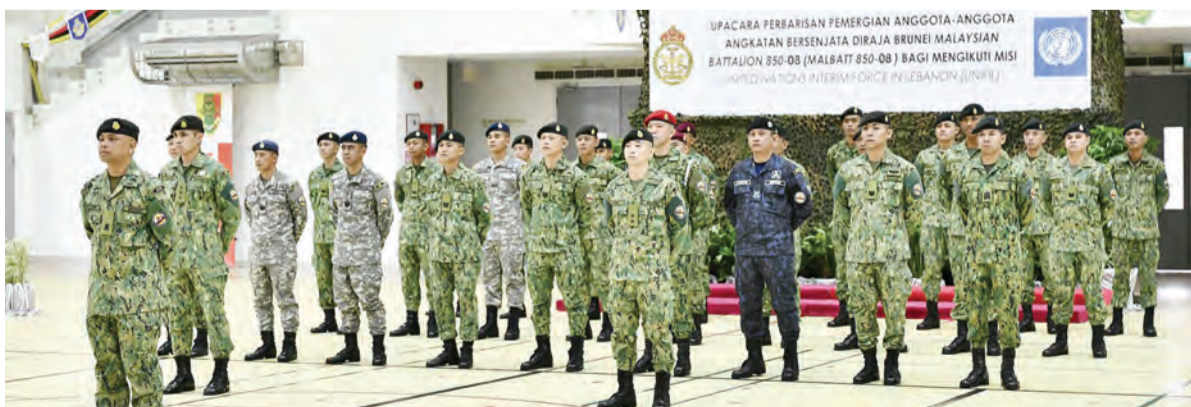
KONTINJEN negara seramai 30 anggota ABDB akan menyertai Batalion Malaysia 850-8 (MALBATT 850-8) dalam penugasan misi pengaman United Nations Interim Force in Lebanon (UNIFIL) dan bertolak pada 23 September 2020.

ABDB telah berkhidmat dalam misi pengaman UNIFIL sejak tahun 2008 dan dalam masa tersebut juga telah menghantar sejumlah 34 Pegawai dan 278 anggota ABDB.