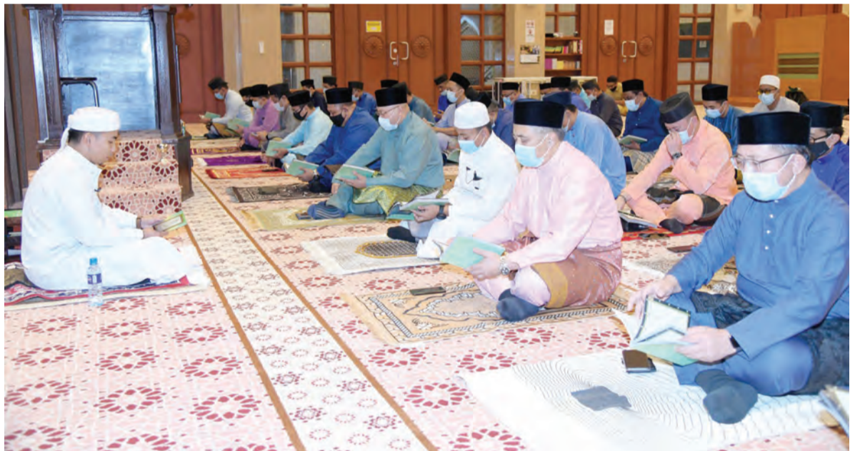
YANG Berhormat Menteri Pengangkutan dan Infokomunikasi semasa hadir pada Doa Kesyukuran dan Bacaan Surah Yaa Siin sempena Sambutan Hari Maritim Sedunia dan Ulang Tahun Penubuhan MPABD Ke-3.