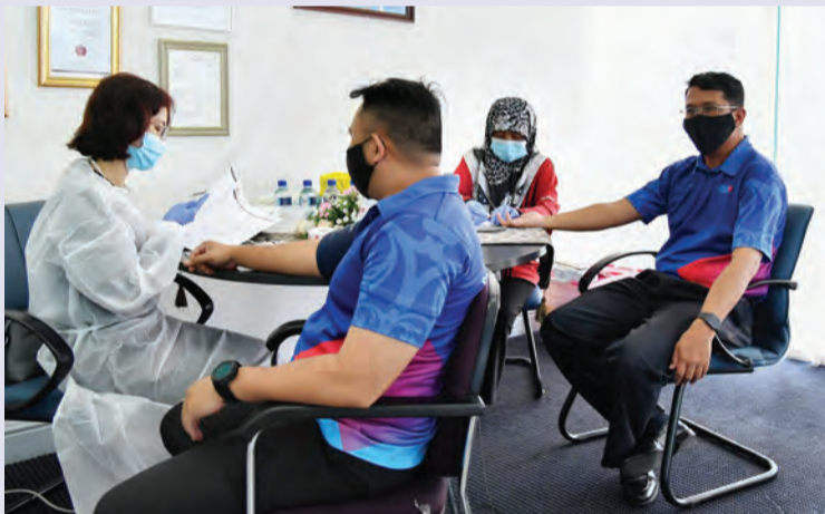
RHB dengan kerjasama Pusat Pendermaan Darah mengadakan Kempen Derma Darah, berlangsung di Bank RHB, Kompleks Yayasan Sultan Haji Hassanal Bolkiah.

Berita dan Foto : Mohamad Azmi Awang Damit