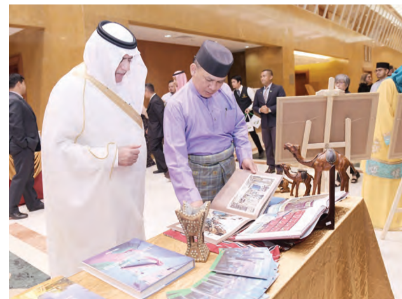
YANG Berhormat Menteri Kebudayaan, Belia dan Sukan; Duta Besar Istimewa dan Mutlak Kerajaan Arab Saudi ke Negara Brunei Darussalam (NBD); Dean of the Diplomatic Missions dan Duta Besar Istimewa dan Mutlak Kesultanan Oman ke NBD; dan Duta Besar Istimewa dan Mutlak Kuwait ke NBD semasa sesi memotong kek pada Majlis Resepsi berkenaan (kiri). Sementara gambar atas, Yang Berhormat semasa menyaksikan pameran sempena Sambutan Ulang Tahun Hari Kebangsaan Kerajaan Arab Saudi Ke-90 di Indera Samudera Hall 2, The Empire Brunei.