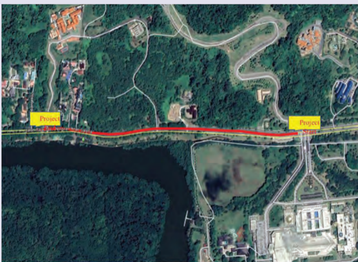
PENUTUPAN sebahagian jalan lorong kiri menghala ke Tutong bagi memberi laluan kerja-kerja pembaikan jalan raya di sepanjang Jalan RIPAS.