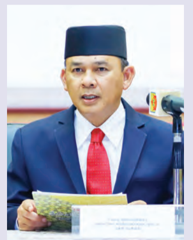
YANG Berhormat Menteri Kebudayaan, Belia dan Sukan pada Sidang Media berkenaan.

Para penganjur, tegasnya, turut mempunyai tanggungjawab untuk memastikan setiap garis panduan dipatuhi dalam sebarang penganjuran dan hendaklah mengambil langkah