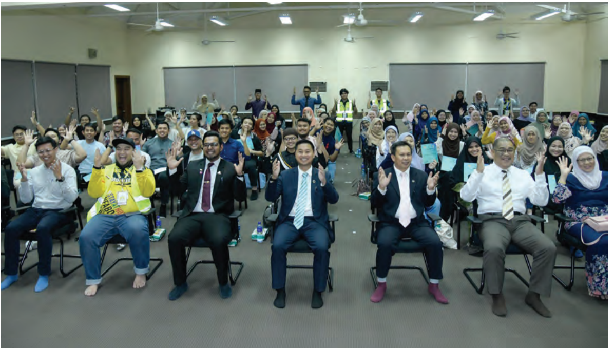
PARA peserta Bengkel Jom Berisyarat! pada sesi bergambar ramai bersama tetamu kehormat majlis.

merupakan Yang Di-Pertua Alumni Program - program Antarabangsa serta dibantu oleh ahli komiti APPA dan kakitangan Pusat Bahagia.