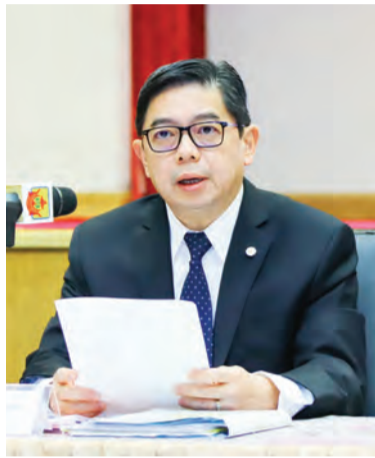
YANG Berhormat Menteri di Jabatan Perdana Menteri dan Menteri Kewangan dan Ekonomi II pada Sidang Media tersebut.

Menurut Yang Berhormat, RB melakukan dua penerbangan ke Singapura setiap minggu, di mana setiap penerbangan akan membawa lebih 20 penumpang.