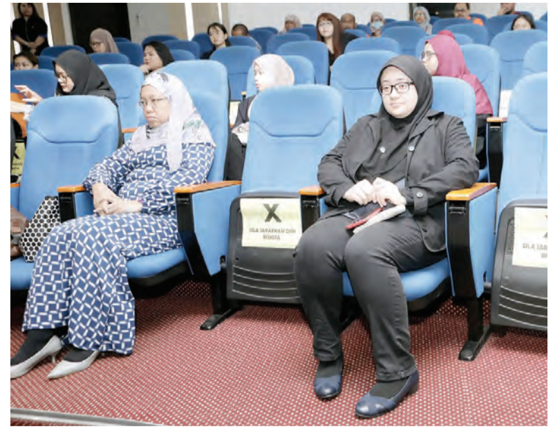
YANG Berhormat Ahli Majlis Mesyuarat Negara (kanan) semasa hadir pada Bengkel Asas Bahasa Isyarat Kali Pertama Tahun 2020 selama dua hari bermula 25 hingga 26 September 2020, bertempat di Dewan Kuliah, Stadium Negara Hassanal Bolkiah (atas). Manakala gambar atas kiri, para fasilitator ketika mengajarkan Bahasa Isyarat kepada peserta bengkel.

Oleh : Rohani Haji Abdul Hamid