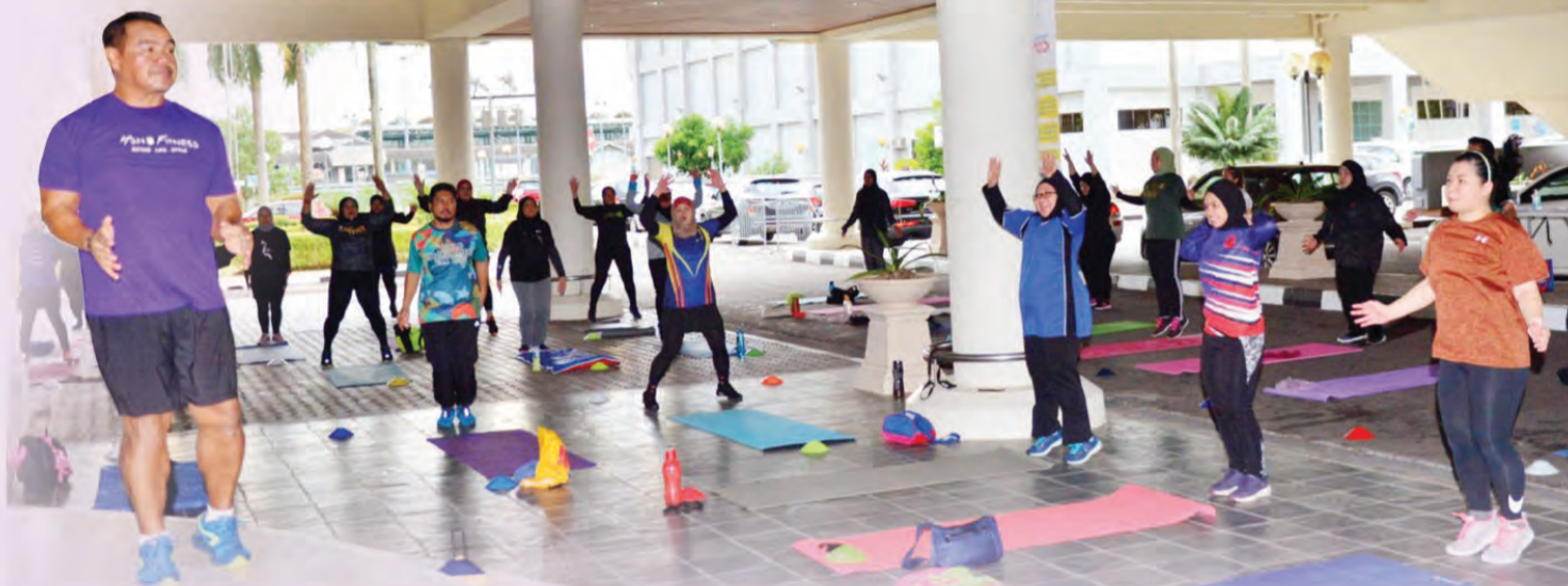
BAGI mengenang dan menghargai jasa-jasa guru, HSN Fitness menganjurkan 'Tabata Workout' secara percuma buat kali kedua pada tahun ini untuk insan-insan yang bergelar guru yang diadakan di kawasan Stadium Tertutup, Kompleks Sukan Negara Hassanal Bolkiah.