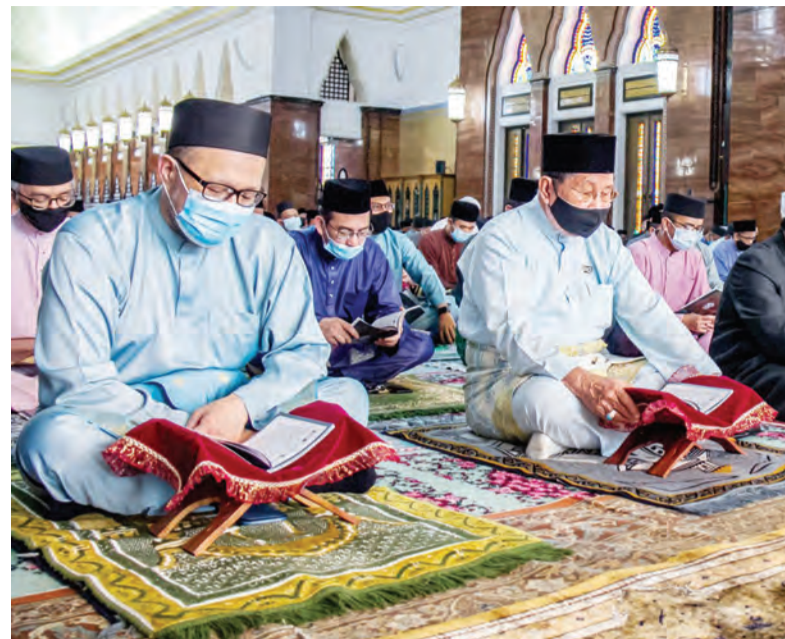
YANG Berhormat Menteri Hal Ehwal Ugama (dua, kiri) dan Yang Berhormat Menteri Pendidikan (kiri) ketika menunaikan Sembahyang Sunat Hajat Berjemaah bagi Menghindari Wabak dan Keselamatan Negara Brunei Darussalam pada Majlis Membaca Surah Yaa Siin dan Bacaan Tahlil bagi Al-Marhum Sultan Haji Omar 'Ali Saifuddin Sa'adul Khairi Waddien dan Al-Marhumah Duli Raja Isteri Pengiran Anak Damit, yang diselenggarakan dengan Majlis Doa Kesyukuran sempena Sambutan Hari Guru Ke-30 di Masjid Omar 'Ali Saifuddin, di ibu negara (kiri dan kanan).

Oleh : Dk. Siti Redzaimi Pg. Haji Ahmad