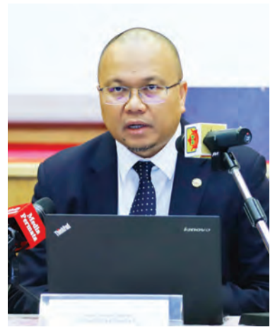
YANG Berhormat Menteri Kesihatan pada Sidang Media berkenaan.

Untuk maklumat lanjut dan perkembangan terkini, orang ramai boleh melayari Laman Sesawang Kementerian Kesihatan, iaitu www.moh.gov.bn atau menghubungi Talian Nasihat Kesihatan 148 atau melalui aplikasi BruHealth.