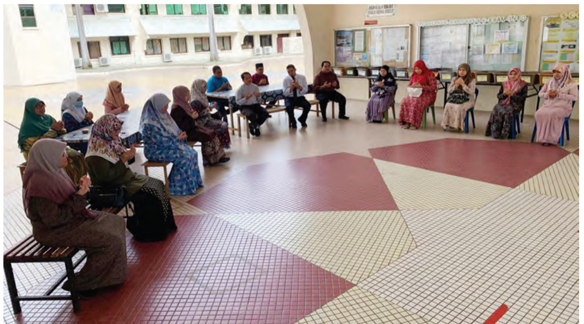
MAJLIS Doa Kesyukuran sempena Sambutan Hari Guru Ke-30 diadakan di sekolah-sekolah, maktab-maktab dan pusat-pusat tingkatan enam di seluruh negara adalah bagi mengenang jasa bakti Al-Marhum Sultan Haji Omar 'Ali Saifuddin Sa'adul Khairi Waddien terhadap kemajuan pendidikan di negara ini.