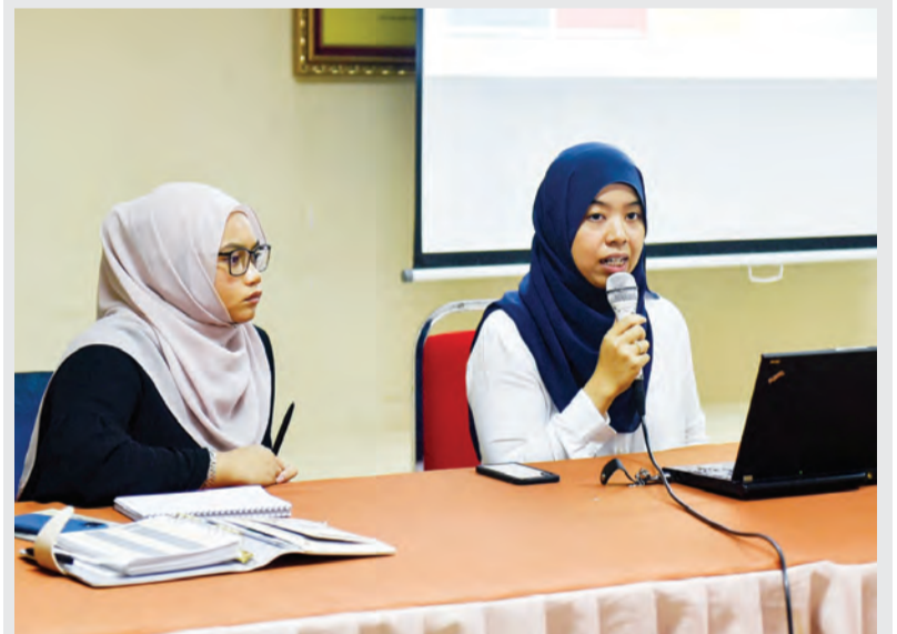
WAKIL Sekretariat Ease of Doing Business, Kementerian Kewangan dan Ekonomi menyampaikan taklimat mengenai Ease of Doing Business pada Perkampungan Sivik Lepas Ijazah Kali Pertama Tahun 2020 di Pusat Belia, Bangar, Temburong.

TEMBURONG, Isnin, 10 Februari. - Peserta Perkampungan Sivik Lepas Ijazah (PSLI) kali pertama tahun 2020 didedahkan kepada inisiatif Ease of Doing Business (EODB) sebagai salah satu pengisian program perkampungan tersebut.