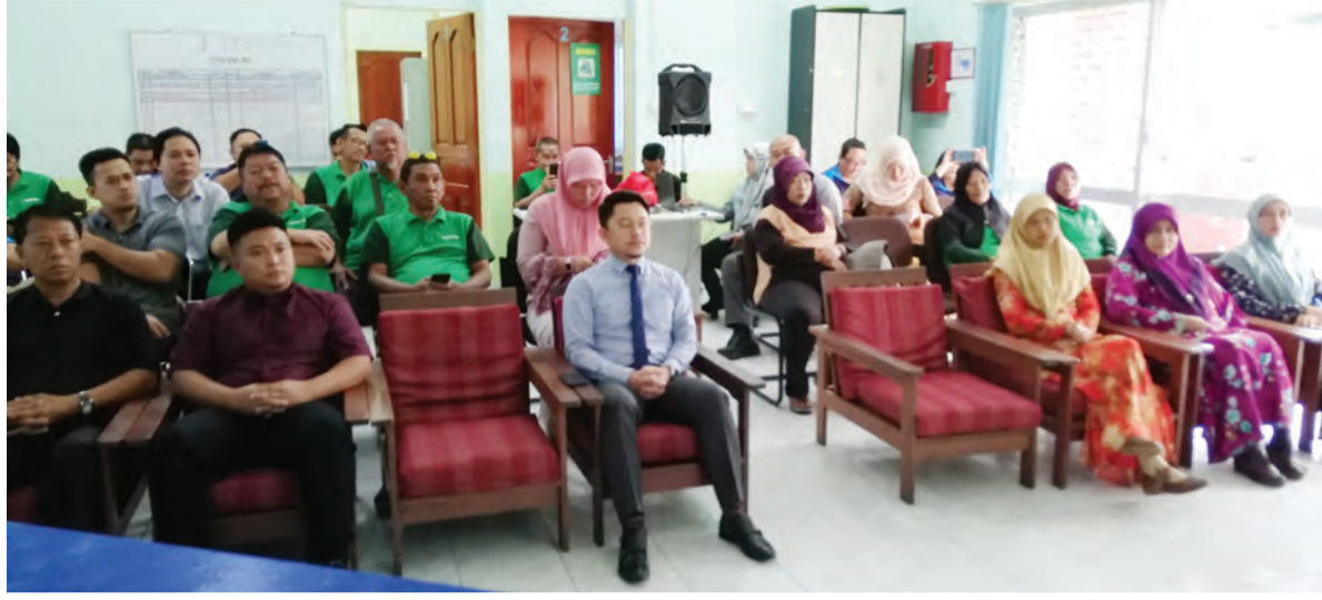
PENOLONG Pegawai Penerangan selaku Ketua Cawangan Penerangan Daerah Belait semasa menyampaikan Taklimat Menghayati Bendera dan Lagu Kebangsaan Negara Brunei Darussalam (kiri), sementara gambar kanan, Ketua Cawangan JASTRe Daerah Belait (tengah) bersama para kakitangan JASTRe Kuala Belait (KB) hadir mendengarkan taklimat tersebut.

Berita dan Foto : Noraisah Haji Muhammed