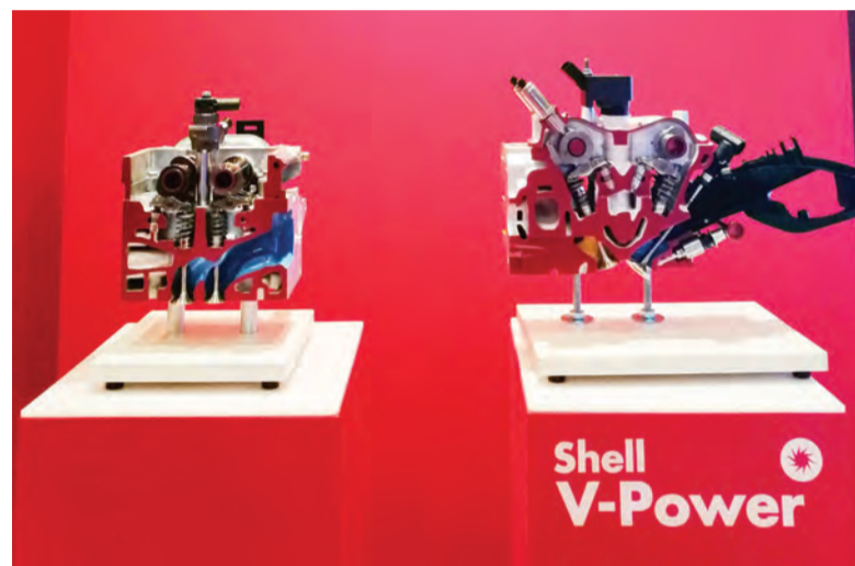
SEBAHAGIAN daripada pameran semasa pelancaran Shell V-Power (kiri dan kanan).