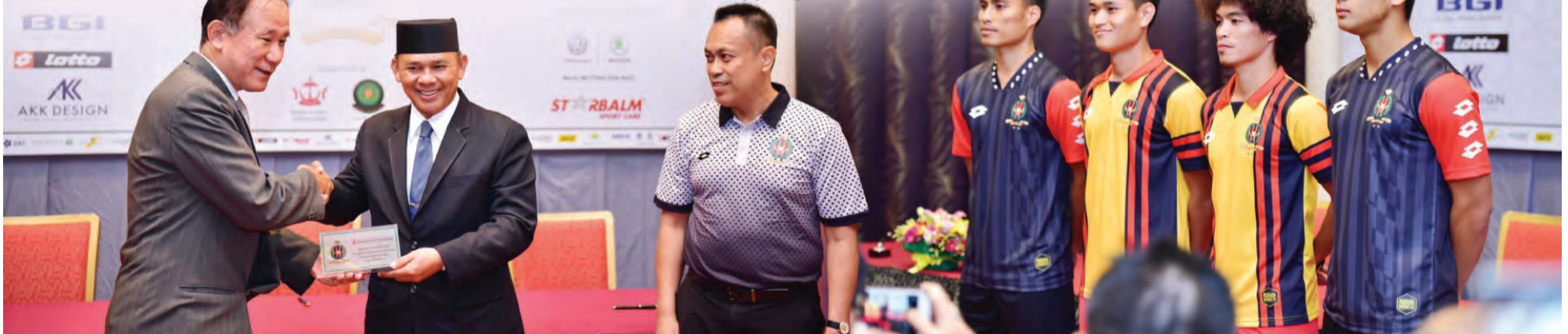
YANG Berhormat Menteri Kebudayaan, Belia dan Sukan turut menyempurnakan Penyampaian Cenderamata daripada DPMM FC kepada penaja (kiri), Sementara gambar kanan, Jersi DPMM FC Musim 2020, iaitu Home and Away jersey.

BERITA-BERITA HARIAN BOLEH DIKUTI DI LAMAN SESAWANG : www.pelitabrunei.gov.bn