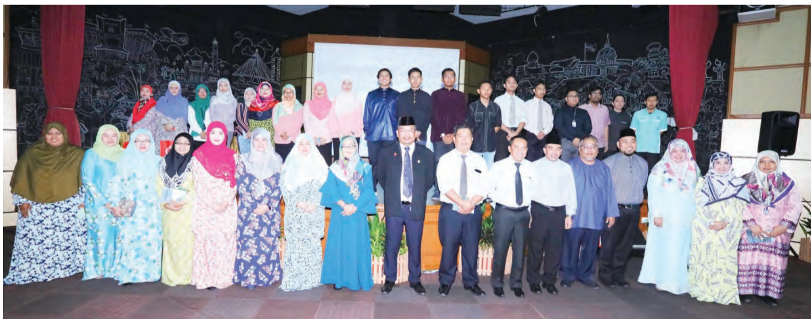
PEMANGKU Pengarah Dewan Bahasa dan Pustaka (DBP) ketika berucap (kiri). Sementara gambar kanan, para peserta Bengkel Kritikal Sastera anjuran DBP bergambar ramai bersama Pemangku Pengarah DBP dan pembimbing-pembimbing bengkel.