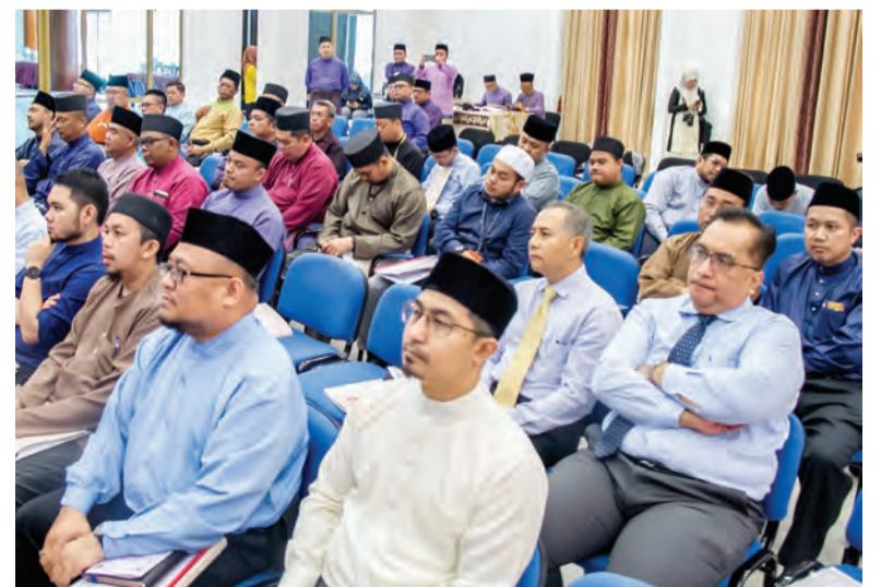
PARA peserta yang mengikuti kursus tersebut.

Muzakarah diharap dapat mencapai objektifnya dan memantapkan lagi guru-guru pengkursus dengan ilmu ibadah haji dalam menyampaikan kursus ibadah haji kepada bakal jemaah haji tahun 1441H / 2020M, di samping ilmu ibadah haji dapat disebarluaskan kepada pegawai-pegawai dan kakitangan dalam perkhidmatan awam juga mahasiswa institusi-institusi pengajian tinggi.