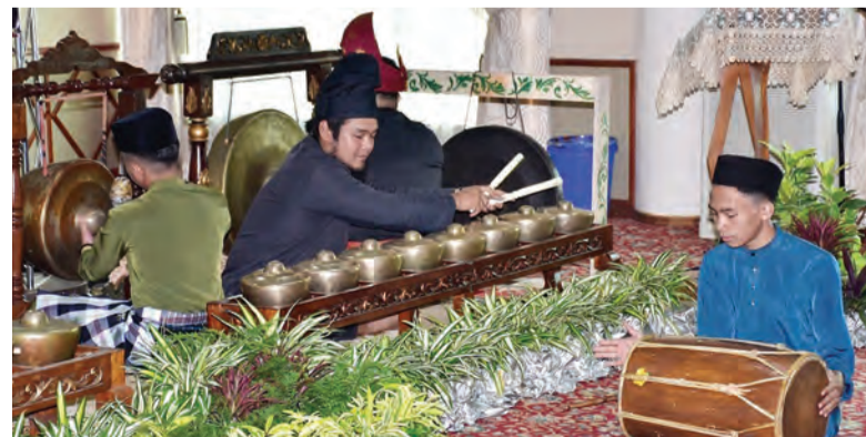
PERSEMBAHAN Gulintangan memeriahkan lagi majlis berkenaan.