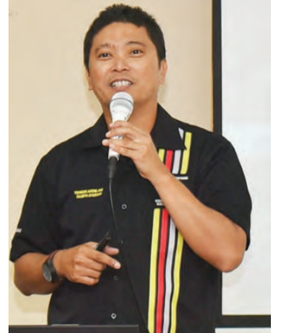
PEGAWAI Narkotik dari Cawangan Pendidikan Pencegahan Dadah, Biro Kawalan Narkotik mengongsikan mengenai Sindiket Dadah Antarabangsa yang menggunakan warga tempatan untuk menjadi keldai dadah.

beberapa terasul untuk kerabat-kerabat diraja yang lain, dan orang-orang yang diberikan gelaran.