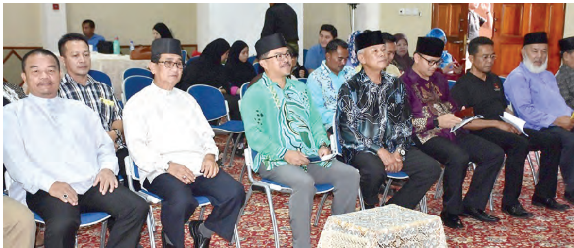
PEMANGKU Pegawai Daerah Temburong (depan, tiga kiri) hadir selaku tetamu kehormat pada Majlis Penutup Bengkel Gulintangan Kali Pertama.