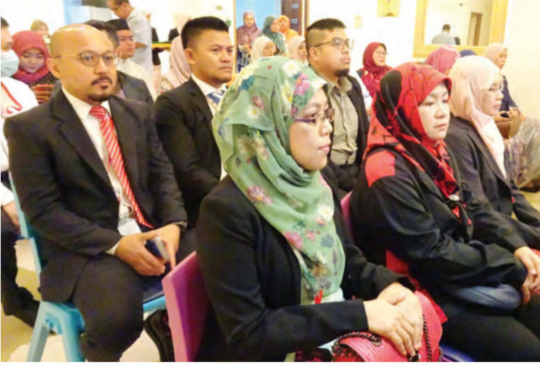
SETIAUSAHA Tetap di Kementerian Kesihatan merangkap Ahli Lembaga Pengelola Politeknik Brunei menyaksikan Majlis Penandatanganan Memorandum Persefahaman (MoU) di antara Kementerian Kesihatan dan Politeknik Brunei (kanan). Sementara gambar atas, antara yang hadir pada majlis tersebut.