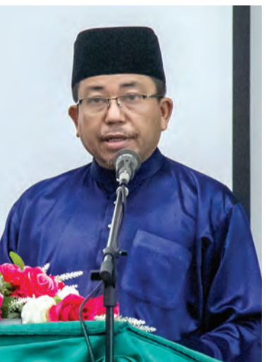
TIMBALAN Setiausaha Tetap (Dasar dan Keagamaan), Kementerian Hal Ehwal Ugama ketika berucap.

BANDAR SERI BEGAWAN, Selasa, 11 Februari. - Muzakarah Pengkursus Ibadat Haji yang diadakan diakhiri dengan Majlis Penutup Kursus bertempat di Dewan Multaqa, Lantai Bawah, Bangunan Tambahan, Kementerian Hal Ehwal Ugama.