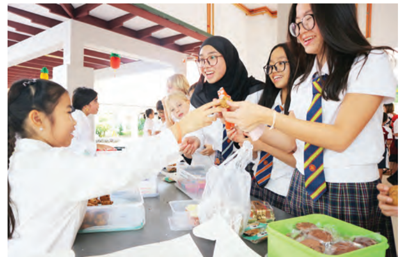
ANTARA aktiviti yang diadakan semasa Minggu Pengumpulan Dana JIS (kiri dan kanan).