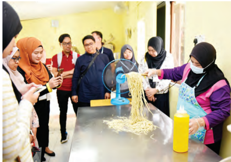
SEORANG Ahli Biro Wanita MPK Senukoh menunjukkan cara-cara penyediaan mi kuning sebelum pembungkusan kepada para Peserta Perkampungan Sivik Lepas Ijazah (PSLI) yang mengadakan lawatan ke kampung tersebut.

Berita dan Foto : Hernie Suliana Haji Othman