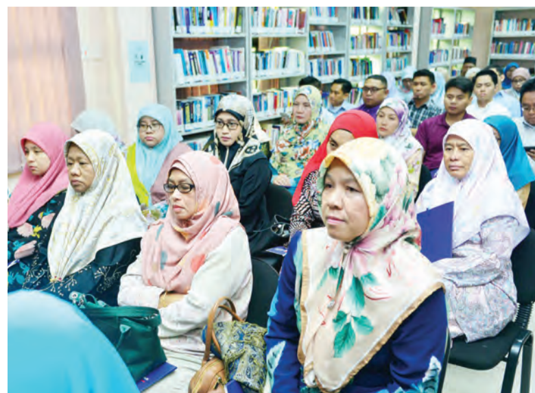
Berita dan Foto : Haji Ariffin Mohd Noor / Morshidi

BERAKAS , Selasa, 11 Februari. - Persatuan Perpustakaan Negara Brunei Darussalam (BLA) dengan kerjasama Pihak Berkuasa Info-Komunikasi Teknologi (AITI) menganjurkan seminar bertajuk Seminar Kesedaran Tadbir Urus Internet bagi Perpustakaan.