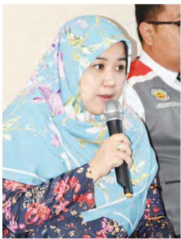
PEMANGKU Pegawai Penerangan Kanan, selaku Ketua Bahagian Kenegaraan dan Kemasyarakatan semasa berucap.

Berita dan Foto : Dk. Vivv Malessa Pg. Ibrahim