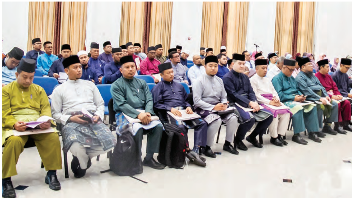
ANTARA yang hadir pada Majlis Muzakarah Pengkursus Ibadat Haji tersebut.

Hukum-hukum berkaitan dengan haji, umrah dan ziarah yang akan disampaikan selaras dan seragam tidak ada percanggahan hukum yang diberikan kepada para bakal jemaah haji oleh guru-guru pengkursus selain melengkapkan dan mempersiapkan diri guru-guru pengkursus dengan ilmu-ilmu ibadah haji dan bimbingan haji.