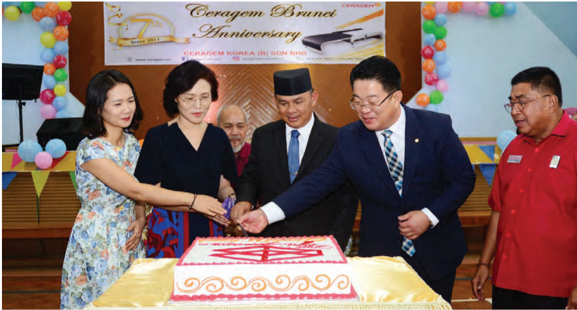
YANG Berhormat Menteri Kebudayaan, Belia dan Sukan (tengah); Puan Yang Terutama Duta Besar Istimewa dan Mutlak Republik Korea ke Negara Brunei Darussalam (dua, kiri) dan Ketua Pegawai Eksekutif (CEO) selaku Pengasas Ceragem Brunei (dua, kanan) memotong kek sempena Sambutan Ulang Tahun Ketujuh, Pusat Terapi Ceragem (Brunei). Majlis berlangsung di Dewan Kemasyarakatan Jalan 77, Rancangan Perumahan Negara Lambak Kanan.

Siaran Akhbar : Pusat Terapi Ceragem (Brunei)