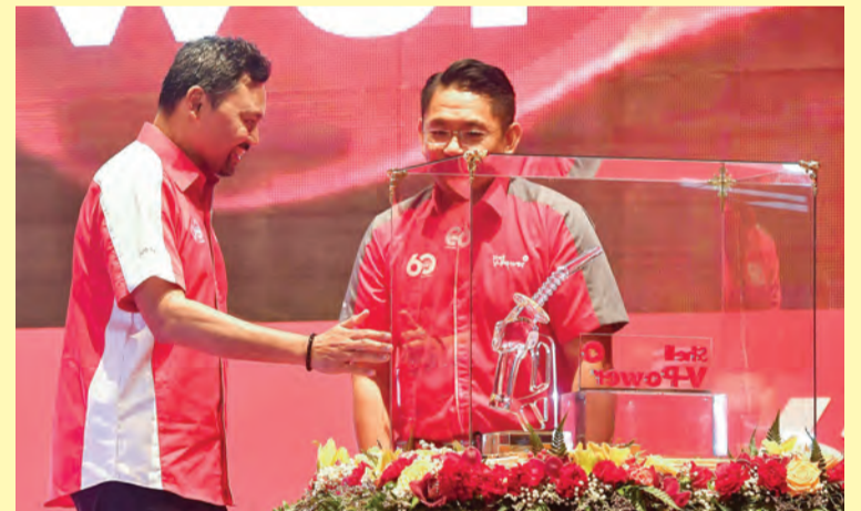
DULI Yang Teramat Mulia Paduka Seri Pengiran Muda Mahkota Pengiran Muda Haji Al-Muhtadee Billah ibni Kebawah Duli Yang Maha Mulia Paduka Seri Baginda Sultan Haji Hassanal Bolkiah Mu'izzaddin Waddaulah, Menteri Kanan di Jabatan Perdana Menteri juga selaku Pengerusi Lembaga Pengarah Syarikat Brunei Shell Marketing (BSM) berkenan berangkat ke Majlis Pelancaran Produk Petroleum Shell V-Power tersebut (kiri), sementara gambar atas, Duli Yang Teramat Mulia berkenan menerima pesambah.