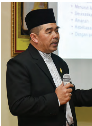
PEMANGKU Pegawai Tugas-Tugas Khas Kanan Pejabat Sekretariat Majlis Tertinggi Melayu Islam Beraja mengongsikan antara inti pati konsep Melayu Islam Beraja kepada Peserta Perkampungan Sivik.

TEMBURONG, Selasa, 11 Februari. - Konsep Melayu Islam Beraja (MIB) merupakan tunjang kepada asuhan pemikiran dan pembentukan sikap kehidupan orang Brunei yang taat beragama, setia kepada raja, serta rajin berusaha dengan meneliti semua sifat dan nilainya secara positif.