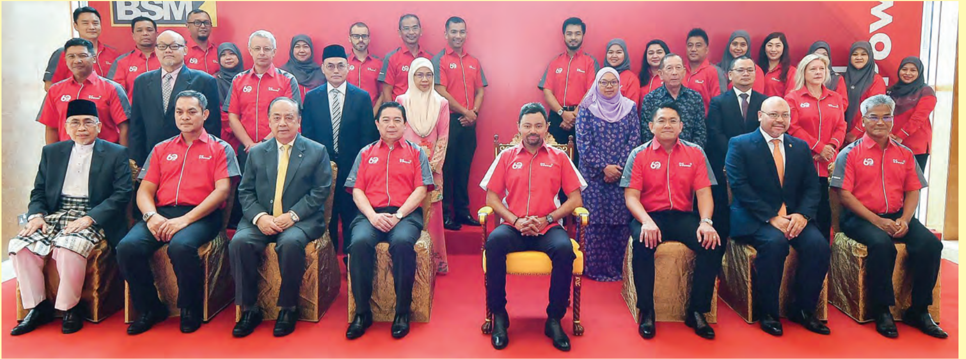
DYTM juga berkenan bergambar ramai bersama para Lembaga Pengarah BSM, pasukan Kepimpinan BSM juga tetamu-tetamu khas.