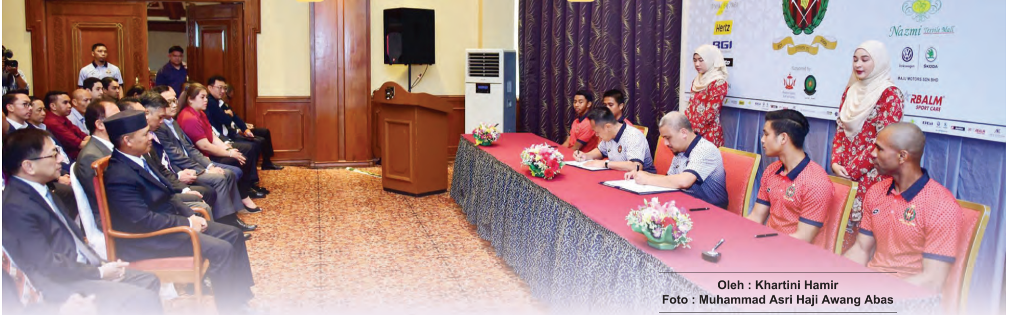
Oleh : Khartini Hamir

YANG Berhormat Menteri Kebudayaan, Belia dan Sukan hadir menyaksikan Majlis Penandatanganan Kontrak Kelab Bola Sepak DPMM bersama pemain-pemain dan penaja-penaja bagi Kejohanan Bola Sepak SPL 2020 yang berlangsung di Hotel Centrepoint, Gadong.