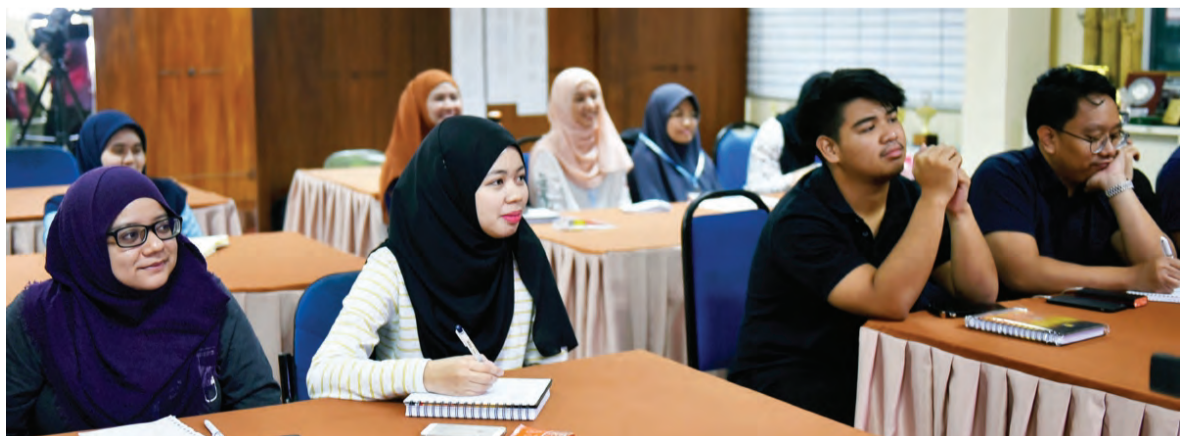
PARA peserta semasa mendengarkan taklimat yang diadakan di Pusat Belia, Bangar Temburong sebagai pengisian program berkenaan.