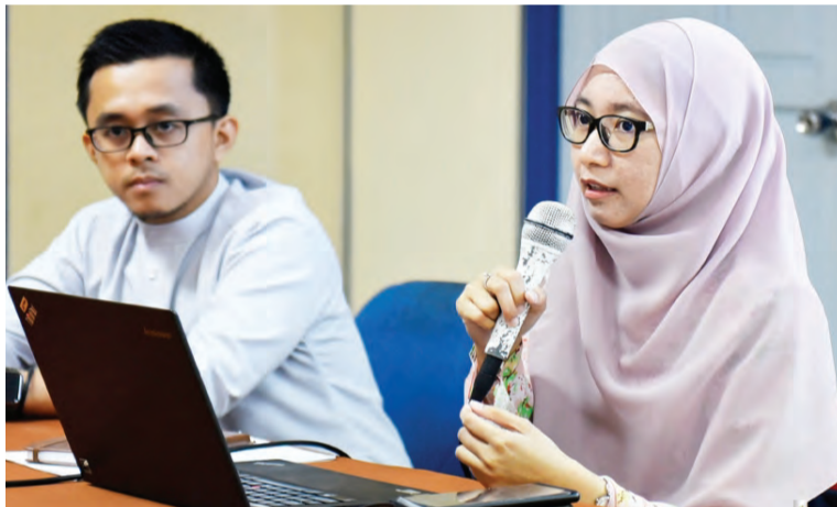
WAKIL Sekretariat Wawasan Brunei 2035 mengongsikan antara contoh yang belia boleh lakukan selaku pewaris masa depan dalam meyakong Wawasan Brunei 2035.

Namun juga diingatkan, dalam mengejar wawasan tersebut supaya kita tidak lupa dengan nilai-nilai teras Melayu Islam Beraja yang menjadi pegangan kita selaku rakyat Negara Brunei Darussalam.