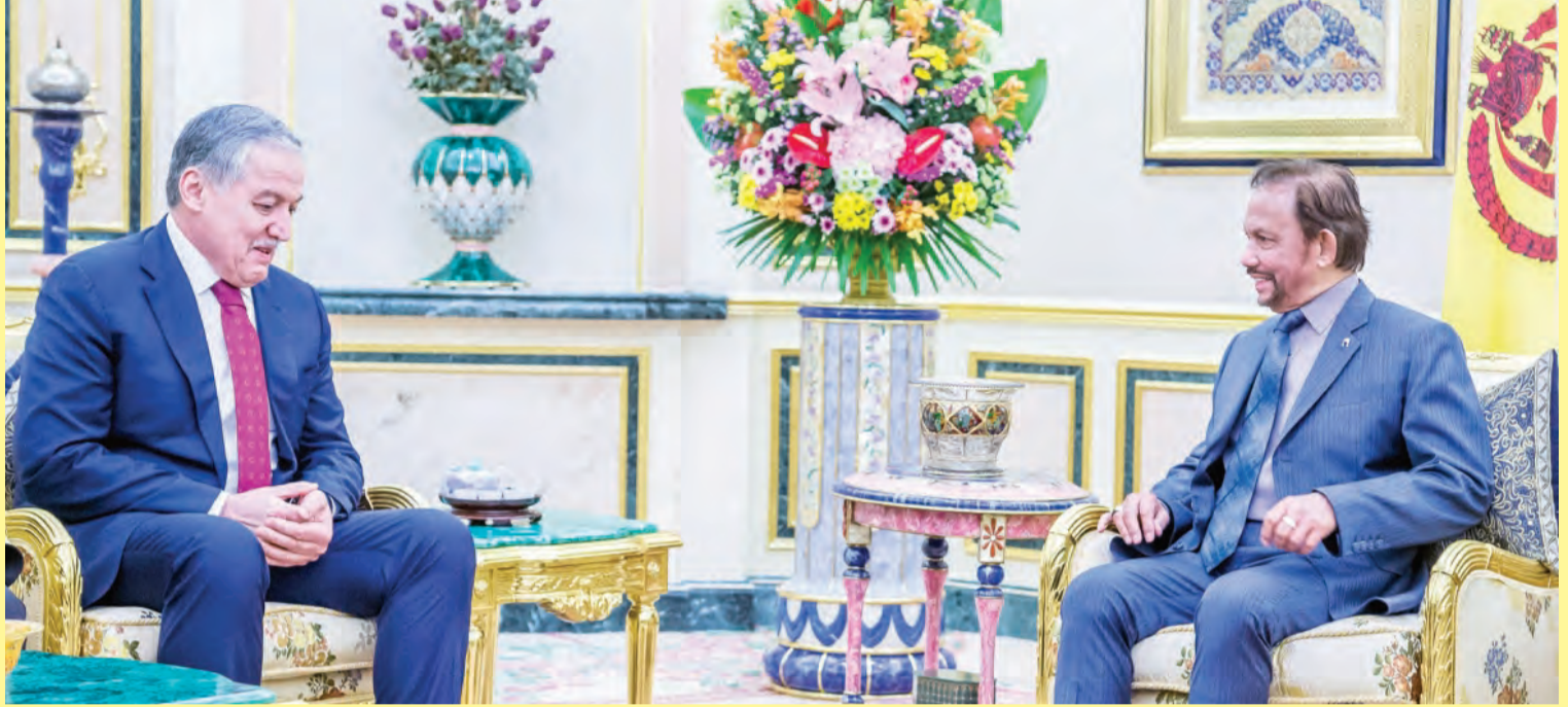
KEBAWAH Duli Yang Maha Mulia Paduka Seri Baginda Sultan Haji Hassanal Bolkiah Mu'izzaddin Waddaulah ibni Al-Marhum Sultan Haji Omar 'Ali Saifuddien Sa'adul Khairi Waddien, Sultan dan Yang Di-Pertuan Negara Brunei Darussalam berkenan menerima mengadap Menteri Hal Ehwal Luar Negeri Republik Tajikistan, Tuan Yang Terutama Sirojiddin Muhriddin.

Kedua-dua pihak juga mengembangkan lagi kerjasama sedia ada dengan memberi tumpuan dalam bidang