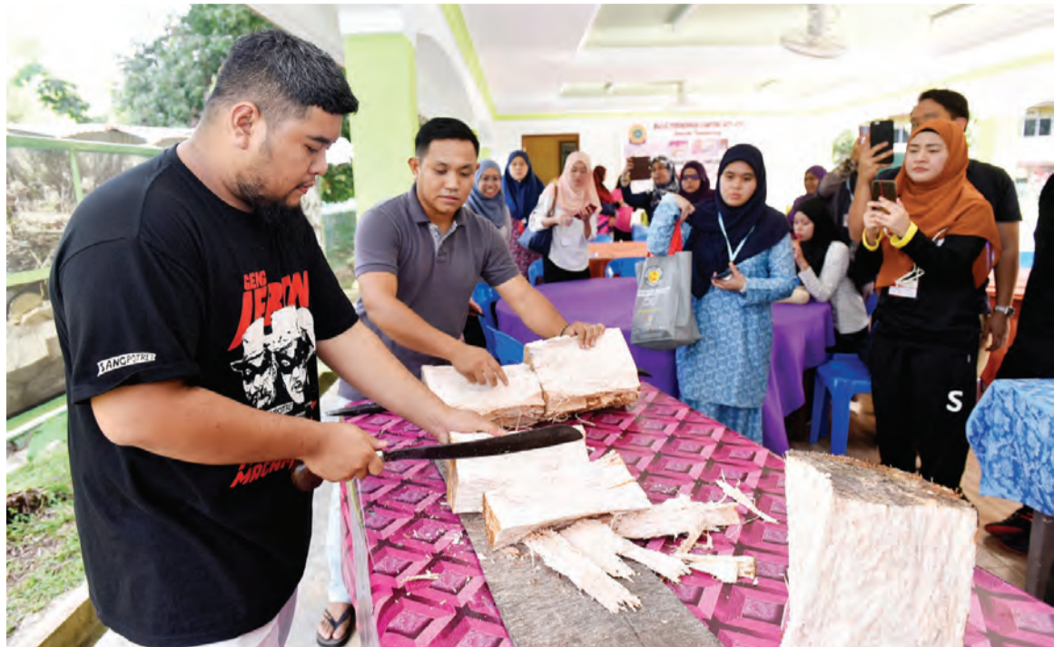
BATANG pohon Rumbia dipotong menjadi saiz kecil yang merupakan bahan asas sebelum ia dikisar bersama air bagi proses pembuatan Ambulong, iaitu produk keluaran Majlis Perundingan Kampung (MPK) Batu Apoi.