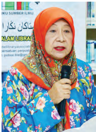
YANG Di-Pertua Persatuan Perpustakaan Negara Brunei Darussalam (BLA) semasa menyampaikan ucapan alu-aluan.

mengingsikan mengenai wujudnya Majlis Penasihat Kandungan (Content Advisory Council) juga talian bantuan bagi aduan isu tular di media sosial 123 yang wujud sejak tahun 2018.