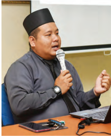
PEGAWAI Adat Istiadat semasa menyampaikan taklimat mengenai 'Terasul dan Bahasa Dalam'.

TEMBURONG, Selasa, 11 Februari. - Sindiket Dadah Antarabangsa menggunakan warga tempatan untuk menjadi keldai dadah, tidak terkecuali menyasarkan kepada penuntut-penuntut yang belajar di luar negeri.