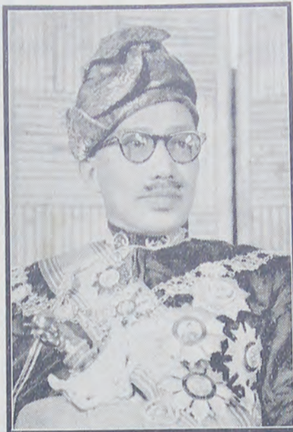
D. Y. M. M.

hir sa-kali di-Johor telah di-langsungkan dalam bulan November, 1895, apabila Almerhum Sultan Ibrahim di-mahkotakan.