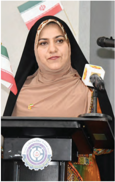
PUAN Yang Terutama Duta Besar Istimewa dan Mutlak Republik Islam Iran ke NBD ketika berucap pada Majlis Sambutan Memperingati Ulang Tahun Kejayaan Hari Kebangsaan Republik Islam Iran Ke-41.