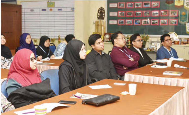
PARA Peserta Perkampungan Sivik Lepas Ijazah semasa mendengarkan taklimat yang disampaikan.

Manakala "Bahasa Dalam" bagi masyarakat Melayu Brunei tradisional sering menyebutnya