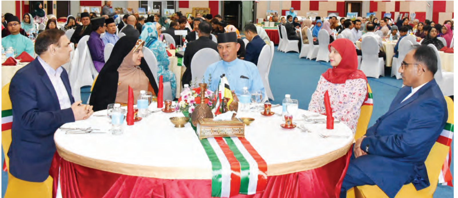
YANG Berhormat Menteri Kebudayaan, Belia dan Sukan dan datin hadir selaku tetamu kehormat pada Majlis Sambutan Memperingati Ulang Tahun Kejayaan Hari Kebangsaan Republik Islam Iran Ke-41, yang berlangsung di Dewan Universiti Teknologi Brunei.