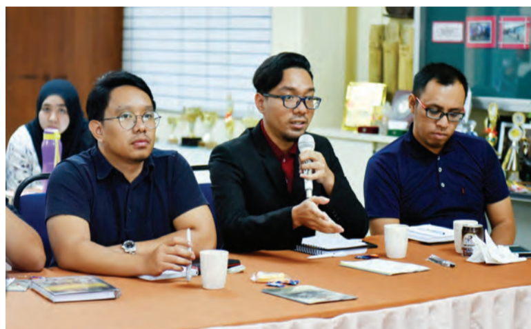
PESERTA Perkampungan Sivik Lepas Ijazah berpeluang mengajukan soalan kepada wakil-wakil agensi yang dijemput untuk memberikan taklimat pada program tersebut.