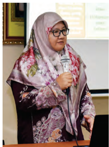
WAKIL Unit Perundangan Islam, Kementerian Hal Ehwal Ugama menyampaikan taklimat mengenai Perintah Kanun Hukum Jenayah Syariah 2013 kepada peserta.

TEMBURONG, Selasa, 11 Februari. - Konsep Melayu Islam Beraja (MIB) merupakan tunjang kepada asuhan pemikiran dan pembentukan sikap kehidupan orang Brunei yang taat beragama, setia kepada raja, serta rajin berusaha dengan meneliti semua sifat dan nilainya secara positif.