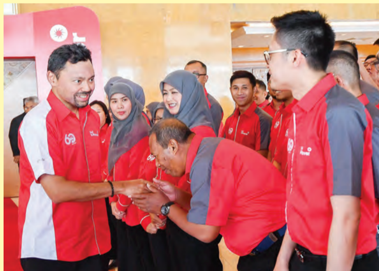
DYTM berkenan menerima junjung ziarah (atas), sementara gambar bawah, DYTM berkenan menyaksikan pameran mengenai faedah Shell V-Power.