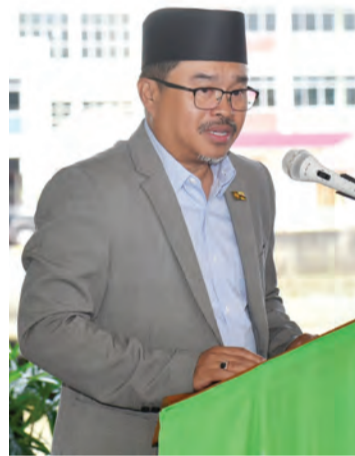
PEMANGKU Pegawai Daerah Temburong menyampaikan ucapan bagi mengalu-alukan rombongan Peserta Perkampungan Sivik Lepas Ijazah.

Para peserta kemudian menyaksikan bahan-bahan pameran dan aktiviti jualan daripada beberapa masyarakat di daerah Temburong yang hadir pada majlis tersebut.