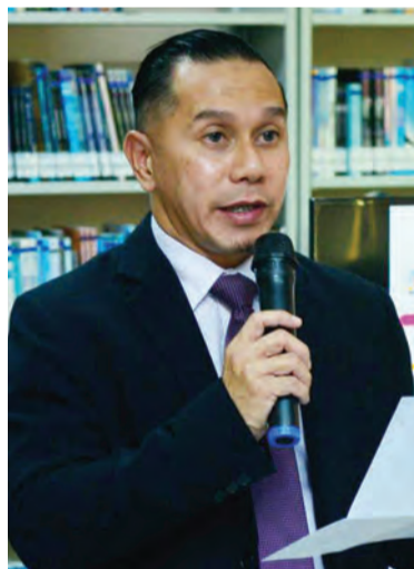
PEMANGKU Ketua Eksekutif, Pihak Berkuasa Info-Komunikasi Teknologi (AITI) semasa berucap pada Seminar Kesedaran Tadbir Urus Internet bagi Perpustakaan.