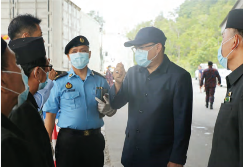
PEMANGKU Pegawai Daerah Temburong ketika menghadiri Operasi Pemeriksaan Suhu Badan di Pos Kawalan Labu, Temburong.