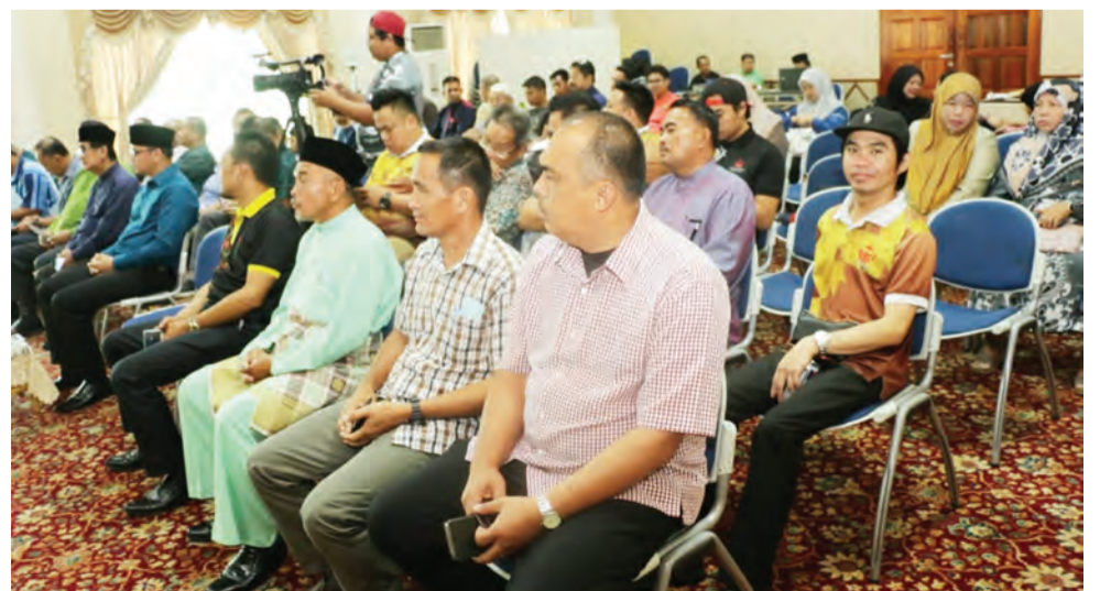
BENGGEL disertai oleh 19 peserta lelaki dan diadakan selama tiga hari bermula hari ini hingga 9 Februari (kiri), sementara gambar kanan, sebahagian daripada yang hadir pada Perasmian Bengkel Permainan Gulintangan Kali Pertama.