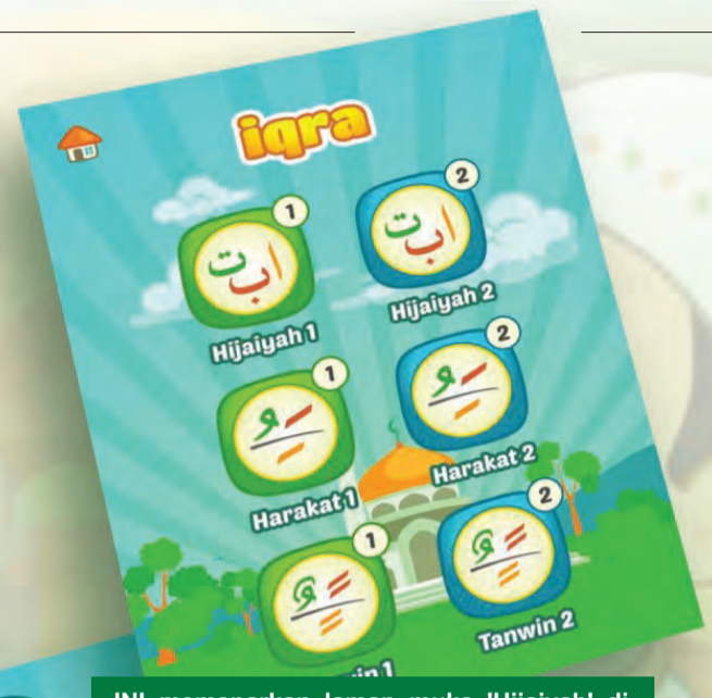
INI memaparkan laman muka 'Hijaiyah' di mana ciri-cirinya adalah pengguna dapat belajar menyebut huruf-huruf 'Hijaiyah' dengan sebutan yang betul.