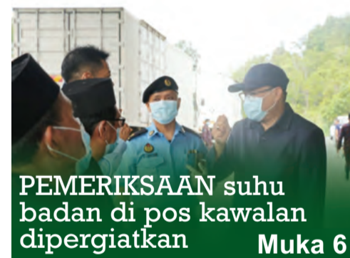
PEMERIKSAAN suhu badan di pos kawalan dipergiatkan Muka 6