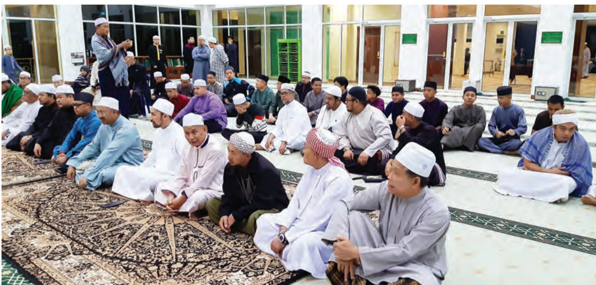
ANTARA jemaah yang hadir mendengarkan Tazkirah Subuh, "Siapa itu Dajjal dan Persiapan Menghadapinya" pada Solat Subuh Berjemaah bagi Program Pejuang Fajr yang berlangsung di Masjid Pengiran Anak Haji Mohamad Alam, Kampung Sengkarai (atas dan bawah).

Program ini merupakan kali kelima diadakan sejak tahun 2019 yang berperanan sebagai satu inisiatif agar menanamkan rasa kebersamaan dan silaturahim dalam kalangan belia Keagamaan dan orang awam serta sebagai medium dakwah kesedaran bagi para belia seluruhnya untuk bangun mengerjakan solat subuh kerana, di samping keistimewaan dalam waktu tersebut, ia juga merupakan solat yang sememangnya sering dan mudah ditinggalkan oleh para belia pada masa ini.