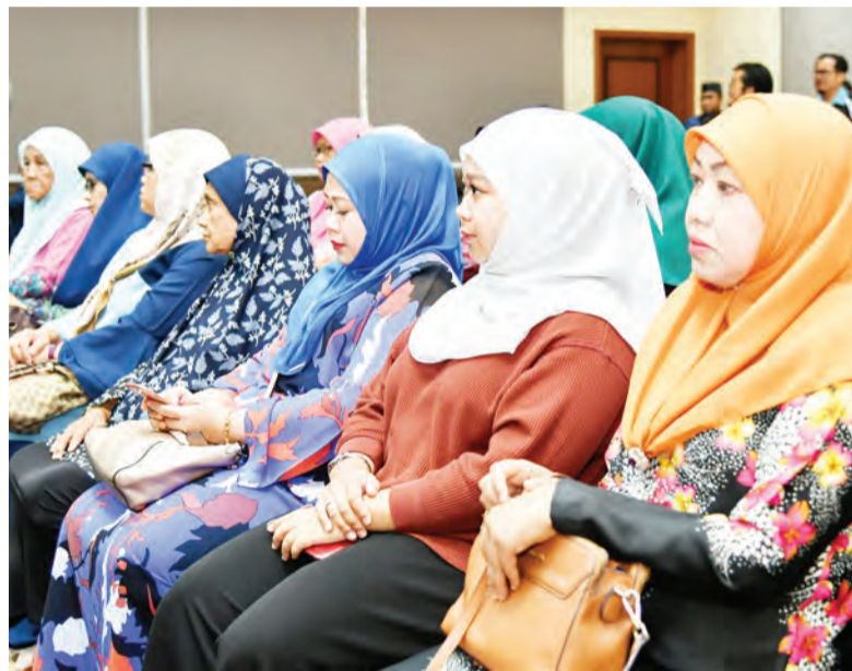
ANTARA mangsa-mangsa banjir yang hadir semasa Majlis Penyerahan Bantuan Kewangan Kerajaan kepada Mangsa Bencana bagi Daerah Brunei dan Muara (kiri dan kiri sekali).