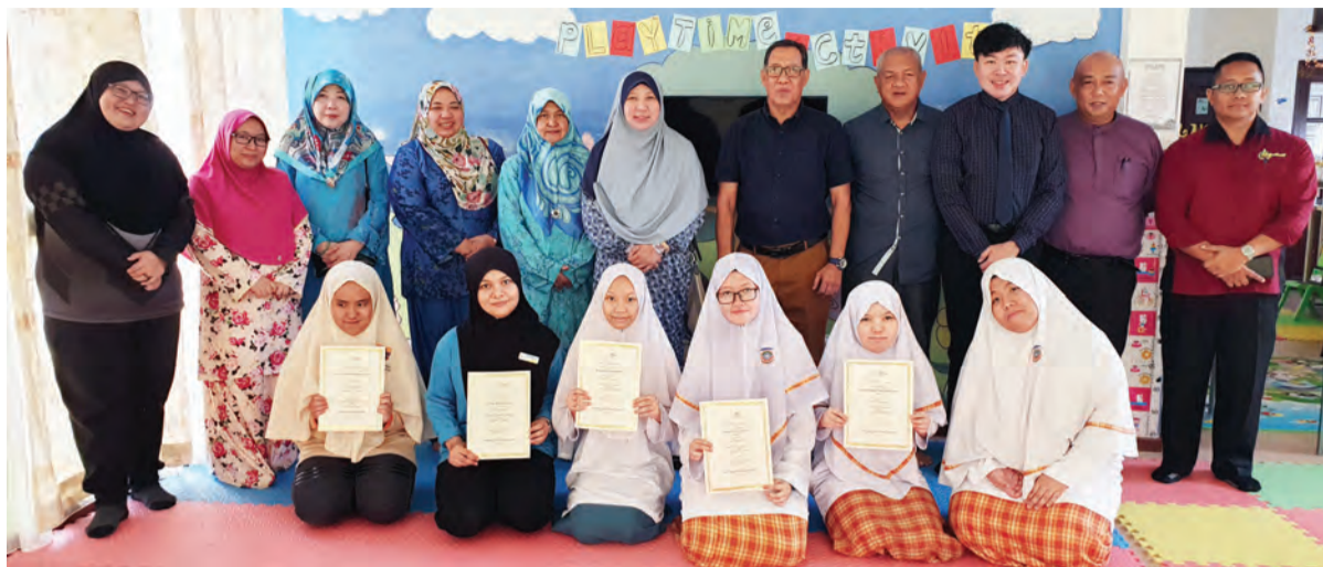
PARA pelajar yang menamatkan penempatan latihan kerja bersama sijil masing-masing pada Majlis Penyampaian Sijil di Little Gems Day Care, Cawangan Lambak.