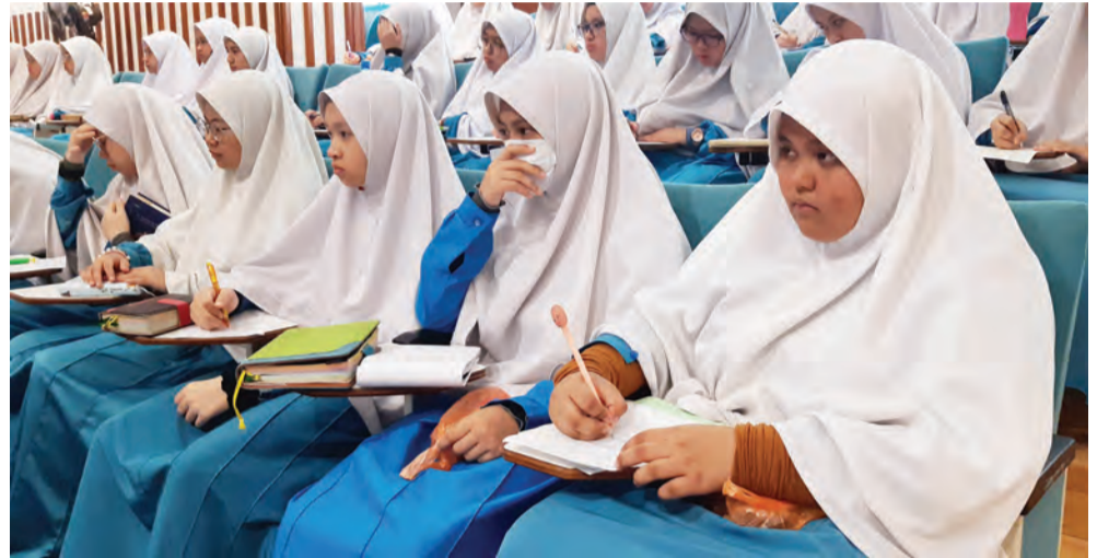
PARA pelajar Institut Tahfiz Al-Quran Sultan Haji Hassanal Bolkiah (ITQSHHB) hadir pada Program Inspirasi dan Motivasi Bagi Pelajar IMPETUS (kiri dan kanan).