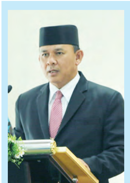
MENTERI Kebudayaan, Belia dan Sukan, Yang Berhormat Mejar Jeneral (B) Dato Paduka Seri Haji Aminuddin Ihsan bin Pehin Orang Kaya Saiful Mulok Dato Seri Paduka Haji Abidin semasa berucap pada Majlis Pelancaran Program Khidmat Bakti Negara (PKBN) Pengambilan Ke-9 pada Sabtu, 10 Rabiulakhir 1441 Hijrah / 7 Disember 2019 Masihi di Kem Latihan PKBN, Batu Apoi, Daerah Temburong.

Dalam tiga bulan yang akan datang ini, kita yakin para pelatih akan menimba pengalaman baharu serta mempelajari teras yang bertujuan untuk mengukuhkan jati diri, membangun ketahanan jasmani, memupuk budi pekerti serta mempertahankan pegangan berteraskan kepada falsafah negara Melayu Islam Beraja. Oleh yang demikian, manfaatkanlah pengalaman ini dengan