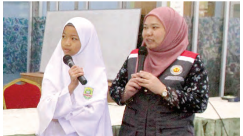
BERSEDIA untuk menjawab soalan yang dikemukakan oleh salah seorang kakitangan Cawangan Penerangan Daerah Tutong.

Dalam taklimat tersebut, beliau antara lain menyentuh mengenai Raja Kita, tatacara menaik-kibarkan bendera negara dan sejarah Lagu Kebangsaan Negara Brunei Darussalam 'Allah Peliharakan Sultan' dengan terperinci. Seramai 38 pelajar dari Tahun 7