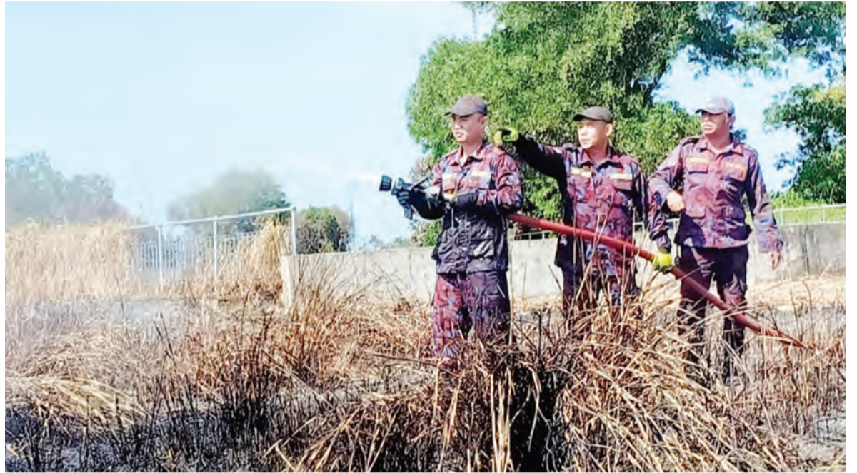
ANGGOTA Jabatan Bomba dan Penyelamat ketika bertindak semasa memadamkan kebakaran belukar.

JBP sentiasa bersiap siaga 24 jam dan sentiasa membuat rondaan dan pemantauan di darat mahupun perairan bagi mengambil langkah-langkah berpatutan bagi mengelakkan perkara yang tidak diingini berlaku di kawasan yang dikenal pasti berisiko tinggi.