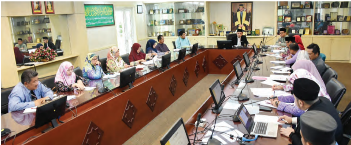
MUZAKARAH Mendaulatkan Tulisan Jawi di Negara Brunei Darussalam yang dipengerusikan oleh Pemangku Timbalan Ra'es Kolej Universiti Perguruan Ugama Seri Begawan (KUPU SB).

Berita dan Foto : Wan Mohamad Sahran Wan Ahmadi