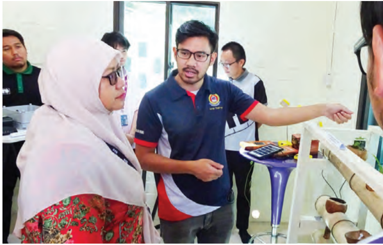
NAIB Canselor Universiti Teknologi Brunei (UTB) mendengarkan penerangan pada Pelancaran semula ITB Low Energy House.

Pelancarannya disempurnakan oleh Naib Canselor UTB, Profesor