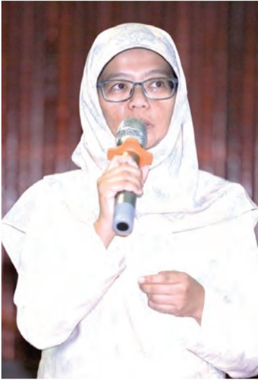
PENOLONG Pegawai Penerangan ketika menyampaikan Taklimat Kenegaraan Raja Kita, Menghayati Bendera dan Lagu Kebangsaan Negara Brunei Darussalam.

BANDAR SERI BEGAWAN , Khamis, 6 Februari. - Jabatan Penerangan, Jabatan Perdana Menteri melalui Unit Kenegaraan, Bahagian Kenegaraan dan Kemasyarakatan kali ini