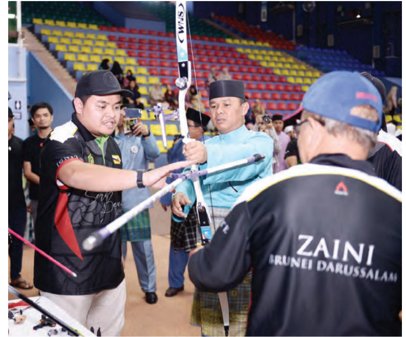
MENTERI Kebudayaan, Belia dan Sukan bersama mantan Penyelia Pusat Belia Pertama, Pengiran Haji Mohammad bin Pengiran Haji Chuchu memotong kek sempena Perasmian Festival Jubli Emas Pusat Belia (kiri). Sementara gambar kanan, Yang Berhormat Menteri Kebudayaan, Belia dan Sukan meneliti busur yang digunakan oleh Ahli-ahli Kelab Memanah Setia Bersatu yang mengadakan pameran pada majlis tersebut.

Berita dan Foto : Hernie Suliana Haji Othman