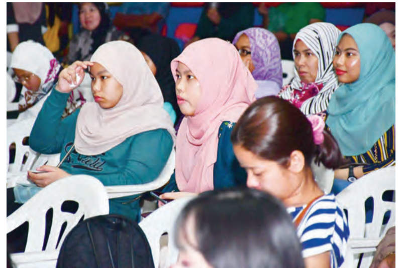
ANTARA yang hadir menyaksikan persembahan tersebut (atas). Sementara gambar kiri, sebahagian daripada persembahan yang diketengahkan oleh para belia kitani.

Berita dan Foto : Ak. Syi'aruddin Pg. Dauddin