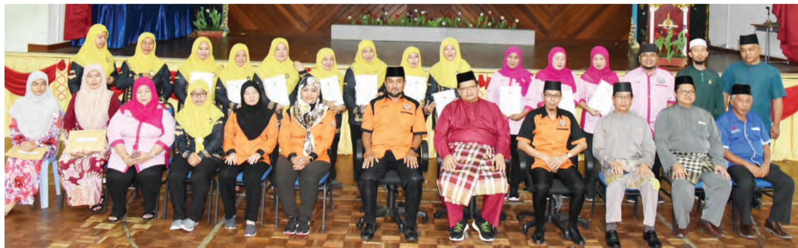
PEGAWAI Daerah Brunei dan Muara (lima, kanan) bergambar kenangan bersama para Ahli baharu Jawatankuasa Tertinggi (AJKT) dan Biro-biro Majlis Perundingan Kampung Rancangan Perumahan Negara (RPN) Kampung Panchor Mengkubau bersama sijil masing-masing pada majlis berkenaan.

AJKT MPK tersebut telah selesai dilantik pada awal bulan September dan disusuli pula dengan pelantikan Biro-biro dan ahli-ahli dengan tarikh yang berasingan.