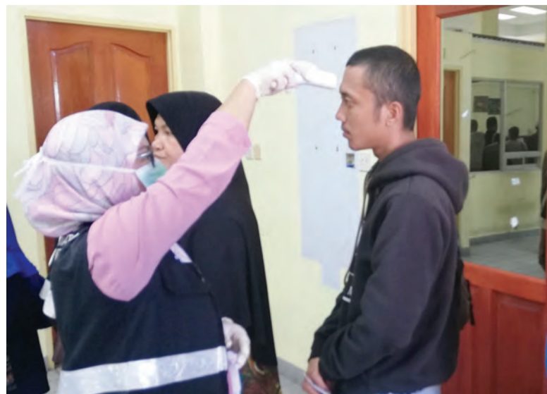
SETIAUSAHA Tetap (Keselamatan, Kesejahteraan dan Undang- Undang), Kementerian Hal Ehwal Dalam Negeri dan Setiausaha Tetap Kementerian Kesihatan hadir menyaksikan Operasi Pemeriksaan Suhu Badan di Pos Kawalan Sungai Tujuh (kiri). Manakala gambar kanan, operasi berkenaan adalah untuk memantau kemasukan orang luar melalui Pos Kawalan Sungai Tujuh.

Berita dan Foto : Noraisah Haji Muhammed