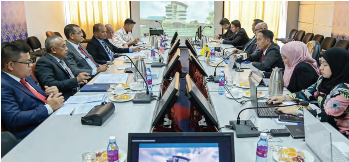
MESYUARAT dua hala di antara Jabatan Pengangkutan Darat (JPD) Negara Brunei Darussalam dan Jabatan Pengangkutan Jalan (JPJ) Negara Malaysia.

Berita dan Foto : Mohamad Azmi Awang Damit