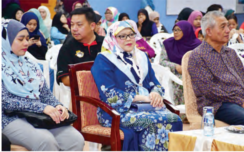
TIMBALAN Setiausaha Tetap (Kebudayaan), Kementerian Kebudayaan, Belia dan Sukan ketika hadir selaku tetamu kehormat pada acara 'Traditional Gulintangan Fusion Night'.

BANDAR SERI BEGAWAN, Jumaat, 7 Februari. - Dalam usaha untuk mengetengahkan bakat-bakat belia dalam bidang seni dan kebudayaan, Festival Jubli Emas Pusat Belia diteruskan lagi dengan acara 'Traditional Gulintangan Fusion Night' yang diadakan di Pusat Belia, Bandar Seri Begawan, di sini.