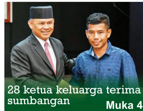
28 ketua keluarga terima sumbangan Muka 4