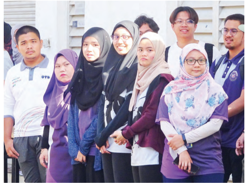
ANTARA yang hadir memeriahkan majlis itu (atas), sementara gambar bawah, ITB Low Energy House terletak di Blok Kejuruteraan, Fasa 1, UTB.

ITB Low Energy House yang terletak di Blok Kejuruteraan, Fasa 1, UTB itu dibina pada tahun 2005 bagi kerja penyelidikan mengenai teknologi tenaga rendah, terutama dalam penggunaan tenaga solar dan material pembinaan bertenaga rendah.