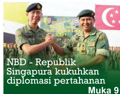
NBD - Republik Singapura kukuhkan diplomasi pertahanan Muka 9