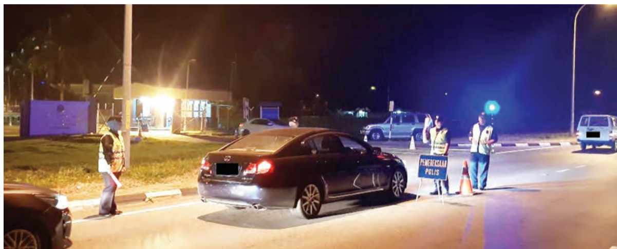
SUASANA Operasi Sekatan Jalan Raya yang dijalankan di kawasan Jalan Tengah Seria, Panaga.

PPDB akan sentiasa berterusan mengadakan operasi sedemikian bagi kepentingan para pengguna jalan raya untuk patuh pada undang-undang jalan raya, di samping meningkatkan usaha kesedaran terhadap kemalangan lalu lintas yang mungkin berpunca daripada kecauaan pemandu sendiri.