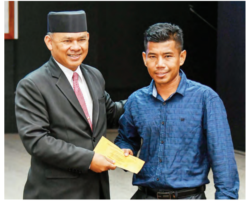
YANG Berhormat Menteri Kebudayaan, Belia dan Sukan (kiri) semasa menyampaikan bantuan kewangan kepada mangsa bencana banjir.

Beliau turut menyentuh bahawa pihaknya menyedari akan kepentingan bagi mempercepatkan pengagihan bantuan-bantuan kewangan ini dan sedang berusaha untuk mengemas kini