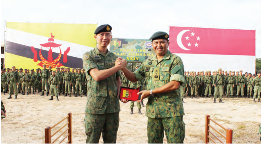
PANGLIMA Tentera Darat Singapura dan Pemerintah Tentera Darat Diraja Brunei (TDDB) bertukar-tukar cenderahati semasa Upacara Penutup Ekseksais MAJU BERSAMA Siri 24 / 2020 (atas), sementara gambar kanan, upacara dimulakan dengan pemeriksaan perbarisan.