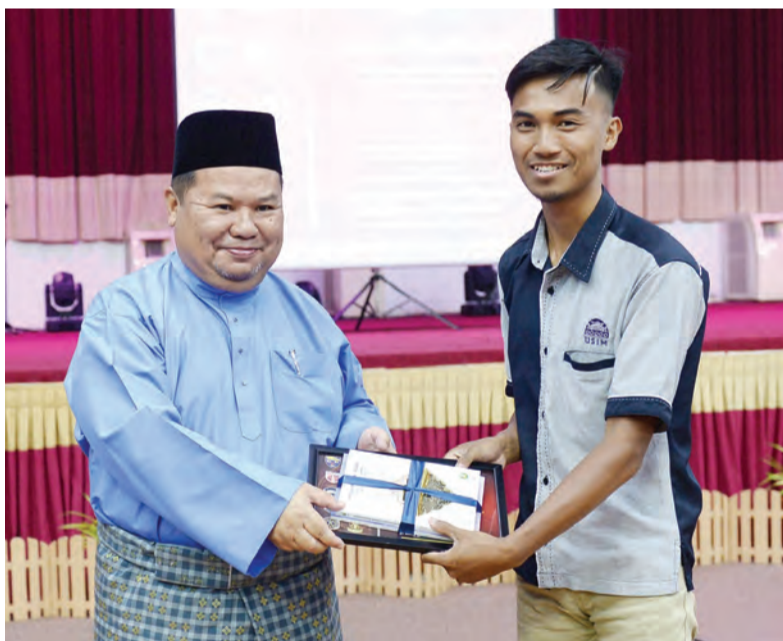
SETIAUSAHA Tetap Kementerian Hal Ehwal Ugama (kiri) menyampaikan cenderahati kepada wakil universiti serantau yang menyertai Perkhemahan Bahasa Arab Serantau Kali Pertama tersebut.

Orang ramai bolehlah berhubung terus ke Bahagian Perhubungan Awam Ibu Pejabat Bomba dan Penyelamat melalui talian +673 2382860 atau +673 2380409 sambungan 111 semasa waktu pejabat.