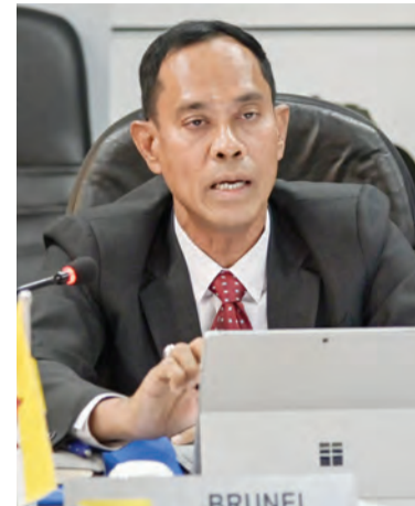
PENGARAH JPD Negara Brunei Darussalam.

Selain itu, kerjasama strategik ini diharap akan dapat mengongsikan perkembangan-perkembangan terkini mengenai dasar pengangkutan, perjalanan atau mobiliti kenderaan-kenderaan