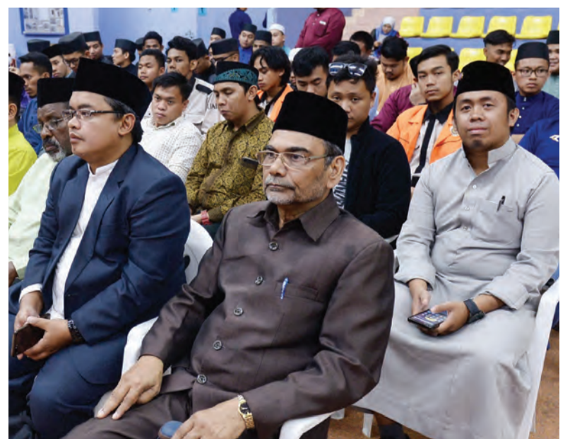
SEBAHAGIAN daripada tenaga akademik dan peserta lelaki dari universiti-universiti yang menyertai Perkhemahan Bahasa Arab Serantau Kali Pertama berkenaan.