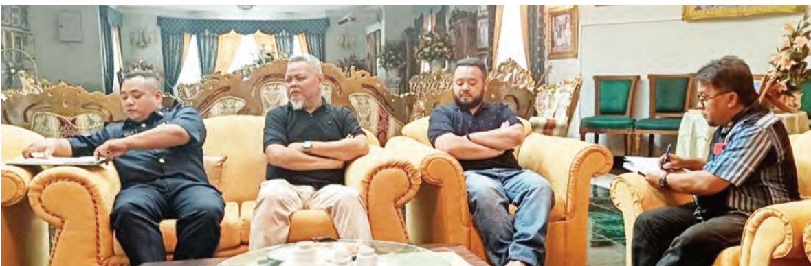
BEBERAPA buah kampung di negara ini giat mengikut aktiviti di bawah Program PK anjuran PPDB yang menurus kepada pendekatan dan rondaan pencegahan jenayah.

Diharap dengan pendekatan sedemikian dapat mewujudkan dan mempertingkatkan lagi perhubungan silaturahim dalam kalangan masyarakat awam bagi memberikan kefahaman