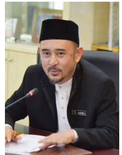
PEMANGKU Timbalan Ra'es Kolej Universiti Perguruan Ugama Seri Begawan (KUPU SB) semasa berucap.

Berkaitan dengan kitab Turath, pusat berkenaan bermatlamat untuk menyediakan khidmat kitab Turath bagi semua pelajar dan orang ramai, menjalankan