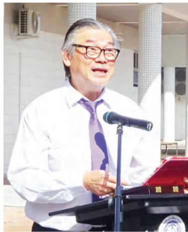
PENGARAH Pusat Kejuruteraan Inovatif (CIE), UTB.