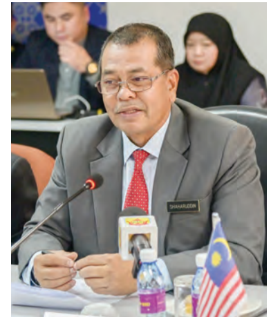
KETUA Pengarah JPJ Negara Malaysia.

pengangkutan, seterusnya diharap akan dapat memantapkan lagi pentadbiran sektor pengangkutan di antara kedua-dua negara.