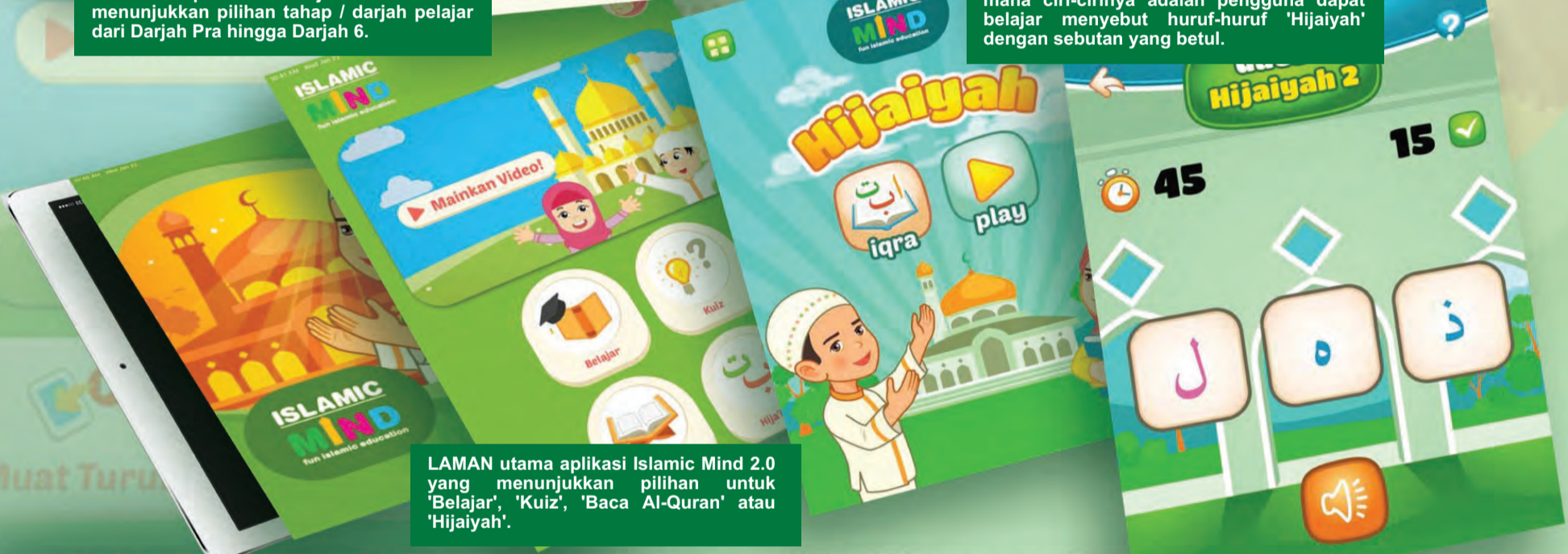
LAMAN utama aplikasi Islamic Mind 2.0 yang menunjukkan pilihan untuk 'Belajar', 'Kuiz', 'Baca Al-Quran' atau 'Hijaiyah'.