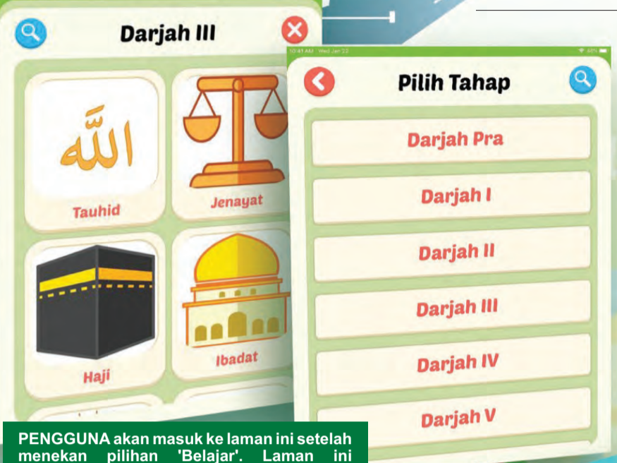
PENGGUNA akan masuk ke laman ini setelah menekan pilihan 'Belajar'. Laman ini menunjukkan pilihan tahap / darjah pelajar dari Darjah Pra hingga Darjah 6.

Artikel dan Foto : Mindplus Education Sdn. Bhd.