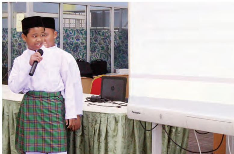
ANTARA yang menghadiri Taklimat Kenegaraan Raja Kita, Menghayati Bendera dan Lagu Kebangsaan Negara Brunei Darussalam di Ma'had Islam Brunei (kiri). Manakala gambar kanan, antara pelajar Tahun 7 sekolah tersebut yang menyertai sesi Kuiz Kenegaraan.