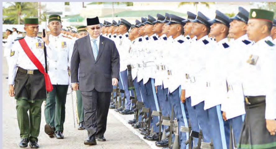
SETIAUSAHA Tetap (Media dan Kabinet) di Jabatan Perdana Menteri memeriksa perbarisan terdiri daripada Rekrut Lelaki Pengambilan Ke-165 di Padang Kawad, Institut Latihan Angkatan Bersenjata Diraja Brunei (ABDB), Penanjong Garison.

Oleh : Nooratini Haji Abas