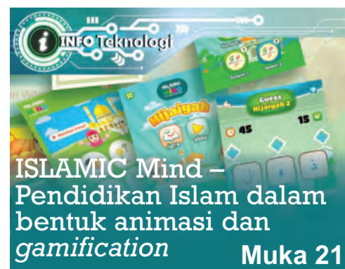
ISLAMIC Mind - Pendidikan Islam dalam bentuk animasi dan gamification Muka 21