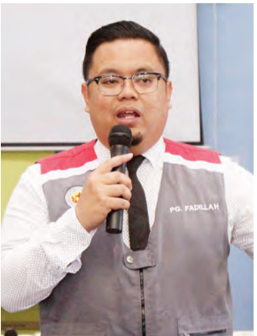
PENOLONG Pegawai Penerangan selaku Ketua Cawangan Penerangan Daerah Tutong ketika menyampaikan taklimat.

Siaran Akhbar : Jabatan Penerangan