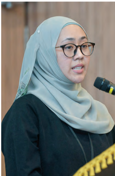
TAKLIMAT disampaikan oleh salah seorang wakil daripada DARE.