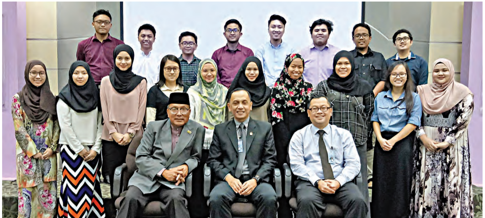
PENULIS bergambar kenangan bersama Pengarah dan Pegawai Kanan Bahagian Biasiswa Kementerian Pendidikan serta pelajar-pelajar yang mendapat biasiswa ke United Kingdom, Australia dan New Zealand.

Baginda tidak jemu-jemu mengingatkan para pelajar Brunei khususnya yang berada di luar negara dan generasi muda masa kini umumnya untuk mengamalkan dan menghayati nilai-nilai MIB yang menjadi calak keBruneian. Ini adalah kerana generasi muda adalah pewaris bangsa Brunei masa akan datang yang menentukan