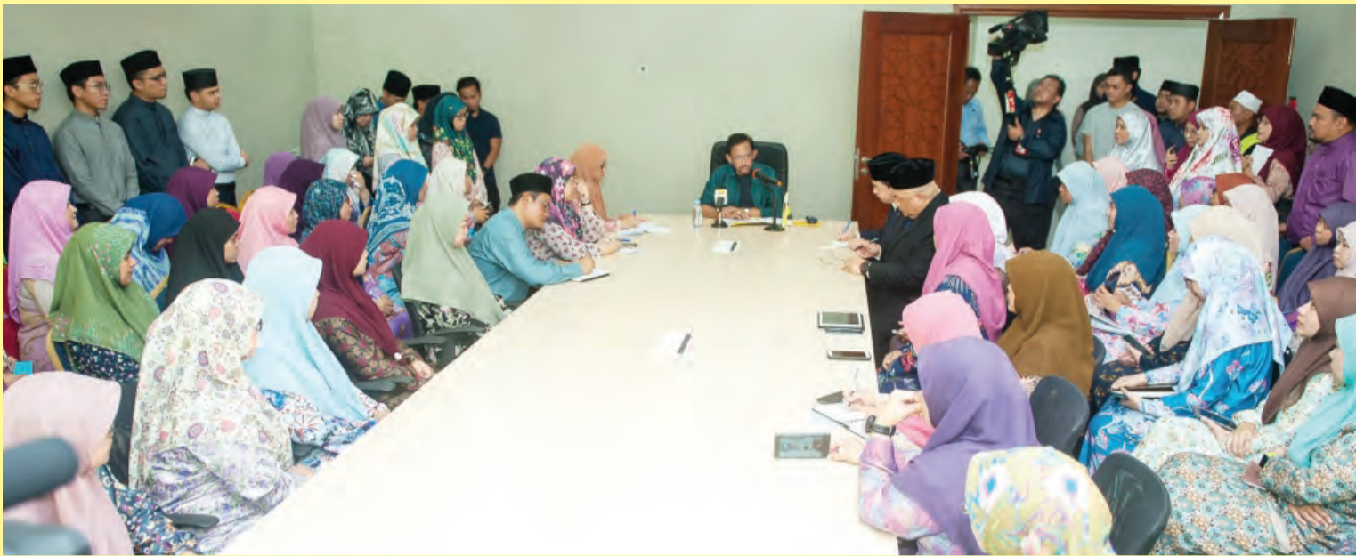
KEBAWAH Duli Yang Maha Mulia Paduka Seri Baginda Sultan Haji Hassanal Bolkiah Mu'izzaddin Waddaulah ibni Al-Marhum Sultan Haji Omar 'Ali Saifuddien Sa'adul Khairi Waddien, Sultan dan Yang Di-Pertuan Negara Brunei Darussalam berkenan mengadakan Sesi Muzakarah bersama guru-guru Sekolah Menengah Arab Rimba.