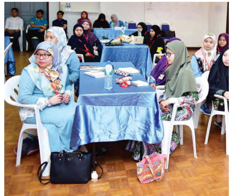
PARA peserta Program Perkampungan Sivik Lepas Ijazah Negara Brunei Darussalam Kali Pertama 2019 semasa mendengarkan taklimat.

mengenai Raja Kita, tatacara menaik-kibarkan bendera negara dan sejarah Lagu Kebangsaan Negara Brunei Darussalam 'Allah Peliharakan Sultan' dengan terperinci.