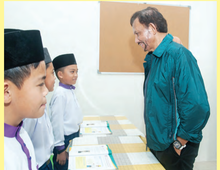
KEBAWAH Duli Yang Maha Mulia berkenan beramah mesra dengan para pelajar Sekolah Menengah Arab Rimba (atas). Sementara gambar bawah kiri, Kebawah DYMM berkenan bergambar ramai bersama tenaga pengajar sekolah tersebut. Manakala gambar bawah kanan, baginda ketika berangkat meninjau Sekolah Menengah Arab Rimba.