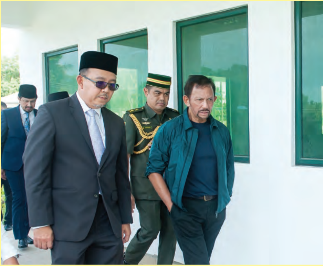
KEBAWAH Duli Yang Maha Mulia Paduka Seri Baginda Sultan Haji Hassanal Bolkiah Mu'izzaddin Waddaulah ibni Al-Marhum Sultan Haji Omar 'Ali Saifuddien Sa'adul Khairi Waddien, Sultan dan Yang Di-Pertuan Negara Brunei Darussalam ketika berangkat ke tapak Sekolah Ugama Lambak Jalan Bedil baharu yang sedang dalam pembinaan (atas, atas kanan dan bawah kiri).