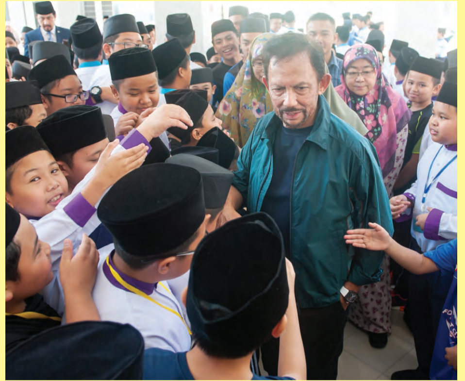
KEBAWAH Duli Yang Maha Mulia Paduka Seri Baginda Sultan Haji Hassanal Bolkiah Mu'izzaddin Waddaulah ibni Al-Marhum Sultan Haji Omar 'Ali Saifuddien Sa'adul Khairi Waddien, Sultan dan Yang Di-Pertuan Negara Brunei Darussalam ketika berkenan berangkat ke Sekolah Menengah Arab Rimba (kiri). Sementara gambar kanan, Kebawah Duli Yang Maha Mulia berkenan menerima junjung ziarah daripada para pelajar Sekolah Menengah Arab Rimba.