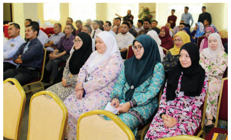
ANTARA yang hadir semasa taklimat mengenai bahaya penyalahgunaan dadah bagi warga Kementerian Hal Ehwal Dalam Negeri.

Tajuk-tajuk akan datang : 1) 'Senyum' - Tarikh Tutup : 9 Februari 2019 2) 'Bendera atau Anak Merdeka' - Tarikh Tutup : 23 Februari 2019 3) 'Suasana Sambutan Hari Kebangsaan' - Tarikh Tutup : 9 Mac 2019 Kesemua tajuk-tajuk hendaklah dihantar sebelum jam 12.00 tengah hari pada tarikh-tarikh berkenaan.