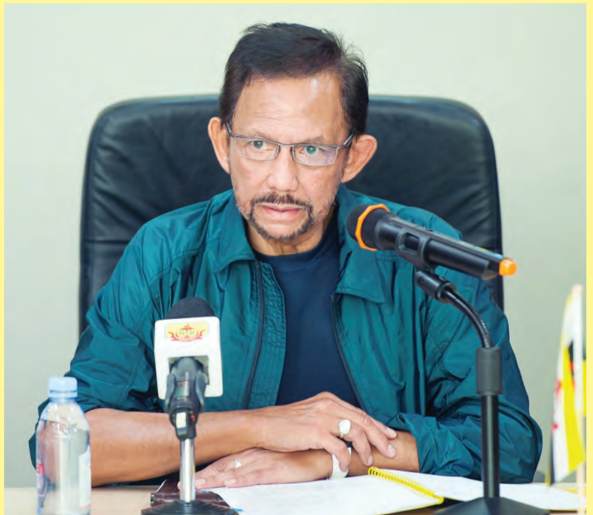
KEBAWAH Duli Yang Maha Mulia Paduka Seri Baginda Sultan Haji Hassanal Bolkiah Mu'izzaddin Waddaulah ibni Al-Marhum Sultan Haji Omar 'Ali Saifuddin Sa'adul Khairi Waddien, Sultan dan Yang Di-Pertuan Negara Brunei Darussalam berkenan mengurniakan titah semasa berangkat ke Sekolah Menengah Arab Rimba. (Lihat muka 3, 4 dan 5).