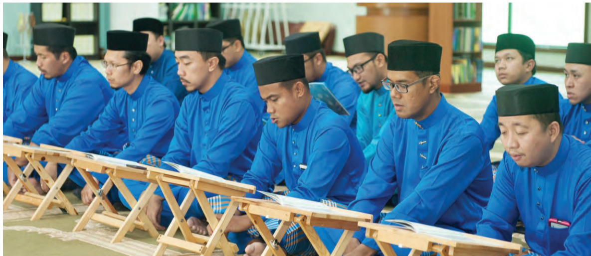
SEBAHAGIAN warga TAP yang ikut serta dalam Majlis Khatam Al-Quran tersebut (kanan).