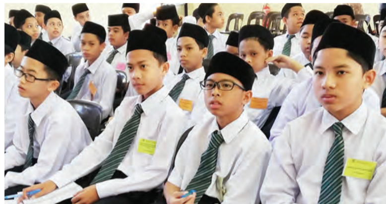
ANTARA pelajar Sekolah Menengah Perdana Wazir, Kuala Belait yang mendengarkan taklimat tersebut.

menyertai Kuiz Kenegaraan yang dikendalikan oleh Jabatan Penerangan. Taklimat diakhiri dengan penyampaian hadiah kepada para penuntut yang berjaya menjawab Kuiz Kenegaraan.