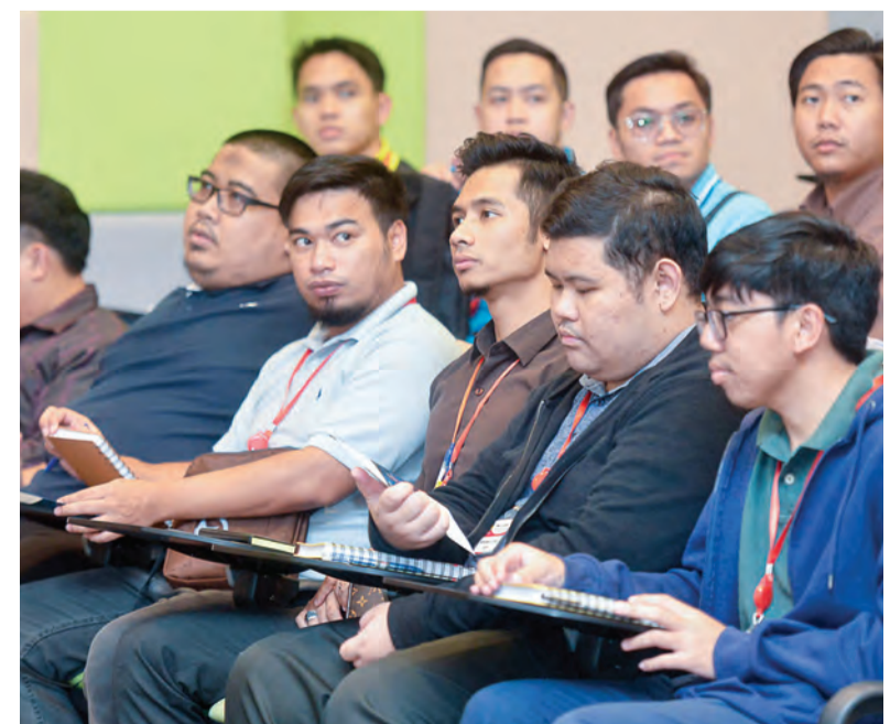
PARA peserta semasa mendengarkan taklimat.