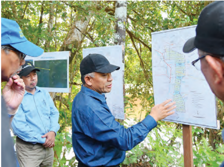
MENTERI Sumber-Sumber Utama dan Pelancongan, Yang Berhormat Dato Seri Setia Awang Haji Ali bin Haji Apong, menerangkan kawasan-kawasan yang diperuntukkan bagi kawasan komersial pertanian di Daerah Belait kepada rombongan Yang Berhormat Ahli-Ahli Majlis Mesyuarat Negara.

LABI, KUALA BELAIT , Selasa, 29 Januari. - Empat tapak perusahaan pertanian di Daerah Belait menjadi lokasi tumpuan siri lawatan Yang Berhormat Ahli-Ahli Majlis Mesyuarat Negara (MMN) hari ini sebagai lanjutan dari siri lawatan yang kedua, pada Sabtu, 26 Januari 2019 yang lalu.