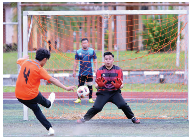
KEMENANGAN bagi pasukan Belia Masjid Rancangan Perumahan Negara Rataie dicapai melalui sepakan penalti dengan mendahului pasukan Belia Masjid Sultan Sharif Ali, Sengkurong.

Sementara itu, pada perlawanan lain pasukan Wijaya FC tumpas di tangan pasukan Kota Ranger FC dengan keputusan berakhir 3 - 0 yang berlangsung di Padang dan Balapan, Kompleks Sukan Negara Hassanul Bolkih.