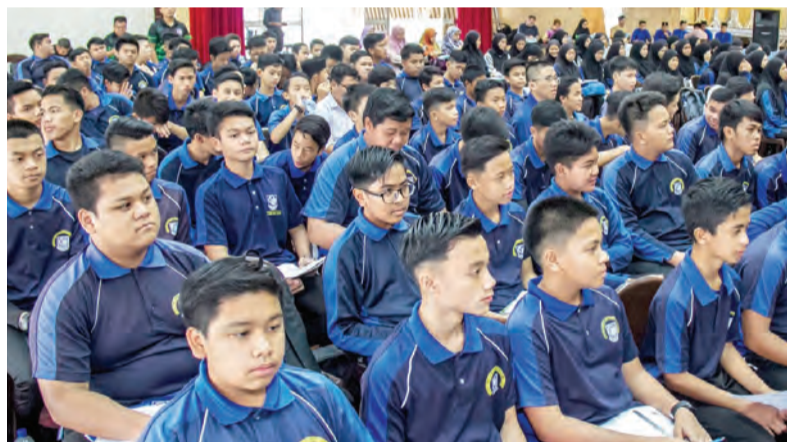
PARA Pelajar Tahun 9 dan 10 yang mengikuti program tersebut.

Para pelajar turut dihiburkan dengan lawak jenaka dan Kuiz RRP Jabatan Penerangan dan diakhiri dengan penyampaian hadiah kuiz dan cenderahati.