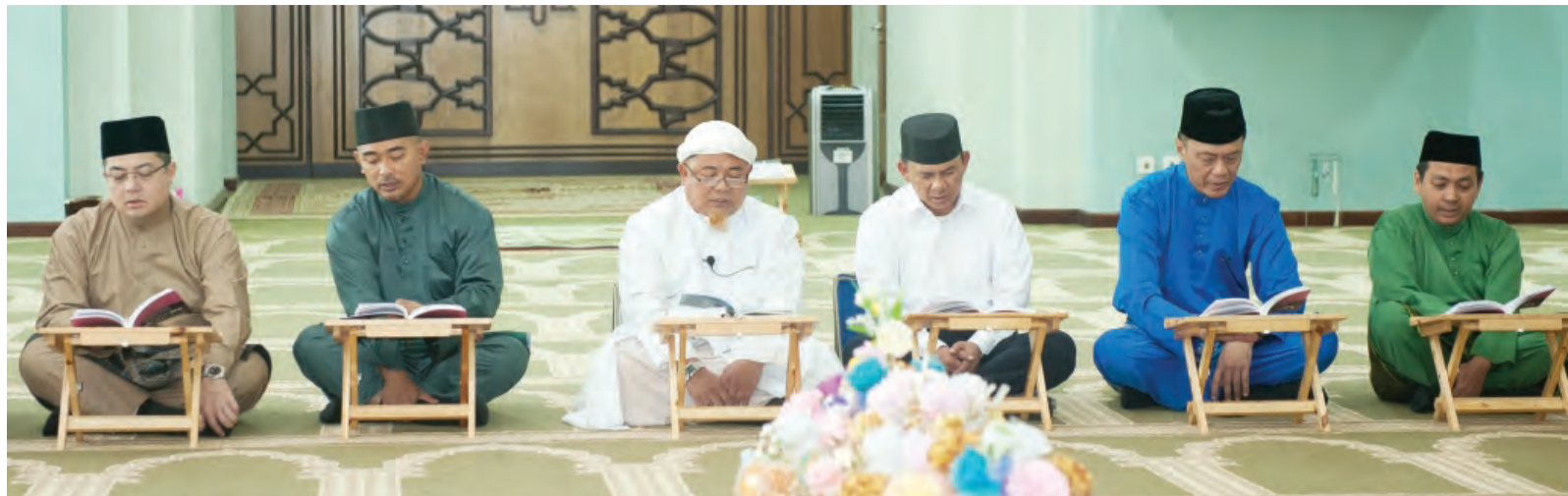
MENTERI Kebudayaan, Belia dan Sukan, Yang Berhormat Mejar Jeneral (B) Dato Paduka Seri Haji Aminuddin Ihsan bin Pehin Orang Kaya Saiful Mulok Dato Seri Paduka Haji Abidin, selaku Pengerusi Lembaga Pengarah Tabung Amanah Pekerja (TAP) (tiga, kanan) semasa hadir selaku tetamu kehormat pada Majlis Doa Kesyukuran dan Sembahyang Sunat Hajat di Masjid Pengiran Muda 'Abdul Malek, Kampung Tungku, Katok.

Majlis diselenggarakan dengan penyampaian wakaf untuk masjid berkenaan hasil sumbangan daripada pegawai dan kakitangan TAP.