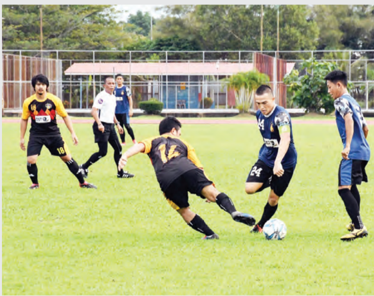
SEBAHAGIAN aksi perlawanan di antara pasukan Majlis Sukan Angkatan Bersenjata Diraja Brunei (MS ABDB) menentang pasukan Setia Perdana FC pada siri Perlawanan Liga Super Brunei DST 2018.

Berita dan Foto : Ak. Syi'aruddin Pg. Daudin