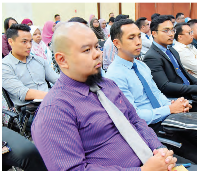
SEBAHAGIAN graduan tempatan yang terpilih menjadi Guru-Guru Tempatan Berkontrak.

Selain itu, ianya juga diharap akan dapat memberikan kefahaman mengenai misi, visi, fungsi dan peranan Kementerian Pendidikan, serta untuk memberi pendedahan dan kefahaman yang jelas dengan profesionalisme sebagai Guru Bahasa Inggeris dan Matematik dalam mendukung Wawasan Negara 2035 khususnya dalam pendidikan literasi dan numerasi.