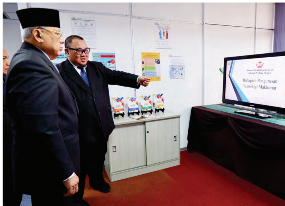
YANG Berhormat Menteri di JPM diberikan penerangan ringkas mengenai peranan Bahagian Pengurusan Teknologi Maklumat di JPA (kiri). Sementara gambar kanan Yang Berhormat melancarkan Projek Digitasi Rekod Perkhidmatan Warga Perkhidmatan Awam; Buku Garispanduan dan Tatacara Pelaksanaan Pengauditan Tenaga Manusia Perkhidmatan Awam bagi Agensi-Agensi Kerajaan Negara Brunei Darussalam; dan Buku Panduan Latihan Dalam Perkhidmatan.