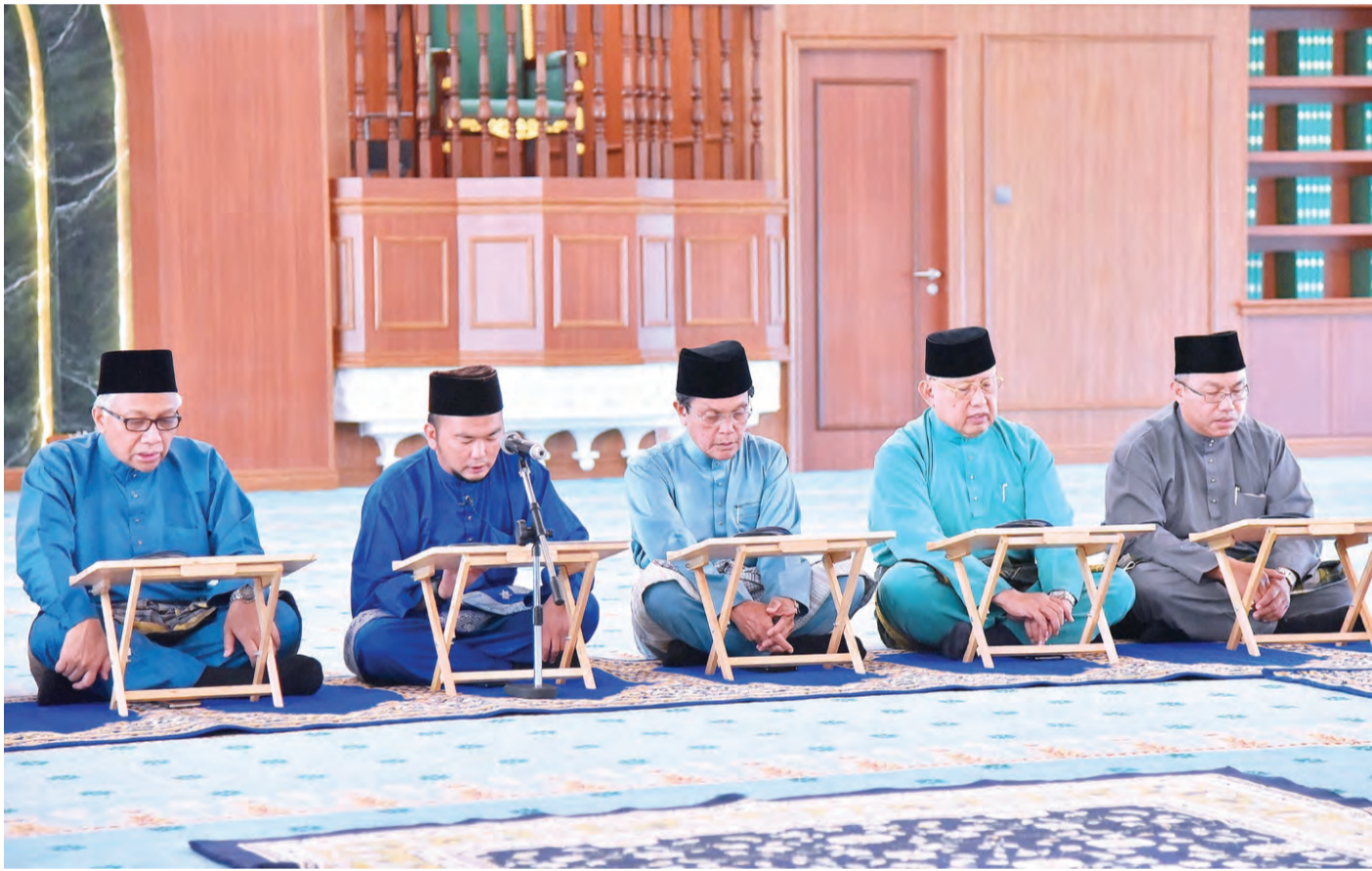
Oleh : Wan Mohamad Sahran Wan Ahmadi

MENTIRI, Selasa, 8 Januari. - Autoriti Monetari Brunei Darussalam (AMBD) mencapai ulang tahun kelapan. Sehubungan itu, Majlis Doa Kesyukuran bagi memperingati penubuhannya diadakan di Masjid Hassanal Bolkiah, Kampung Perpindahan Mentiri di sini.