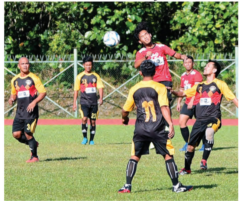
REBUTAN bola di antara pemain pasukan Setia Perdana (jersi kuning) dengan pemain pasukan IKLS FC (jersi merah) pada Perlawanan Liga Super Brunei DST 2018 dan antara aksi perlawanan di antara pasukan Setia Perdana dengan pasukan IKLS FC (kiri dan kanan).

Oleh : Dk. Vivv Malessa Pg. Ibrahim