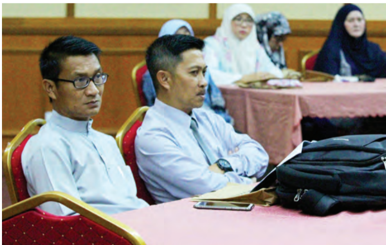
BENGGEL Penyuntingan Disertasi Buku 2019 disertai oleh para pegawai dan kakitangan dan jabatan di bawah Kementerian Kebudayaan, Belia dan Sukan.