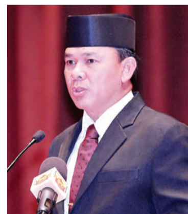
MENTERI Kebudayaan, Belia dan Sukan, Yang Berhormat Mejar Jeneral (B) Dato Paduka Seri Haji Aminuddin Ihsan bin Pehin Orang Kaya Saiful Mulok Dato Seri Paduka Haji Abidin berucap pada majlis tersebut.

Menyentuh tentang tema sambutan kali ini iaitu 'Memperkasakan Orang Kelainan Upaya Dan Memastikan Penglibatan dan Kesaksamaan', Yang Berhormat menerangkan bahawa ianya amatlah sejajar