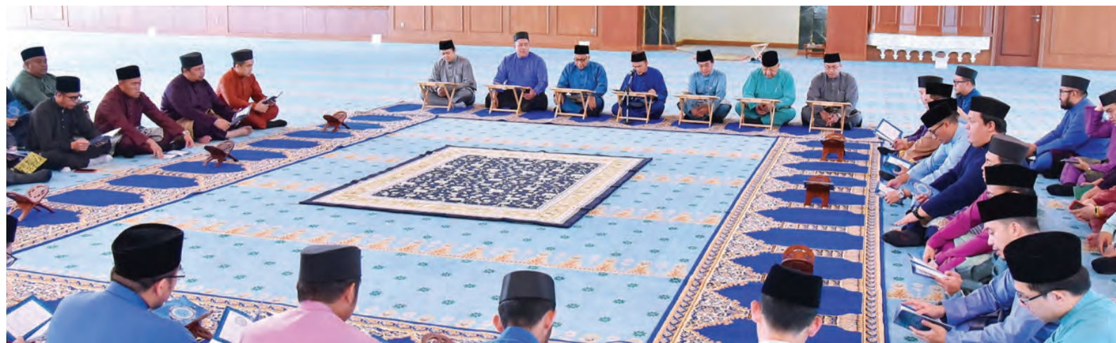
MAJLIS Doa Kesyukuran Sempena Ulang Tahun Ke-8 Penubuhan Autoriti Monetari Brunei Darussalam (AMBD) diimarahkan dengan bacaan Surah Yaa Siin dan Tahliil yang berlangsung di Masjid Hassanal Bolkiah, Kampung Perpindahan Mentiri.

Penggunaan Direct Credit Transfer dalam sistem ACH yang telah beroperasi mulai Februari 2017 telah menyumbang kepada pengurangan penggunaan cek fizikal sebanyak 18 peratus pada tahun ini berbanding tahun 2016. Nilai cek yang diproses pada tahun 2018 berbanding dengan tahun sebelumnya juga dijangka