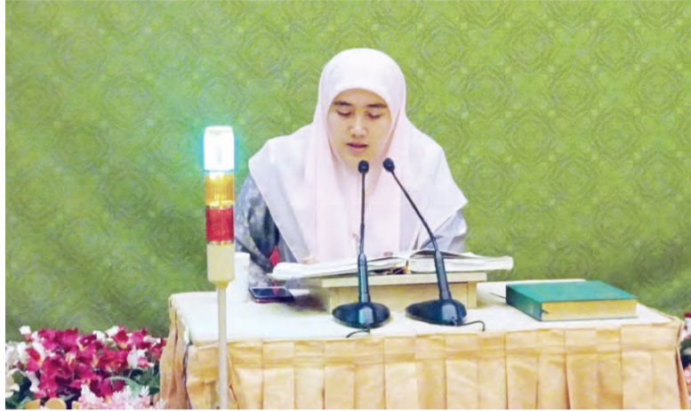
Berita dan Foto : Marlinawaty Hussin

PESERTA qari dan qariah memperdengarkan bacaan Al-Quran mereka pada Musabaqah Membaca Al-Quran Bahagian Dewasa Peringkat Separuh Akhir Kebangsaan yang berlangsung di Dewan Muzakarah, Pusat Persidangan Antarabangsa (kiri dan kanan).