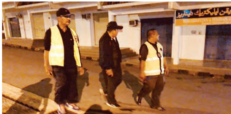
RONDAAN berasingan diadakan oleh ahli Focal Point bersama ahli Pengawasan Kejiranan bagi meningkatkan kewaspadaan masyarakat dalam sama-sama memastikan keselamatan di kawasan kampung bebas jenayah (atas dan bawah).

BRUNEI MUARA, Isnin, 7 Januari. - Bagi memastikan kesejahteraan serta pencegahan jenayah dilaksanakan di kawasan kampung, ahli Focal Point Daerah Brunei Muara telah menggiatkan aktiviti pencegahan jenayah pada tahun baharu 2019 ini dengan membuat rondaan bersama ahli-ahli Pengawasan Kejiranan (PK) kampung setempat.