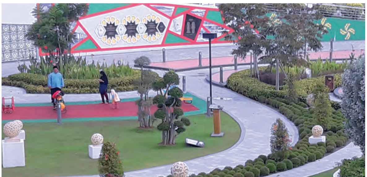
ANTARA kemudahan yang terdapat di Taman Mahkota Jubli Emas di ibu negara.

Tambahnya, di negara kita yang sering dikenali dengan gelaran