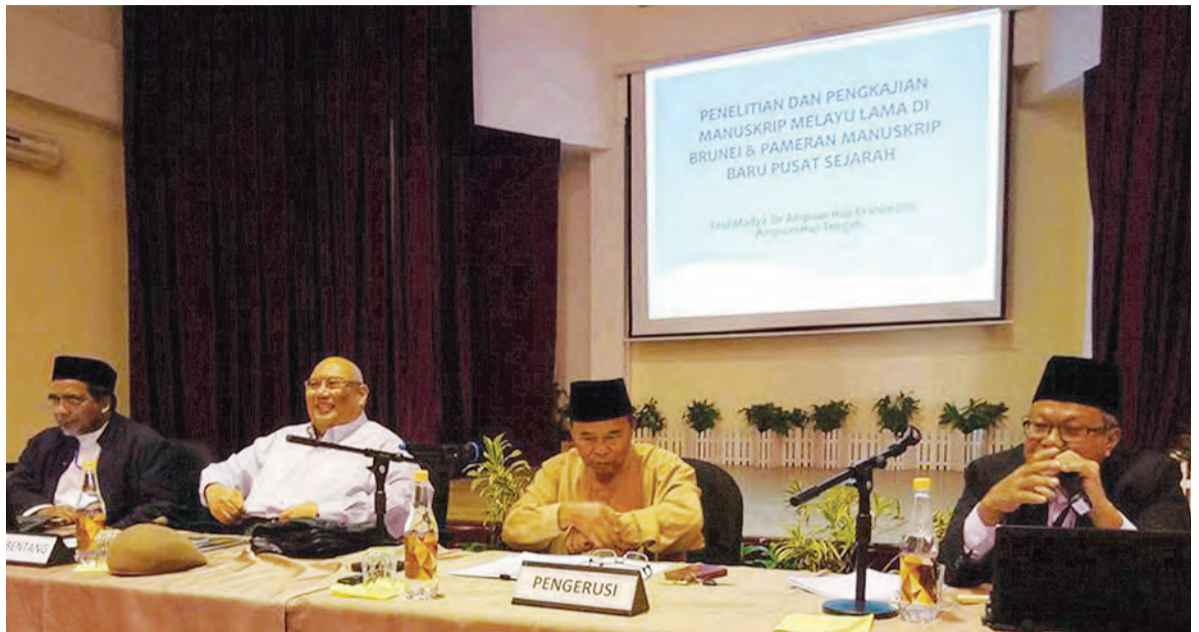
ANTARA pembentang dari dalam dan luar negeri mengenai manuskrip lama tentang Brunei.

Sebenarnya sebelum Sultan Hashim menghantar warkah ini terlebih dahulu baginda telah menghantar perutusan rasmi kepada Presiden Amerika Syarikat. Perutusan ke Amerika Syarikat ini kemungkinan juga ada kaitannya dengan peristiwa pengambilan Wilayah Limbang pada tahun 1890. Ini memandangkan perutusan tersebut berlaku tiga tahun selepas peristiwa pengambilan Limbang. Kemungkinan kerana kekecewaan baginda terhadap sikap dan dasar Kerajaan British yang lebih menyebelahi Kerajaan Brooke di Sarawak menyebabkan baginda telah mencari alternatif lain berbuat baik dengan Amerika Syarikat untuk mendapat simpati dan sokongan Amerika Syarikat berdasarkan perjanjian persahabatan pada tahun 1850.