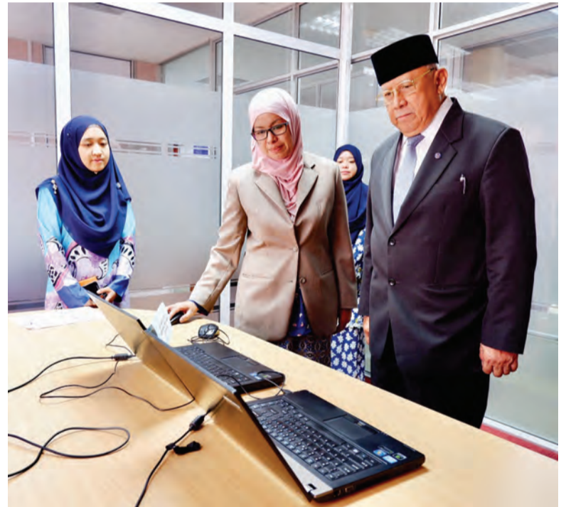
YANG Berhormat Dato Seri Setia Haji Awang Abdul Mokti bin Haji Mohd. Daud ketika meninjau secara dekat salah satu bahagian yang ada di JPA.

Selain itu, ia dihasratkan untuk memberi peluang kepada pegawai-pegawai JPA untuk berinteraksi serta bertukar-tukar fikiran dengan Yang Berhormat Menteri khususnya mengenai pembangunan, perkembangan dan kesejahteraan warga kerja JPA.