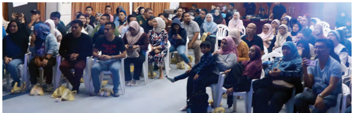
ANTARA penonton yang hadir menyaksikan pementasan teater 'Takdir'.

Maklumat lebih lanjut mengenai pementasan teater, bengkel teater dan aktiviti-aktiviti yang akan datang dari Sutera Memento, boleh menghubungi talian hotline di +673 880 3448, atau melalui akaun media sosial di Facebook, Instagram dan Twitter di @suteramemento.