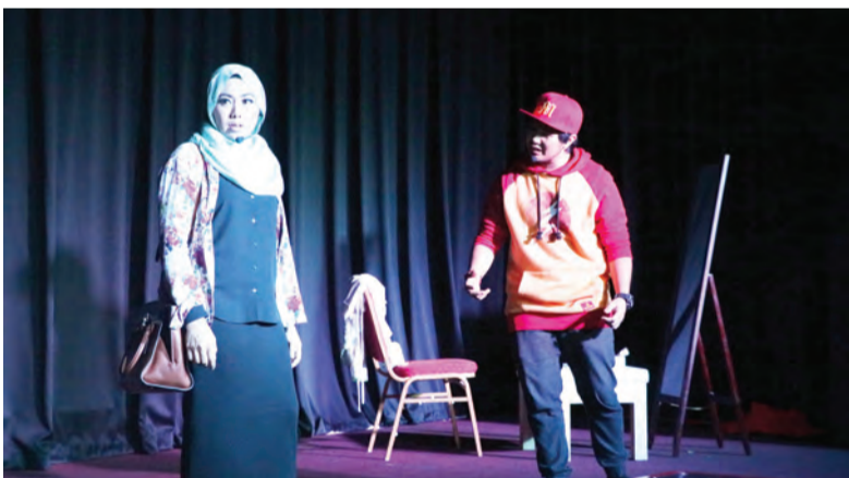
PEMENTASAN teater 'Takdir' yang berlangsung di Dewan Silaturahim, Tingkat I, Pusat Belia bersempena dengan Malam Minggu Pusat Belia (MMPB).

BANDAR SERI BEGAWAN , Selasa, 8 Januari. - Sambutan yang menggalakkan dan positif dari lebih kurang 150 penonton yang hadir menyaksikan pementasan teater 'Takdir' telah memberikan impak yang bermakna, di mana ia menunjukkan bahawa pementasan tempatan juga mendapat tempat di hati para penonton di Brunei.