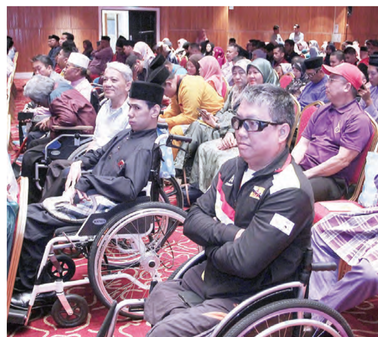
SEBAHAGIAN jemputan yang hadir.

Juga hadir pada majlis tersebut ialah Ahli-ahli Majlis Mesyuarat Negara, Setiausaha Tetap KKBS, Pemangku Pengarah JAPEM, Ketua-Ketua Jabatan, pegawai-pegawai kerajaan, ahli-ahli MKOKU, Pengerusi-Pengerusi Persatuan-Persatuan di bawah MKOKU dan ibu bapa serta penjaga Warga OKU.