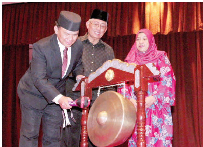
YANG Berhormat Menteri Kebudayaan, Belia dan Sukan menyempurnakan pelancaran Forum Sempena Sambutan Hari Antarabangsa Orang Kelainan Upaya 2019 dengan pukulan gong pada majlis yang diadakan di Dewan Utama, Pusat Persidangan Antarabangsa Berakas.

Oleh : Haniza Abdul Latif