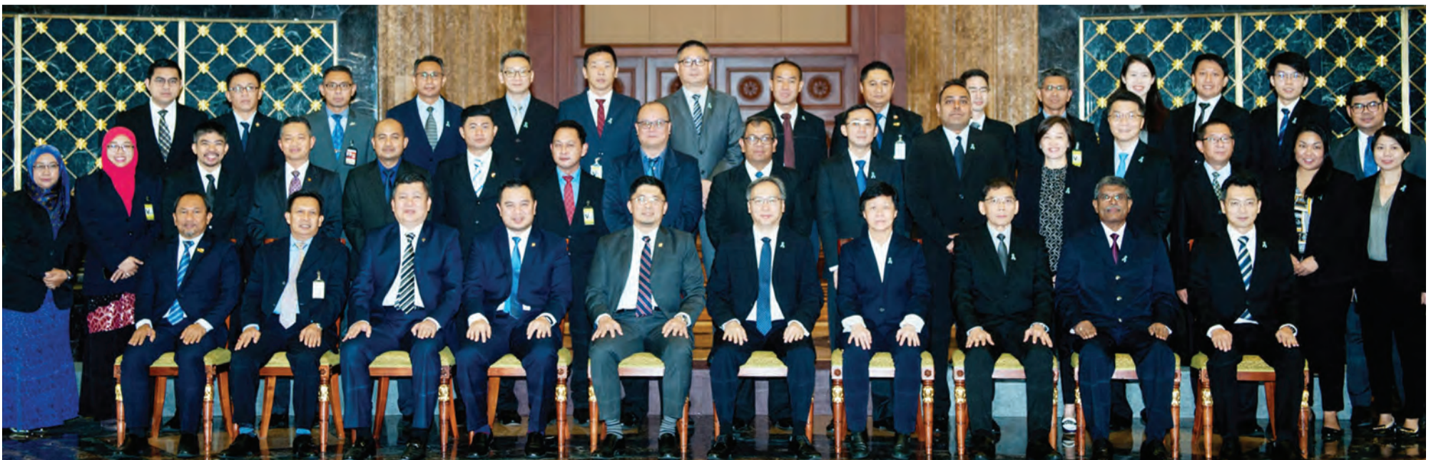
PARA delegasi Mesyuarat Dua Hala Kali Keempat di antara Negara Brunei Darussalam dan Republik Singapura pada sesi bergambar ramai.

Mesyuarat ini bertujuan bagi perkongsian maklumat dan amalan terbaik negara masing-masing serta untuk menerokai peluang-peluang latihan bersama dalam pelbagai bidang-bidang berkaitan.