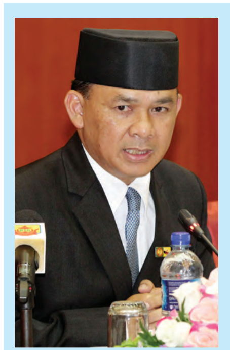
MENTERI Kebudayaan, Belia dan Sukan, Yang Berhormat Mejar Jeneral (B) Dato Paduka Seri Haji Aminuddin Ihsan bin Pehin Orang Kaya Saiful Mulok Dato Seri Paduka Haji Abidin semasa berucap pada Mesyuarat Pertama Jawatankuasa Pandu Bandar Seri Begawan Sebagai Ibu Negara Kebudayaan Islam Bagi Rantau Asia 2019 pada Khamis, 23 Safar 1440H / 1 November 2018M bertempat di Dewan Di-Gadong, Kementerian Kebudayaan, Belia dan Sukan.

Alhamdulillah, kita bersyukur ke hadirat Allah Subhananhu Wata'ala kerana dengan Rahmat dan izin-Nya jua, Bandar Seri Begawan telah dipilih sebagai Ibu Negara Kebudayaan Islam bagi rantau Asia untuk