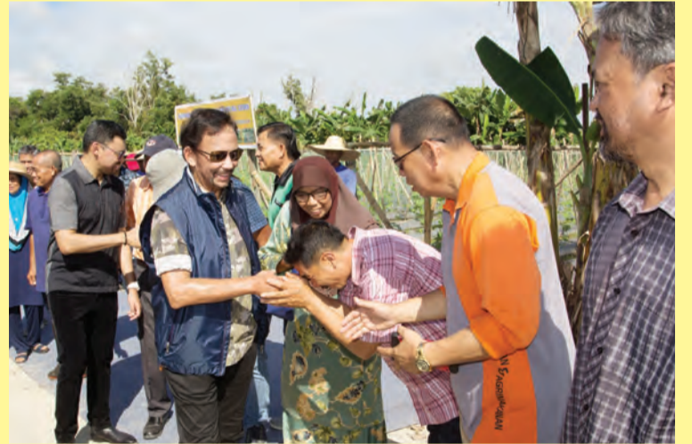
KEBAWAH Duli Yang Maha Mulia dan paduka anakanda, Duli Yang Teramat Mulia Paduka Seri Pengiran Muda Mahkota Pengiran Muda Haji Al-Muhtadee Billah berkenan menerima junjung ziarah daripada ahli keluarga pengusaha ladang berkenaan.