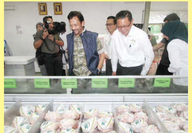
KEBAWAH Duli Yang Maha Mulia berkenan dijunjung melawat ke Kedai Runcit Ideal Meat Shop.