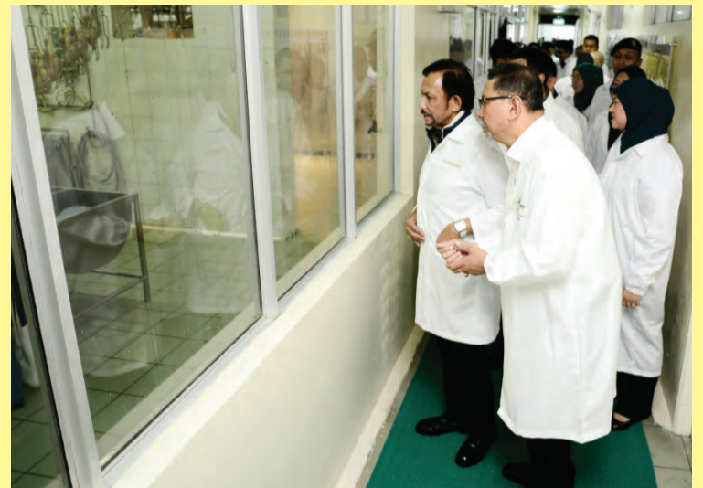
KEBAWAH Duli Yang Maha Mulia Paduka Seri Baginda Sultan dan Yang Di-Pertuan Negara Brunei Darussalam ketika berkenan berangkat ke Ladang Ideal Multifeed Farm (B) Sdn. Bhd. dan berkenan diberikan sembah penerangan.

Sebelum mengakhiri lawatan, Kebawah DYMM berserta kerabat diraja yang lain berkenan berangkat ke Majlis Santap Tengah Hari di Dewan Serbaguna IBTE, Kampus Agro-Teknologi, Wasan.