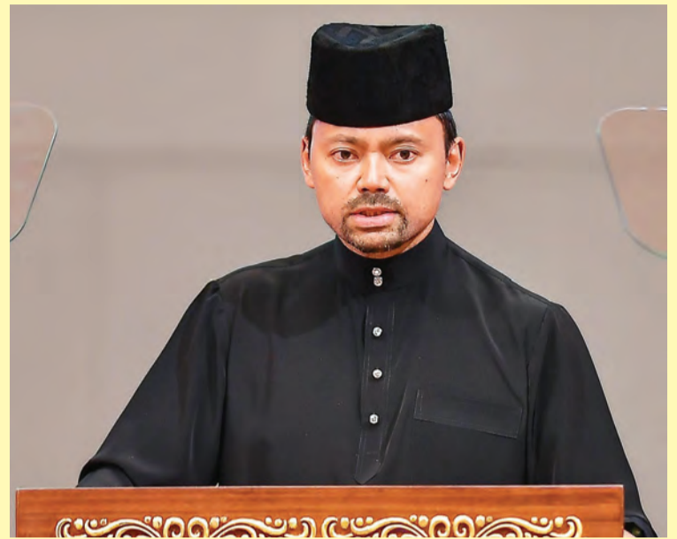
DULI Yang Teramat Mulia Paduka Seri Pengiran Muda Mahkota Pengiran Muda Haji Al-Muhtadee Billah ibni Kebawah Duli Yang Maha Mulia Paduka Seri Baginda Sultan Haji Hassanal Bolkiah Mu'izzaddin Waddaulah, Menteri Kanan di Jabatan Perdana Menteri berkenan mengurniakan sabda pada Majlis Pembukaan Rasmi Musabaqah Membaca Al-Quran Bahagian Dewasa Peringkat Akhir Kebangsaan Tahun 1440 Hijrah / 2019 Masihi di Dewan Plenary, Pusat Persidangan Antarabangsa.

DYT M bersabda di mana halaqah ini akan menjadi lebih bererti dan bermanfaat jika ia dikembangkan dan disertakan lagi dengan bacaan makna ayat-ayat yang dibaca untuk lebih menghayati pengajaran dan peringatan yang terkandung di dalamnya dan amalan ini sangat