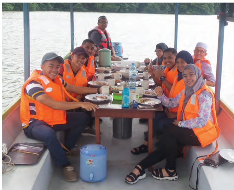
MENIKMATI hidangan atau 'Makan Dalam Perahu' sambil menyaksikan keindahan alam semula jadi atau perkampungan nelayan dan Kampong Ayer adalah inisiatif untuk menghidupkan kembali nostalgia dahulu yang kebanyakannya termasuk mereka yang pernah menikmati hidangan di atas perahu.

Belait mengetahui mengenai 'Makan Dalam Perahu' menerusi jirannya dan justeru itu ingin merasa sendiri seperti yang ditularkan melalui sosial media.