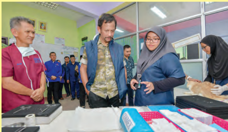
KEBAWAH Duli Yang Maha Mulia ketika berkenan berangkat ke Klinik Veterinar yang menyediakan pembelajaran mengenai pemeriksaan haiwan peliharaan seperti kucing (kiri). Sementara gambar kanan, Kebawah DYMM bersama paduka anakanda baginda ketika diberikan sembah penerangan ketika melawat Food Technology Unit.

Sebelum mengakhiri lawatan, Kebawah DYMM berserta kerabat diraja yang lain berkenan berangkat ke Majlis Santap Tengah Hari di Dewan Serbaguna IBTE, Kampus Agro-Teknologi, Wasan.