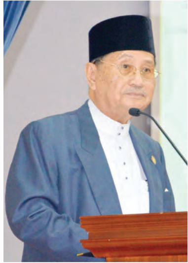
MENTERI Hal Ehwal Ugama, Yang Berhormat Pehin Udana Khatib Dato Paduka Seri Setia Ustaz Haji Awang Badaruddin bin Pengarah Dato Paduka Haji Awang Othman semasa berucap pada Sambutan Bahasa Arab sempena Hari Bahasa Arab Sedunia di Negara Brunei Darussalam.

GADONG, Selasa, 12 Februari. - Menteri Hal Ehwal Ugama, Yang Berhormat Pehin Udana Khatib Dato Paduka Seri Setia Ustaz Haji Awang Badaruddin bin Pengarah