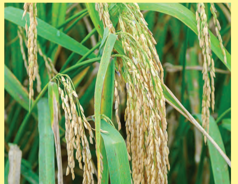
KEBAWAH Duli Yang Maha Mulia berkenan menerima pesambah yang disebarkan oleh Menteri Sumber-Sumber Utama dan Pelancongan, Yang Berhormat Dato Seri Setia Awang Haji Ali bin Haji Apong pada majlis berkenaan (kanan, atas). Sementara gambar kanan, hasil Varieti Padi Hibrid Sembada188, di Ladang Koperasi Setia Kawan (KOSEKA), KKP Wasan.