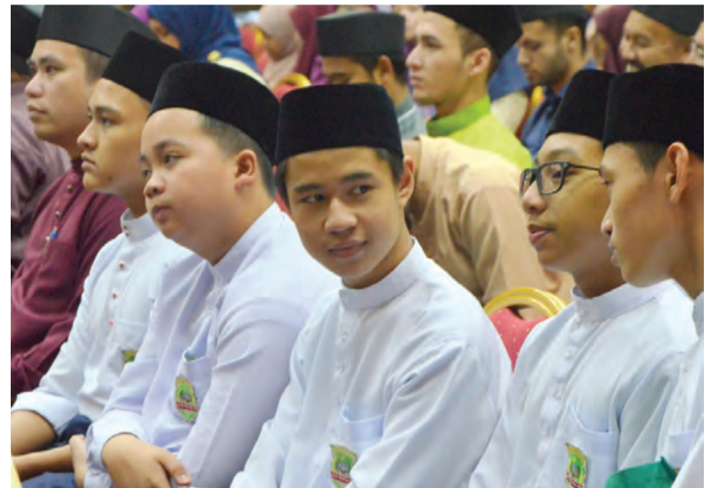
ANTARA yang hadir pada Sambutan Bahasa Arab sempena Hari Bahasa Arab Sedunia yang diadakan di Universiti Islam Sultan Sharif Ali (UNISSA).

Orang ramai adalah dialu-alukan untuk sama-sama menyertai aktiviti-aktiviti yang diadakan sepanjang Sambutan Bahasa Arab di UNISSA.