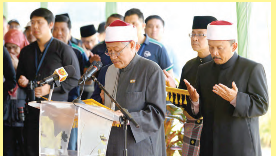
HADIR pada majlis tersebut, Menteri Hal Ehwal Dalam Negeri, Yang Berhormat Pehin Orang Kaya Seri Kerna Dato Seri Setia (Dr.) Haji Awang Abu Bakar bin Haji Apong; Menteri di JPM, Yang Berhormat Dato Seri Setia Awang Haji Abdul Mokti bin Haji Mohd. Daud; Menteri di JPM dan Menteri Kewangan dan Ekonomi II, Yang Berhormat Dato Seri Setia Dr. Awang Haji Mohd. Amin Liew bin Abdullah; Menteri Pembangunan, Yang Berhormat Dato Seri Setia Awang Haji Suhaimi bin Haji Gafar; Menteri Tenaga (Tenaga dan Tenaga Manusia) dan Perindustrian, Yang Berhormat Dato Seri Setia Dr. Awang Haji Mat Suny bin Haji Md. Hussien; Menteri Pendidikan, Yang Berhormat Dato Seri Setia Awang Haji Hamzah bin Haji Sulaiman (kiri), sementara gambar kanan, bacaan Surah Al-Fatihah dan Doa Selamat oleh Mufti Kerajaan, Yang Berhormat Pehin Datu Seri Maharaja Dato Paduka Seri Setia (Dr.) Ustaz Haji Awang Abdul Aziz bin Juned.