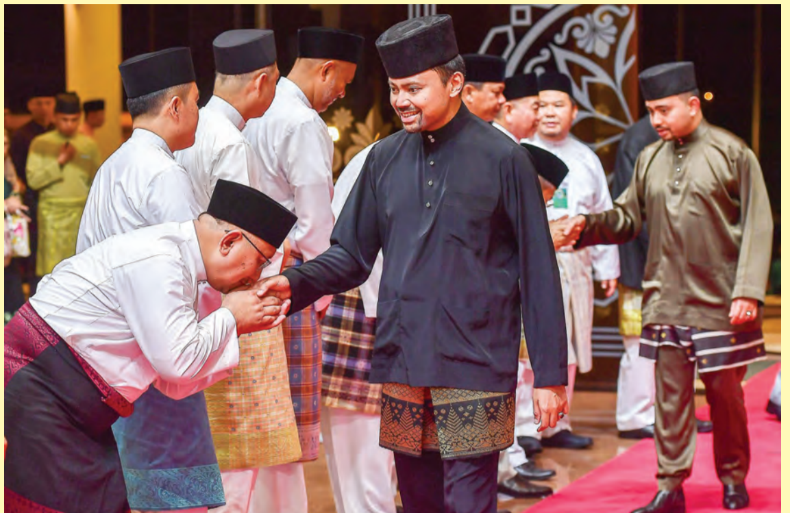
DULI Yang Teramat Mulia Paduka Seri Pengiran Muda Mahkota Pengiran Muda Haji Al-Muhtadee Billah ibni Kebawah Duli Yang Maha Mulia Paduka Seri Baginda Sultan Haji Hassanal Bolkiah Mu'izzaddin Waddaulah, Menteri Kanan di Jabatan Perdana Menteri dan paduka adinda Duli Yang Teramat Mulia, Duli Yang Teramat Mulia Paduka Seri Pengiran Muda 'Abdul Malik berkenan menerima junjung ziarah daripada Ahli-ahli Jawatankuasa Tertinggi Sambutan Hari-Hari Kebesaran Islam Tahun 1440 Hijrah sejeurus berangkat tiba Pusat Persidangan Antarabangsa, Berakas.

Musabaqah tahun ini diisikan dengan pameran-pameran terdiri dari Pameran dan Jualan Produk Kraf Tangan Mualaf, Unit Pengupayaan Mualaf, Bahagian Pembangunan Mualaf, Pusat Da'wah Islamiah; Pameran Kaligrafi Islam daripada Pusat Pengajian Kesenian dan Kaligrafi Islam Yayasan Sultan Haji Hassanal Bolkiah; Jualan