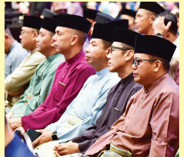
ANTARA para jemputan yang hadir pada majlis tersebut.