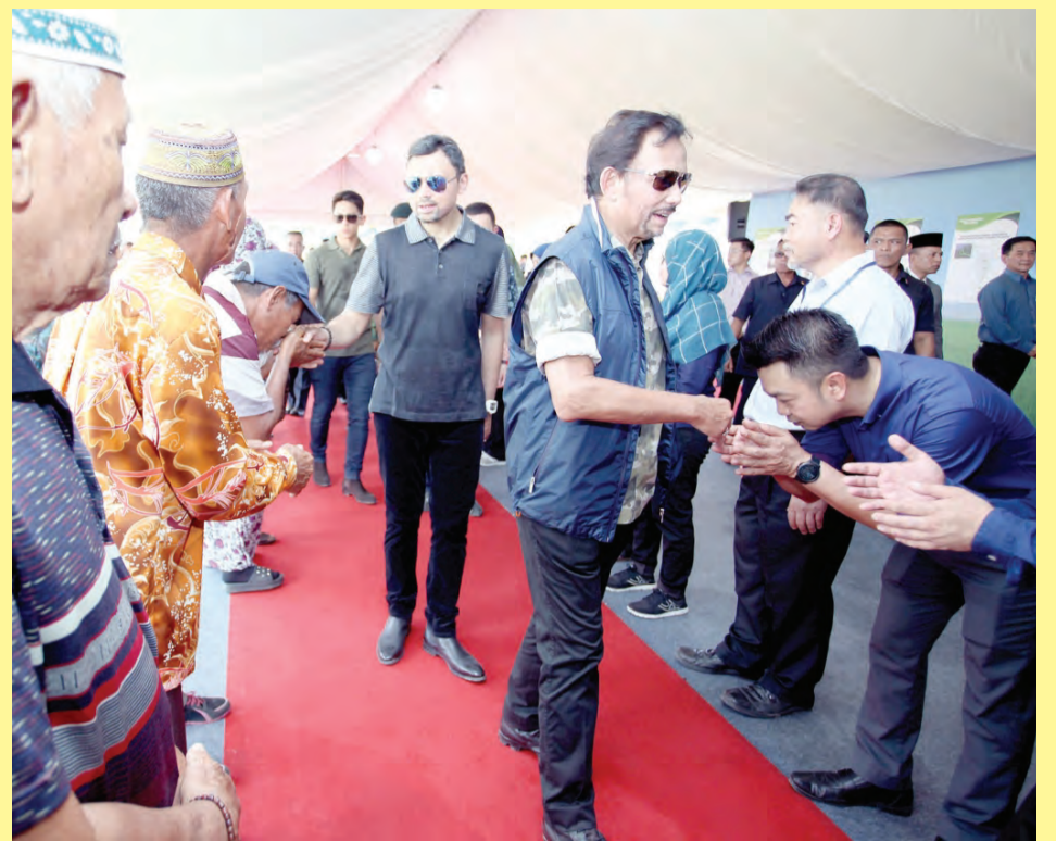
KEBAWAH Duli Yang Maha Mulia Paduka Seri Baginda Sultan Haji Hassanal Bolkiah Mu'izzaddin Waddaulah ibni Al-Marhum Sultan Haji Omar 'Ali Saifuddin Sa'adul Khairi Waddien, Sultan dan Yang Di-Pertuan Negara Brunei Darussalam berkenan mendengar sembah penerangan ringkas mengenai Varieti Padi Hibrid Sembada188 tersebut (kiri). Sementara gambar kanan, Kebawah Duli Yang Maha Mulia bersama paduka-paduka anakanda baginda berkenan menerima junjung ziarah daripada Ahli-ahli KOSEKA dan pihak Pengurusan Yaz & Wyn Enterprise sebelum berangkat ke Pusat Pemrosesan Padi (Ricemill), Wasan.