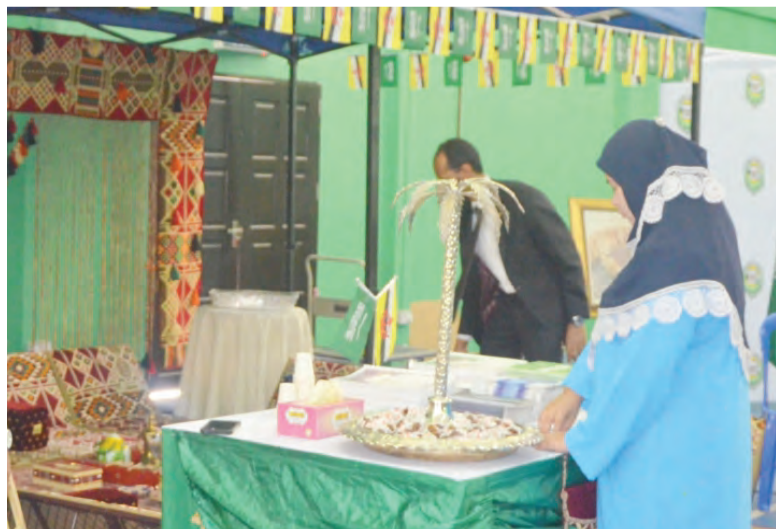
SUASANA Pameran Kreativiti Bahasa Arab.

Antara yang hadir pada sesi pertemuan itu, pegawai-pegawai kerajaan, penghulu dan ketua kampung juga para penduduk sekitar.