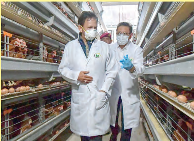
KEBAWAH DYMM ketika berkenan meninjau lebih dekat dan menerima sembah penerangan mengenai ternakan ayam penelor menggunakan reban tertutup Ladang Ideal Multifeed Farm (B) Sdn. Bhd. (kiri). Sementara gambar kanan, paduka-paduka anakanda baginda, Duli Yang Teramat Mulia Paduka Seri Pengiran Muda 'Abdul Malik dan Duli Yang Teramat Mulia Paduka Seri Pengiran Muda 'Abdul Mateen ketika berkenan berangkat melawat Kedai Runcit Ideal Meat Shop.