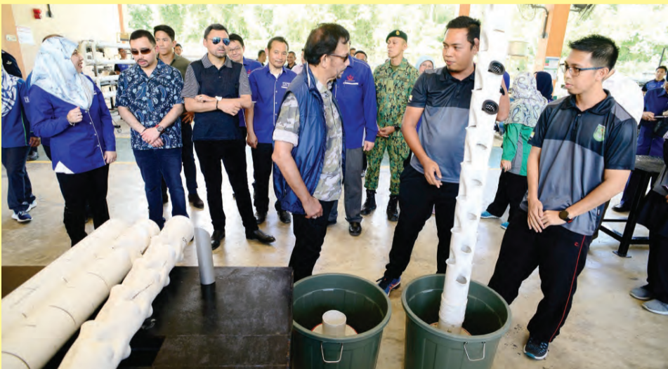
KEBAWAH DYMM bersama paduka-paduka anakanda baginda ketika berkenan meninjau pelbagai jenis sistem hidroponik (kiri). Sementara gambar kanan, Kebawah DYMM bersama paduka-paduka anakanda baginda berkenan berangkat ke Majlis Santap Tengah Hari di Dewan Serbaguna IBTE, Kampus Agro-Teknologi, Wasan.