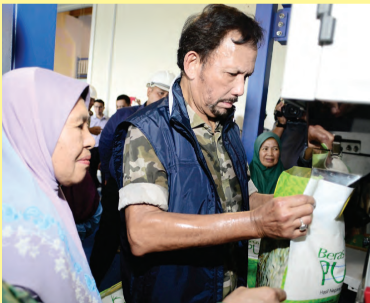
Di bahagian pembungkusan, Kebawah Duli Yang Maha Mulia Paduka Seri Baginda Sultan dan Yang Di-Pertuan Negara Brunei Darussalam berkenan mencuba peralatan pembungkusan beras tersebut (kiri). Sementara gambar kanan, Kebawah Duli Yang Maha Mulia berkenan meninjau mesin memeriksa kualiti beras yang dihasilkan.

Dengan pengalamannya dan kepakarannya dalam bidang pertanian, PTU memainkan peranan bekerjasama dengan agensi kerajaan dalam pelbagai program pembangunan negara antaranya projek kerjasama inisiatif pembangunan padi di negara ini.