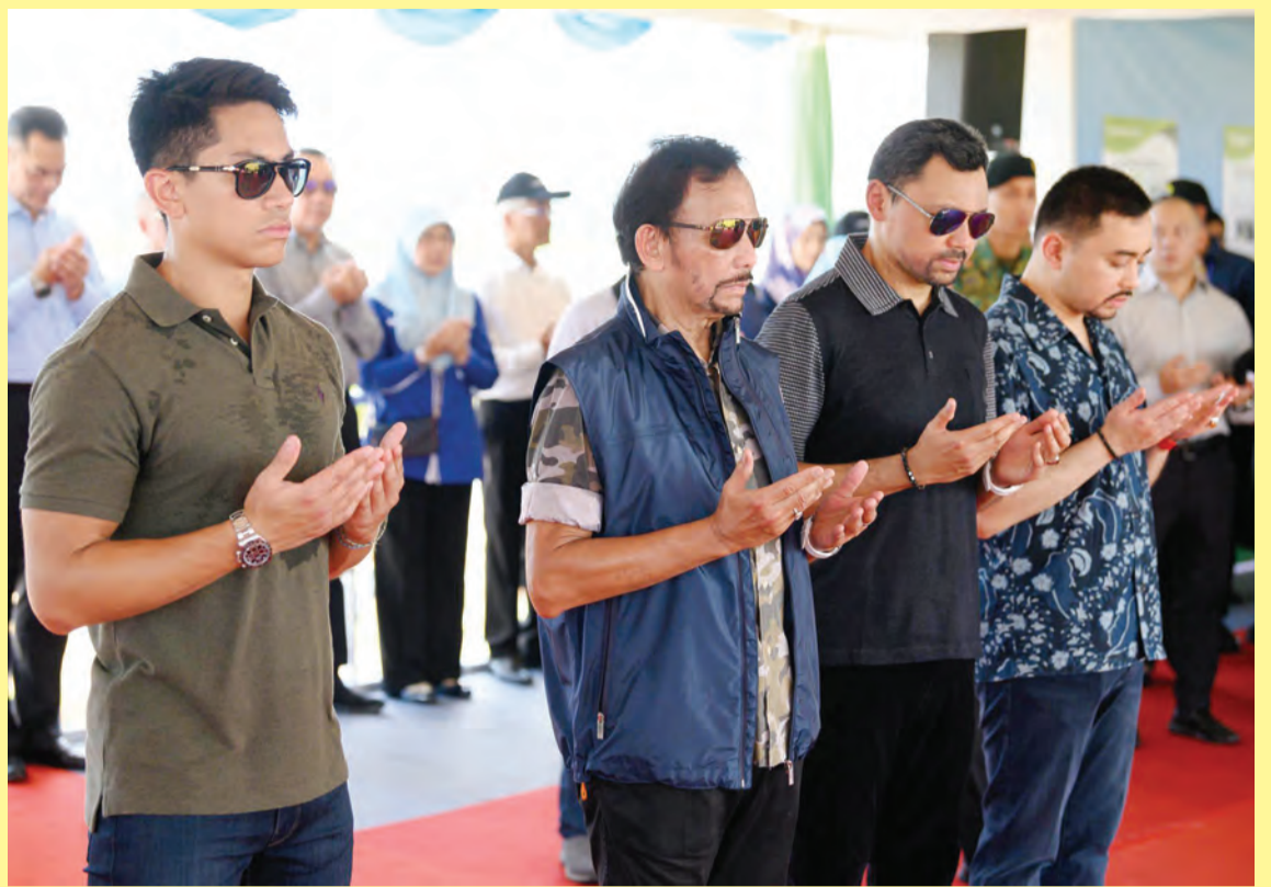
KEBAWAH Duli Yang Maha Mulia Paduka Seri Baginda Sultan Haji Hassanal Bolkiah Mu'izzaddin Waddaulah ibni Al-Marhum Sultan Haji Omar 'Ali Saifuddien Sa'adul Khairi Waddien, Sultan dan Yang Di-Pertuan Negara Brunei Darussalam berkenan mengurniakan Titah Perasmian pada Majlis Mengatam Varieti Padi Hibrid Sembada188 di Kawasan Kemajuan Pertanian (KKP) Wasan, Mukim Pengkalan Batu (kiri), sementara gambar kanan, baginda dan paduka-paduka anakanda baginda, Duli Yang Teramat Mulia Paduka Seri Pengiran Muda Mahkota Pengiran Muda Haji Al-Muhtadee Billah, Menteri Kanan di Jabatan Perdana Menteri (JPM); Duli Yang Teramat Mulia Paduka Seri Pengiran Muda 'Abdul Malik dan Duli Yang Teramat Mulia Paduka Seri Pengiran Muda 'Abdul Mateen menadah tangan ketika Doa Selamat dibacakan pada majlis berkenaan.