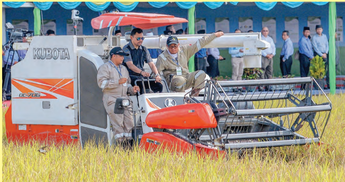
DULI Yang Teramat Mulia Paduka Seri Pengiran Muda Mahkota Pengiran Muda Haji Al-Muhtadee Billah, Menteri Kanan di JPM berkenan mengatam Varieti Padi Hibrid Sembada188, di Ladang Koperasi Setia Kawan (KOSEKA), KKP Wasan menggunakan sebuah jentuai.