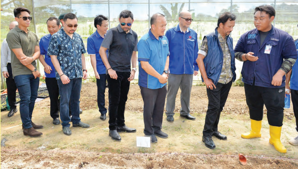
KEBAWAH Duli Yang Maha Mulia Paduka Seri Baginda Sultan Haji Hassanal Bolkiah Mu'izzaddin Waddaulah ibni Al-Marhum Sultan Haji Omar 'Ali Saifuddien Sa'adul Khairi Waddien, Sultan dan Yang Di-Pertuan Negara Brunei Darussalam bersama paduka-paduka anakanda baginda berkenan melawat Crop Production Unit sambil diberi sembah penerangan daripada salah seorang pelajar Institut Pendidikan Teknik Brunei (IBTE).

WASAN, Selasa, 12 Februari. - Sekolah Agro-Teknologi dan Sains Gunaan, Institut Pendidikan Teknik Brunei (IBTE), Kampus Agro-Teknologi, Kampung Wasan merupakan sebuah institusi pendidikan vokasional yang menawarkan pelbagai program Sijil Teknikal Tertinggi Kebangsaan (HNTEC) dan Sijil Teknikal Kebangsaan (NTec) dalam mata pelajaran Agroteknologi; Teknologi Akuakultur; Sains Makanan dan Teknologi; dan Sains Gunaan.