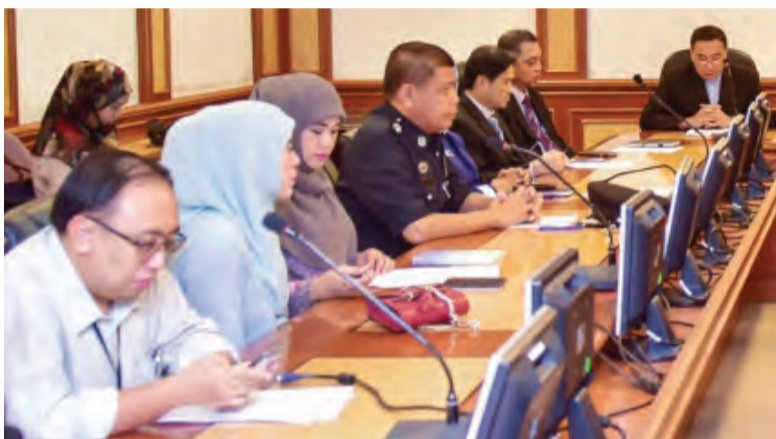
ANTARA yang hadir pada Sidang Media Perkhidmatan Rintis Talian Harapan 145.

Untuk maklumat lanjut mengenai Perkhidmatan-Perkhidmatan Kesihatan Mental di Negara Brunei Darussalam, orang ramai boleh menghubungi Talian Harapan 145 ataupun Talian Darussalam 123 ataupun melayari laman sesawang Kementerian Kesihatan di www.moh.gov.bn .