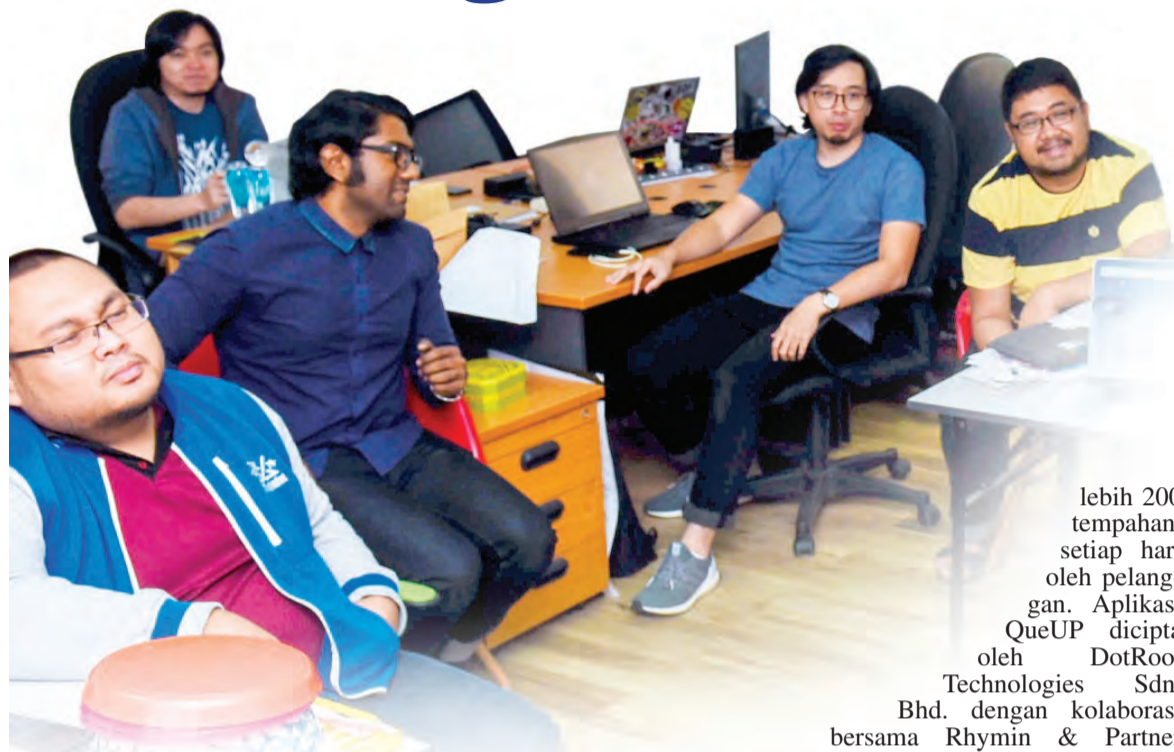
Oleh : Hezlinawati Haji Abdul Karim Infografik : Bahagian Pelita Brunei