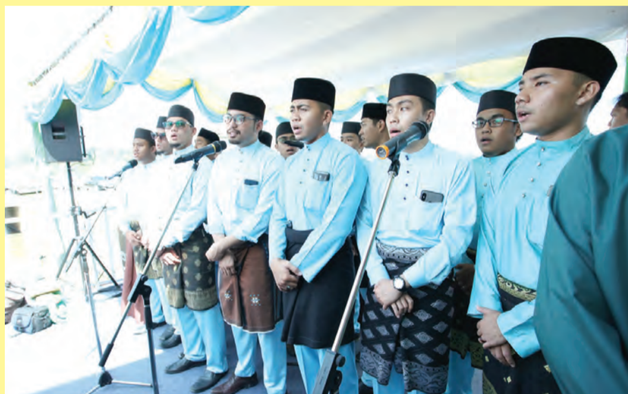
PERSEMBAHAN Tausyeh Syukur yang dipimpin oleh seramai 15 orang siswa Kolej Universiti Perguruan Ugama Seri Begawan (KUPU SB) mengiringi Kebawah DYMM di sepanjang baginda mengatam Varieti Padi Hibrid Sembada188 tersebut.