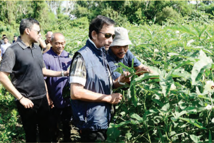
KEBAWAH DYMM dan paduka anakanda baginda, Duli Yang Teramat Mulia Paduka Seri Pengiran Muda Mahkota Pengiran Muda Haji Al-Muhtadee Billah, Menteri Kanan di Jabatan Perdana Menteri semasa berkenan melawat dan meninjau lebih dekat ladang tersebut.

"Jika diberikan sokongan dan bantuan lagi dari pihak kerajaan, kami ingin mengembangkan lagi perusahaan demi meningkatkan hasil produk kami," ujarnya.