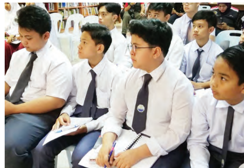
ANTARA penuntut Tahun 7 Sekolah St. Angela yang menghadiri Program Taklimat Kenegaraan Raja Kita, Menghayati Bendera dan Lagu Kebangsaan Negara Brunei Darussalam.

Taklimat diakhiri dengan penyampaian hadiah kepada para penuntut yang berjaya menjawab Kuiz Kenegaraan.