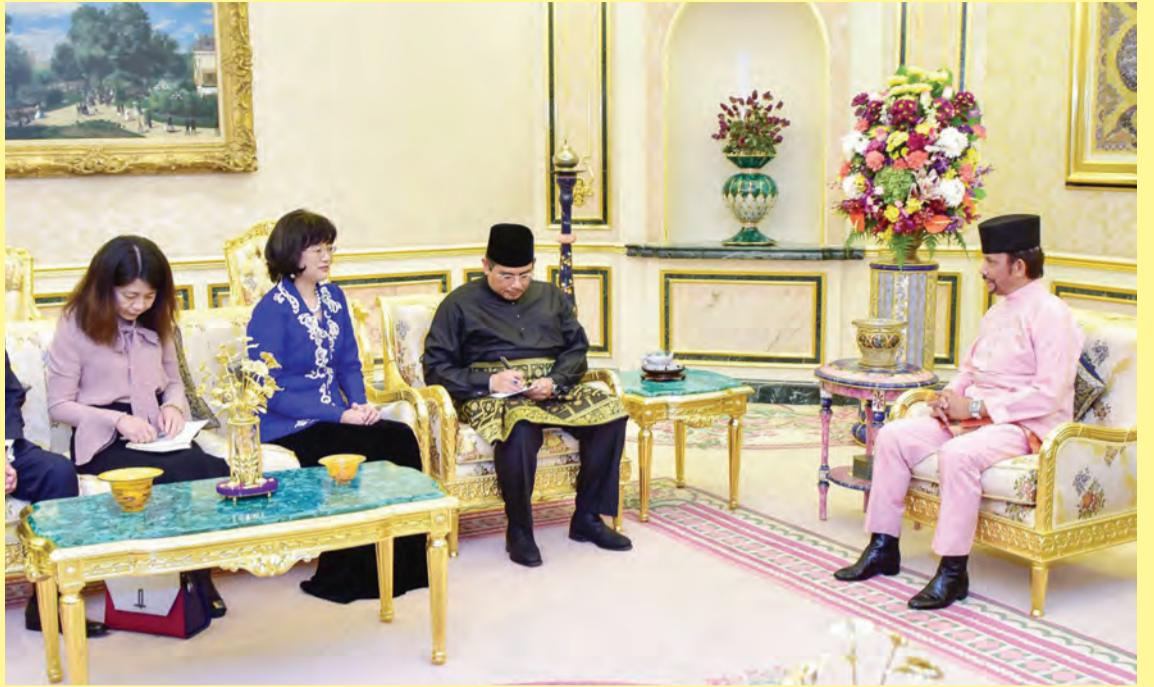
KEBAWAH Duli Yang Maha Mulia Paduka Seri Baginda Sultan dan Yang Di-Pertuan Negara Brunei Darussalam berkenan menerima Surat Tauliah Pelantikan dan menerima mengadap Duta Besar Istimewa dan Mutlak Republik Rakyat China ke Negara Brunei Darussalam, Puan Yang Terutama Yu Hong (kiri dan kanan).