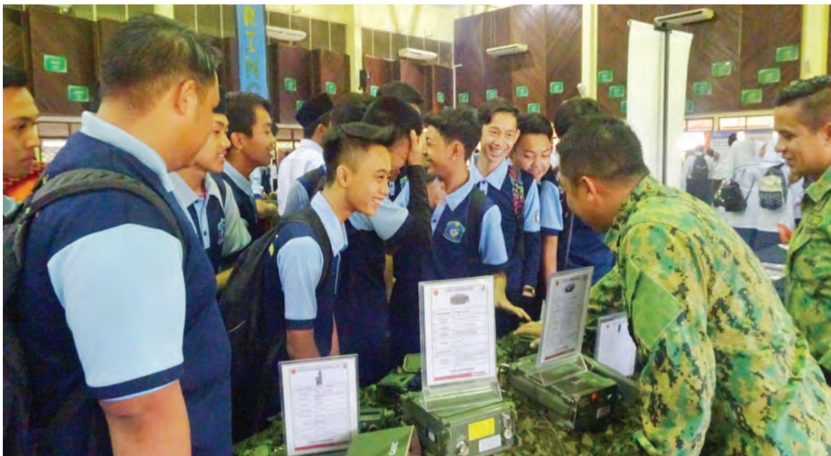
PARA penuntut Tahun 11 Sekolah Menengah Rimba (SMR) berpeluang menyaksikan pameran Angkatan Bersenjata Diraja Brunei (ABDB) bagi Program Hala Tuju dan Eksplorasi Kerjaya.

Politeknik Brunei; Perkhidmatan Kejururawatan, Kementerian Kesihatan dan Kemuda Institute.