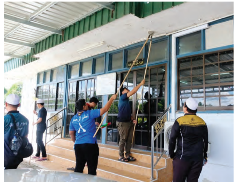
SELAIN mengadakan praktikal pertanian, rombongan KUPU SB juga mengadakan aktiviti khairat kemasyarakatan membersihkan Masjid Kampung Selangan.

Selain itu, pelaksanaan projek pertanian tersebut juga diharapkan dapat dimanfaatkan