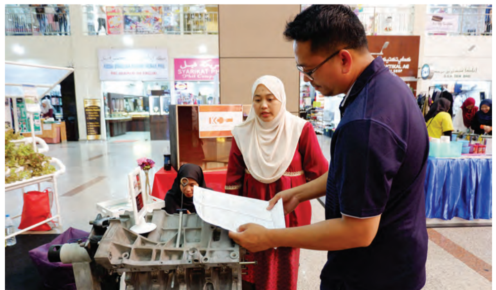
ANTARA pengunjung Cyber Shop Fair bertempat di Airport Mall.