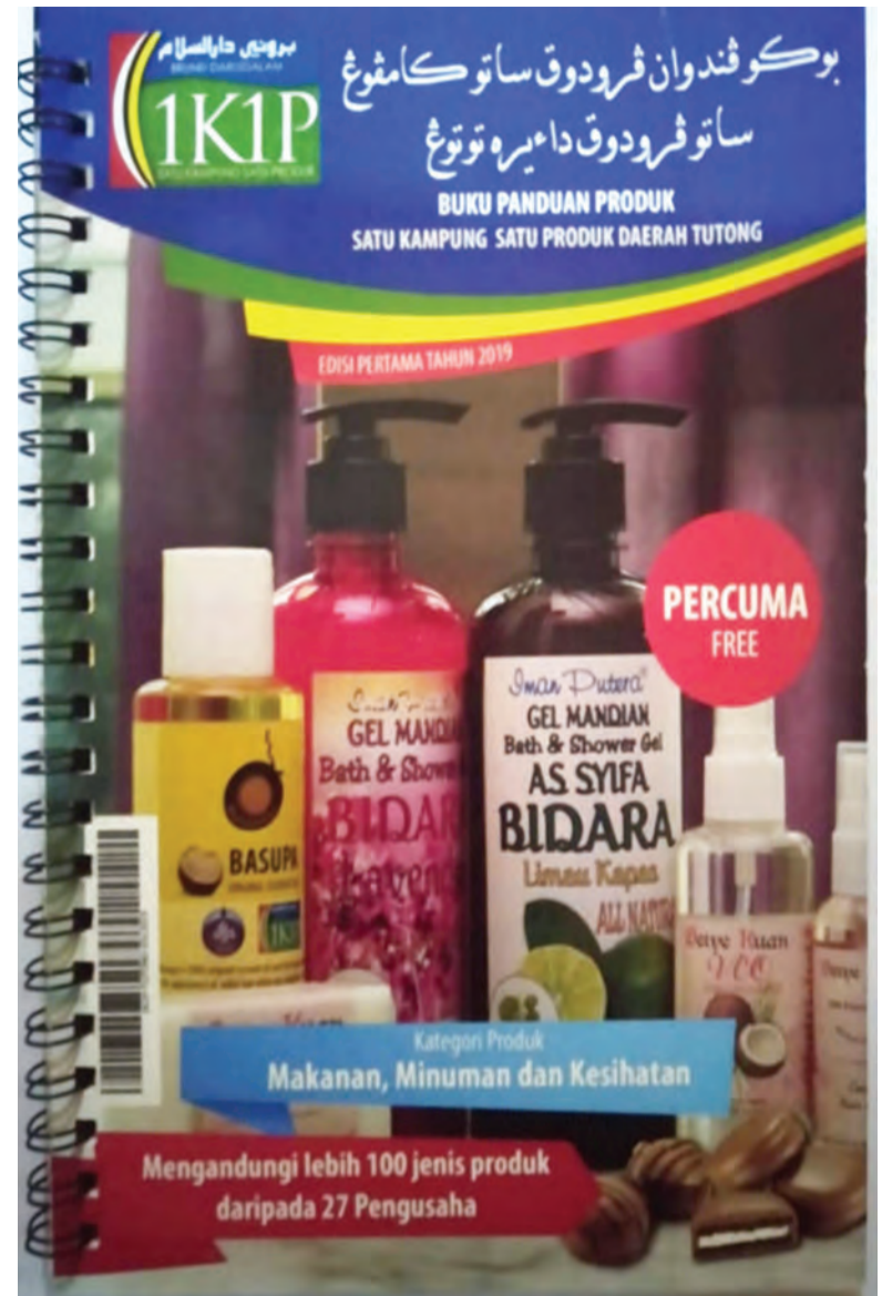
BUKU Panduan Produk 1K1P memudahkan orang ramai untuk membeli dan mengetahui produk-produk yang terdapat di Daerah Tutong.

Orang ramai yang ingin mendapatkan buku edisi pertama buku panduan tersebut, bolehlah memuat naik di laman sesawang e-book di https://ufile.io/yn240 .