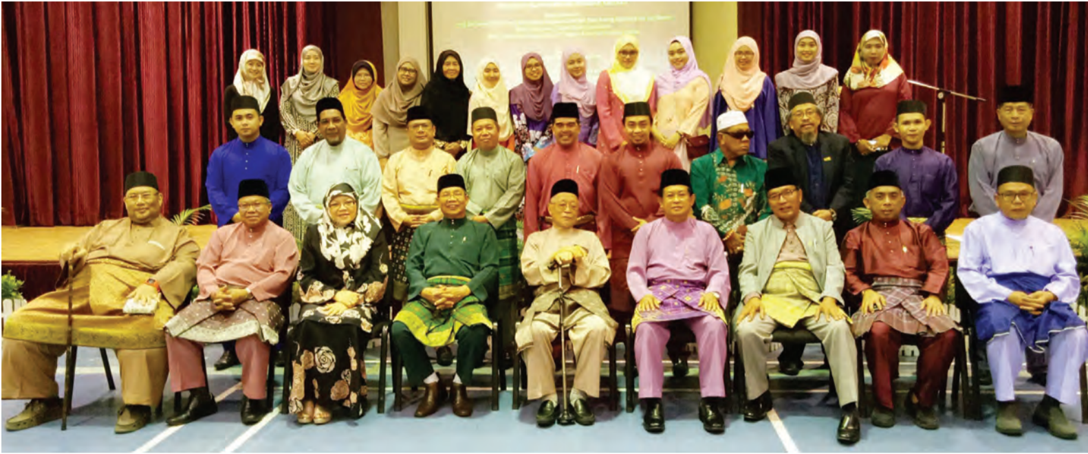
AHLI - ahli Jawatankuasa Tertinggi PESEBAR Sesi Tahun 2017 - 2019 bergambar ramai dengan ahli-ahlinya yang hadir dalam Mesyuarat Agung Ke-7.