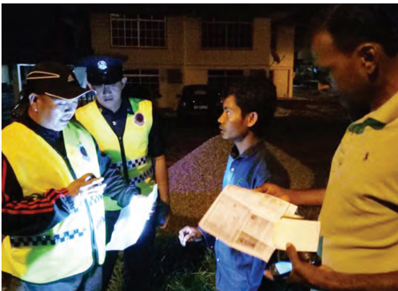
RONDAAN pencegahan jenayah dijalankan sempena cuti awam Tahun Baharu Cina oleh ahli-ahli Pengawasan Kejiranan (PK) Mukim Kianggeh, Kampung Jaya Bakti, Kampung Jaya Setia, Kampung Burong Pingai Berakas, Kampung Lugu dan Katimahar, Kampung Masin dan Kampung Lumapas 'B' (kiri dan kanan).