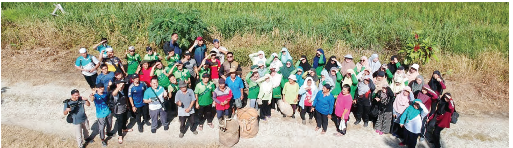
PROJEK lawatan pertanian mahasiswa / mahasiswi dari Nadi Pertanian dan Nadi Fotografi & Multimedia, KUPU SB merupakan langkah menggalakkan dan meningkatkan kemahiran mereka dalam bidang pertanian.

sepenuhnya bagi mewujudkan generasi usahawan pertanian pada masa akan datang, kerana ia melibatkan input nilai-nilai keusahawanan agar mereka lebih berdaya saing, kompetitif dan bersedia memenuhi tanggungjawab.