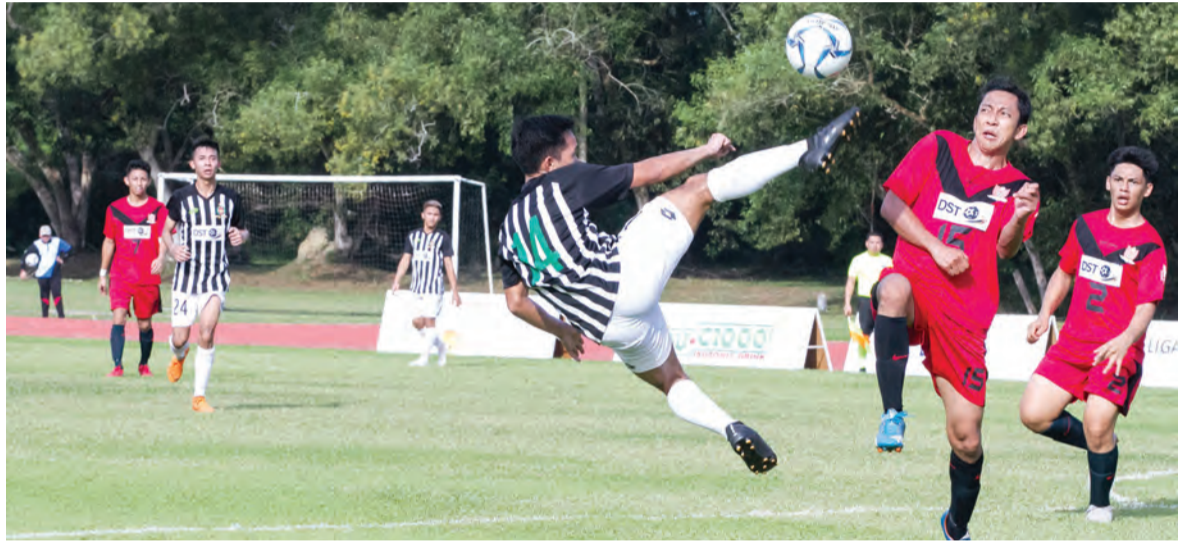
ANTARA aksi kedua-dua pasukan pada perlawanan Bola Sepak Liga Perdana Brunei DST di antara DPMM FC berjersi putih / hitam dan Rimba Star FC berjersi merah berlangsung di Padang Mini Jerudong Park.