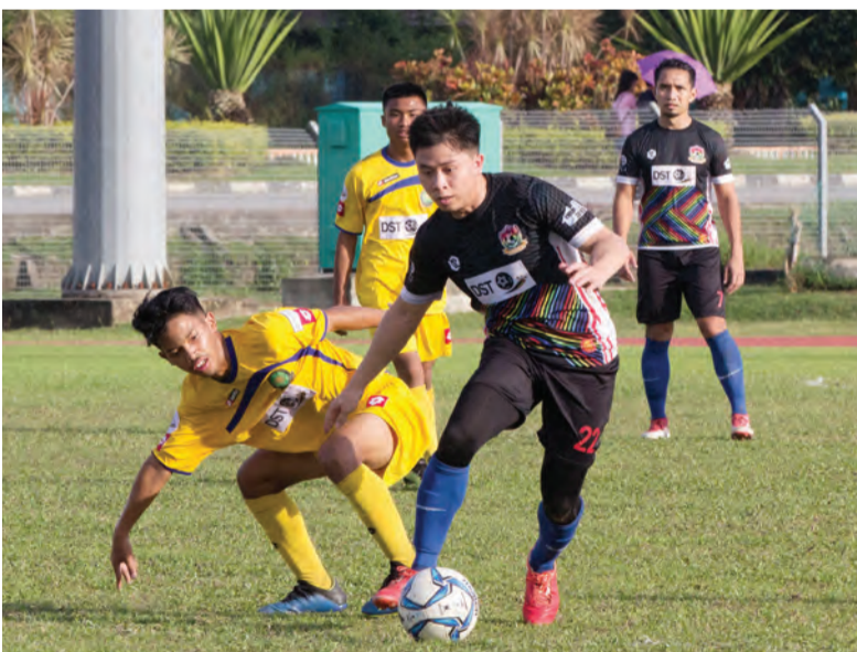
PERLAWANAN antara Tabuan Muda (jersi kuning) dan Rainbow FC (jersi hitam) dalam Liga Perdana Brunei DST 2018/2019 yang telah diadakan di Kompleks Sukan Berakas.

Oleh : Hajah Siti Zuraihah Haji Awang Sulaiman