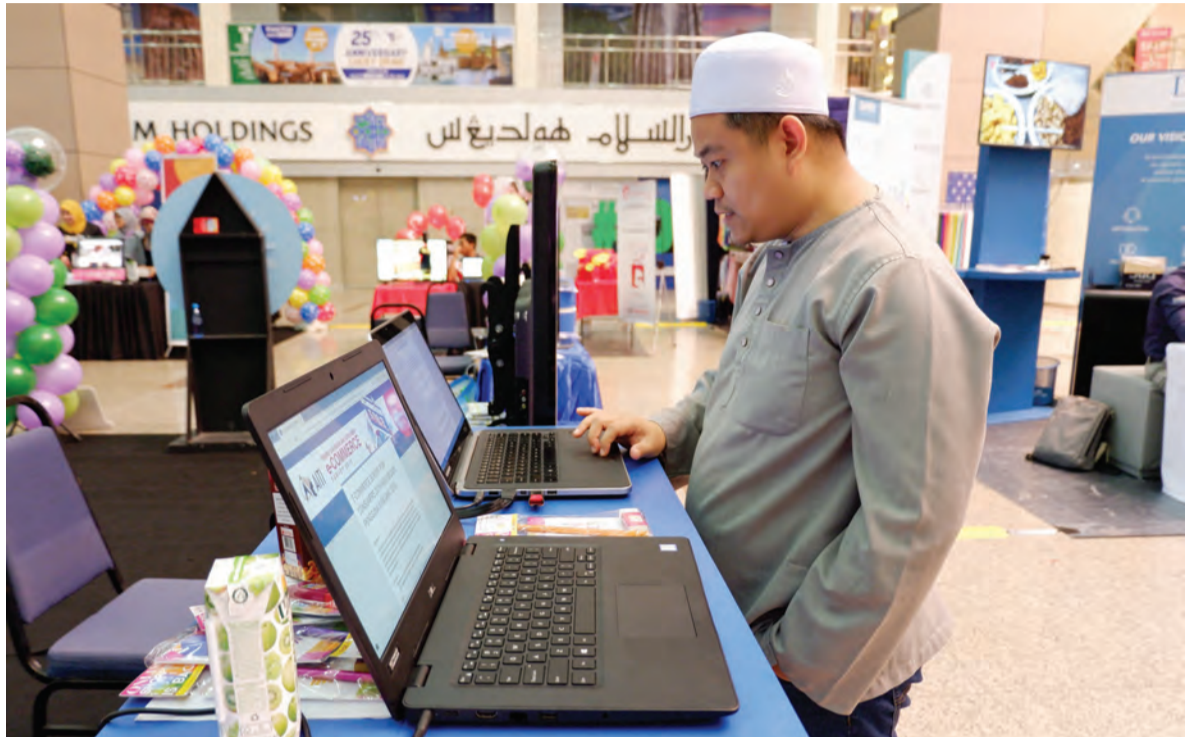
PENGUNJUNG Cyber Shop Fair juga berpeluang mengisi borang kaji selidik.

Beliau menjelaskan, Cyber Shop Fair diadakan bersempena dengan Cyber Shop Fest, iaitu kempen membeli-belah secara online yang diadakan selama dua bulan, iaitu Januari dan Februari.