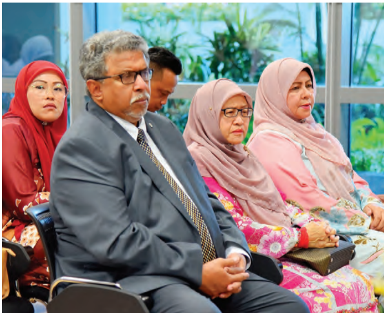
ANTARA yang hadir pada Sidang Media tersebut.

Tambah beliau, Unit Pengesanan Awal dan Pencegahan Kanser bertujuan untuk menyelaraskan penjagaan untuk memenuhi tujuan-tujuan tersebut.