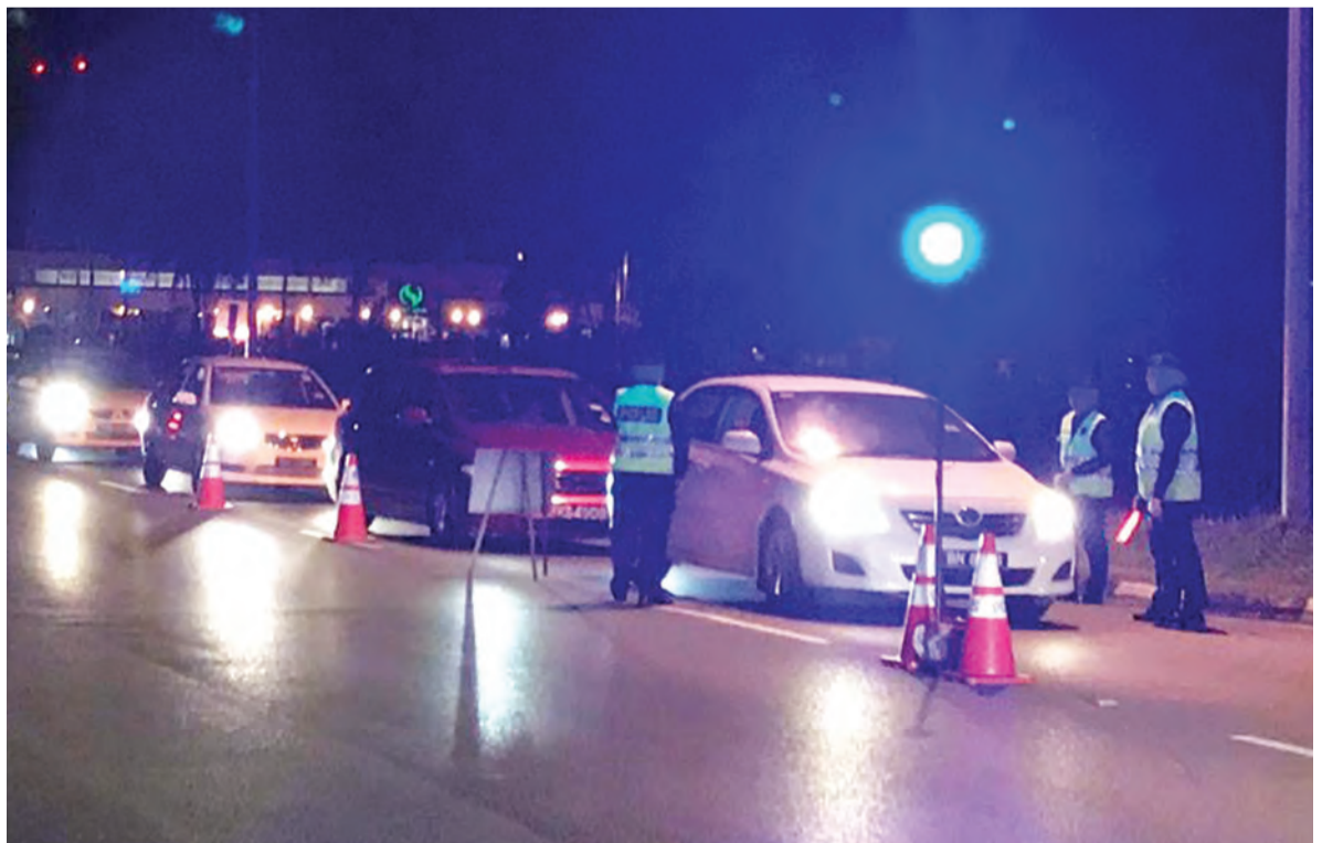
SEKATAN jalan raya yang telah dijalankan oleh keanggotaan Ibu Pejabat Daerah Polis Belait dan Balai Polis Seria sempena cuti awam Tahun Baharu Cina.

Hasil daripada sekatan itu dua kompaun telah dikeluarkan kerana cukai jalan yang mansuh dan kenderaan tidak dalam keadaan baik, manakala empat pemandu telah dikeluarkan surat peringatan kerana tidak membawa lesen memandu.