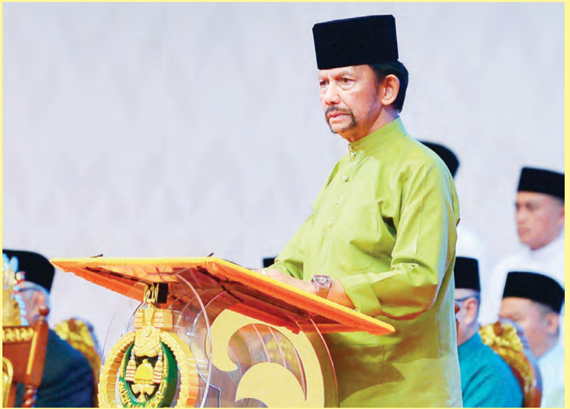
KEBAWAH Duli Yang Maha Mulia Paduka Seri Baginda Sultan Haji Hassanal Bolkiah Mu'izzaddin Waddaulah ibni Al-Marhum Sultan Haji Omar 'Ali Saifuddien Sa'adul Khairi Waddien, Sultan dan Yang Di-Pertuan Negara Brunei Darussalam berkenan mengurniakan titah pada Majlis Pengurniaan Hadiah Musabaqah Tilawatil Quran Belia Asia Tenggara (MTQBAT) Ke-9, Tahun 1441 Hijrah / 2019 Masihi.

Dengan menghayati Al-Quran titah baginda, insyaaAllah, para belia akan beroleh penghidupan yang baik lagi berkat, sempurna keperibadian dan akhlak.