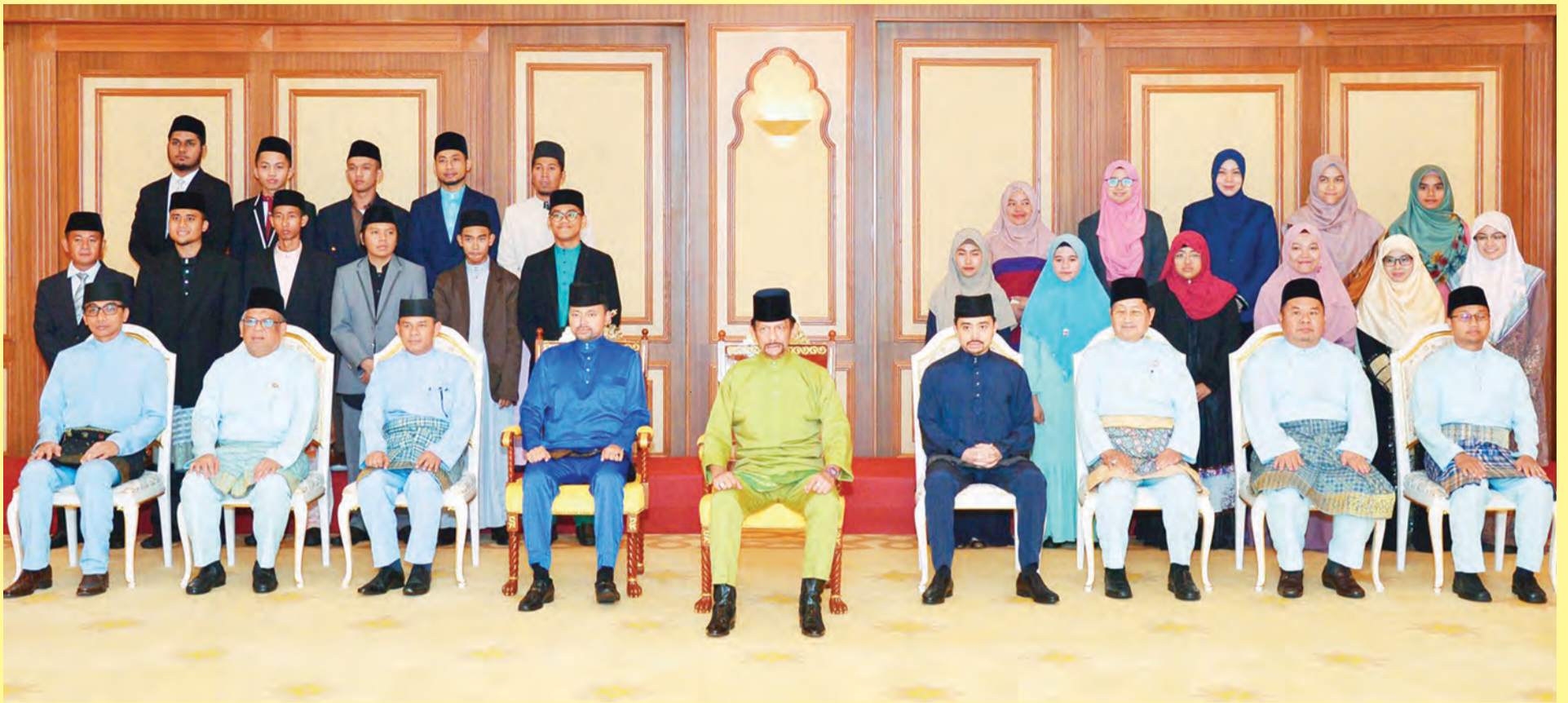
KEBAWAH Duli Yang Maha Mulia Paduka Seri Baginda Sultan Haji Hassanal Bolkiah Mu'izzaddin Waddaulah ibni Al-Marhum Sultan Haji Omar 'Ali Saifuddien Sa'adul Khairi Waddien, Sultan dan Yang Di-Pertuan Negara Brunei Darussalam bersama paduka-paduka anakanda baginda, Duli Yang Teramat Mulia Paduka Seri Pengiran Muda Mahkota Pengiran Muda Haji Al-Muhtadee Billah; dan Duli Yang Teramat Mulia Paduka Seri Pengiran Muda 'Abdul Malik berkenan bergambar ramai bersama para peserta pada Majlis Pengurniaan Hadiah Musabaqah Tilawatil Quran Belia Asia Tenggara (MTQBAT) Ke-9, Tahun 1441 Hijrah / 2019 Masihi.