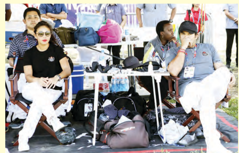
JUGA berangkat menyaksikan, Yang Teramat Mulia Paduka Seri Pengiran Anak Puteri 'Azemah Ni'matul Bolkiah binti Kebawah Duli Yang Maha Mulia Paduka Seri Baginda Sultan Haji Hassanal Bolkiah Mu'izzaddin Waddaulah; Yang Amat Mulia Pengiran Muda Abdul Qawi ibni Duli yang Teramat Mulia Paduka Seri Pengiran Perdana Wazir Sahibul Himmah Wal-Waqar Pengiran Muda Mohamed Bolkiah; dan Yang Amat Mulia Pengiran Muda Bahar ibni Duli Yang Teramat Mulia Paduka Seri Pengiran Digadong Sahibul Mal Pengiran Muda Haji Jefri Bolkiah.