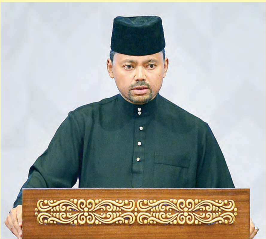
DULI Yang Teramat Mulia Paduka Seri Pengiran Muda Mahkota Pengiran Muda Haji Al-Muhtadee Billah ibni Kebawah Duli Yang Maha Mulia Paduka Seri Baginda Sultan Haji Hassanal Bolkiah Mu'izzaddin Waddaulah, Menteri Kanan di Jabatan Perdana Menteri berkenan mengurniakan sabda pada Majlis Pembukaan Rasmi Musabaqah Tilawatil Quran Belia Asia Tenggara Ke-9, Tahun 1441 Hijrah bersamaan 2019 Masihi pada Selasa (Malam Rabu), 7 Rabiulakhir 1441 Hijrah / 3 Disember 2019 Masihi di Dewan Plenary, Pusat Persidangan Antarabangsa, Berakas.

Assalamu'alaikum Warahmatullahi Wabarakatuh Bismillaahir Rahmaanir Raheem Alhamdulillah Rabbil 'Alameen, Wassalaatu' Wassalaamu 'Ala Asyarafil Mursaleen, Sayyidina Muhammaddin, Wa'ala Aalihee Wasahbihee Ajma'een, Waba'du.