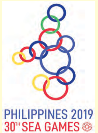
Berita dan Foto : Aimi Sani

Sementara itu, acara Women Doubles Event, negara diwakili oleh gandingan Pengiran Nadia Nabila binti Pengiran Abu Samah dan Fatin Nur Ashikin binti Abu Bakar serta gandingan beregu