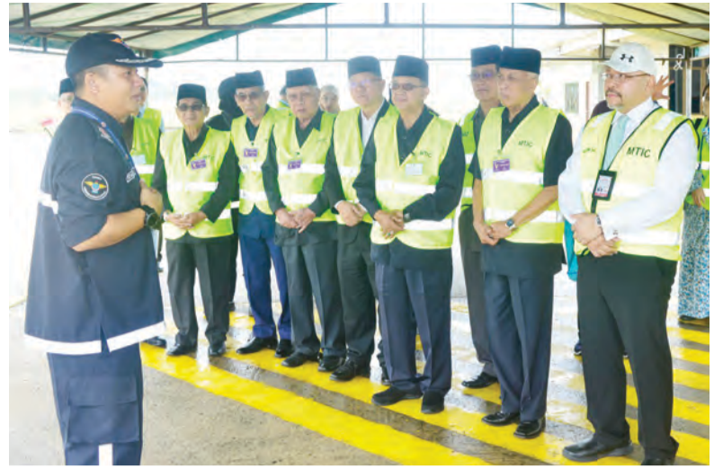
MENTERI Pengangkutan dan Infokomunikasi, Yang Berhormat Dato Seri Setia Awang Abdul Mutalib bin Pehin Orang Kaya Seri Setia Dato Paduka Haji Mohammad Yusof (kanan) dan Ahli-ahli Majlis Mesyuarat Negara (MMN) ketika menyaksikan Latihan Kecemasan Lapangan Terbang Antarabangsa Berakas (LTAB).