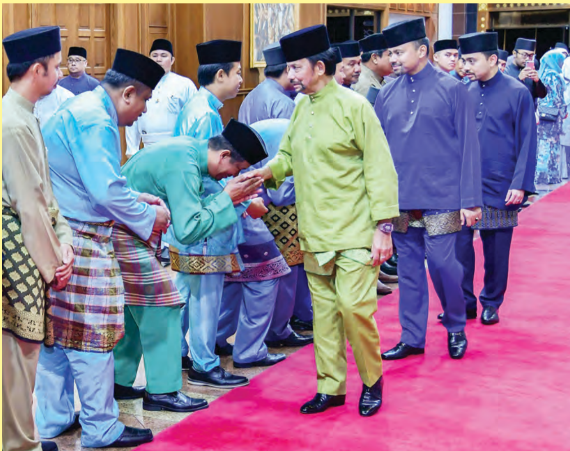
KEBAWAH Duli Yang Maha Mulia Paduka Seri Baginda Sultan dan Yang Di-Pertuan Negara Brunei Darussalam bersama paduka-paduka anakanda baginda, Duli Yang Teramat Mulia Paduka Seri Pengiran Muda Mahkota Pengiran Muda Haji Al-Muhtadee Billah, Menteri Kanan di Jabatan Perdana Menteri; dan Duli Yang Teramat Mulia Paduka Seri Pengiran Muda 'Abdul Malik berkenan menerima junjung ziarah sejurus berangkat tiba ke Majlis Pengurniaan Hadiah MTQBAT Ke-9, Tahun 1441 Hijrah / 2019 Masihi.

BANDAR SERI BEGAWAN, Khamis, 5 Disember. - Kebawah Duli Yang Maha Mulia Paduka