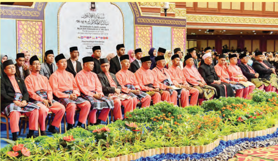
BARISAN Jemaah Hakim dan para peserta pada Majlis Pengurniaan Hadiah MTQBAT Ke-9, Tahun 1441 Hijrah / 2019 Masihi.