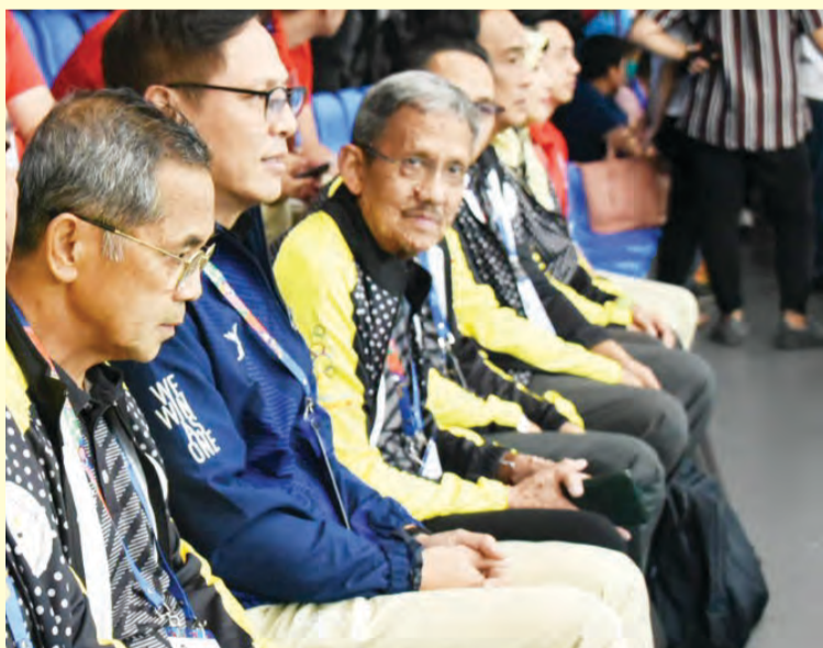
KEBERANGKATAN Duli Yang Teramat Mulia Paduka Seri Pengiran Bendahara Seri Maharaja Permaisua Pengiran Muda Haji Sufri Bolkiah ibni Al-Marhum Sultan Haji Omar 'Ali Saifuddin Sa'adul Khairi Waddien, Presiden Majlis Olimpik Kebangsaan Negara Brunei Darussalam sememangnya menyuntik lagi semangat atlet Billiards negara.

MANILA, FILIPINA, Khamis, 5 Disember. - Pertarungan di meja Billiards hari ini diteruskan dengan pertarungan dua atlet negara untuk melayakkan diri ke peringkat seterusnya dalam Men