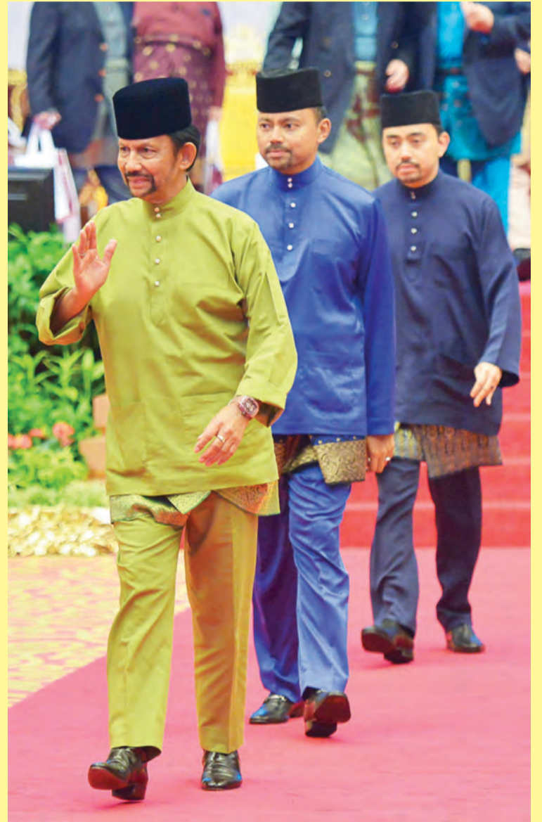
KEBAWAH Duli Yang Maha Mulia Paduka Seri Baginda Sultan dan Yang Di-Pertuan Negara Brunei Darussalam bersama paduka-paduka anakanda baginda, DYTm Paduka Seri Pengiran Muda Mahkota Pengiran Muda Haji Al-Muhtadee Billah; dan DYTm Paduka Seri Pengiran Muda 'Abdul Malik berkenan menerima junjung ziarah daripada kanak-kanak yang hadir pada Majlis Pengurniaan Hadiah MTQBAT Ke-9, Tahun 1441 Hijrah / 2019 Masihi berkenaan.