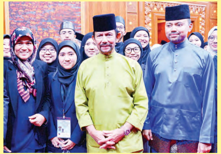
KEBAWAH Duli Yang Maha Mulia Paduka Seri Baginda Sultan Haji Hassanal Bolkiah Mu'izzaddin Waddaulah ibni Al-Marhum Sultan Haji Omar 'Ali Saifuddien Sa'adul Khairi Waddien, Sultan dan Yang Di-Pertuan Negara Brunei Darussalam bersama paduka-paduka anakanda baginda, Duli Yang Teramat Mulia Paduka Seri Pengiran Muda Mahkota Pengiran Muda Haji Al-Muhtadee Billah; dan Duli Yang Teramat Mulia Paduka Seri Pengiran Muda 'Abdul Malik berkenan berangkat ke Majlis Pengurniaan Hadiah Musabaqah Tilawatil Quran Belia Asia Tenggara (MTQBAT) Ke-9, Tahun 1441 Hijrah / 2019 Masihi (atas), sementara gambar atas kanan, Kebawah Duli Yang Maha Mulia dan paduka-paduka anakanda baginda berkenan mengabadikan gambar bersama yang hadir pada majlis tersebut.