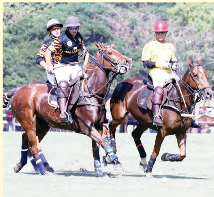
ANTARA aksi Duli Yang Teramat Mulia Paduka Seri Pengiran Digadong Sahibul Mal Pengiran Muda Haji Jefri Bolkiah dan skuad Polo negara pada perlawanan berkenaan (atas dan bawah).

Ke-30, Republik Filipina 2019 yang berlangsung di Miguel Romero Polo Field, di sini. Pada permulaan perlawanan chaka pertama, kedua-dua pasukan tidak berjaya menghasilkan sebarang jaringan, walaupun kedua-dua pasukan sering berbalas serangan ke kubu masing-masing.