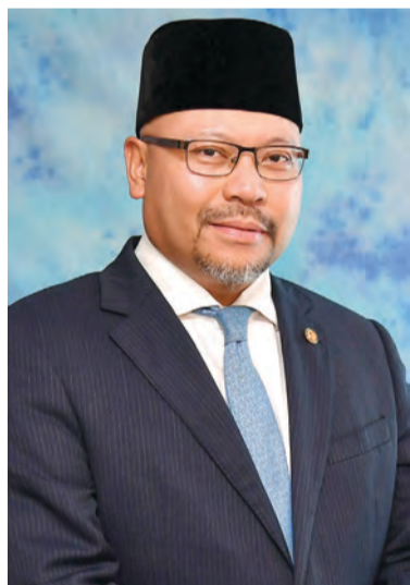
MENTERI Pengangkutan dan Infokomunikasi, Yang Berhormat Dato Seri Setia Awang Abdul Mutalib bin Pehin Orang Kaya Seri Setia Dato Paduka Haji Mohammad Yusof.

Mini Karnival yang berlangsung selama tiga hari bermula 3 Disember 2019 tersebut turut dimeriahkan dengan pelbagai acara menarik termasuk kuiz di sepanjang berlangsungnya muzikal pentas animasi kegemaran ramai Didi & Friends tersebut dijalankan.