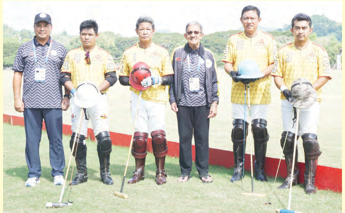
DULI Yang Teramat Mulia Paduka Seri Pengiran Bendahara Seri Maharaja Permaisua Pengiran Muda Haji Sufri Bolkiah ibni Al-Marhum Sultan Haji Omar 'Ali Saifuddien Sa'adul Khairi Waddien selaku Presiden Majlis Olimpik Kebangsaan Negara Brunei Darussalam bersama Duli Yang Teramat Mulia Paduka Seri Pengiran Digadong Sahibul Mal Pengiran Muda Haji Jefri Bolkiah ibni Al-Marhum Sultan Haji Omar 'Ali Saifuddien Sa'adul Khairi Waddien berkenan mengabadikan gambar bersama skuad Polo negara pada perlawanan kedua Sukan Polo bagi Divisyen B low goals (0 - 2) pada Temasya Sukan SEA Kali Ke-30.