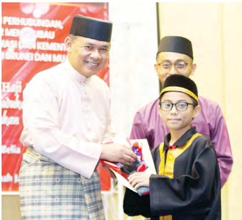
MENTERI Kebudayaan, Belia dan Sukan, Yang Berhormat Mejar Jeneral (B) Dato Paduka Seri Haji Aminuddin Ihsan bin Pehin Orang Kaya Saiful Mulok Dato Seri Paduka Haji Abidin (kiri) semasa menyampaikan hadiah dan sijil kepada para peserta Program Curahan Ilmu 2019 yang diraikan.

Turut hadir ialah Syarikat Penerbangan Diraja Brunei (RB); wakil-wakil Lembaga Pengarah; Pemangku Setiausaha Tetap dan Pemangku Timbalan Setiausaha Tetap (Pengangkutan), MTIC.