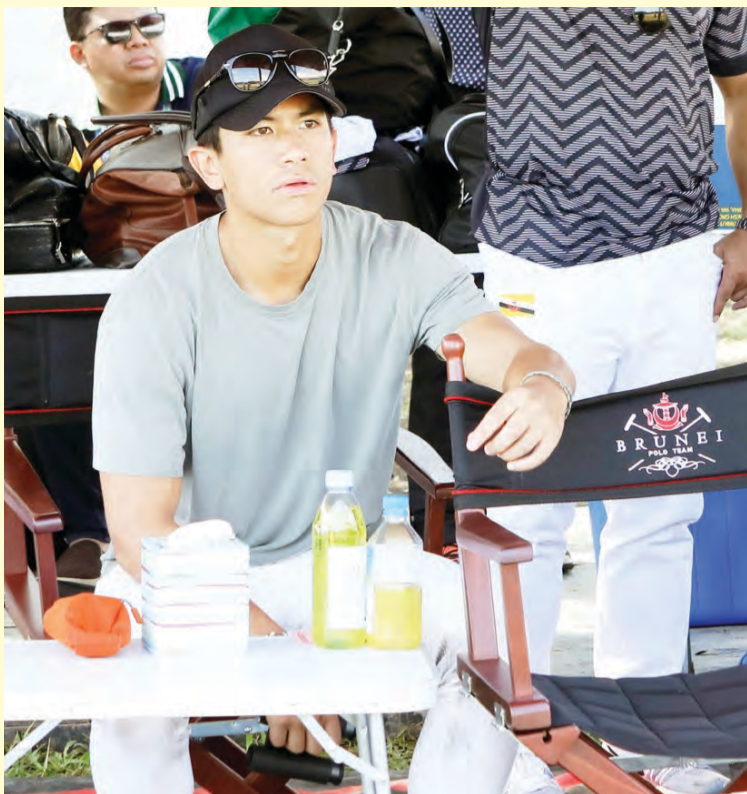
DULI Yang Teramat Mulia Paduka Seri Pengiran Muda 'Abdul Mateen ibni Kebawah Duli Yang Maha Mulia Paduka Seri Baginda Sultan Haji Hassanal Bolkiah Mu'izzaddin Waddaulah berkenan berangkat menyaksikan perlawanan kedua Sukan Polo Negara Brunei Darussalam bagi Divisyen B low goals (0 - 2) menentang Malaysia.

CALATAGAN, REPUBLIK FILIPINA , Jumaat, 6 Disember. - Skuad Polo Negara Brunei Darussalam terpaksa akur apabila tewas di tangan skuad Malaysia dengan jaringan 8 - 3 pada perlawanan kedua Sukan Polo bagi Divisyen B low goals (0 - 2) pada Temasya Sukan Asia Tenggara (Sukan SEA) Kali