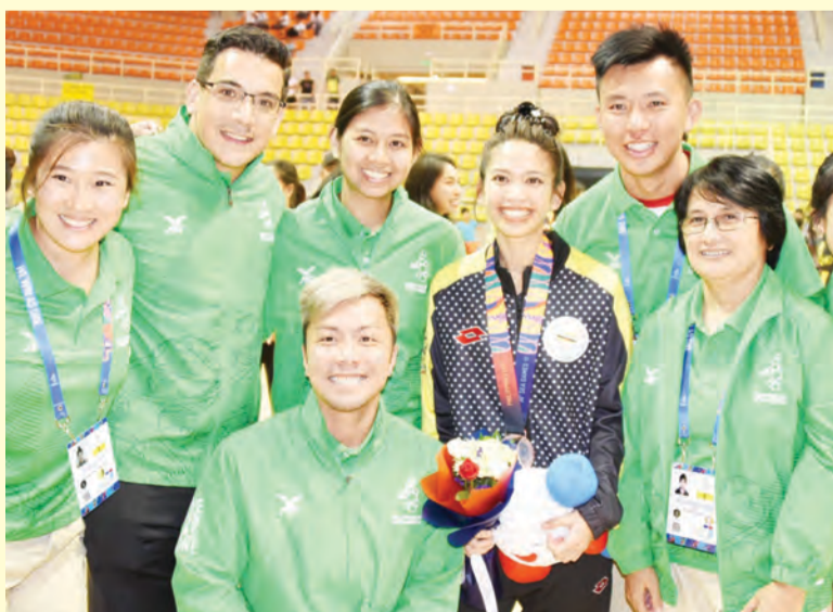
YTM Paduka Seri Pengiran Anak Puteri Fadzilah Lubabul Bolkiah berkenan bergambar dengan umpire perlawanan Bola Jaring Temasya Sukan SEA Ke-30.

MANILA, REPUBLIK negara pada Temasya Sukan FILIPINA, Isnin, 2 Disember. - SEA Kali Ke-30 akhirnya Penyertaan skuad Bola Jaring membuahkan hasil setelah