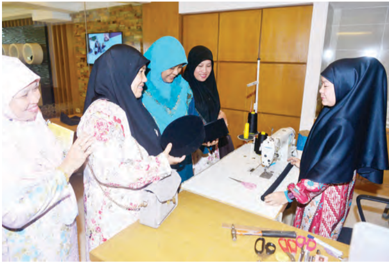
PESERTA Program Masyarakat Bermaklumat semasa mengadakan lawatan ke Pusat Latihan Kesenian dan Pertukangan Tangan Brunei.