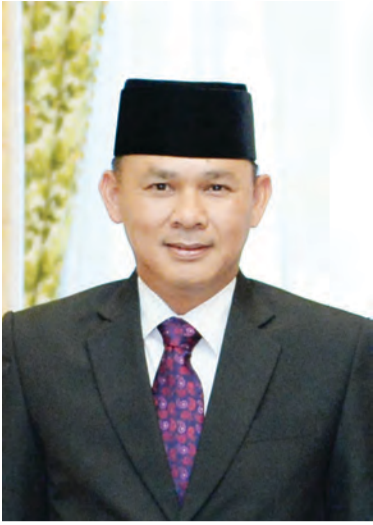
MENTERI Kebudayaan, Belia dan Sukan, Yang Berhormat Mejar Jeneral (B) Dato Paduka Seri Haji Aminuddin Ihsan bin Pehin Orang Kaya Saiful Mulok Dato Seri Paduka Haji Abidin.