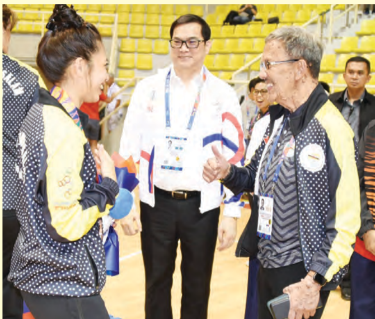
DULI Yang Teramat Mulia Paduka Seri Pengiran Bendahara Seri Maharaja Permaisua Pengiran Muda Haji Sufri Bolkiah ibni Al-Marhum Sultan Haji Omar 'Ali Saifuddin Sa'adul Khairi Waddien, Presiden Majlis Olimpik Kebangsaan Negara Brunei Darussalam dan Yang Teramat Mulia Paduka Seri Pengiran Anak Puteri Fadzilah Lubabul Bolkiah binti Kebawah Duli Yang Maha Mulia Paduka Seri Baginda Sultan Haji Hassanal Bolkiah Mu'izzaddin Waddaulah selaku Ketua Pasukan Bola Jaring Negara, Royal Bees pada upacara penyampaian pingat Sukan Bola Jaring Temasya Sukan SEA Kali Ke-30 yang berlangsung di STA, Rosa Multi-Sports Complex, Laguna, Republik Filipina.

MANILA, REPUBLIK negara pada Temasya Sukan FILIPINA, Isnin, 2 Disember. - SEA Kali Ke-30 akhirnya Penyertaan skuad Bola Jaring membuahkan hasil setelah