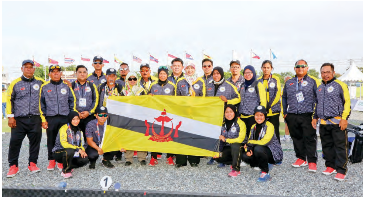
SKUAD Boling Padang lelaki dan wanita Negara Brunei Darussalam ketika bergambar ramai di CDC, Friendships Gate, Clark (kanan), sementara gambar kiri, pasukan boling padang negara wanita saat beraksi menentang pasukan lawan dari Malaysia. Manakala gambar bawah kiri, antara penyokong yang datang menyaksikan dan memberikan sokongan padu kepada pasukan negara yang bertanding.

Oleh : Nooratini Haji Abas