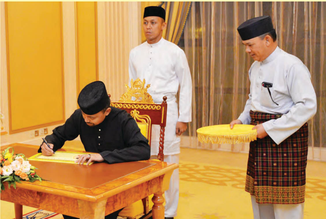
DULI Yang Teramat Mulia Paduka Seri Pengiran Muda Mahkota Pengiran Muda Haji Al-Muhtadee Billah ibni Kebawah Duli Yang Maha Mulia Paduka Seri Baginda Sultan Haji Hassanal Bolkiah Mu'izzaddin Waddaulah, Menteri Kanan di Jabatan Perdana Menteri berkenan menandatangani Lembaran Keberangkatan pada Majlis Perasmian Musabaqah Tilawatil Quran Belia Asia Tenggara (MTQBAT) Ke-9, Tahun 1441 Hijrah / 2019 Masihi.