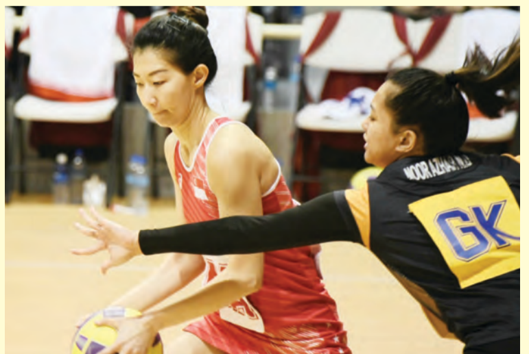
AKSI pada perlawanan Peringkat Akhir Bola Jaring Temasya Sukan SEA Ke-30 di antara Malaysia dan Singapura.