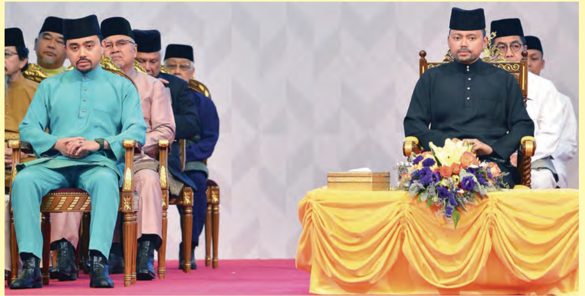
DULI Yang Teramat Mulia Paduka Seri Pengiran Muda Mahkota Pengiran Muda Haji Al-Muhtadee Billah ibni Kebawah Duli Yang Maha Mulia Paduka Seri Baginda Sultan Haji Hassanal Bolkiah Mu'izzaddin Waddaulah, Menteri Kanan di Jabatan Perdana Menteri bersama paduka adinda Duli Yang Teramat Mulia, Duli Yang Teramat Mulia Paduka Seri Pengiran Muda 'Abdul Malik berkenan berangkat ke Majlis Perasmian Musabaqah Tilawatil Quran Belia Asia Tenggara (MTQBAT) Ke-9, Tahun 1441 Hijrah / 2019 Masihi.

DYTm bersabda melahirkan harapan agar Musabaqah Belia ini akan terus dipertingkatkan ke arah mendekatkan lebih ramai belia Muslimin Asia Tenggara kepada Al-Quran, di mana