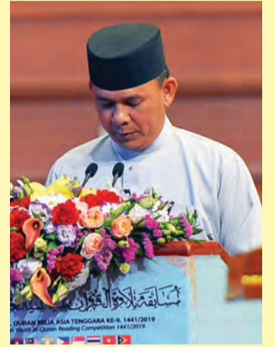
MENTERI Kebudayaan, Belia dan Sukan, Yang Berhormat Mejar Jeneral (B) Dato Paduka Seri Haji Aminuddin Ihsan bin Pehin Orang Kaya Saiful Mulok Dato Seri Paduka Haji Abidin ketika sembah alu-aluan.

Inisiatif kerajaan ini mendapat sambutan Negara-negara Anggota ASEAN dan Republik Demokratik Timor Leste yang menjadi kebanggaan negara kerana negara berupaya melakar satu program serantau yang memberikan kesannya terhadap belia-belia di rantau ini, antaranya memupuk dan menyemai persahabatan juga persaudaraan serta jaringan kerjasama Belia-belia Asia Tenggara, di samping membantu meningkatkan mutu pembacaan Al-Quran dalam kalangan Belia-belia Asia Tenggara dan menghubungkan kesinambungan mutu bacaan dari peringkat belia, seterusnya ke peringkat dewasa, sama ada di peringkat kebangsaan atau antarabangsa.