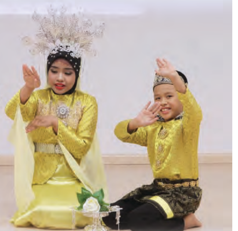
Oleh : Ak. Jefferi Pg. Durahman

DALAM masyarakat yang serba berkembang maju dalam era globalisasi yang moden ini, kefahaman dalam sama-sama menjaga kesenian budaya etnik adalah sangat penting. Salah satu khazanah warisan kebudayaan negara yang berharga dan perlu dikekalkan supaya tidak pupus ditelan zaman ialah Tarian Adai-Adai.