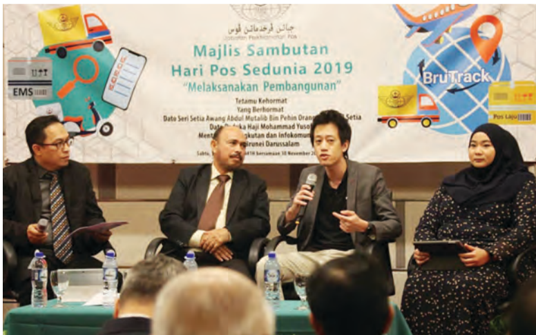
SAMBUTAN Hari Pos Sedunia diserikan dengan mini forum yang bertajuk 'Transformation - Mindset Towards 4th Industrial Revolution - The Challenges in the Postal Industry', yang dikendalikan oleh ahli-ahli panel jemputan yang berkaitan dengan industri pos mengikut perspektif bidang masing-masing.

Sambutan Hari Pos Sedunia disambut bersempena dengan memperingati hari ulang tahun penubuhan Kesatuan Pos Sedunia (Universal Postal Union) sejak tahun 1874. Jabatan Perkhidmatan Pos berharap agar Sambutan Hari Pos Sedunia yang dikendalikan pada tahun ini akan dapat dimanfaatkan oleh rakan-rakan perniagaan dan orang ramai dalam membarigakan perkhidmatan-perkhidmatan pos yang sedia-ada dan akan datang.