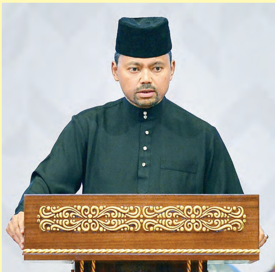
DULI Yang Teramat Mulia Paduka Seri Pengiran Muda Mahkota Pengiran Muda Haji Al-Muhtadee Billah ibni Kebawah Duli Yang Maha Mulia Paduka Seri Baginda Sultan Haji Hassanal Bolkihah Mu'izzaddin Waddaulah, Menteri Kanan di Jabatan Perdana Menteri bersabda pada Majlis Pembukaan Rasmi Musabaqah Tilawatil Quran Belia Asia Tenggara Ke-9, Tahun 1441 Hijrah / 2019 Masihi, bertempat di Dewan Plenary, Pusat Persidangan Antarabangsa, Berakas. (Lihat muka 3 hingga 4).