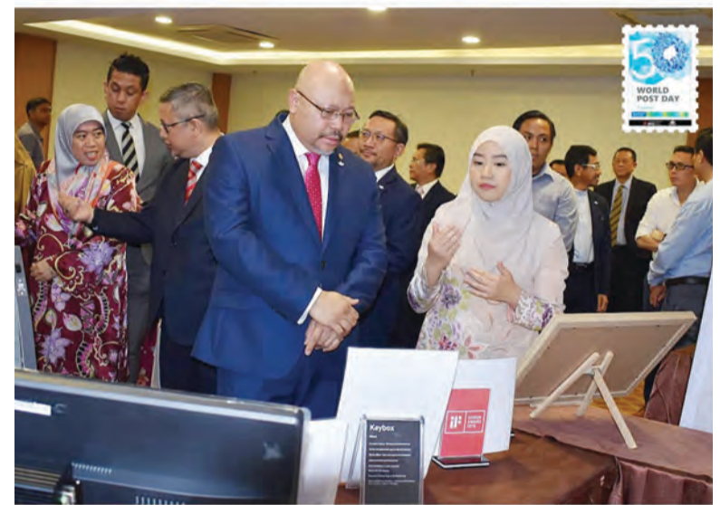
MENTERI Pengangkutan dan Infokomunikasi, Yang Berhormat Dato Seri Setia Awang Abdul Mutalib bin Pehin Orang Kaya Seri Setia Dato Paduka Haji Mohammad Yusof (dua, kanan) menyaksikan mini pameran sempena dengan Majlis Sambutan Hari Pos Sedunia Ke-145 Tahun, bertempat di Jupiter Banquet Room, Hotel Starlodge, Jerudong.