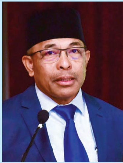
MENTERI Pembangunan, Yang Berhormat Dato Seri Setia Ir. Awang Haji Suhaimi bin Haji Gafar semasa berucap pada Mesyuarat Agung Tahunan Pertengahan Ukur Jurutera dan Arkitek (PUJA) 2018 / 2019 dan Pelancaran PUJA Journal, Sistem Pengurusan CPD Digital dan Program Pembayaran Dalam Talian pada Sabtu, 11 Jamadilakhir 1440 Hijrah bersamaan 16 Februari 2019 Masihi di Dewan Bertabur, Kementerian Pembangunan.

Sebagai pelaku utama dalam industri, kita tidak akan mengambil mudah perkara ini dan hendaklah saling tampil dengan cara dan strategi untuk menjadi lebih cekap dan rasional dalam meningkatkan perkhidmatan kami kepada pelanggan. Kita perlu sentiasa mengukuhkan dan menyelaraskan garis panduan bangunan kita, menjadikannya mudah disesuaikan kerana ia merupakan salah satu alat rujukan semasa menangani proses binaan. Kita tidak akan berkompromi dengan keselamatan dan sekuriti bangunan kerana ia adalah salah satu komponen penting, sama