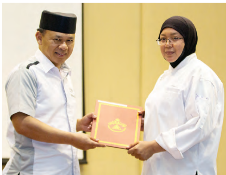
MENTERI Kebudayaan, Belia dan Sukan, Yang Berhormat Mejar Jeneral (B) Dato Paduka Seri Haji Aminuddin Ihsan bin Pehin Orang Kaya Saiful Mulok Dato Seri Paduka Haji Abidin semasa menyampaikan sikit kepada salah seorang peserta (atas). Sementara gambar kanan, Yang Berhormat menyaksikan secara dekat hasil buat Kemahiran Kursus Masakan dan Pastrri.

Selesai sahaja sesi tazkirah, para peserta program bersama para jemaah yang hadir sama-sama membaca Surah Al-Kahfi dan Surah Al-Waqiah serta seterusnya