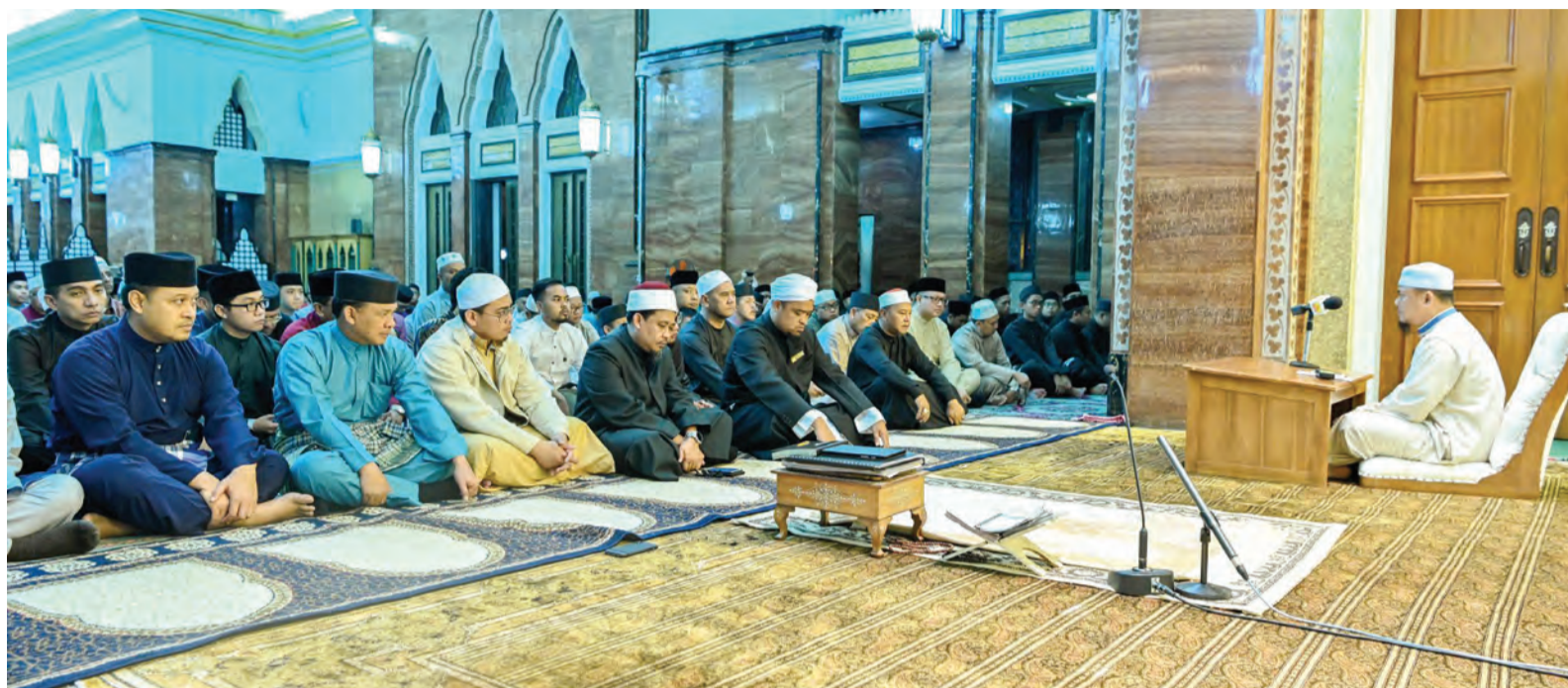
Berita dan Foto : Mohamad Azmi Awang Damit