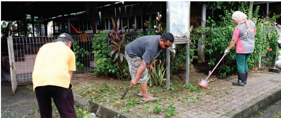
KERJA-KERJA pembersihan meliputi pemotongan rumput, pembuangan kayu-kayu, pembersihan longkang dan kawasan lainnya.

Pihak kerajaan telah menyediakan beberapa infrastruktur termasuk tong-tong sampah, namun isu tersebut bukanlah seharusnya ditangani oleh pihak kerajaan sahaja, orang ramai juga seharusnya sama-sama menjaga kebersihan dengan