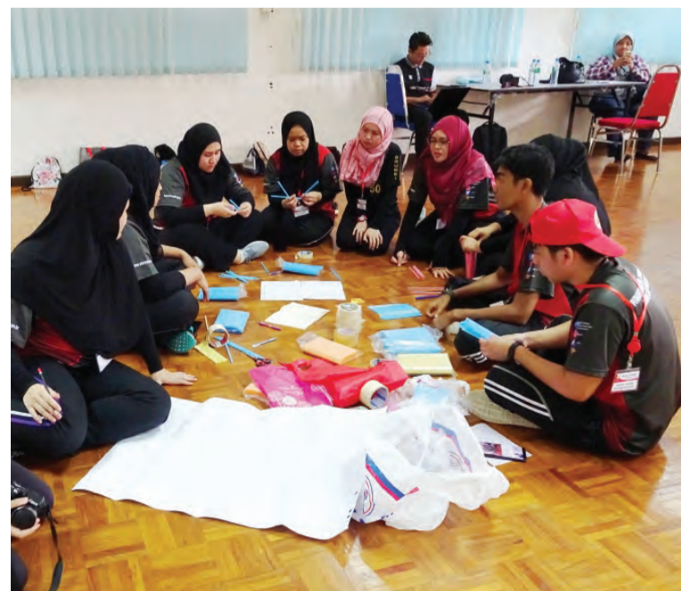
PARA peserta Program Perkampungan Sivik Lepas Ijazah Negara Brunei Darussalam Kali Kedua bagi Tahun 2019 semasa menjalani aktiviti Team Building , bertempat di Kompleks Sukan Sungai Kebun.

Seramai 15 peserta mengikuti Program Perkampungan Sivik anjuran Jabatan Penerangan melalui Unit Kenegaraan, Bahagian Kenegaraan dan Kemasyarakatan berkenaan.