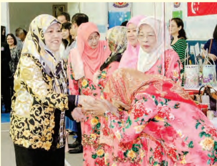
YTM berkenan menerima junjung ziarah daripada ahli-ahli dan kakitangan Pusat Ehsan Al-Ameerah Al-Hajjah Maryam.

Selain jualan, pelbagai aktiviti juga diadakan termasuk permainan, perlawanan PS4, cabutan bertuah dan banyak lagi.