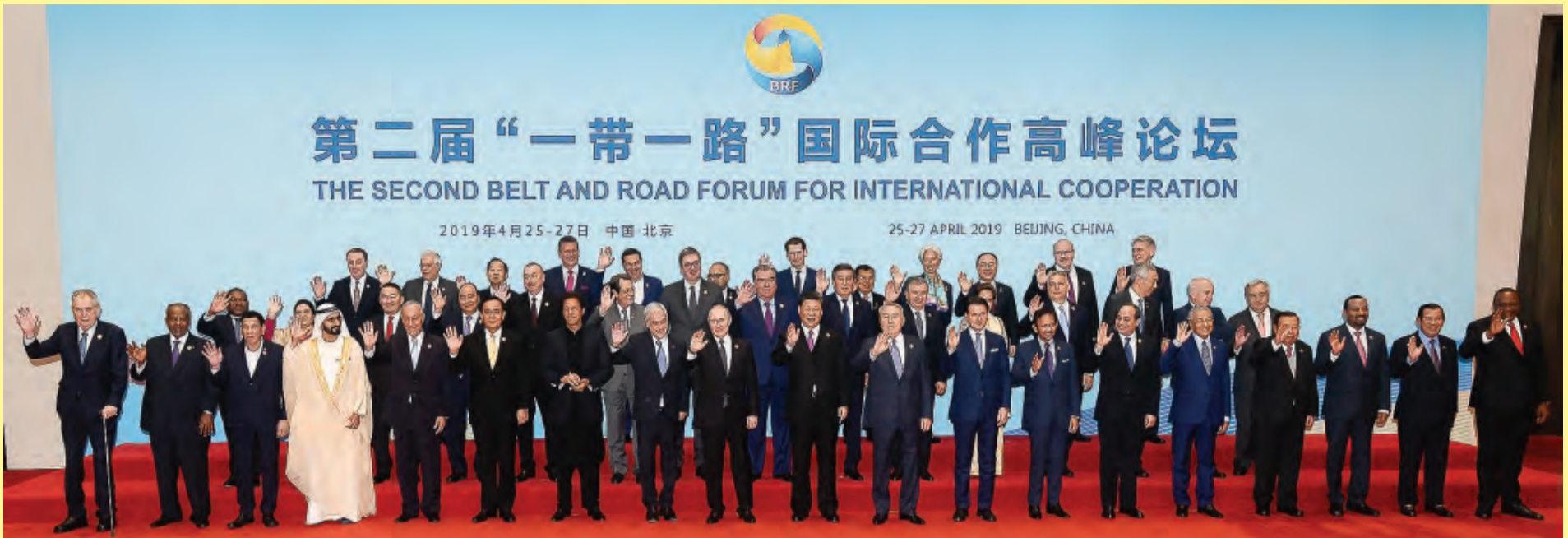
KEBAWAH Duli Yang Maha Mulia Paduka Seri Baginda Sultan Haji Hassanal Bolkiah Mu'izzaddin Waddaulah ibni Al-Marhum Sultan Haji Omar 'Ali Saifuddien Sa'adul Khairi Waddien, Sultan dan Yang Di-Pertuan Negara Brunei Darussalam berkenan berangkat menyertai sesi bergambar kenangan semasa Majlis Sambutan Rasmi sempena The 2nd Belt and Road Forum for International Cooperation.