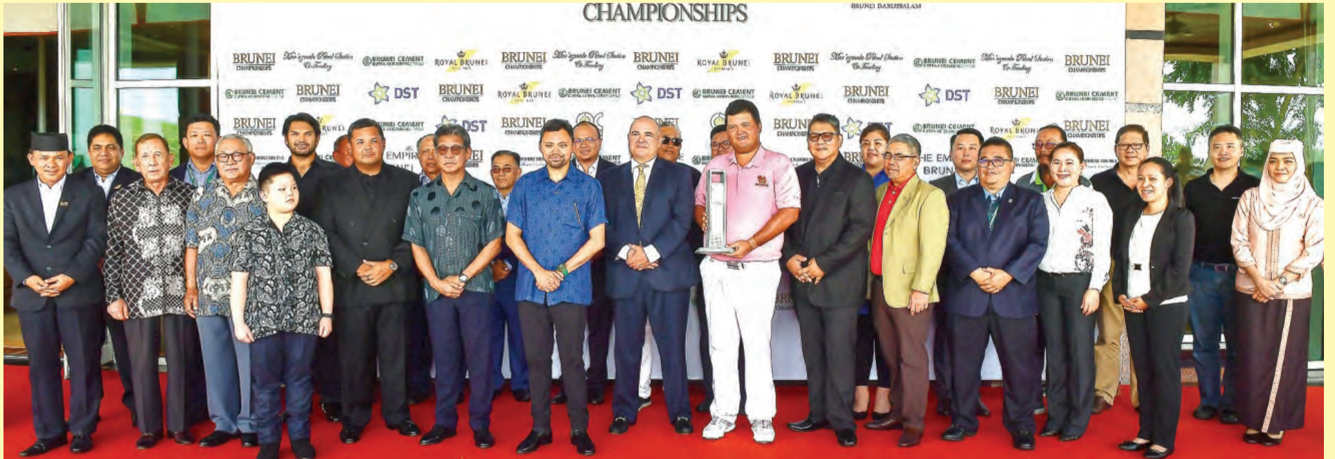
DULI Yang Teramat Mulia Paduka Seri Pengiran Muda Mahkota Pengiran Muda Haji Al-Muhtadee Billah ibni Kebawah Duli Yang Maha Mulia Paduka Seri Baginda Sultan Haji Hassanal Bolkiah Mu'izzaddin Waddaulah, Timbalan Sultan berkenan menyertai sesi bergambar ramai.