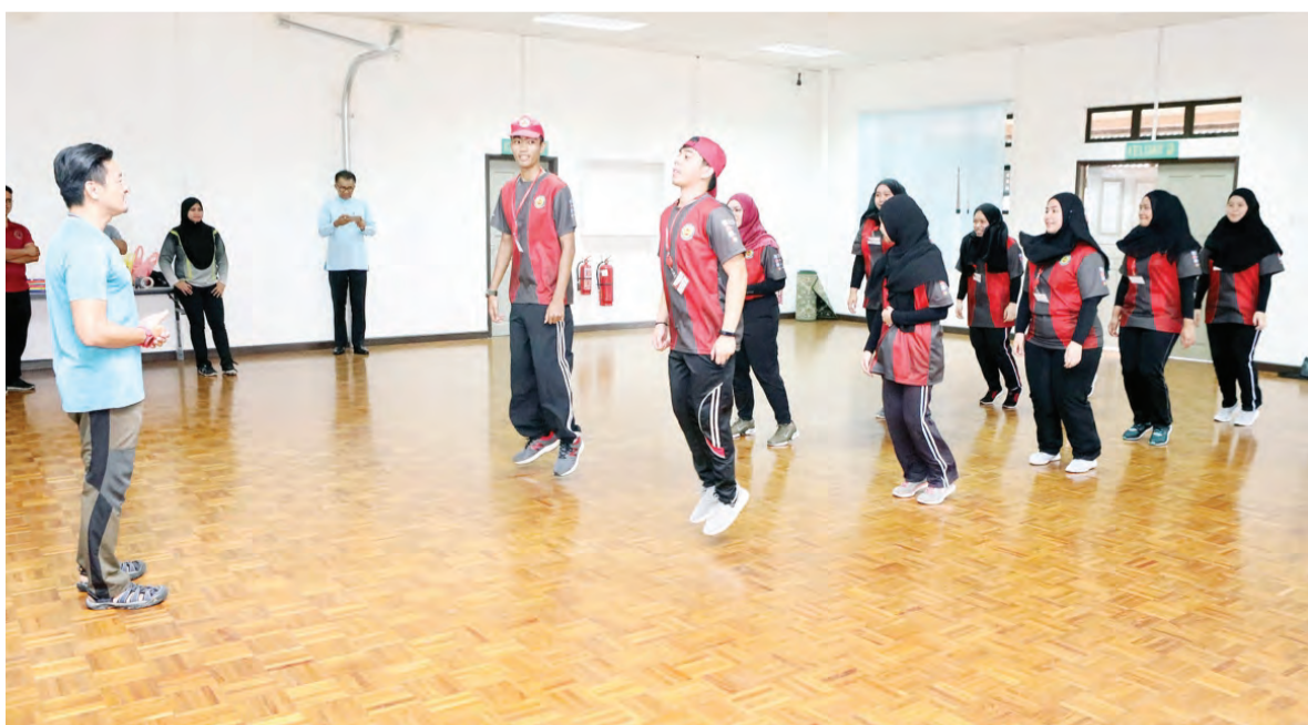
PARA peserta Program Perkampungan Sivik Lepas Ijazah semasa sesi Ice Breaking dan Team Building , dikendalikan oleh Outward Bound Brunei Darussalam (OBBD).