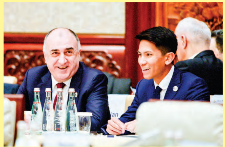
BERANGKAT sama ialah paduka anakanda Kebawah Duli Yang Maha Mulia, Duli Yang Teramat Mulia Paduka Seri Pengiran Muda 'Abdul Mateen.

Siaran Akhbar : Jabatan Perdana Menteri