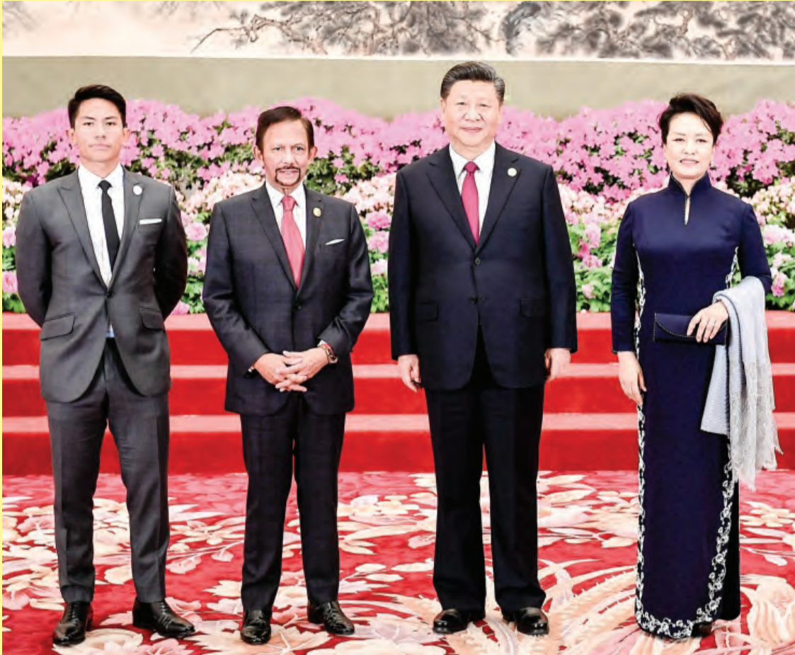
Siaran Akhbar : Jabatan Perdana Menteri

KEBAWAH Duli Yang Maha Mulia Paduka Seri Baginda Sultan Haji Hassanah Bolkiah Mu'izzaddin Waddaulah ibni Al-Marhum Sultan Haji Omar 'Ali Saifuddin Sa'adul Khairi Waddien, Sultan dan Yang Di-Pertuan Negara Brunei Darussalam bersama Presiden Republik Rakyat China, Tuan Yang Terutama Xi Jinping dan isteri berkenan bergambar ramai sebelum Majlis Santap Malam Gala di Dewan Persantapan, Great Hall of the People, Beijing. Berangkat sama ialah paduka anakanda Kebawah Duli Yang Maha Mulia, Duli Yang Teramat Mulia Paduka Seri Pengiran Muda 'Abdul Mateen.