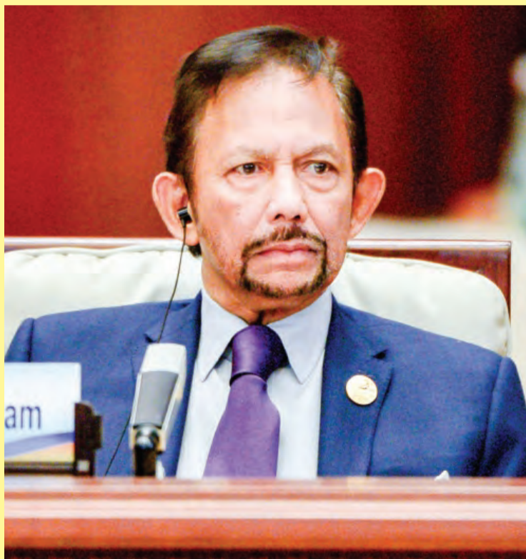
KEBAWAH Duli Yang Maha Mulia Paduka Seri Baginda Sultan Haji Hassanal Bolkiah Mu'izzaddin Waddaulah ibni Al-Marhum Sultan Haji Omar 'Ali Saifuddien Sa'adul Khairi Waddien, Sultan dan Yang Di-Pertuan Negara Brunei Darussalam berkenan menghadiri Leaders' Roundtable Session I: Boosting Connectivity to Explore New Sources of Growth di Jixian Hall, 2nd Floor, Yanqi Lake, International Convention Center (ICC), Beijing.