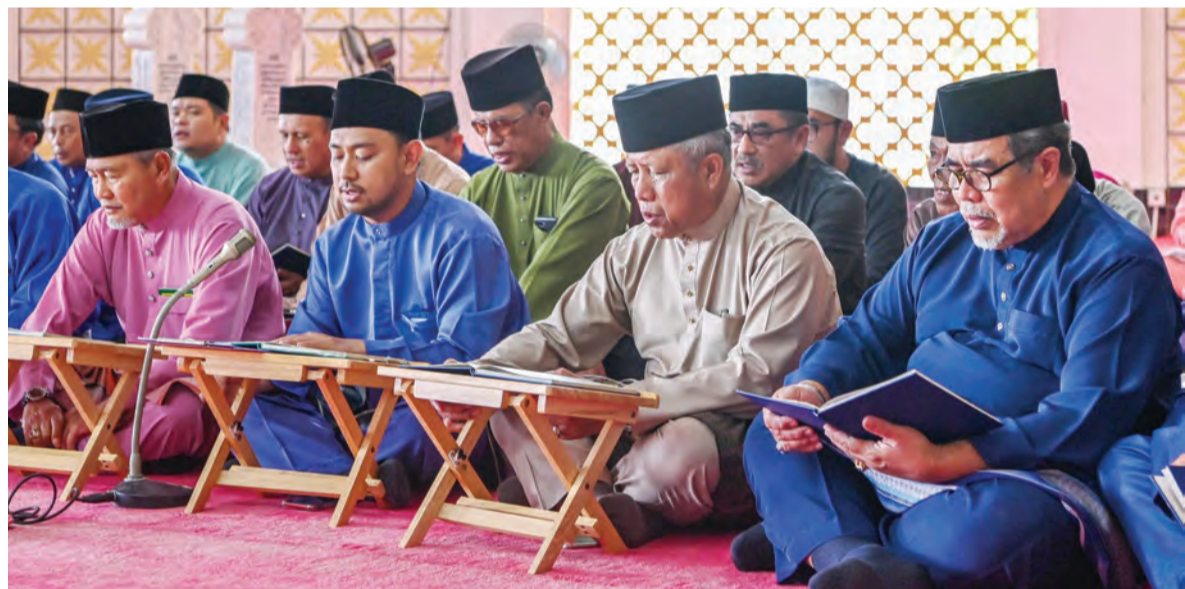
MENTERI Pertahanan Kedua, Yang Berhormat Pehin Datu Lailaraja Mejar Jeneral (B) Dato Paduka Seri Haji Awang Halbi bin Haji Mohd. Yussof (dua, kanan) yang juga selaku Penaung Ahli Jawatankuasa Takmir Masjid Kampung Kilanas hadir pada Majlis Membaca Surah Yaa Siin dan Tahlil Majlis Perundingan Kampung Kilanas di Kubah Makam Diraja.

Sementara itu, kelmarin seramai 100 ahli Persatuan Saudara-Saudara Baharu Negara Brunei Darussalam dan warga Pusat Da'wah Islamiah (PDI) juga mengadakan Majlis Bertahlil dan