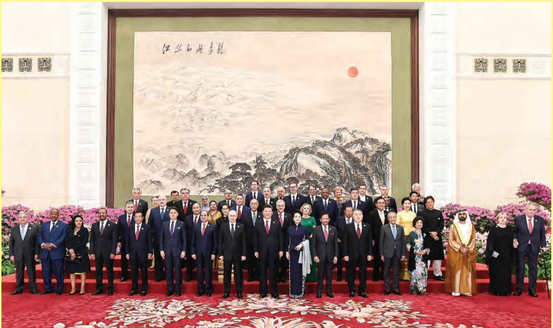
KEBAWAH DYMM berkenan bergambar ramai bersama para pemimpin yang menghadiri Majlis Santap Malam Gala di Dewan Persantapan, Great Hall of the People, Beijing. Berangkat sama ialah DYTM Paduka Seri Pengiran Muda 'Abdul Mateen.

ibni Al-Marhum Sultan Haji Omar 'Ali Saifuddin Sa'adul Khairi Waddien, Sultan dan Yang