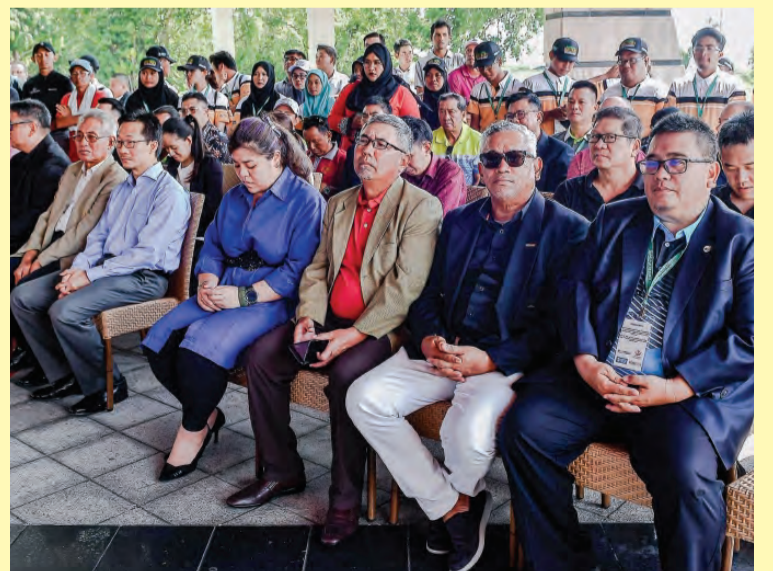
ANTARA yang hadir pada Majlis Kejohanan Golf Butra Heidelberg Cement (BHC) Brunei 2019.