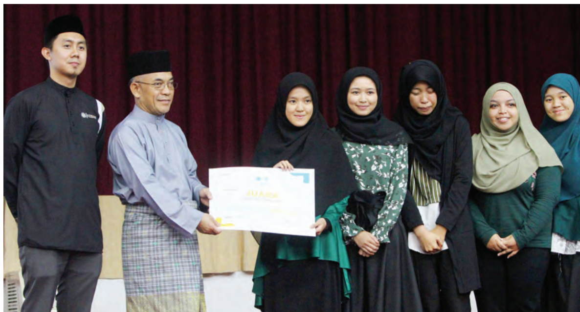
MENTERI Sumber-Sumber Utama dan Pelancongan, Yang Berhormat Dato Seri Setia Awang Haji Ali bin Haji Apong (dua, kiri) menyampaikan hadiah kepada Kumpulan Kembara Aesthete "Lakastah Singgah ke Temburong" selaku juara Program Belia Brunei Berbakti (3B) Tahun 2019.

BANDAR SERI BEGAWAN, Ahad, 28 April.- Kumpulan Kembara Aesthete "Lakastah Singgah ke Temburong" muncul juara Program Belia Brunei Berbakti (3B) Tahun 2019 dan membawa pulang hadiah wang tunai sebanyak BND500 dan sijil penyertaan. Naib Juara dimenangi oleh