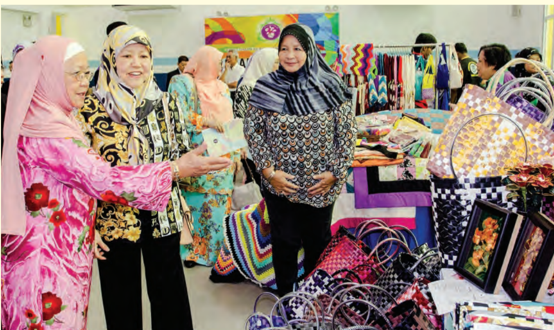
YTM berkenan mendengarkan sembah penerangan semasa berangkat menyaksikan hasil jualan Pusat Ehsan (kiri dan kanan).