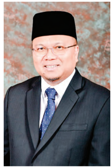
MENTERI Kesihatan, Yang Berhormat Dato Seri Setia Dr. Awang Haji Md. Isham bin Haji Jaafar.

Di atas komitmen yang berterusan daripada Kerajaan Kebawah Duli Yang Maha Mulia Paduka Seri Baginda Sultan dan Yang Di-Pertuan Negara Brunei Darussalam pula, Program Imunisasi Kanak-kanak Kebangsaan khususnya di bawah program imunisasi bagi yang berisiko tinggi dan penjagaan kesihatan awam telah berjaya menjadikan Negara Brunei