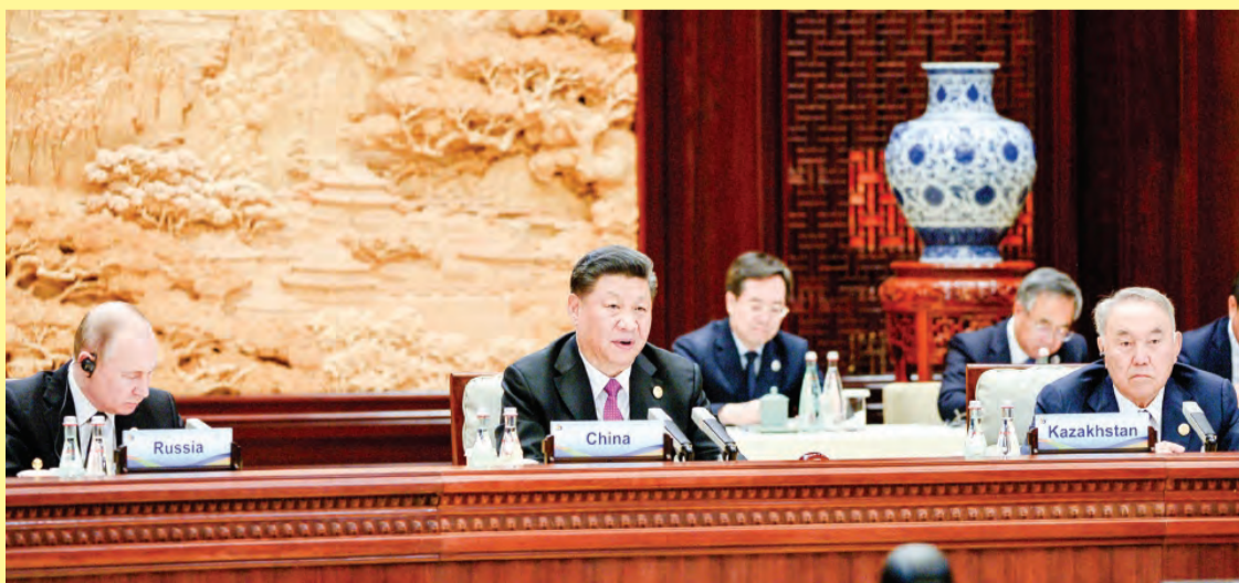
PRESIDEN Republik Rakyat China, Tuan Yang Terutama Xi Jinping ketika berucap pada mesyuarat berkenaan.

Sesi-sesi Mesyuarat pada hari ini telah membincangkan beberapa agenda penting, antaranya usaha meningkatkan kesalinghubungan bagi meneroka sumber pertumbuhan baharu; pengukuhan dasar sinergi dan mengeratkan rakan kongsi; juga usaha-usaha mempromosikan pembangunan hijau dan mampan selaras dengan Agenda United Nation's 2030.