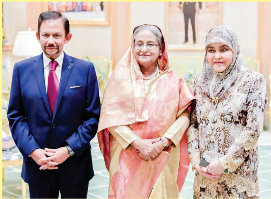
KEBAWAH Duli Yang Maha Mulia Paduka Seri Baginda Sultan dan Yang Di-Pertuan Negara Brunei Darussalam dan Kebawah Duli Yang Maha Mulia Paduka Seri Baginda Raja Isteri Pengiran Anak Hajah Saleha berkenan bergambar bersama Perdana Menteri Republik Rakyat Bangladesh, PYT Sheikh Hasina.

yang berlangsung hari ini titah baginda, akan mengukuhkan lagi hubungan dan memastikan ia akan terus teguh pada masa hadapan.