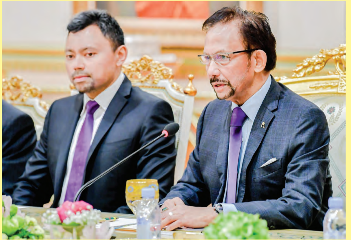
KEBAWAH Duli Yang Maha Mulia Paduka Seri Baginda Sultan Haji Hassanal Bolkiah Mu'izzaddin Waddaulah ibni Al-Marhum Sultan Haji Omar 'Ali Saifuddien Sa'adul Khairi Waddien, Sultan dan Yang Di-Pertuan Negara Brunei Darussalam berkenan mengurniakan titah pada Majlis Perjumpaan Dua Hala bersama Perdana Menteri Republik Rakyat Bangladesh, Puan Yang Terutama Sheikh Hasina.

Sementara itu, PYT dalam ucapan balasnya, antara lain menyebarkan mengenai hubungan penting di antara Republik Rakyat Bangladesh bersama Negara Brunei Darussalam yang mempunyai nilai yang sama dan berharap kedua-dua belah pihak akan meluaskan lagi bidang kerjasama.