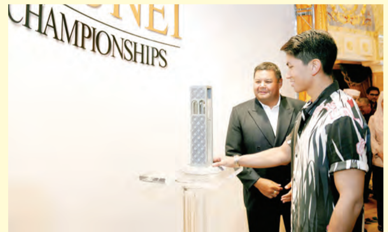
DULI Yang Teramat Mulia Paduka Seri Pengiran Muda 'Abdul Mateen ketika berkenan merasmikan Kejohanan Golf Butra Heidelberg Cement (BHC) Brunei 2019.

Antara objektif utama kejohanan tersebut ialah bagi mempromosikan Brunei sebagai destinasi golf premium di rantau ini, selain dapat memberikan galakan kepada generasi muda belia di negara ini untuk menyemarakkan dan menyertai sukan berkenaan pada masa akan datang.