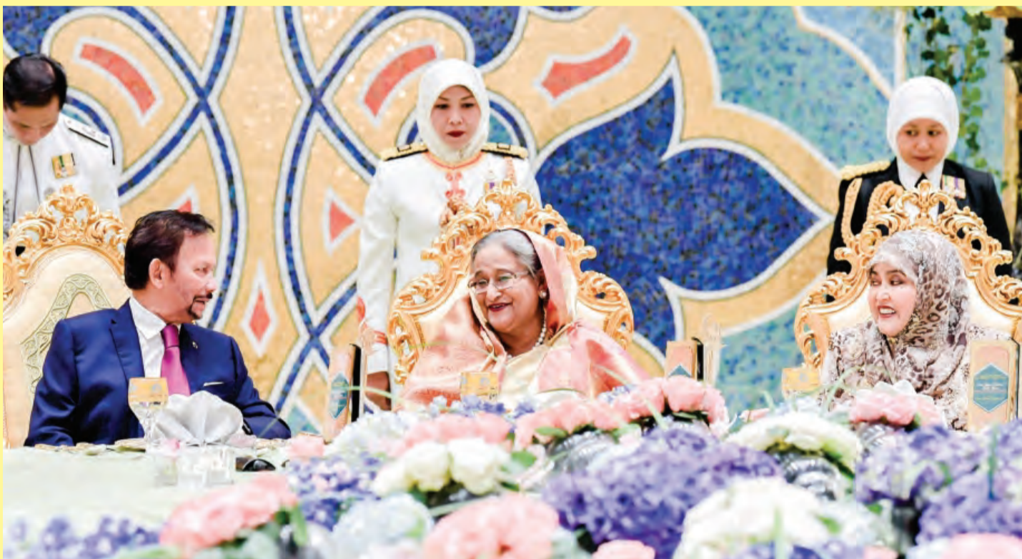
KEBAWAH Duli Yang Maha Mulia Paduka Seri Baginda Sultan Haji Hassanal Bolkiah Mu'izzaddin Waddaulah ibni Al-Marhum Sultan Haji Omar 'Ali Saifuddin Sa'adul Khairi Waddien, Sultan dan Yang Di-Pertuan Negara Brunei Darussalam dan Kebawah Duli Yang Maha Mulia Paduka Seri Baginda Raja Isteri Pengiran Anak Hajah Saleha binti Al-Marhum Pengiran Pemancha Pengiran Anak Haji Mohamed Alam berkenan berangkat ke Majlis Persantapan Rasmi bagi meraikan Perdana Menteri Republik Rakyat Bangladesh, Puan Yang Terutama Sheikh Hasina di Dewan Persantapan, Istana Nurul Iman. (Lihat muka 2, 3, dan 4)