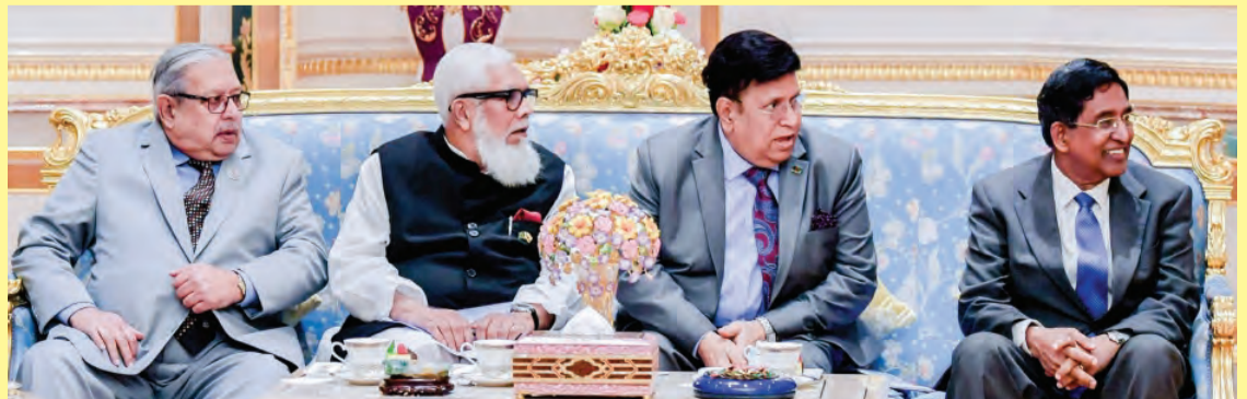
ANTARA rombongan dari Republik Rakyat Bangladesh yang hadir semasa Majlis Mengadap (kiri dan kanan).