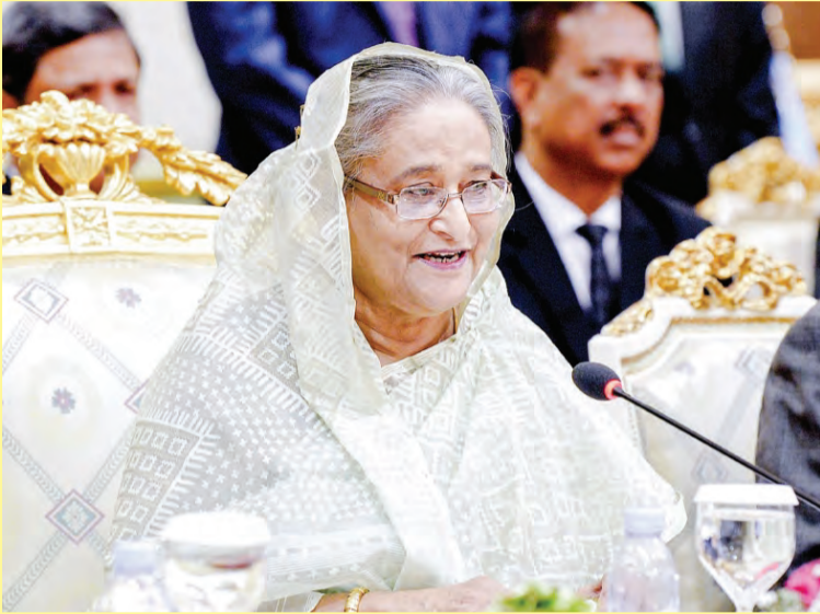
PERDANA Menteri Republik Rakyat Bangladesh, Puan Yang Terutama Sheikh Hasina semasa menyampaikan ucapan balas pada Majlis Perjumpaan Dua Hala.