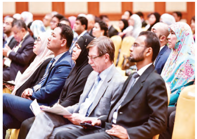
ANTARA yang hadir menyertai Seminar Bersama Brunei-Oman Kali Ketiga.