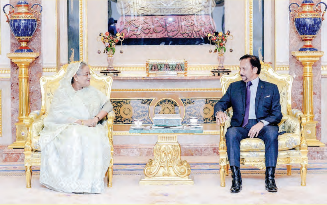
KEBAWAH Duli Yang Maha Mulia Paduka Seri Baginda Sultan Haji Hassanal Bolkiah Mu'izzaddin Waddaulah ibni Al-Marhum Sultan Haji Omar 'Ali Saifuddien Sa'adul Khairi Waddien, Sultan dan Yang Di-Pertuan Negara Brunei Darussalam berkenan menerima mengadap Perdana Menteri Republik Rakyat Bangladesh, Puan Yang Terutama Sheikh Hasina di Cheradi Laila Kenchana, Istana Nurul Iman.

BANDAR SERI BEGAWAN, Isnin, 22 April. - Kebawah Duli Yang Maha Mulia Paduka Seri Baginda Sultan Haji Hassanal Bolkiah Mu'izzaddin Waddaulah ibni Al-Marhum Sultan Haji Omar 'Ali Saifuddien Sa'adul Khairi Waddien, Sultan dan Yang Di-Pertuan Negara Brunei Darussalam berkenan menerima mengadap Perdana Menteri Republik Rakyat Bangladesh,