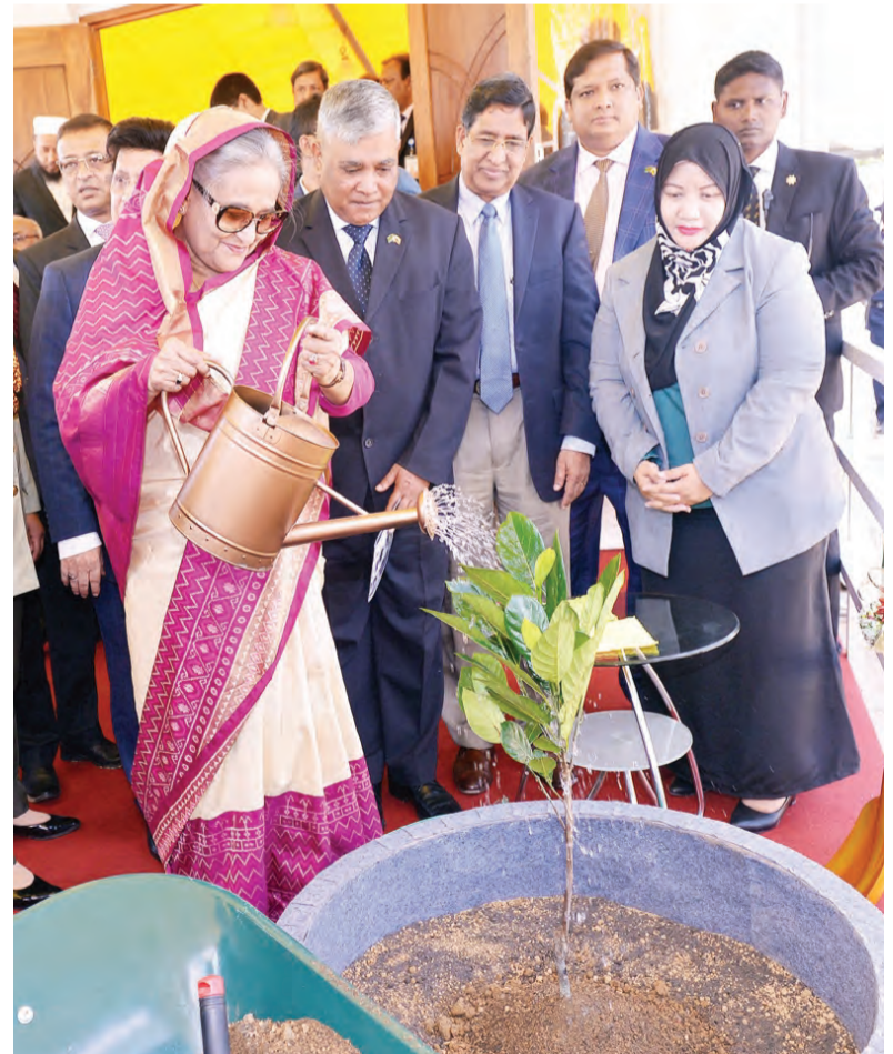
PERDANA Menteri Republik Rakyat Bangladesh menanam pokok sempena Majlis Peletakan Batu Asas Bangunan Pejabat dan Kediaman Suruhanjaya Tinggi Republik Rakyat Bangladesh di Negara Brunei Darussalam.

Bangunan tersebut akan menggambarkan semangat dan kekayaan budaya Bangladesh, di mana penggunaan lambang nasional republik tersebut telah dipilih sebagai pendekatan untuk reka bentuk skim yang dicadangkan.