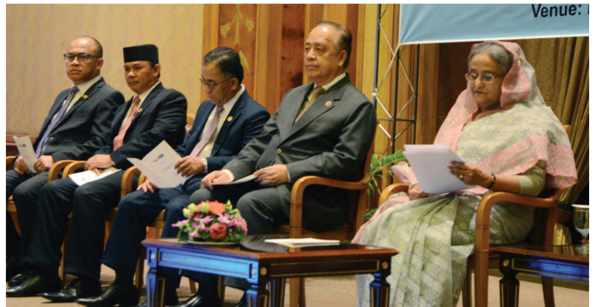
PERDANA Menteri Republik Rakyat Bangladesh, Puan Yang Terutama Sheikh Hasina hadir selaku tetamu kehormat pada Forum Perniagaan antara Komuniti Perniagaan Negara Brunei Darussalam dan Republik Rakyat Bangladesh.

penubuhan dan menjalankan operasi di NBD, serta penyediaan tenaga kerja berpendidikan dan berkemahiran. Hadir selaku tetamu kehormat pada forum tersebut ialah Perdana Menteri Republik Rakyat Bangladesh, Puan Yang Terutama Sheikh Hasina. Puan Yang Terutama Perdana Menteri Republik Rakyat Bangladesh berkata, Bangladesh kini menjadi ekonomi kedua terbesar di Asia Selatan dan Ke-41 di dunia dalam nominal KDNK. Pengurusan ekonomi makro yang cermat, sokongan dasar terhadap keusahawanan swasta, dan pelaburan-pelaburan teguh dalam infrastruktur dan pembangunan manusia menyumbang kepada kejayaan yang menakjubkan pada ekonomi Bangladesh. Forum tersebut turut dihadiri Menteri Sumber-Sumber Utama dan Pelancongan, Yang Berhormat Dato Seri Setia Awang Haji Ali bin Haji Apong selaku Menteri