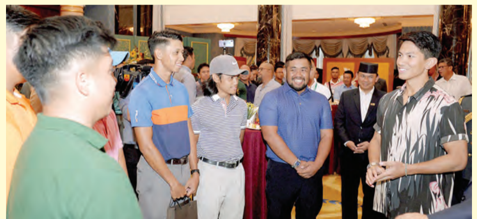
DYTMM Paduka Seri Pengiran Muda 'Abdul Mateen ketika berkenan beramah mesra bersama para pemain yang menyertai Kejohanan Golf Butra Heidelberg Cement (BHC) Brunei 2019 (kiri dan kanan).