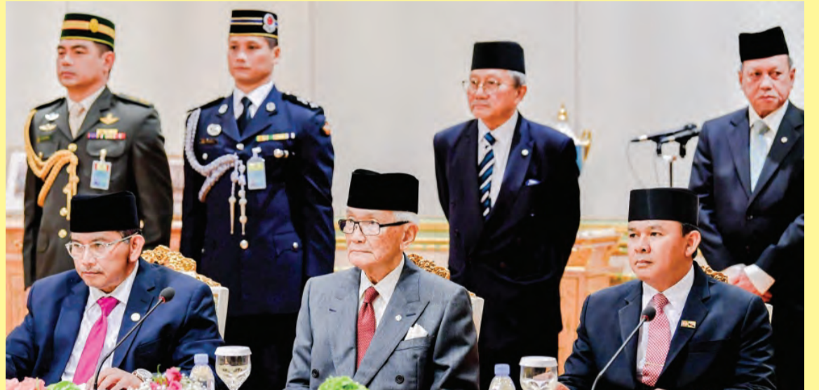
Menteri Kabinet yang hadir pada Majlis Perjumpaan Dua Hala tersebut.

Tambah PYT lagi, hubungan ekonomi yang sedia ada akan mengukuhkan lagi bidang kerjasama.