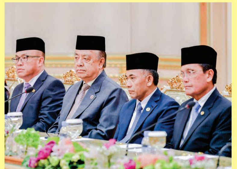
SEBAHAGIAN Menteri Kabinet yang hadir sama pada majlis berkenaan.