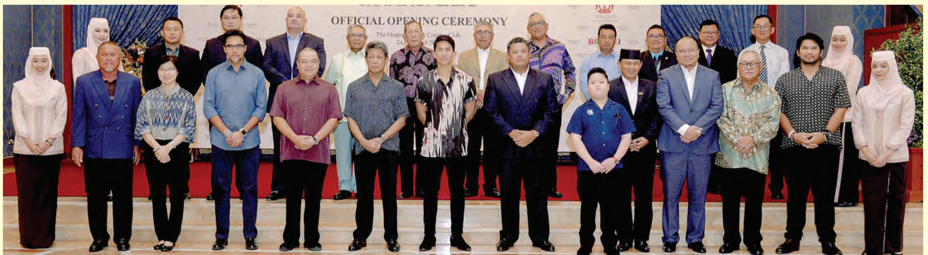
DYTMM Paduka Seri Pengiran Muda 'Abdul Mateen berkenan bergambar ramai.