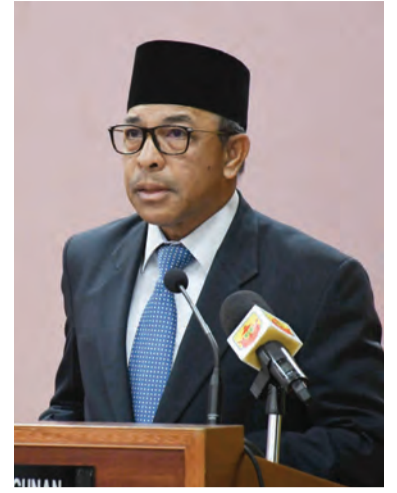
MENTERI Pembangunan, Yang Berhormat Dato Seri Setia Ir. Awang Haji Suhaimi bin Haji Gafar semasa berucap pada Majlis Sambutan Hari Bumi 2019.

Semua itu, jelas Yang Berhormat merupakan antara usaha yang dilaksanakan oleh pihak kerajaan dalam meningkatkan lagi kesedaran orang ramai akan pentingnya untuk menjaga alam sekitar dan menyemai rasa tanggungjawab setiap individu untuk memainkan peranan masing-masing dalam penjagaan dan pemeliharaan alam sekitar.