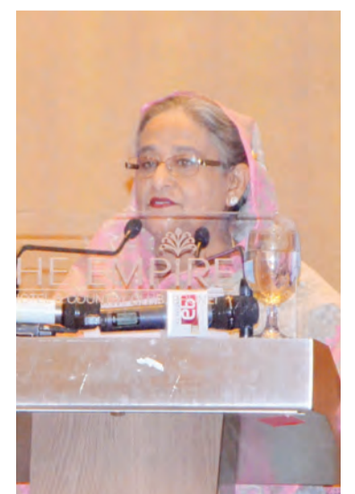
PERDANA Menteri Republik Rakyat Bangladesh, Puan Yang Terutama Sheikh Hasina ketika berucap pada majlis tersebut.