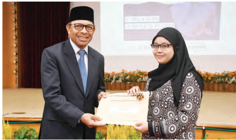
YANG Berhormat Menteri Pembangunan semasa menyampaikan hadiah kepada pemenang yang menyertai pertandingan poster.