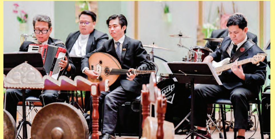
PERSEMBAHAN muzikal memrihkan suasana Majlis Persantapan Rasmi tersebut.