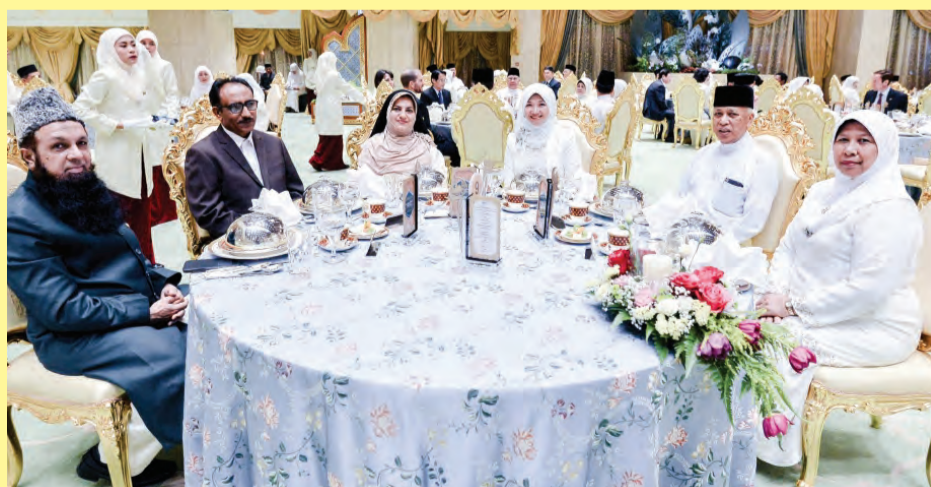
ANTARA yang hadir pada majlis tersebut.