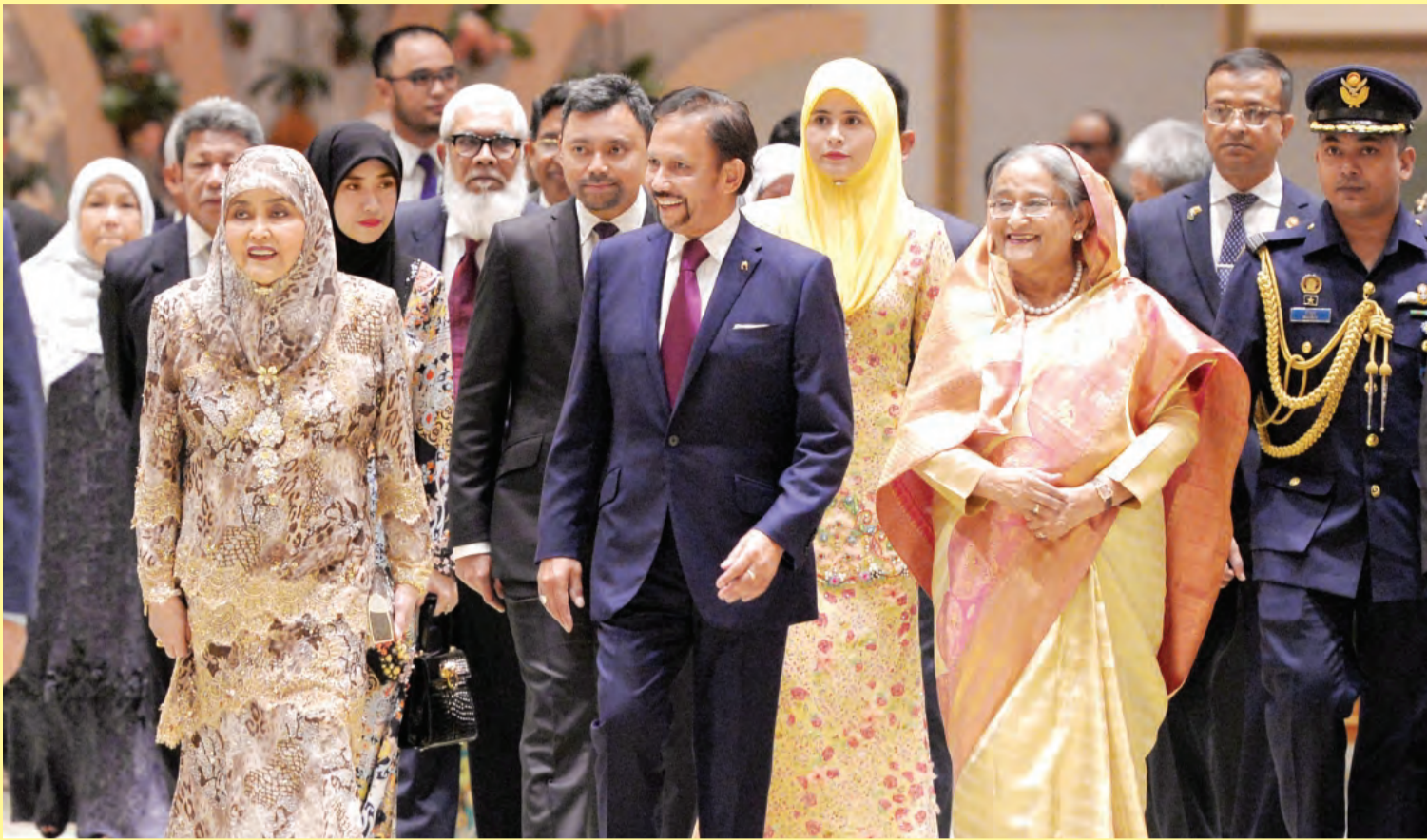
KEBAWAH Duli Yang Maha Mulia Paduka Seri Baginda Sultan Haji Hassanal Bolkiah Mu'izzaddin Waddaulah ibni Al-Marhum Sultan Haji Omar 'Ali Saifuddien Sa'adul Khairi Waddien, Sultan dan Yang Di-Pertuan Negara Brunei Darussalam dan Kebawah Duli Yang Maha Mulia Paduka Seri Baginda Raja Isteri Pengiran Anak Hajah Saleha binti Al-Marhum Pengiran Pemancha Pengiran Anak Haji Mohamed Alam serta kerabat diraja berkenan berangkat ke Majlis Persantapan Rasmi bagi meraikan Perdana Menteri Republik Rakyat Bangladesh, Puan Yang Terutama Sheikh Hasina dan rombongan.