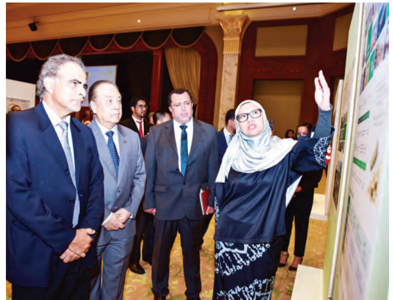
MENTERI Tenaga (Tenaga dan Tenaga Manusia) dan Perindustrian, dan Menteri Minyak dan Gas Kesultanan Oman melawat pameran BSP.

Oleh : Khartini Hamir