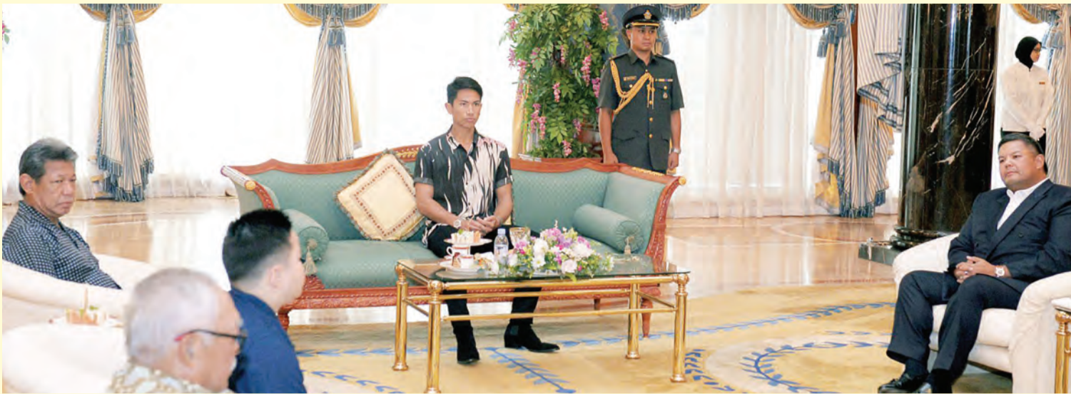
DULI Yang Teramat Mulia Paduka Seri Pengiran Muda 'Abdul Mateen ibni Kebawah Duli Yang Maha Mulia Paduka Seri Baginda Sultan Haji Hassanal Bolkiah Mu'izzaddin Waddaulah berkenan berangkat merasmikan Pelancaran Kejohanan Golf Butra Heidelberg Cement (BHC) Brunei 2019. Berangkat sama ialah Duli Yang Teramat Mulia Paduka Seri Pengiran Digadong Sahibul Mal Pengiran Muda Haji Jefri Bolkiah ibni Al-Marhum Sultan Haji Omar 'Ali Saifuddin Sa'adul Khairi Waddien.