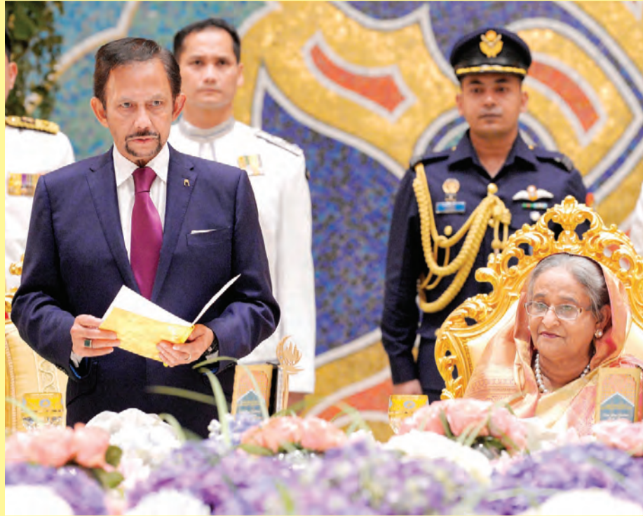
KEBAWAH Duli Yang Maha Mulia Paduka Seri Baginda Sultan Haji Hassanal Bolkhiah Mu'izzaddin Waddaulah ibni Al-Marhum Sultan Haji Omar 'Ali Saifuddien Sa'adul Khairi Waddien, Sultan dan Yang Di-Pertuan Negara Brunei Darussalam ketika berkenan mengurniakan titah pada Majlis Santap Rasmi bagi meraikan Perdana Menteri Republik Rakyat Bangladesh, Puan Yang Terutama Sheikh Hasina.