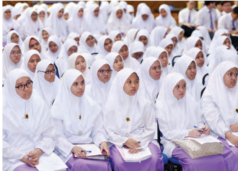
SEBAHAGIAN daripada penuntut Tingkatan Enam Bawah MDPMAMB yang hadir bagi taklimat kesedaran penyakit Talasemia yang diadakan di Auditorium maktab tersebut (kiri dan kanan).

Lebih 400 penuntut Tingkatan Enam Bawah didedahkan kepada