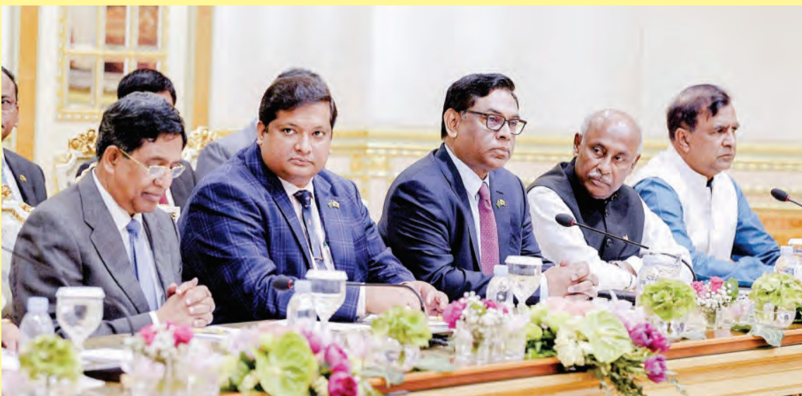
ANTARA rombongan Republik Rakyat Bangladesh yang hadir semasa Majlis Perjumpaan Dua Hala.