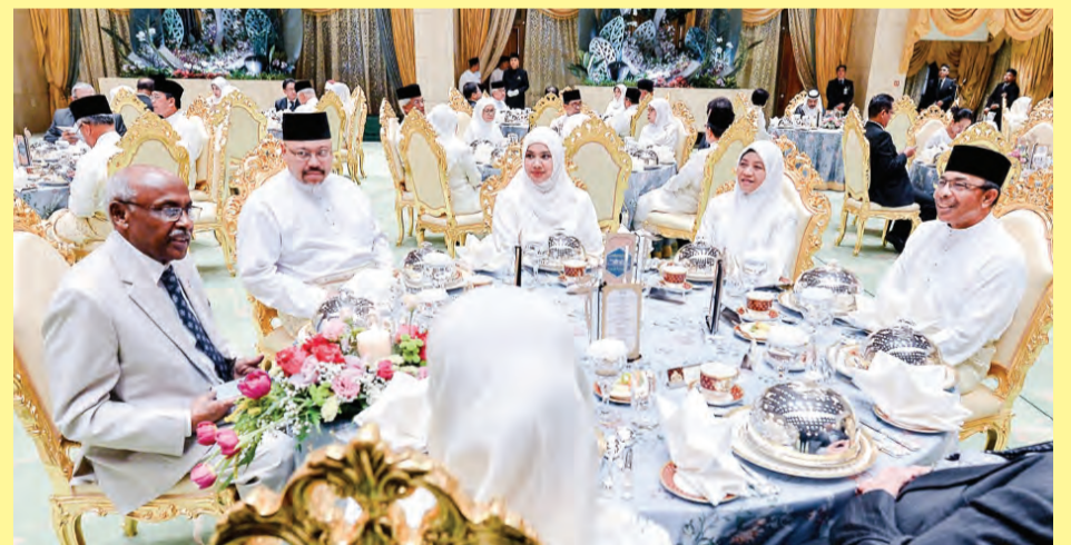
SUASANA Majlis Persantapan Rasmi bagi meraikan Perdana Menteri Republik Rakyat Bangladesh, Puan Yang Terutama Sheikh Hasina (kiri dan kanan).