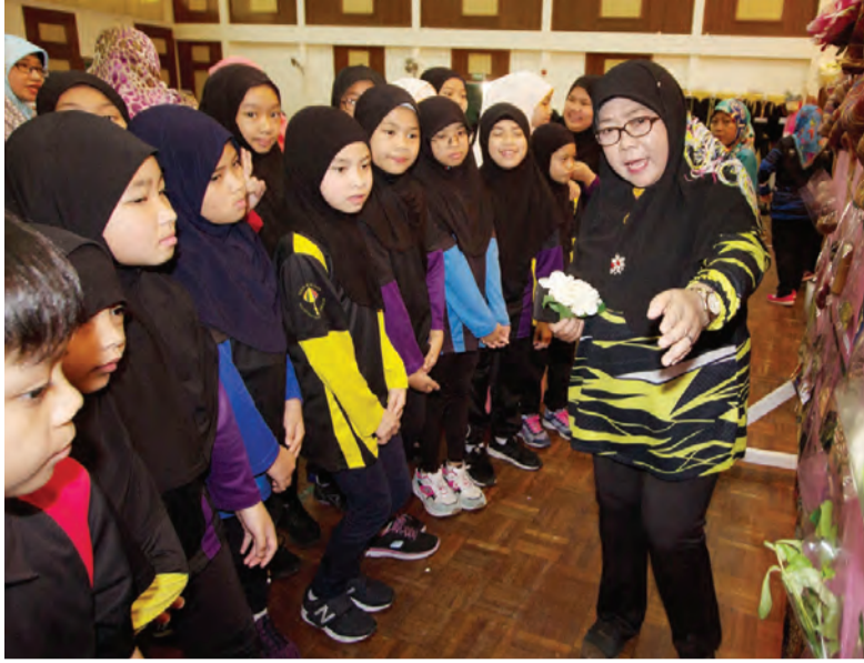
YANG Amat Mulia Pengiran Anak Raihaanah Hanaa-ul Bolqiah semasa berangkat menyaksikan secara dekat rempah ratus yang terdapat di dalam masakan Melayu.