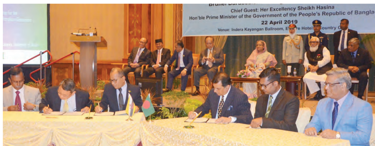
PENANDATANGANAN MoU antara Ghanim International Cooperation Sdn. Bhd. bersama Nizam Group of Company yang ditandatangani oleh wakil syarikat masing-masing.