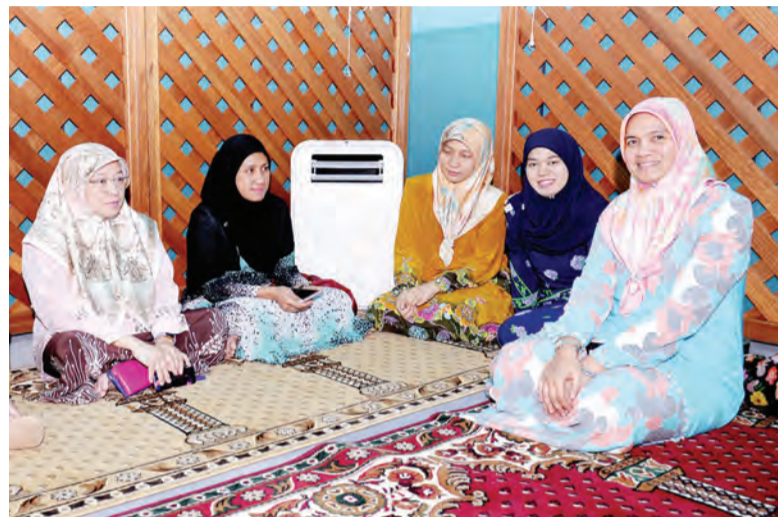
ANTARA pegawai dan kakitangan wanita Kementerian Kewangan dan Ekonomi yang hadir pada majlis tersebut.

Selain itu, ia juga bertujuan untuk mengeratkan silaturahmi di antara para pegawai dan kakitangan Kementerian Kewangan dan Ekonomi serta jabatan-jabatan di dalamnya.