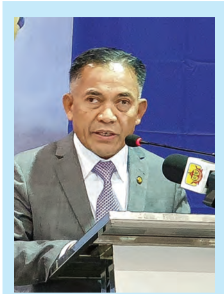
MENTERI Sumber-Sumber Utama dan Pelancongan, Yang Berhormat Dato Seri Setia Awang Haji Ali bin Haji Apong semasa berucap pada Promosi 'Discover Muara' pada Sabtu, 25 Jamadilakhir 1440 Hijrah bersamaan 2 Mac 2019 Masihi di Pusat Kapal Persiaran, Pelabuhan Muara.

Selain tapak bersejarah dan mercu tanda di Muara juga terdapat aktiviti jungle trekking bagi mereka yang gemar melakukan aktiviti mendaki di Bukit Tempayan Pisang. Sepanjang pendakian, mereka akan disajikan dengan pemandangan indah Teluk