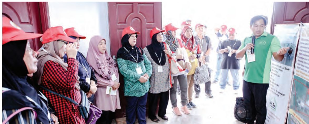
PARA peserta PMB ketika mendengarkan taklimat semasa membuat lawatan ke RZ Prisma Enterprise.

Di ladang tersebut, para peserta juga berpeluang untuk meninjau beberapa tempat tanaman seperti