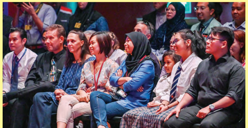
SEBAHAGIAN ibu bapa dan penjaga pelajar yang hadir menyaksikan persembahan.