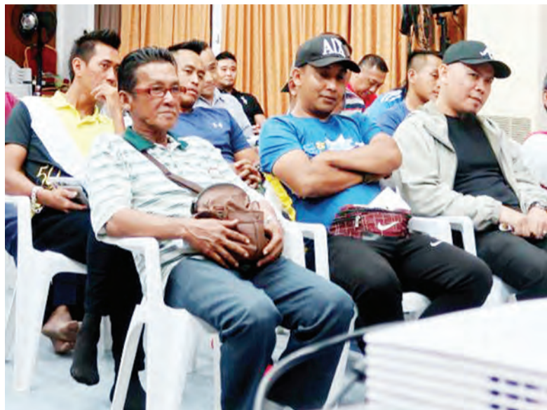
ANTARA pemilik, pengendali dan pemandu perahu-perahu tambang yang hadir pada sesi tersebut.

perahu-perahu yang beroperasi di perairan negara terutama sekali di Sungai Brunei.