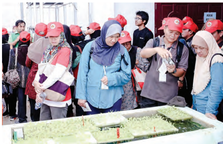
PARA peserta PMB ketika meninjau lebih dekat kaedah penanaman di RZ Prisma Enterprise.

PMB anjuran Jabatan Penerangan, Jabatan Perdana Menteri melalui Cawangan Penerangan Tutong dan dikendalikan bersama oleh Jawatankuasa PMB bagi Kampung Ukong; Kampung Long Mayan; dan Kampung Bukit, Daerah Tutong.