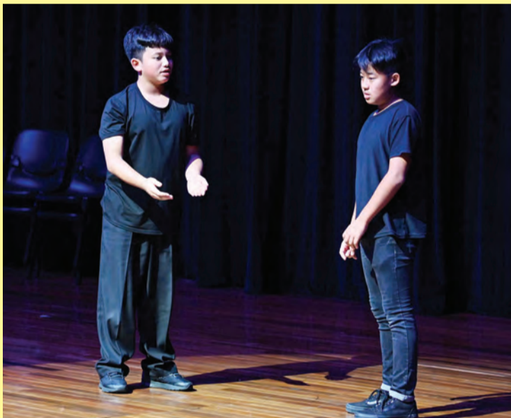
DULI Yang Teramat Mulia Paduka Seri Pengiran Muda 'Abdul Wakeel, pelajar Tahun 7 O berkenan menyertai persembahan drama bersama rakan-rakan (kiri dan kanan).

Sekolah tersebut memberi penekanan tinggi dalam bidang akademik dan melahirkan pelajar - pelajar yang berkemahiran tinggi, yang mana kebanyakannya berjaya mendapat tempat di universiti-universiti terkemuka di luar negara.