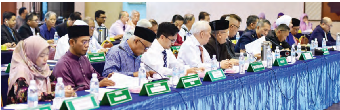
ANTARA yang hadir pada Mesyuarat Pertama Jawatankuasa Tadbir Tertinggi Sambutan Perayaan Ulang Tahun Hari Keputeraan Kebawah Duli Yang Maha Mulia Ke-73, Tahun 2019 bagi Daerah Brunei dan Muara.

Hadir pada mesyuarat tersebut ialah Ahli-ahli Majlis Mesyuarat Negara, Timbalan Pesuruhjaya Polis, Penghulu-penghulu Mukim, Ketua-ketua Jabatan, Pegawai-pegawai Eksekutif daripada syarikat korporat dan swasta serta ahli-ahli jawatankuasa tadbir tertinggi dan pengerusi-pengerusi acara sempena Sambutan Perayaan Ulang Tahun Hari Keputeraan Kebawah DYMM Ke-73 bagi DBM.