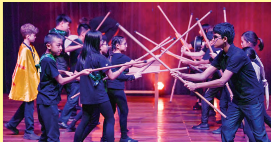
ANTARA aksi persembahan pelajar-pelajar Tahun 7 JIS.