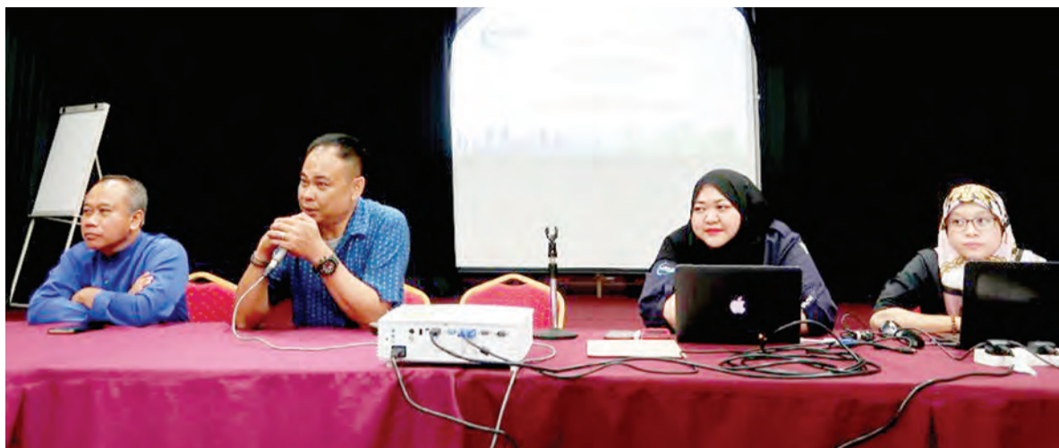
TAKLIMAT disampaikan oleh pegawai-pegawai daripada Pihak Berkuasa Maritim dan Pelabuhan Brunei Darussalam atau Maritime Port Authority Brunei Darussalam (MPABD).

Sesi muzakarah itu bertujuan untuk memberikan penekanan ke atas peraturan pihak MPABD dalam pengawalseliaan pendaftaran mana-mana