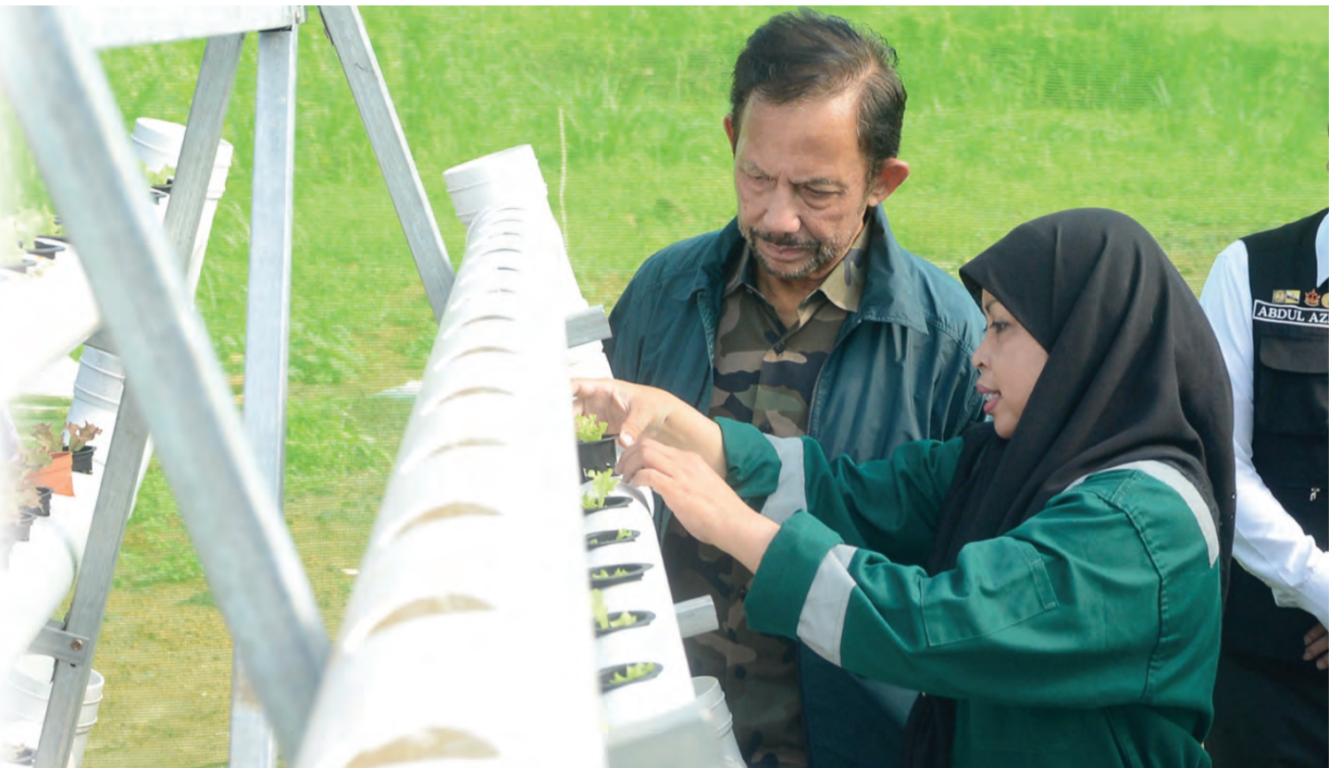
KEBAWAH Duli Yang Maha Mulia Paduka Seri Baginda Sultan Haji Hassanal Bolkiah Mu'izzaddin Waddaulah ibni Al-Marhum Sultan Haji Omar 'Ali Saifuddin Sa'adul Khairi Waddien, Sultan dan Yang Di-Pertuan Negara Brunei Darussalam ketika berkenan meninjau tanaman yang diusahakan oleh peserta PROPAZ.

Selaras dengan hasrat Kebawah DYMM Paduka Seri Baginda Sultan dan Yang Di-Pertuan Negara Brunei Darussalam mahukan rakyat negara ini mempunyai kehidupan yang seimbang dan berkualiti sejajar dengan Wawasan Negara 2035, maka melalui kutipan