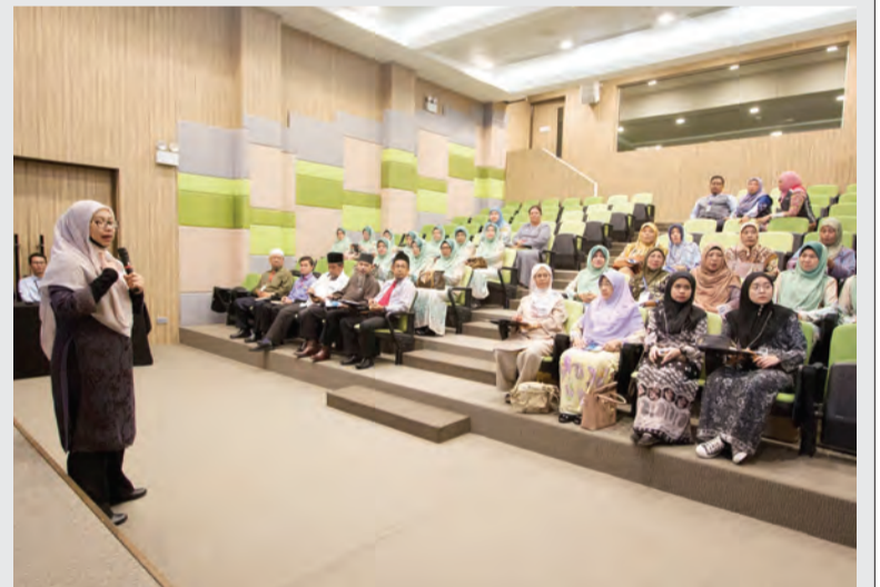
PARA peserta PMB mendengarkan sesi taklimat mengenai 'Peluang-peluang dan Program Keusahawanan'.

Oleh : Saerah Haji Abdul Ghani