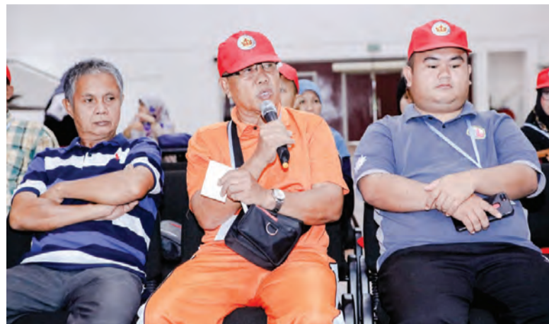
PARA pegawai dari Jabatan Pertanian dan Agrimakanan ketika menyampaikan taklimat pertanian di Dewan Serbaguna Pusat Penyelidikan Pertanian, Kampung Sinaut (kiri), manakala gambar kanan, salah seorang peserta Program Masyarakat Bermaklumat (PMB) mengajukan pertanyaan.

Oleh : Khartini Hamir