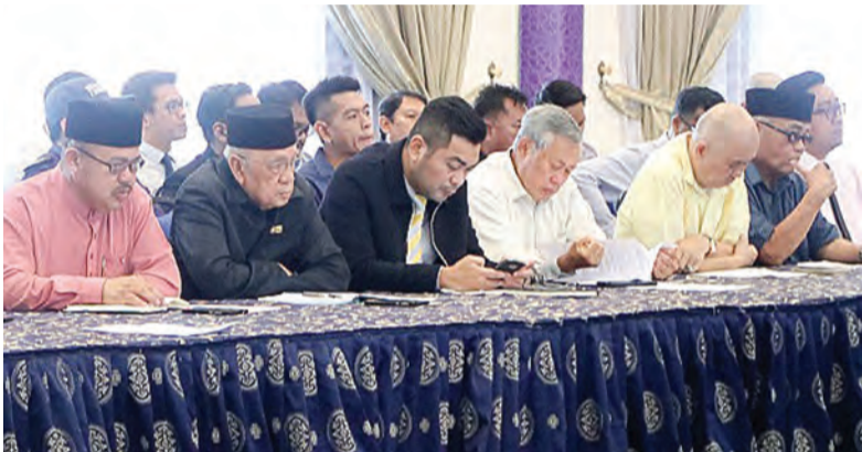
ANTARA yang hadir pada mesyuarat berkenaan.

Mesyuarat dihadiri dengan perbincangan mengenai Acara-acara Sampingan sepanjang Perayaan juga Acara-acara Persembahan Malam Bercorak Kebudayaan dan Keagamaan termasuk kedudukan Pentas dan Gerai Perayaan.