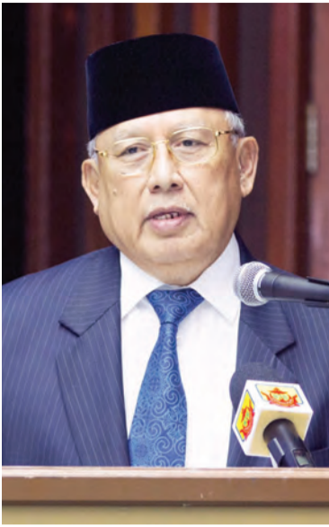
MENTERI di JPM, Yang Berhormat Dato Seri Setia Haji Awang Abdul Mokti bin Haji Mohd. Daud semasa menyampaikan ucapan khas pada majlis tersebut.

BANDAR SERI BEGAWAN , Khamis, 11 April. - Taqwa boleh mendorong seseorang melakukan amar ma'ruf dan nahi munkar , di samping taqarrub (mendekatkan diri) kepada Allah dengan amalan sunat.