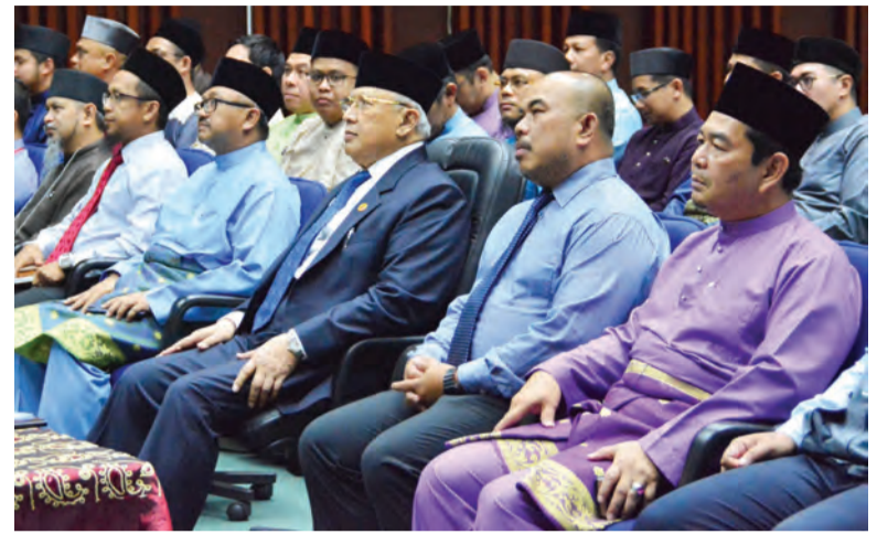
HADIR pada sesi taklimat bagi Program Masyarakat Bermaklumat (PMB) anjuran Jabatan Penerangan, Jabatan Perdana Menteri (JPM) bagi Kampung Lumut I, Mukim Liang yang diadakan di Dewan Pusat Da'wah Islamiah ialah Menteri di JPM, Yang Berhormat Dato Seri Setia Haji Awang Abdul Mokti bin Haji Mohd. Daud.

Sebagai umat manusia, jelas Yang Berhormat, pastinya pandangan dan logik fikiran kita itu lemah atau tidak mampu melihat dari sudut pandangan yang tepat mengenai masa depan. Jadi, tidak wujud sama sekali perkataan cepat, lambat, awal atau akhir bila