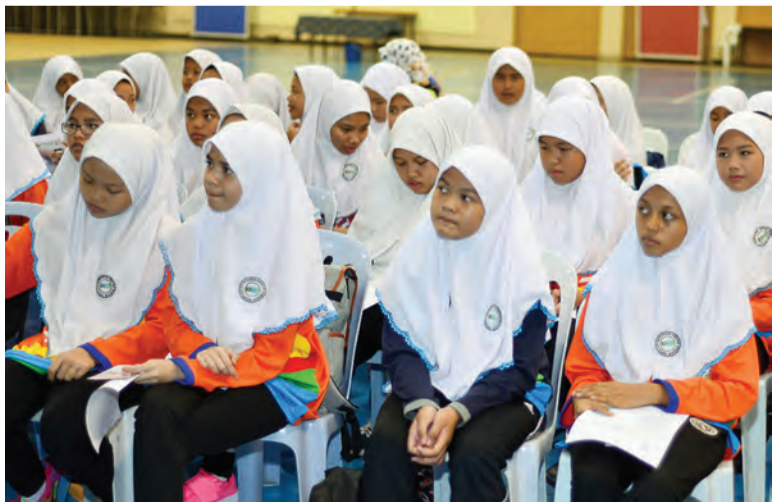
PENUNTUT Tahun 7 Sekolah Menengah Awang Semaun (SMAS) berpeluang mendengar taklimat bertajuk 'Raja Kita, Menghayati Bendera dan Lagu Kebangsaan Negara Brunei Darussalam' yang diadakan di Dewan Serbaguna, SMAS.

Setentunya usaha Jabatan Penerangan ini bagi menyemai semangat patriotisme para pelajar dalam menyayangi raja kita, di samping menghormati dan menjiwai lagu kebangsaan serta bendera negara yang sama-sama kita cintai ini.