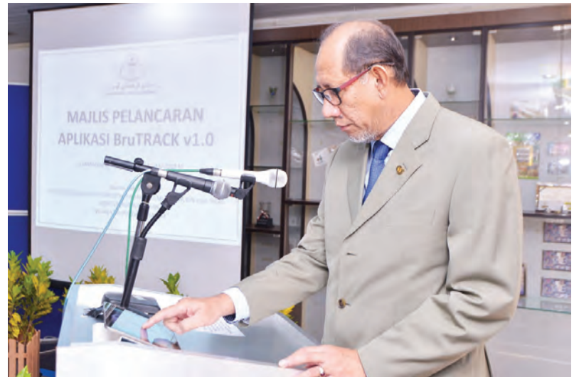
MENTERI Perhubungan, Yang Berhormat Dato Seri Setia Awang Haji Mustappa bin Haji Sirat melancarkan aplikasi BruTRACK Jabatan Perkhidmatan Pos.

Walau bagaimanapun dalam waktu terdekat, JPP akan