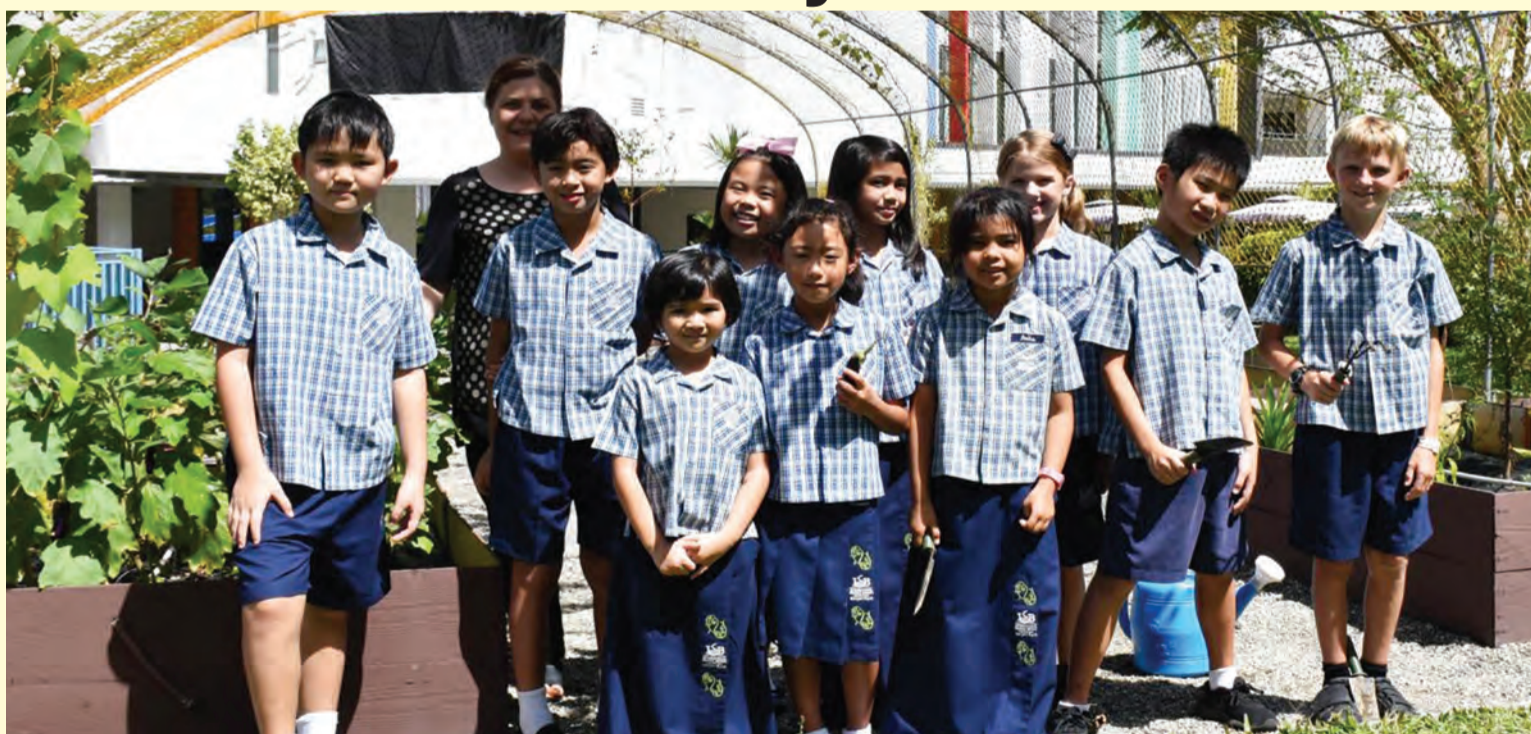
ANAKANDA Kebawah Duli Yang Maha Mulia Paduka Seri Baginda Sultan Haji Hassanal Bolkiah Mu'izzaddin Waddaulah, Sultan dan Yang Di-Pertuan Negara Brunei Darussalam, Yang Teramat Mulia Paduka Seri Pengiran Anak Puteri Ameerah Wardatul Bolkiah berkenan berangkat ke Perhimpunan Khas sempena berakhirnya Projek Eco Garden atau Taman Eko di Sekolah Antarabangsa Brunei (ISB). Juga berangkat ialah anakanda-anakanda Duli Yang Teramat Mulia Paduka Seri Pengiran Muda Mahkota Pengiran Muda Haji Al-Muhtadee Billah, Yang Teramat Mulia Pengiran Muda 'Abdul Muntaqim dan Yang Teramat Mulia Pengiran Anak Muneerah Madhul Bolkiah.

BANDAR SERI BEGAWAN, Jumaat, 26 Januari. - Sekolah Antarabangsa Brunei (ISB) mengadakan Perhimpunan Khas sempena berakhirnya Projek Eco