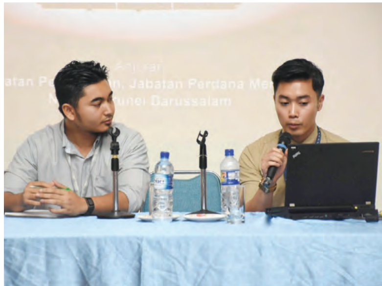
PEGAWAI-pegawai dari Darussalam Enterprise (DARe) semasa menyampaikan taklimat mengenai Keusahawanan.

Program dua hari itu dihadiri oleh seramai 18 peserta yang terdiri daripada Ahli Majlis