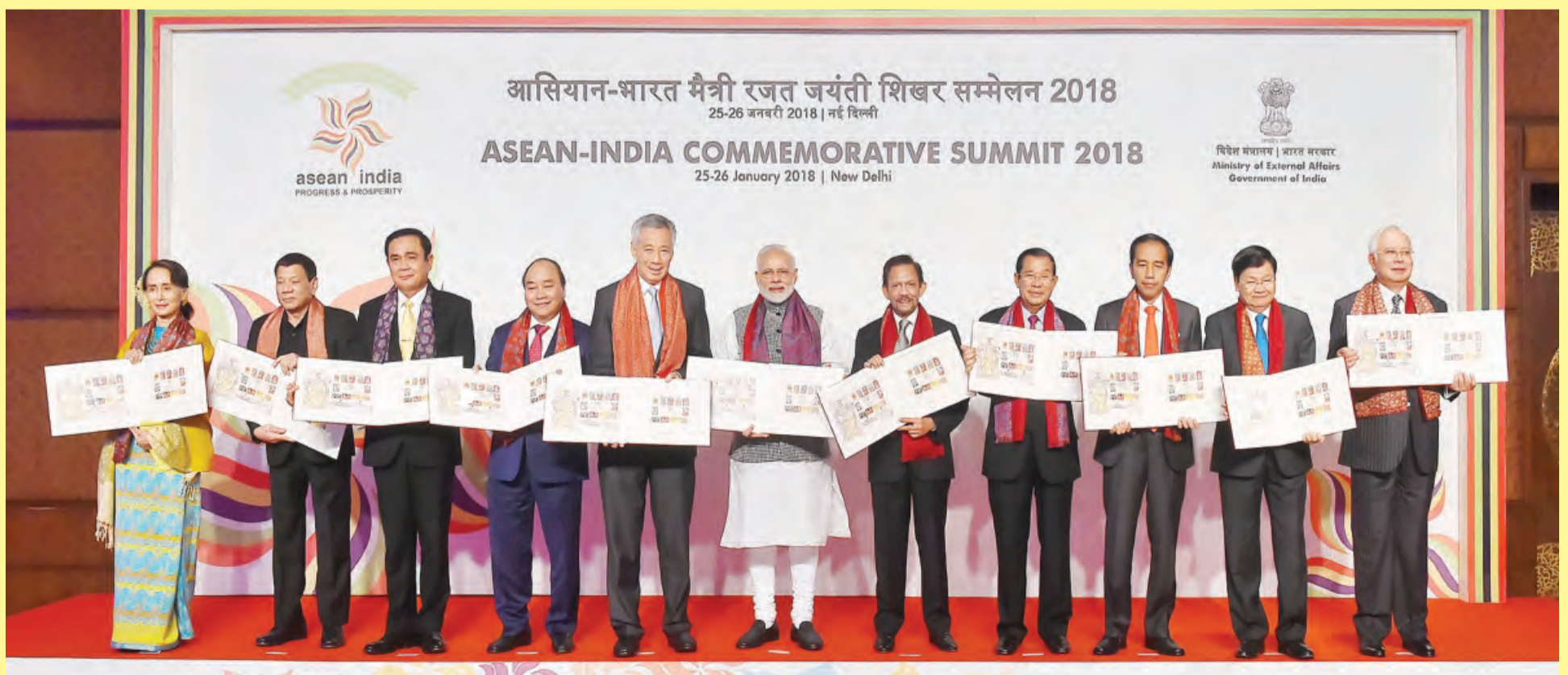
KEBAWAH Duli Yang Maha Mulia Paduka Seri Baginda Sultan Haji Hassanal Bolkiah Mu'izzaddin Waddaulah, Sultan dan Yang Di-Pertuan Negara Brunei Darussalam bergambar ramai bersama TYT Perdana Menteri Republik India dan para pemimpin ASEAN yang lainnya selepas pelancaran 11 keping Setem Peringatan bersempena Ulang Tahun Ke-25 Perkongsian Dialog ASEAN - India.

Selepas Sesi Plenari tersebut, Kebawah DYMM bersama-sama TYT Perdana Menteri Republik India dan Ketua-ketua Negara dan Kerajaan ASEAN lainnya berangkat ke Dewan Mumtaz bagi melawat Pameran 20 Lukisan ASEAN - India Artists Camp.