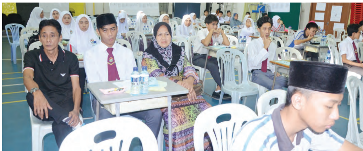
ANTARA yang menghadiri Taklimat Ibu Bapa dan Penjaga serta Pelajar bagi Tahun 11, Sekolah Menengah Menglait.

Jelasnya, antara ciri-ciri pelajar yang berjaya ialah pelajar mempunyai cita-cita dan tujuan serta matlamat untuk berjaya, bersekolah menjadi keutamaan dan mempunyai jadual