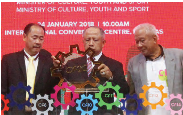
MENTERI Kebudayaan, Belia dan Sukan, Yang Berhormat Pehin Datu Lailaraja Mejar Jeneral (B) Dato Paduka Seri Haji Awang Halbi bin Haji Mohd. Yusof (tengah) selaku tetamu kehormat majlis ketika melancarkan Pesta Pengguna Ke-20 (CF20) yang berlangsung di Pusat Persidangan Antarabangsa (Kiri). Sementara gambar kanan, Menteri Kebudayaan, Belia dan Sukan ketika mendengarkan taklimat daripada salah seorang peserta yang ikut serta pada CF20.

BANDAR SERI BEGAWAN , Rabu, 24 Januari. - Pesta Pengguna Ke-20 (CF20) yang bermula hari ini hingga 28 Januari di Pusat Persidangan Antarabangsa (ICC), Berakas menawarkan pelbagai produk dan perkhidmatan serta aktiviti menarik untuk para pengunjung.