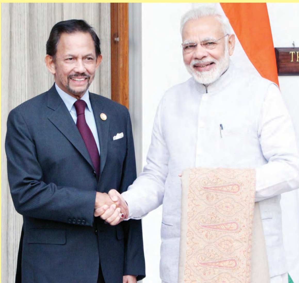
Siaran Akhbar : Jabatan Perdana Menteri