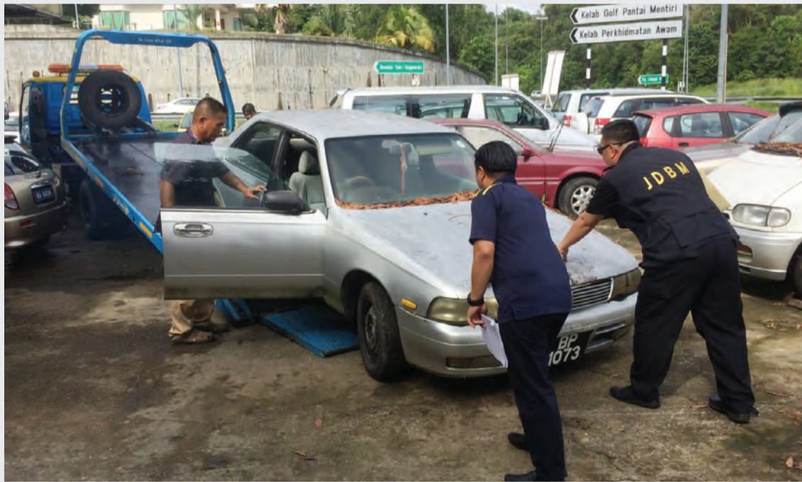
BAHAGIAN Perlesenan dan Penguatkuasaan, Jabatan Daerah Brunei dan Muara semasa memindahkan kenderaan terbiar.

BANDAR SERI BEGAWAN , Selasa, 23 Januari. - Bahagian Perlesenan dan Penguatkuasaan, Jabatan Daerah Brunei dan Muara (JDBM) meneruskan lagi Operasi Bersepadu Ke-3 yang dibuat bersama Syarikat Perlupusan M.Han Enterprise bagi kenderaan-kenderaan serta rangka-rangka kenderaan yang terbiar di kawasan letak kereta premis-premis perniagaan serta bengkel di kawasan Kampung Mentiri, Kampung Salambigar dan Kampung Sungai Hancing.