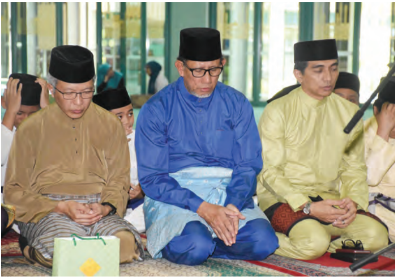
MENTERI Perhubungan, Yang Berhormat Dato Seri Setia Awang Haji Mustappa bin Haji Sirat (dua, kiri), selaku Penasihat Majlis Kebangsaan Keselamatan Jalan Raya, Negara Brunei Darussalam hadir pada Majlis Sembahyang Sunat Hajat Berjemaah dan Ratib Al-Attas sempena Memperingati Mangsa-Mangsa Kemalangan Lalu Lintas Jalan Raya bagi Tahun 2018 yang diadakan di Masjid Mohamed Bolkihah, Serusop.