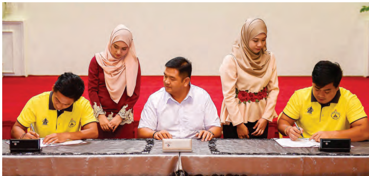
MAJLIS Penyampaian Sijil yang diselenggarakan dengan Majlis Menandatangani Kontrak Pengambilan Bekerja Para Peserta Kursus dengan Syarikat-syarikat Pengusaha Jentera Berat.

Selain itu, para lepasan peserta juga telah dilengkapi dengan pelbagai kemahiran lain seperti