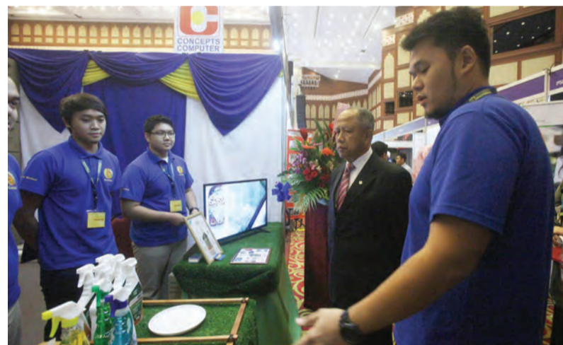
Oleh : Marlinawaty Hussin

Augmented Reality anjuran DST bagi pengguna iPhone dan sebuah kereta Toyota Vios melalui cabutan bertuah.