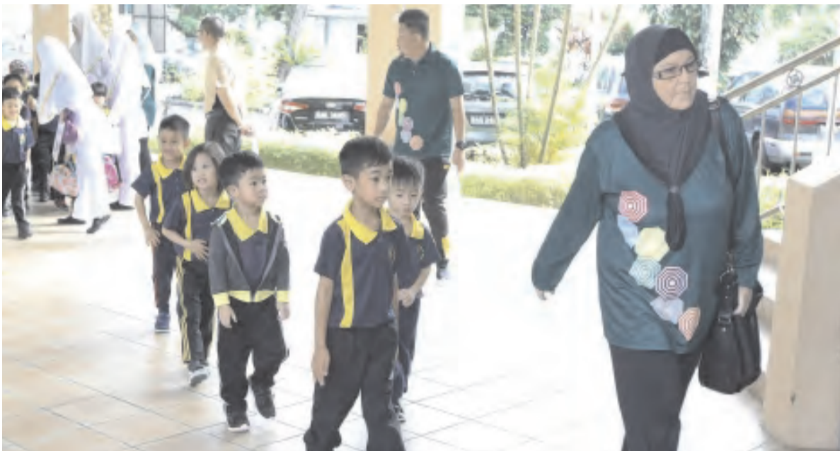
LEBIH 60 kanak-kanak Taman Asuhan Kanak-Kanak Yayasan Sultan Haji Hassanal Bolkiah (TASKA YSHHB) dari KG 3 Red, 3 Yellow dan 3 Green mengadakan lawatan ke Pusat Pergigian Negara (PPN), menyertai lawatan itu ialah cucunda Yang Teramat Mulia Paduka Seri Pengiran Anak Puteri Hajah Amal Nasibah, Yang Mulia Pengiran Muhammad Abdul Haadee Mubasheer bin Pengiran Anak Abdul Badee'.

BERAKAS , Khamis, 25 Januari. - Lebih 60 kanak-kanak Taman Asuhan Kanak-Kanak Yayasan Sultan Haji Hassanal Bolkiah (TASKA YSHHB) dari KG 3 Red, 3 Yellow dan 3 Green mengadakan lawatan ke Pusat Pergigian Negara (PPN) di Lapangan Terbang Lama, di sini.