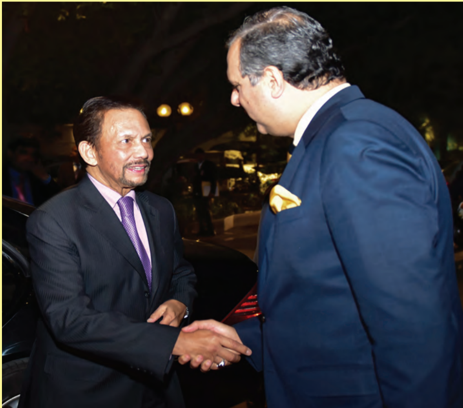
KEBAWAH Duli Yang Maha Mulia berkenan menerima junjung ziarah sejeurus berangkat tiba di sebuah hotel terkemuka di New Delhi, tempat persemayaman baginda di sepanjang keberangkatan ke Sidang Kemuncak Komemoratif ASEAN - India.

Siaran Akhbar : Jabatan Perdana Menteri