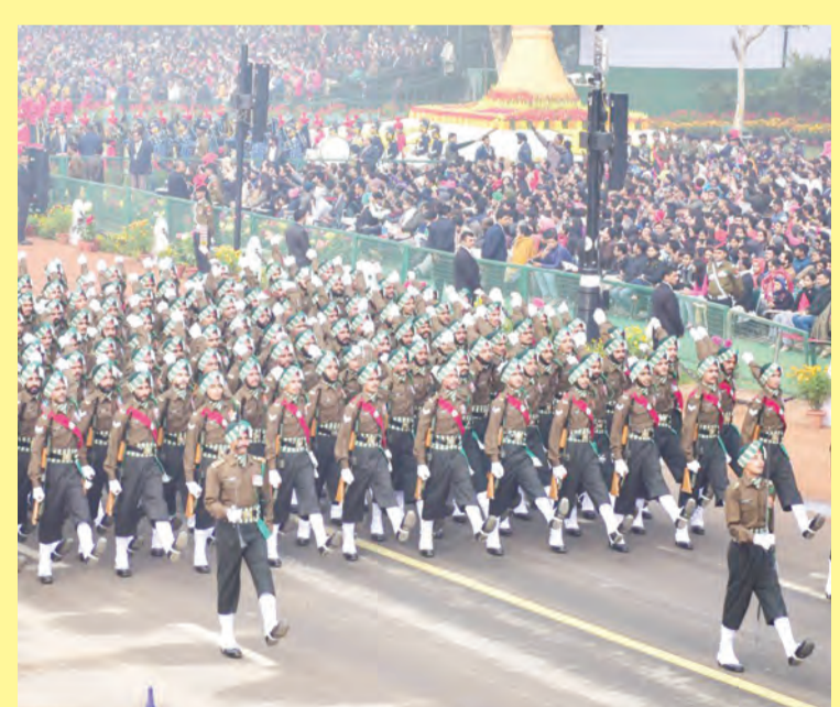
PERBARISAN lalu pembawa bendera negara-negara ASEAN dan India serta persembahan kebudayaan, serta perbarisan lalu anggota tentera India menyerikan lagi suasana Hari Republik India yang disambut setiap tahun pada 26 Januari untuk menghormati Perlembagaan India sejak ia mula berkuat kuasa pada tarikh yang sama dalam tahun 1950 (kiri dan kanan).