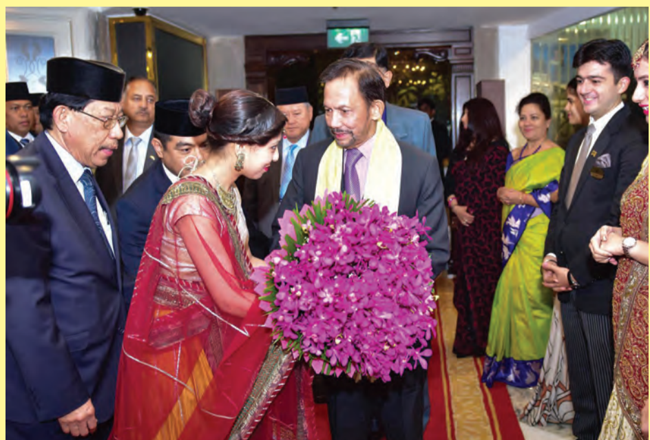
KEBAWAH Duli Yang Maha Mulia berkenan menerima junjung ziarah daripada para pegawai Negara Brunei Darussalam yang hadir sempena dengan sidang kemuncak tersebut (kiri), sementara gambar kanan, baginda berkenan menerima sejambak bunga sejeurus berangkat tiba di hotel terkemuka di New Delhi, tempat persemayaman baginda di sepanjang keberangkatan ke Sidang Kemuncak Komemoratif ASEAN - India.