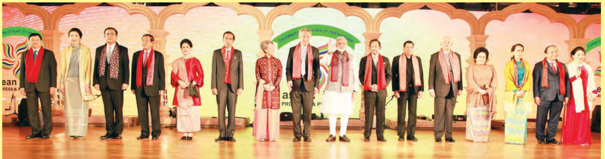
KEBAWAH Duli Yang Maha Mulia Paduka Seri Baginda Sultan Haji Hassanal Bolkiah Mu'izzaddin Waddaulah ibni Al-Marhum Sultan Haji Omar 'Ali Saifuddien Sa'adul Khairi Waddien, Sultan dan Yang Di-Pertuan Negara Brunei Darussalam dijunjung bagi sesi bergambar ramai bersama Tuan Yang Terutama Perdana Menteri India serta para pemimpin ASEAN yang lainnya sebelum bermulanya Majlis Santap Malam Kebudayaan.

NEW DELHI, REPUBLIK INDIA , Khamis, 25 Januari. - Kebawah Duli Yang Maha Mulia Paduka Seri Baginda Sultan Haji Hassanal Bolkiah Mu'izzaddin Waddaulah ibni Al-Marhum Sultan Haji Omar 'Ali Saifuddien