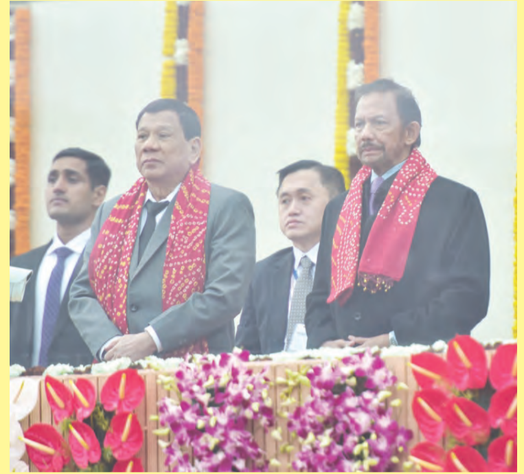
KEBAWAH Duli Yang Maha Mulia Paduka Seri Baginda Sultan Haji Hassanal Bolkiah Mu'izzaddin Waddaulah ibni Al-Marhum Sultan Haji Omar 'Ali Saifuddien Sa'adul Khairi Waddien, Sultan dan Yang Di-Pertuan Negara Brunei Darussalam berkenan berangkat bersama pemimpin ASEAN yang lain pada Sambutan Hari Republik India Ke-69 yang berlangsung di Rajpath, New Delhi (kiri, kanan dan bawah kiri).

Siaran Akhbar : Jabatan Perdana Menteri