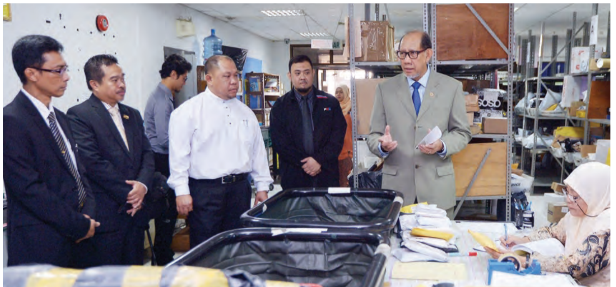
MENTERI Perhubungan, Yang Berhormat Dato Seri Setia Awang Haji Mustappa bin Haji Sirat meninjau ke salah satu bahagian di Pusat Memproses Mel Berakas yang mengendalikan proses penghantaran kad-kad pos bagi bungkus yang diterima dari luar negara.

Bungkus-bungkus yang tidak dituntut tersebut terangnya, menyebabkan kerugian pendapatan atau revenue loss bagi Jabatan Perkhidmatan Pos (JPP), di samping menjadi tanggungan atau liability jika terpaksa dihantar semula kepada penghantar atau penjual di luar negara memandangkan bungkus tersebut tidak boleh dimusnahkan.