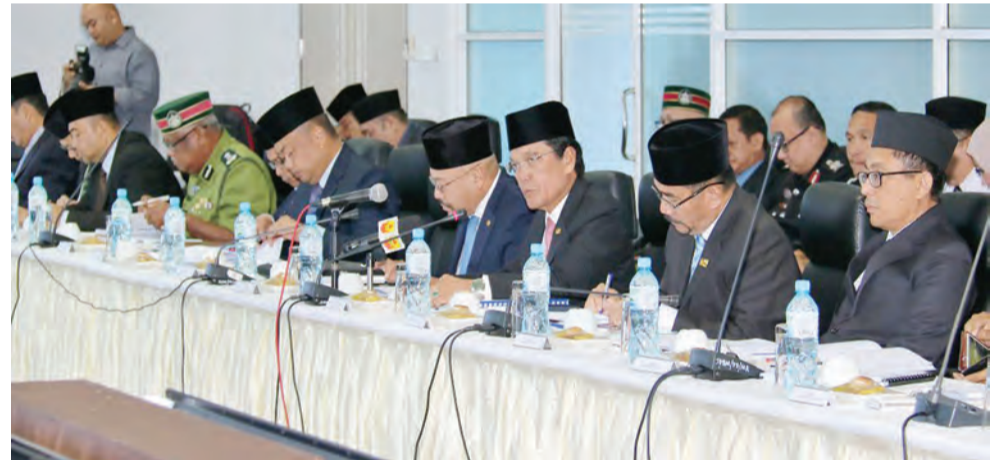
MENTERI Hal Ehwal Dalam Negeri, Yang Berhormat Pehin Orang Kaya Seri Kerna Dato Seri Setia (Dr.) Haji Awang Abu Bakar bin Haji Apong (tiga, kanan) pada Sesi Muzakarah bersama Ahli-ahli Majlis Mesyuarat Negara di Bangunan Jabatan Daerah Brunei dan Muara (kanan), sementara gambar kiri, antara Ahli-ahli Majlis Mesyuarat Negara yang hadir pada Sesi Muzakarah berkenaan.