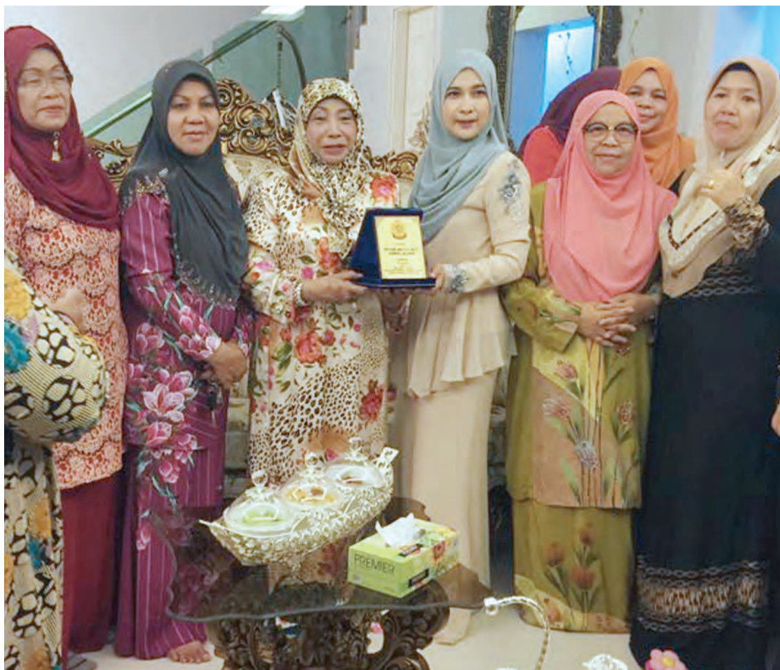
MENGADAKAN lawatan ke Wilayah Persekutuan Labuan.