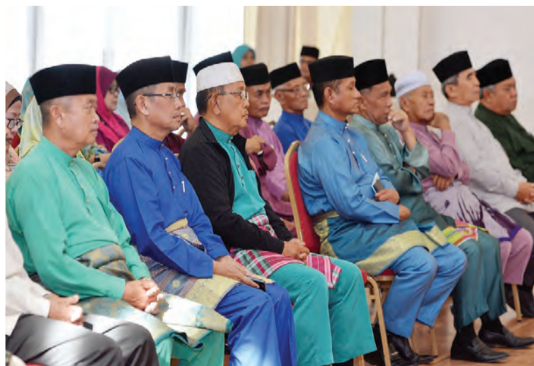
SEBAHAGIAN daripada Ahli-ahli PKWE Daerah Tutong yang hadir pada Majlis Ceramah Pembangunan Masyarakat di Daerah Tutong.

Berita dan Foto : Hernie Suliana binti Haji Othman