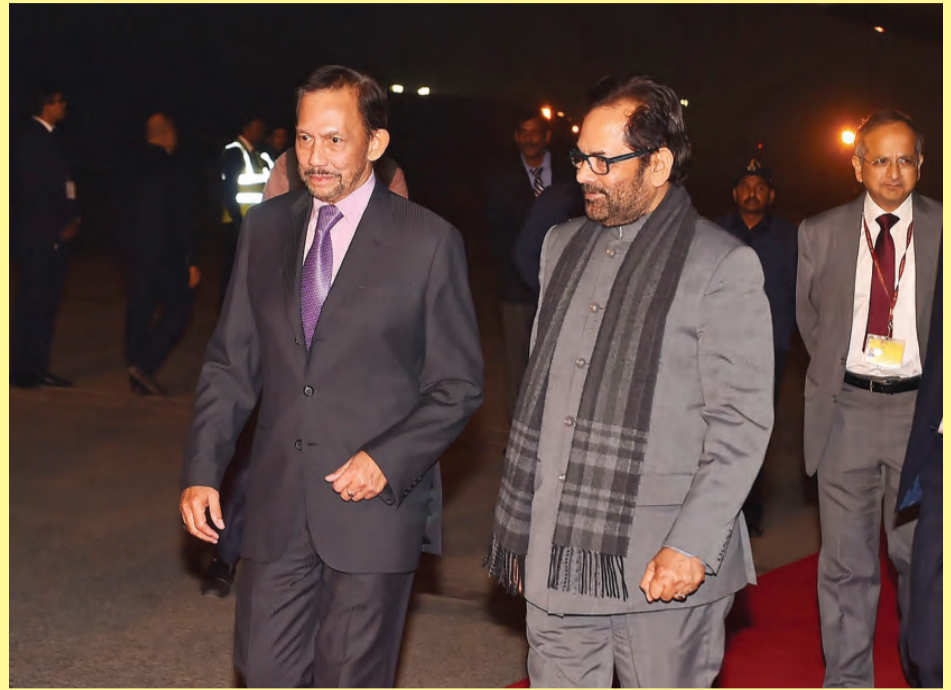
KEBAWAH Duli Yang Maha Mulia Paduka Seri Baginda Sultan Haji Hassanal Bolkiah Mu'izzaddin Waddaulah ibni Al-Marhum Sultan Haji Omar 'Ali Saifuddien Sa'adul Khairi Waddien, Sultan dan Yang Di-Pertuan Negara Brunei Darussalam berkenan menerima junjung ziarah sejeurus berangkat tiba bagi menghadiri Sidang Kemuncak Komemoratif ASEAN - India dan Sambutan Hari Republik India Ke-69 yang berlangsung pada 25 dan 26 Januari 2018 (kiri). Sementara gambar kanan, keberangkatan tiba baginda dijunjung oleh Menteri Hal Ehwal Minoriti, Republik India, Shri Mukhtar Abbas Naqvi.