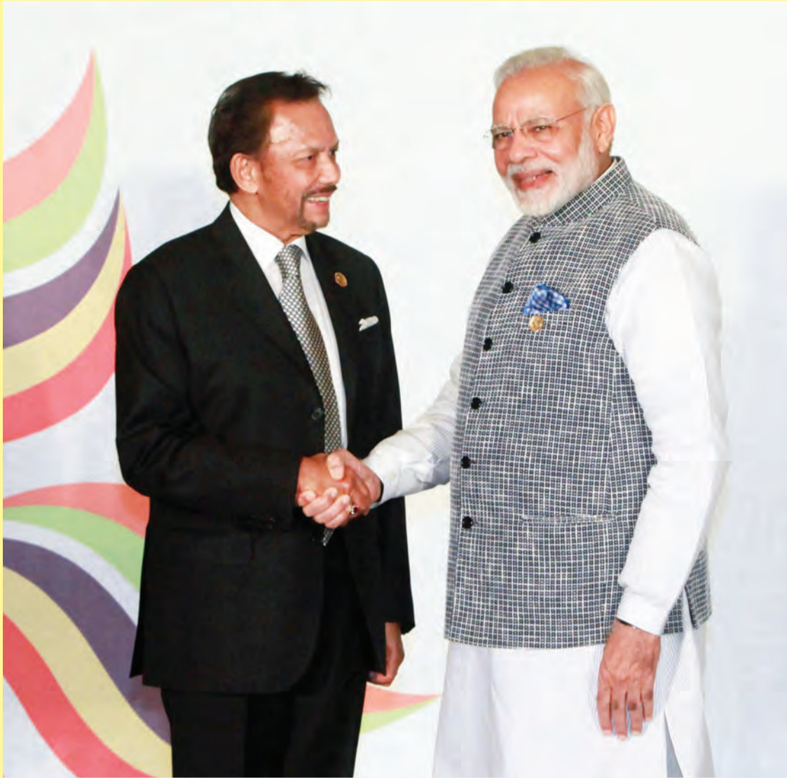
KEBAWAH Duli Yang Maha Mulia Paduka Seri Baginda Sultan Haji Hassanal Bolkiah Mu'izzaddin Waddaulah ibni Al-Marhum Sultan Haji Omar 'Ali Saifuddin Sa'adul Khairi Waddien, Sultan dan Yang Di-Pertuan Negara Brunei Darussalam dialu-alukan oleh Perdana Menteri Republik India, Tuan Yang Terutama Shri Narendra Modi.