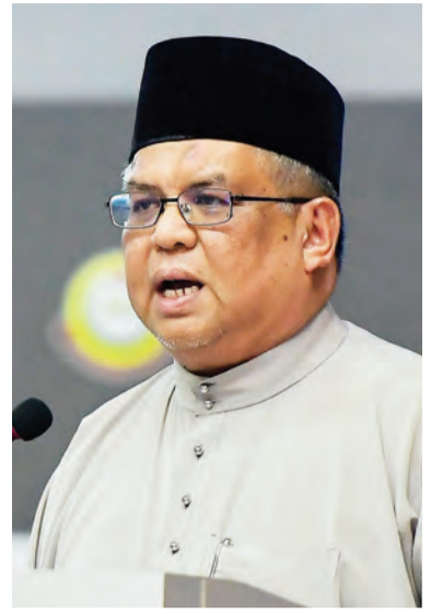
TIMBALAN Menteri Pendidikan, Yang Mulia Pengiran Dato Seri Paduka Haji Bahrom bin Pengiran Haji Bahar semasa berucap pada majlis tersebut.

Kementerian Pendidikan telah memperkenalkan perubahan-perubahan yang diperlukan dan drastik pada sistem pendidikan melalui satu cadangan sistem yang