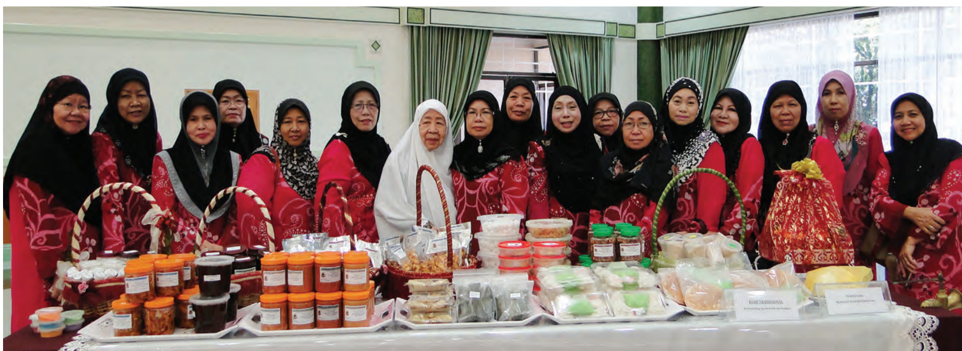
MENYERTA pameran Urusan Rumah Tangga di ICC sempena Hari Keputeraan Kebawah Duli Yang Maha Mulia Ke-70 Tahun.

BERSAMA-sama menghulur bantuan kepada yang memerlukan.