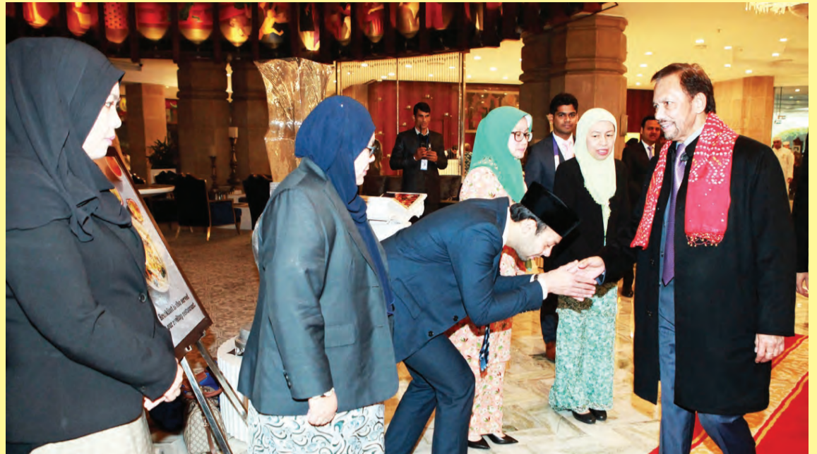
KEBAWAH Duli Yang Maha Mulia Paduka Seri Baginda Sultan Haji Hassanal Bolkiah Mu'izzaddin Waddaulah ibni Al-Marhum Sultan Haji Omar 'Ali Saifuddien Sa'adul Khairi Waddien, Sultan dan Yang Di-Pertuan Negara Brunei Darussalam berkenan menadah tangan ketika Doa Selamat dibacakan oleh Mufti Kerajaan (kiri). Sementara gambar kanan, baginda berkenan menerima junjung zairah daripada para pegawai Kementerian Hal Ehwal Luar Negeri dan Perdagangan di lobi hotel tempat persemayaman baginda.

Siaran Akhbar : Jabatan Perdana Menteri