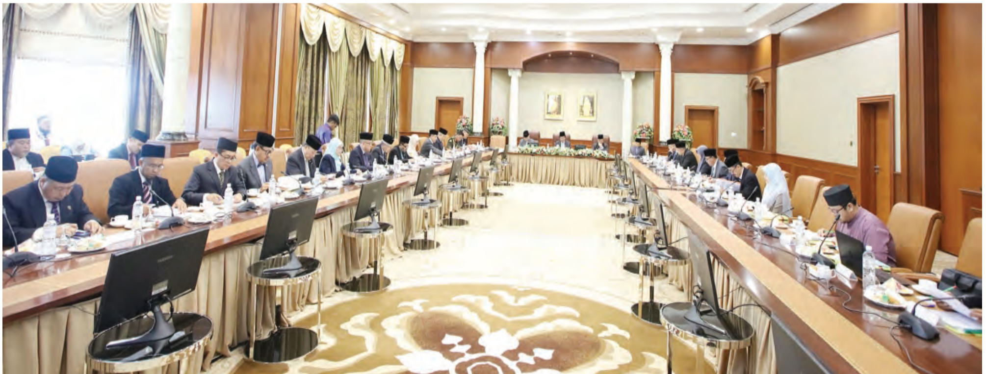
MESYUARAT Pertama Jawatankuasa Kebangsaan Sambutan Perayaan Ulang Tahun Hari Keputeraan Kebawah Duli Yang Maha Mulia Paduka Seri Baginda Sultan dan Yang Di-Pertuan Negara Brunei Darussalam Ke-72 Tahun diadakan di Bangunan Jabatan Perdana Menteri.

BANDAR SERI BEGAWAN, Isnin, 22 Januari. - Mesyuarat Pertama Jawatankuasa Kebangsaan Sambutan Perayaan Ulang Tahun Hari Keputeraan Kebawah Duli Yang Maha Mulia Paduka Seri Baginda Sultan dan Yang Di-Pertuan Negara Brunei Darussalam Ke-72 Tahun adalah bagi membincangkan ketetapan tarikh acara-acara utama dan pengendalian acara-acara Sambutan Perayaan Ulang Tahun Hari Keputeraan Kebawah Duli Yang Maha Mulia pada tahun ini.