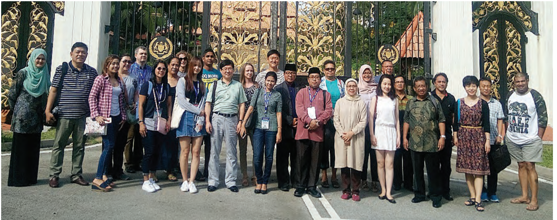
PERWAKILAN dari Negara Brunei Darussalam ketika menyertai Permesyuaratan United Nations Group of Experts on Geographical Names (UNGEGN) di Kuala Lumpur pada tahun 2016.

B AGI Negara Brunei beraja, institusi beraja adalah warisan tradisi bangsa Brunei yang diamalkan turun-temurun sejak 1,400 tahun yang lalu. Pengekalan sistem ini telah menyebabkan nilai-nilai sosiobudaya dan bahasa Melayu terus wujud menjadi lambang identiti dan jati diri keBruneian. Dalam Seminar Internasional Leksikologi dan Leksikografi 'Teknologi Bahasa dan Budaya dalam Penelitian Leksikologi dan Leksikografi' anjuran Laboratorium Leksikologi dan Leksikografi Departemen Linguistik Fakultas Ilmu Pengetahuan Budaya Universitas Indonesia, Depok Jakarta pada Khamis, 4 Mei 2017, perwakilan dari Negara Brunei Darussalam telah menyampaikan kertas kerja yang memfokuskan peranan institusi beraja dalam mendokong perkembangan dan pengukuhan penggunaan bahasa Melayu. Dua buah kertas kerja telah diketengahkan, iaitu daripada penulis sendiri bertajuk 'Peranan Bahasa Dalam Penamaan Geografi' dan Awang Zulkiflee bin Haji Abdul Latif yang bertajuk 'Bahasa (Melayu) Berupaya Mengekalkan Negara Melayu Islam Beraja' (Surutan Dalam Konteks Sejarah). Dalam kertas kerja penulis telah membincangkan tentang kepentingan pengamalan pemerintahan sistem beraja di Negara Brunei Darussalam yang secara langsung telah memperkasa dan memartabatkan kedudukan bahasa Melayu sebagai Bahasa Rasmi Negara berdasarkan Perlembagaan Negeri Brunei 1959 Pindaan 2004 dan 2008.