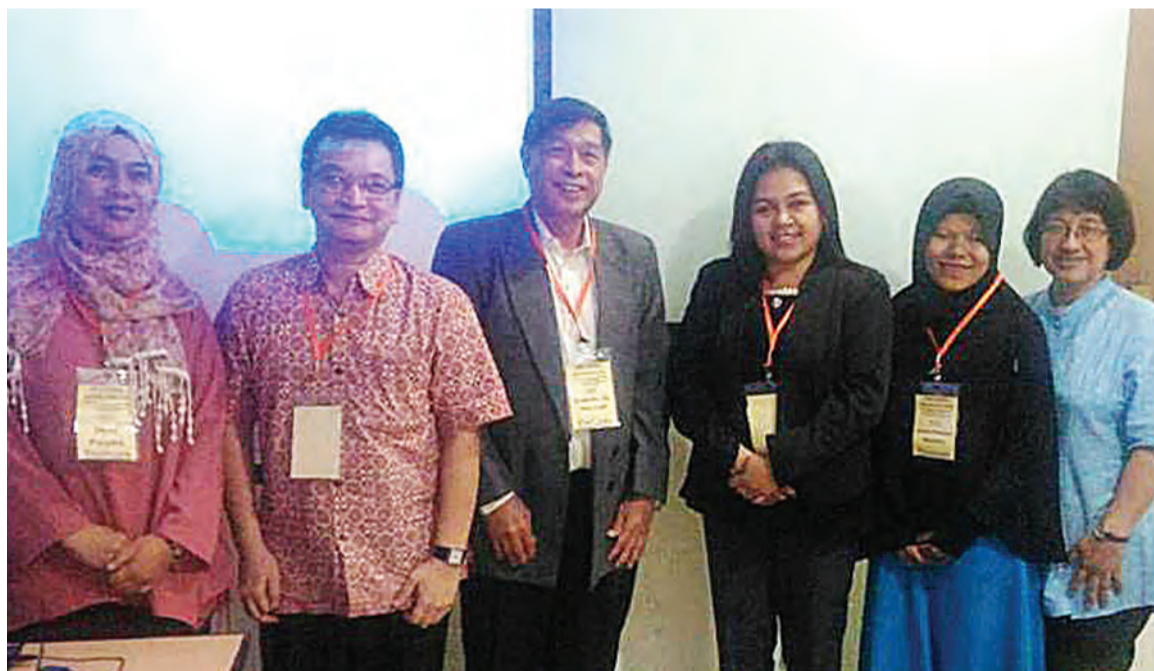
ANTARA pembentang kertas kerja yang hadir pada Seminar Internasional Leksikologi dan Leksikografi, di Universitas Indonesia, Depok Jakarta pada Mei 2017.