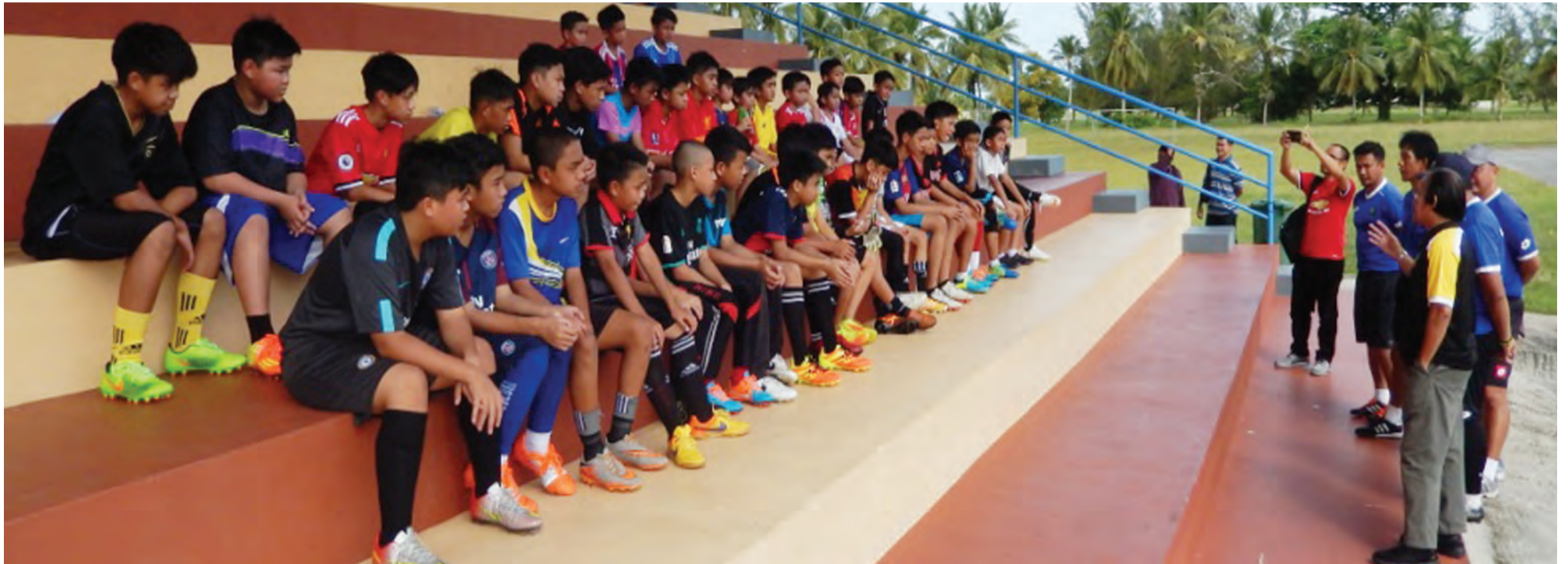
PERSATUAN Bola Sepak Kebangsaan Negara Brunei Darussalam (NFABD) semasa mengadakan sesi pemilihan pemain-pemain bola sepak Bawah 12 dan 14 tahun di Daerah Belait.