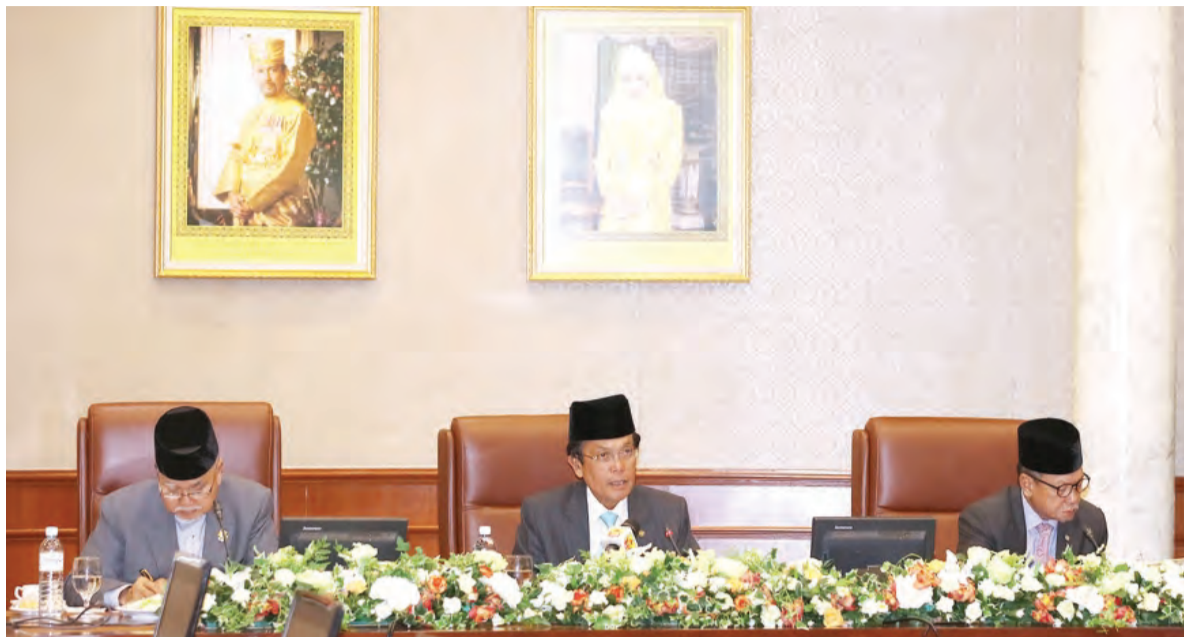
MENTERI Hal Ehwal Dalam Negeri, Yang Berhormat Pehin Orang Kaya Seri Kerna Dato Seri Setia (Dr.) Haji Awang Abu Bakar bin Haji Apong (tengah) semasa mempengerusikan Mesyuarat Pertama Jawatankuasa Kebangsaan Sambutan Perayaan Ulang Tahun Hari Keputeraan Kebawah Duli Yang Maha Mulia Paduka Seri Baginda Sultan dan Yang Di-Pertuan Negara Brunei Darussalam Ke-72 Tahun.