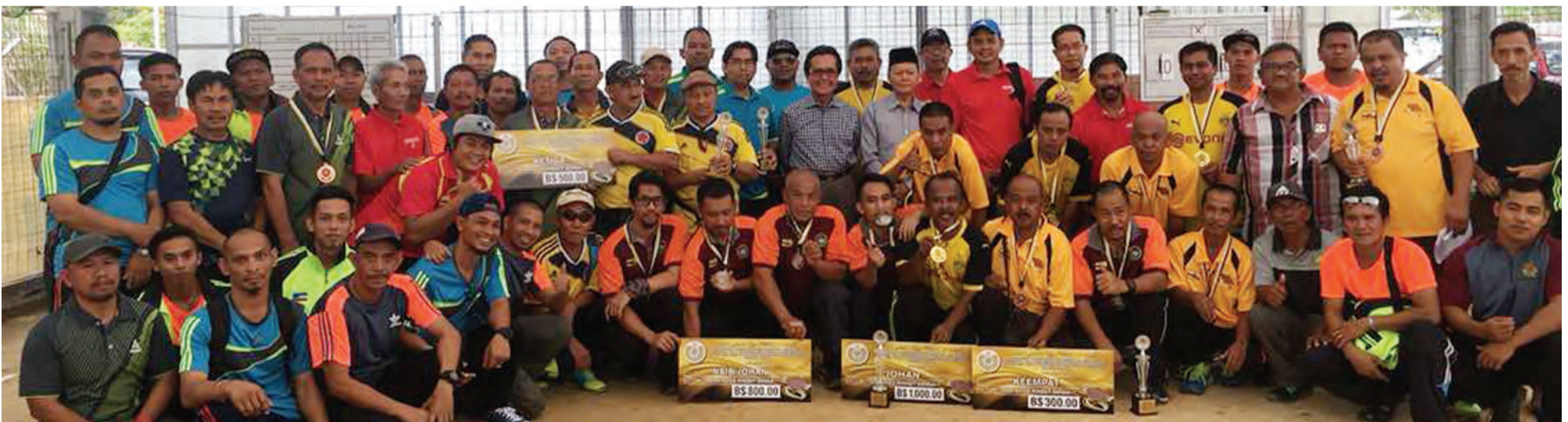
YANG Berhormat Menteri Hal Ehwal Dalam Negeri bergambar ramai bersama peserta yang menyertai Kejohanan Gasing sempena Sambutan Jubli Emas Kebawah Duli Yang Maha Mulia Paduka Seri Baginda Sultan dan Yang Di-Pertuan Negara Brunei Darussalam Menaiki Takhta Tahun 2018.

"Semoga dengan adanya kejohanan ini akan menambah lagi kemeriahan sambutan Jubli Emas Kebawah Duli Yang Maha Mulia Paduka Seri Baginda Sultan dan Yang Di-Pertuan Negara Brunei Darussalam 50 Tahun Menaiki Takhta, di samping mengeratkan lagi tali silaturahim di kalangan peserta-peserta khususnya peserta daripada luar negara," ujarnya.