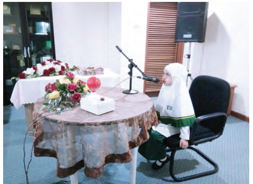
SEORANG peserta Musabaqah Menghafaz Al-Quran Berserta Pemahamannya Peringkat Saringan Kebangsaan Tahun 1439 Hijrah bagi Kategori 'A' ketika memperdengarkan hafazan Al-Quran dan Pemahamannya yang berlangsung di Bilik Mesyuarat Pusat Pengajian dan Penyebaran Al-Quran MABIMS Blok 2H Tingkat 8, Kondominium Ong Sum Ping.

Musabaqah Menghafaz Surah-Surah Pilihan dari Juz 30 iaitu Surah Al-Buruuj, Surah Ath-Thariq, Surah Al-A'laa, Surah Al-Ghasyiyah, Surah Al-Balad, Surah Asy-Syams, Surah Al-Lail, Kompilasi Surah-Surah Lazim bermula dari Surah Adh-Dhuha hingga Surah An-Naas berserta Pemahaman