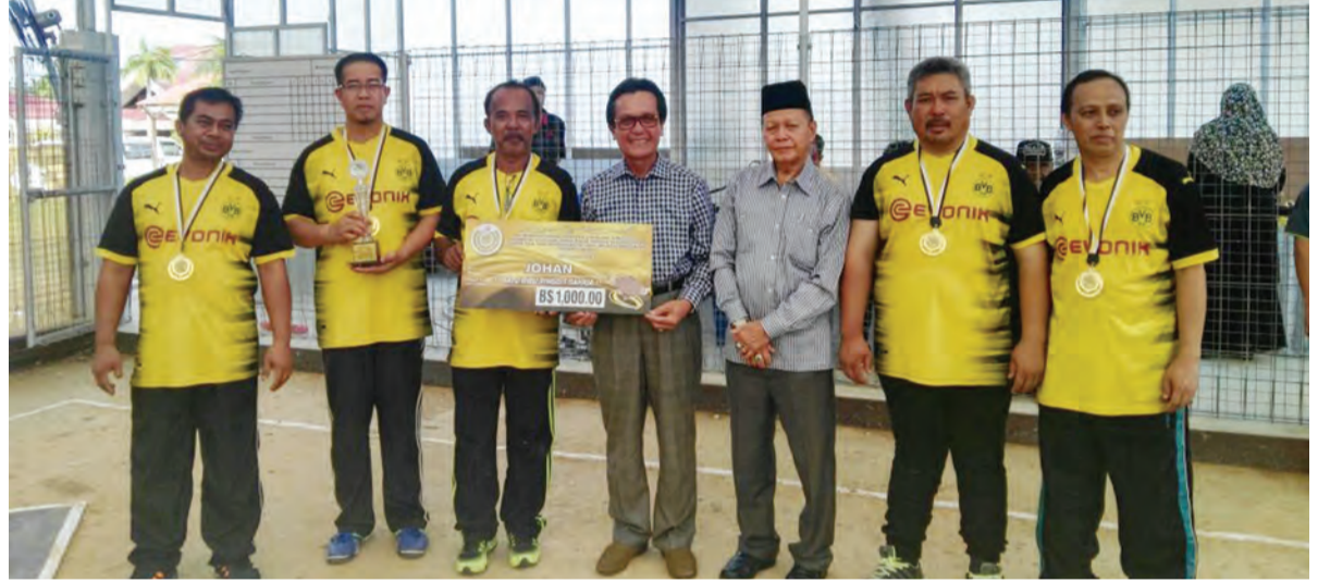
YANG Berhormat Menteri Hal Ehwal Dalam Negeri menyampaikan hadiah juara Perlawanan Peringkat Akhir Gasing Pangkah Regu kepada pasukan Brunei Darussalam 'B'.