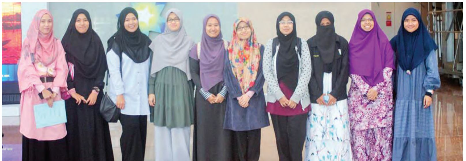
ANTARA pelajar dari Universiti Kebangsaan Malaysia (UKM) yang mengikuti program mobiliti pelajar dan program internship sesi pengajian 2017 / 2018 di UNISSA.

Sejak ditubuhkan pada tahun 2007, UNISSA tidak kendur-kendur berusaha untuk mencapai kecemerlangan dalam pembelajaran dan mendapat pengiktirafan peringkat nasional dan antarabangsa. Dengan adanya jalinan memorandum