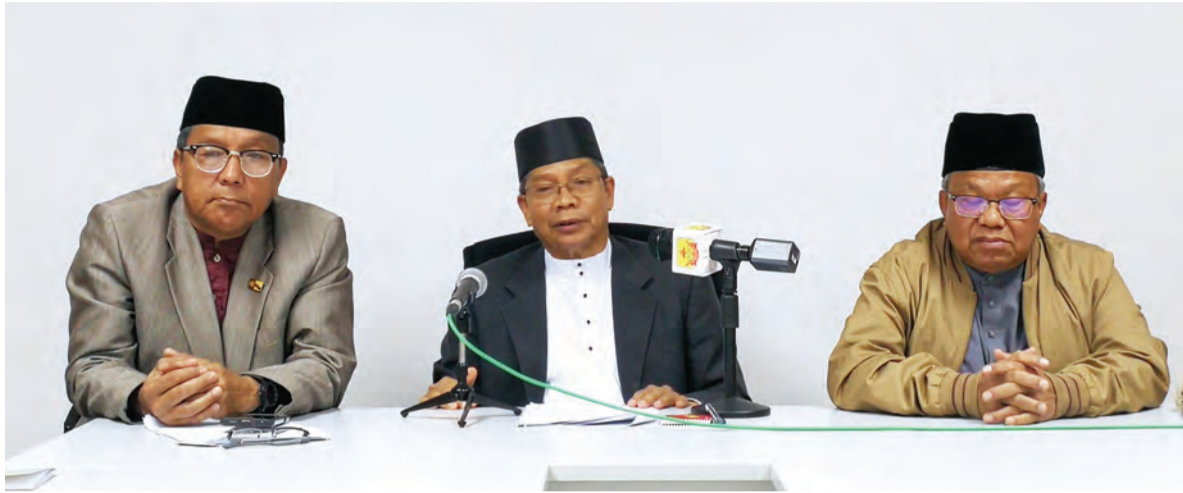
SIDANG media yang disampaikan oleh Ahli Jawatankuasa PESEBAR yang berlangsung di Akademi Pengajian Brunei, UBD.

Oleh : Marlinawaty Hussin