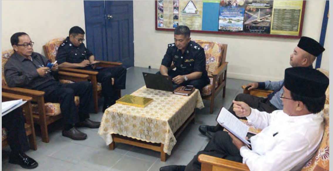
DAERAH Polis Tutong mengaktifkan kembali Pengawasan Kejiranan (PK) dengan membuat perjumpaan bersama Penghulu dan Ketua Kampung Mukim Ukong.

TUTONG, Isnin, 22 Januari. - Daerah Polis Tutong mengaktifkan kembali Pengawasan Kejiranan (PK) dengan membuat perjumpaan bersama penghulu dan ketua kampung Mukim Ukong.