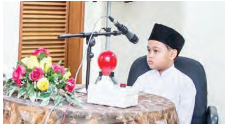
SEORANG peserta ketika memperdengarkan bacaannya pada Musabaqah Menghafaz Al-Quran Berserta Pemahamannya Peringkat Saringan Kebangsaan Tahun 1439 Hijrah.

Sementara Kategori 'D' terbuka kepada semua peringkat umur; dan tidak pernah menjadi johan dalam Kategori 'D' sebanyak dua kali berturut-turut; serta tidak pernah menerima Elaun Ujian Tasmie' Menghafaz Al-Quran Negara Brunei Darussalam dalam Kategori 30 Juz.